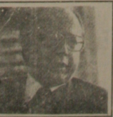
Marcílio Marques Moreira

As contas que serão apresentadas pelo Brasil acabaram de ser revistas pelo Ministério da Economia. O orçamento foi reestruturado em função da queda de receitas e do aumento de gastos da Previdência Social, provocado pelo plano de custeio e benefícios aprovado em junho pelo Congresso. No cálculo do déficit público são levados em conta não apenas os dados do Governo Federal mas também os números da Previdência e dos Estados e Municípios. Para que o resultado final não fuja ao controle, o Ministério da Economia deverá continuar trombandando com os interesses de prefeitos, governadores e aliados interessados em aumentar seus gastos neste resto de ano.