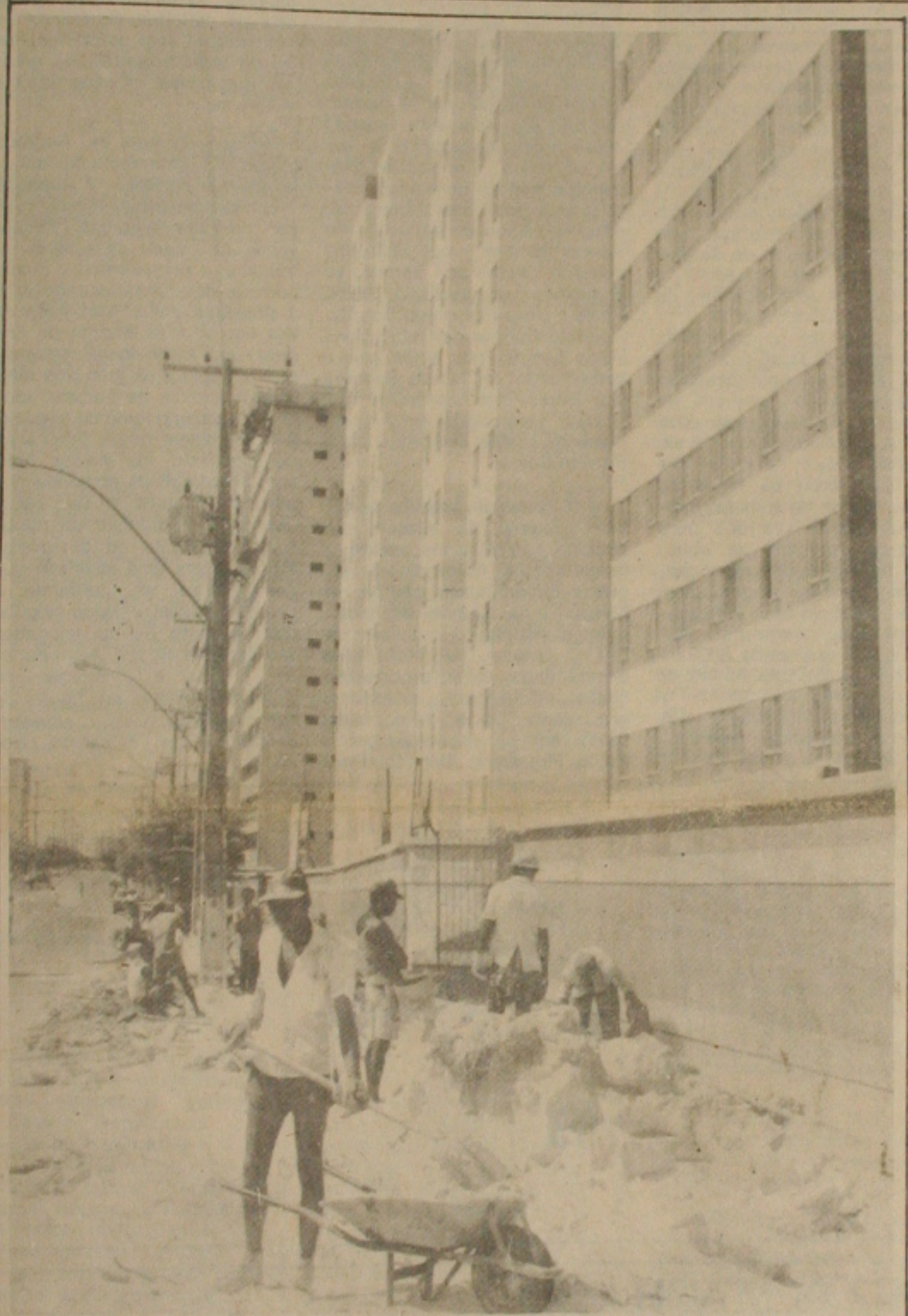
A falta de uso de equipamentos de segurança é a principal causa dos acidentes na construção civil.