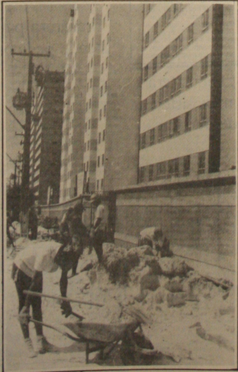
A construção civil é campeã em acidentes de trabalho em todo Estado