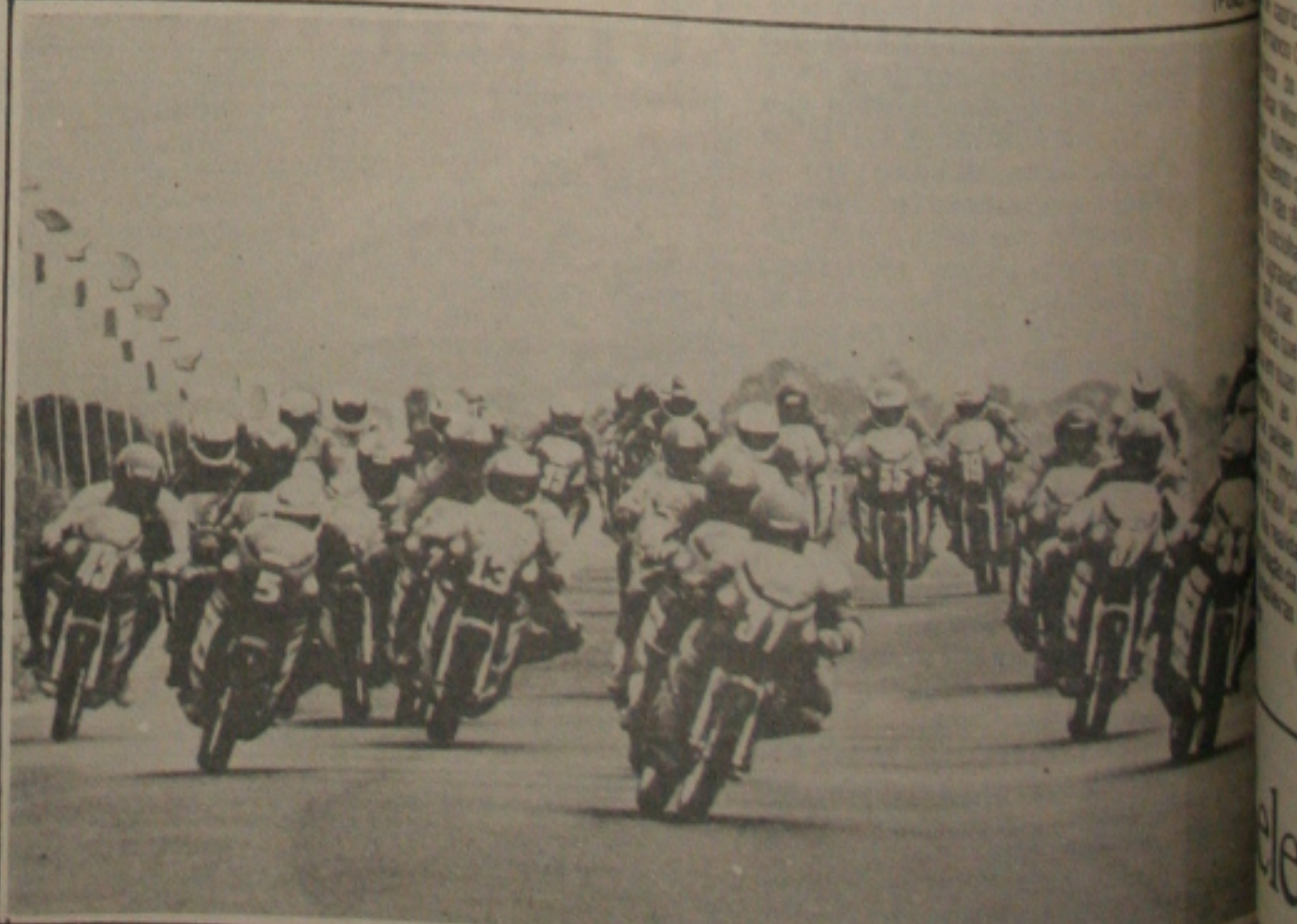
A Copa Yamaha de motociclismo garante fortes emoções da primeira à última volta