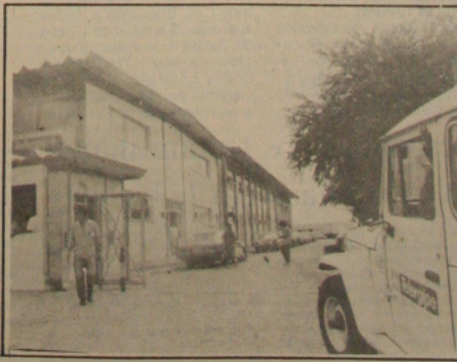
A Telergipe promete regularizar instalações de telefones em pouco tempo no Estado.