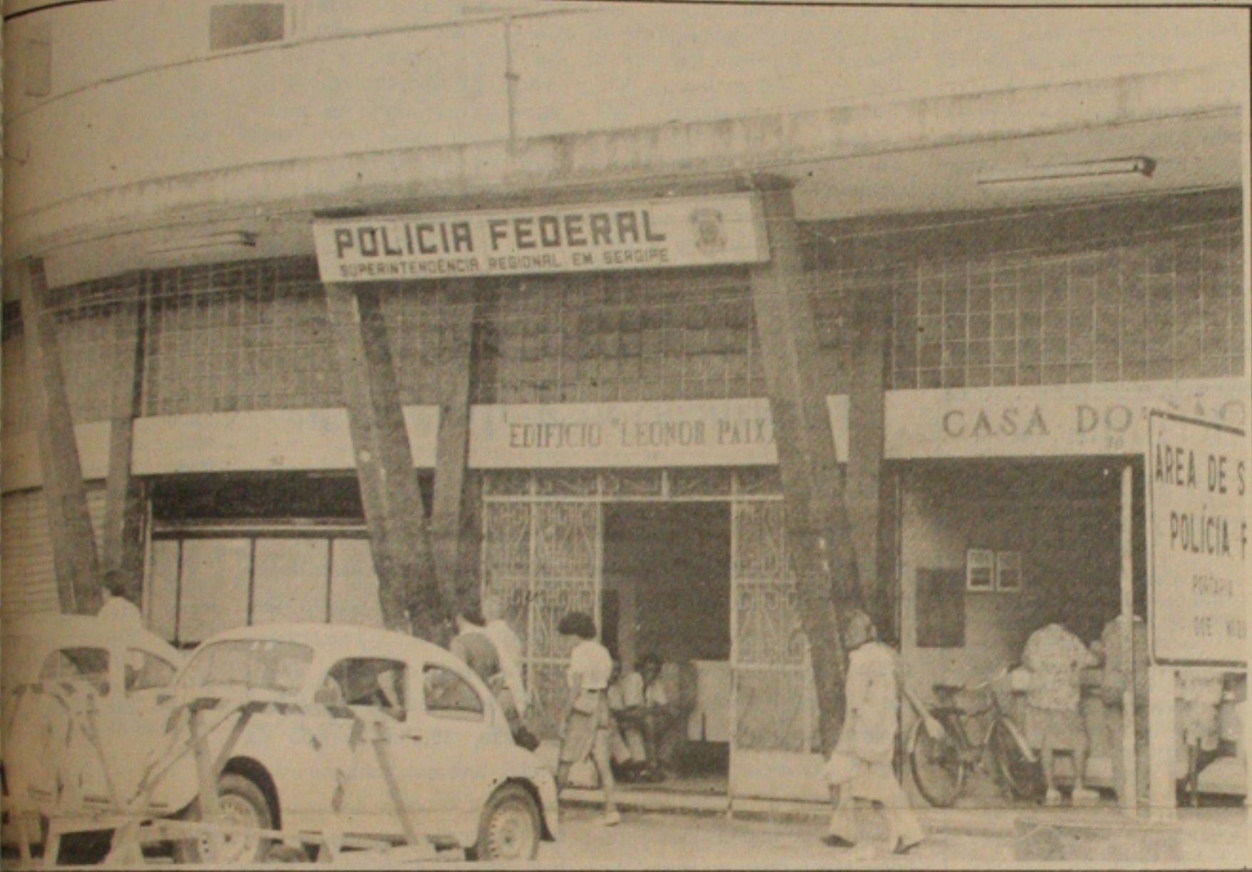
Polícia Federal em Sergipe investiga 280 denúncias de fraudes contra o Instituto Nacional do Seguro Social que deve ter rendidos aos ladrões mais de Cr$ 20 milhões

Já somam mais de 280 inquéritos em andamento e apurados pela Polícia Federal, nas investigações de fraudes da Previdência Social em Sergipe, conforme informação do chefe da Assessoria de Comunicação da PF, Edgar Braz. Acrescentou que em apenas 180 inquéritos policiais o volume de dinheiro já ultrapassa aos Cr$ 20 milhões e envolvem muitos funcionários do INSS, de bancos e beneficiários da previdência.