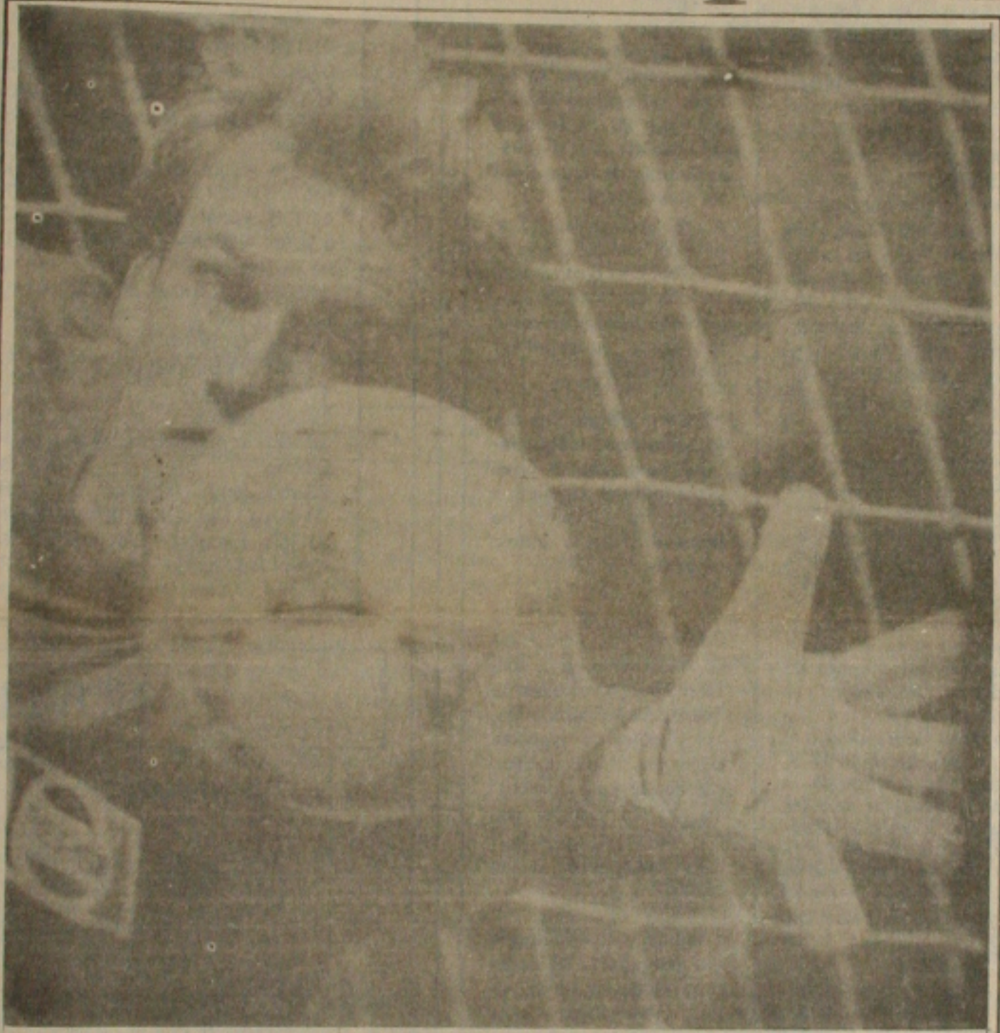
Taffarel foi seguro e reabilitou-se da partida contra a Argentina.