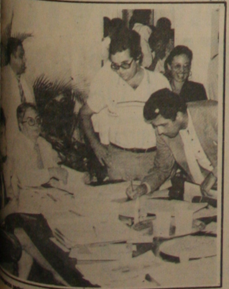
Participam em setembro de congresso sobre questões jurídicas