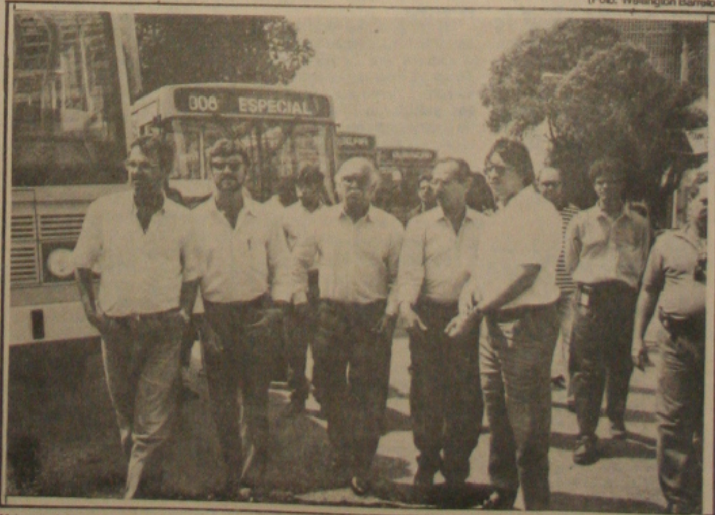
Mais onze ônibus são entregues a três empresas para servir ao aracajuano