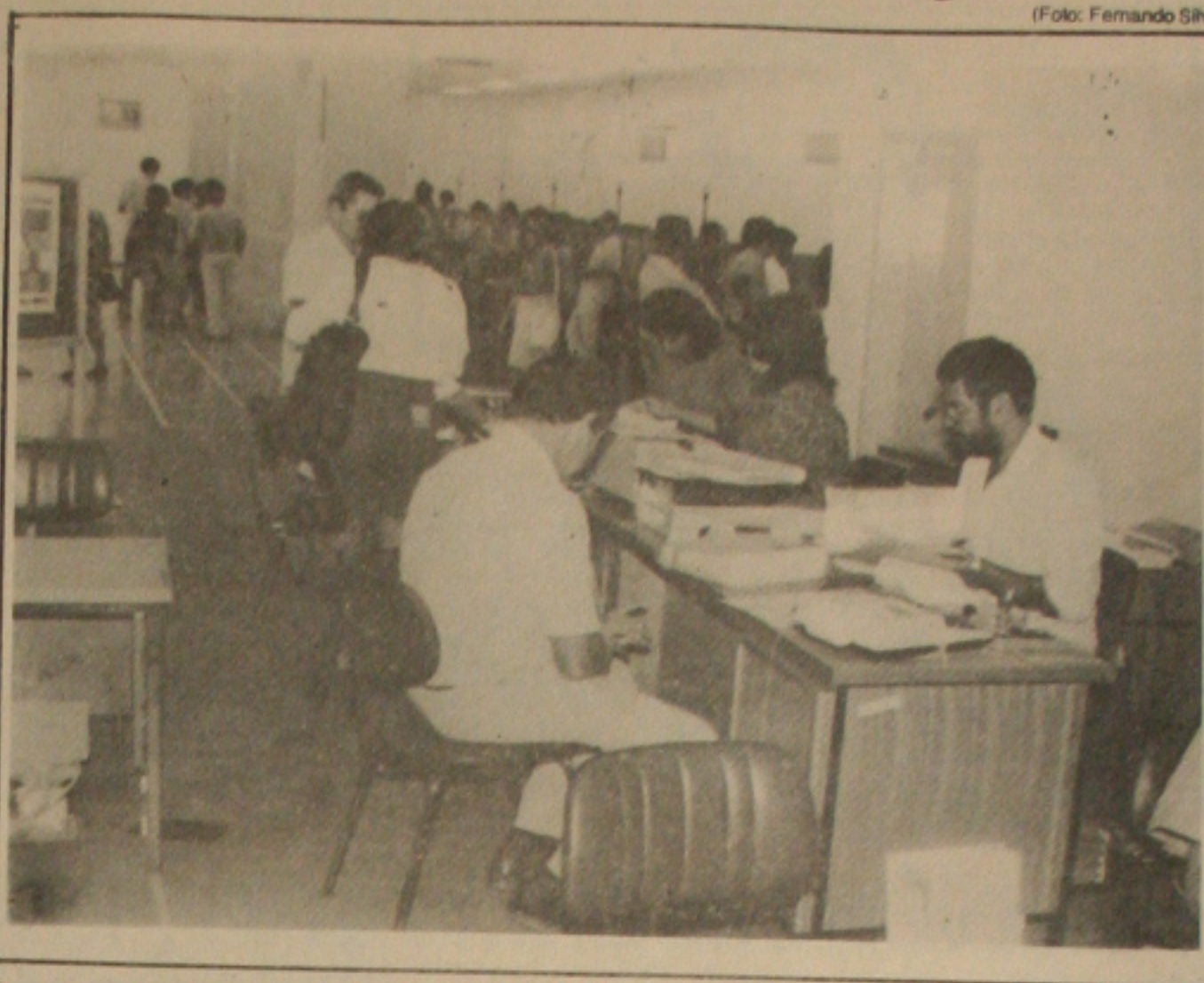
O movimento foi fraco ontem nos bancos para a declaração do Imposto de Renda, cujo prazo termina segunda-feira.

O prazo para a entrega da declaração do Imposto de Renda termina na segunda-feira. Para surpresa das pessoas encarregadas pelo setor de recepção do IR nas instituições financeiras foram poucos os contribuintes que compareceram ontem nas agências bancárias para apresentar o formulário do Leão.