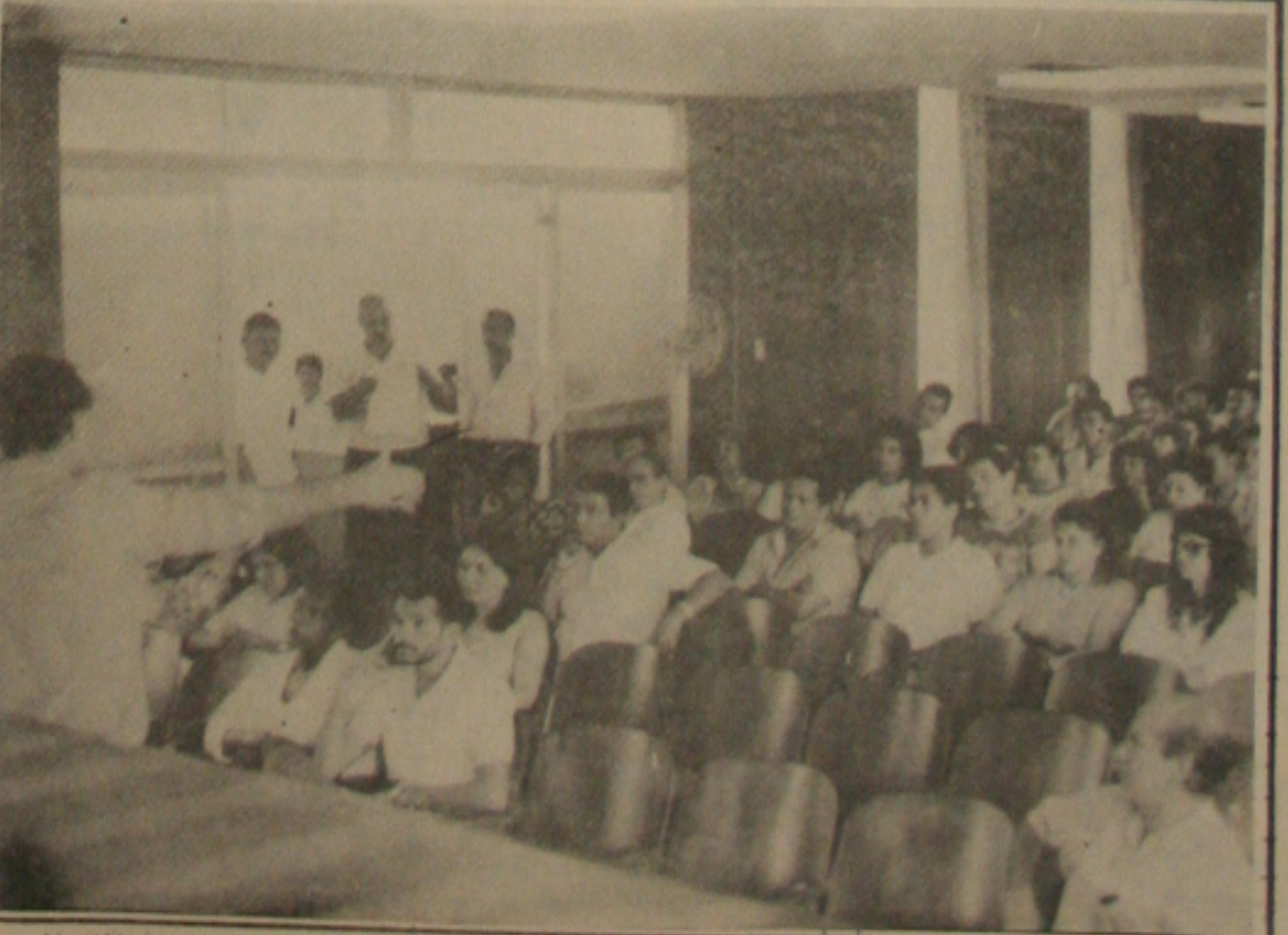
Os previdenciários sergipianos podem definir na próxima semana pelo retorno às atividades.