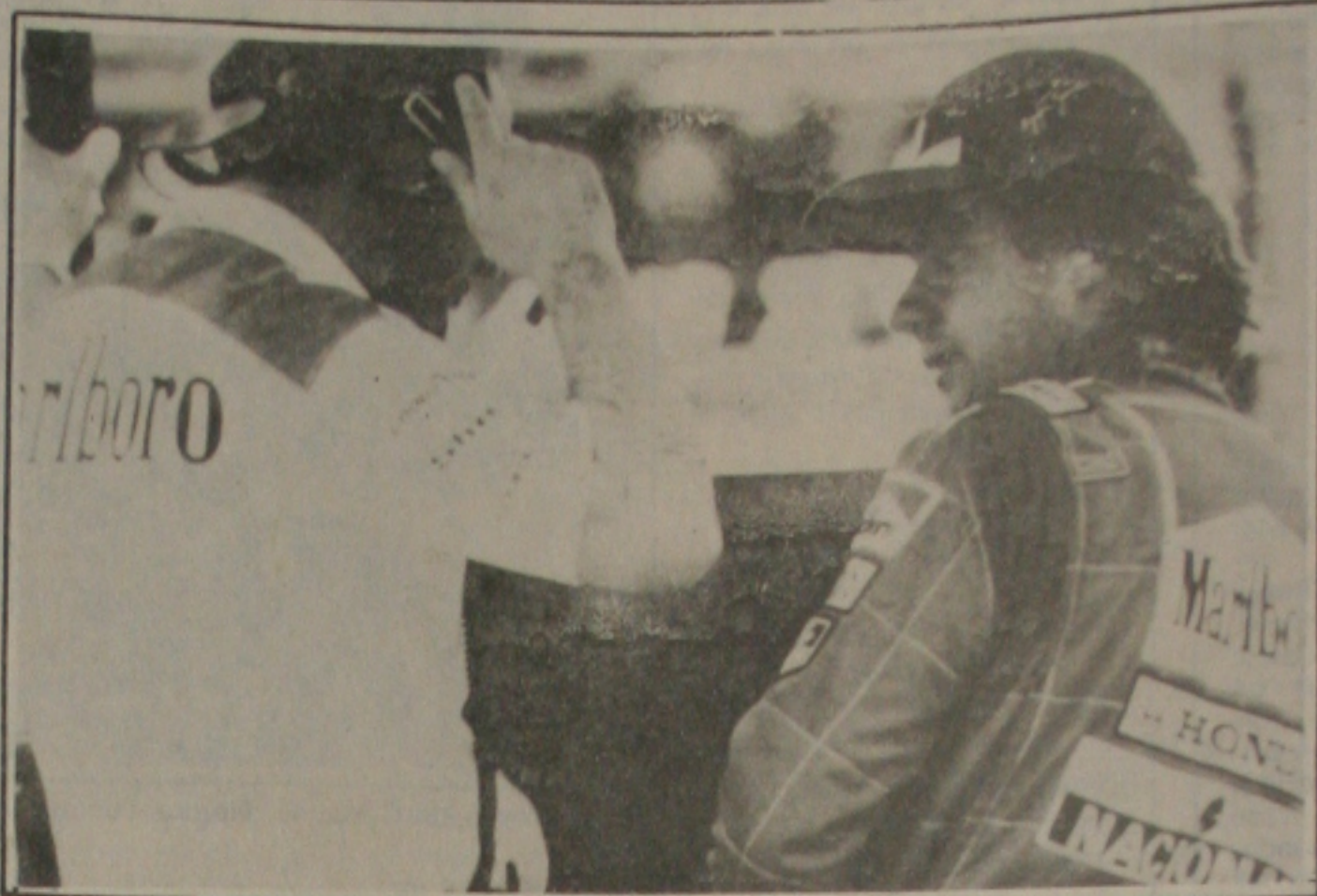
Senna comenta com o chefe da equipe como escapou do acidente em Hockenheim.

Notei alguns progressos no motor, mas ainda não somos rápidos o suficiente para ameaçar a Williams-Renault. Como o nosso programa aqui em Hockenheim foi um pouco curto demais, apenas na