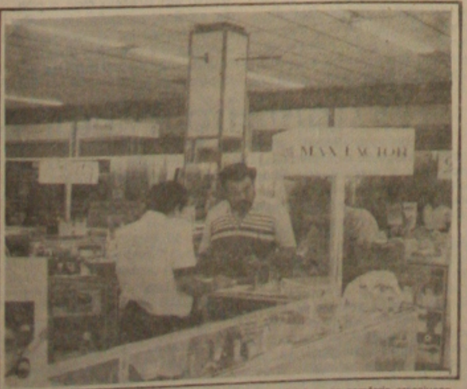
Aumenta 20 por cento a emissão de cheques sem fundos no comércio aracajuano