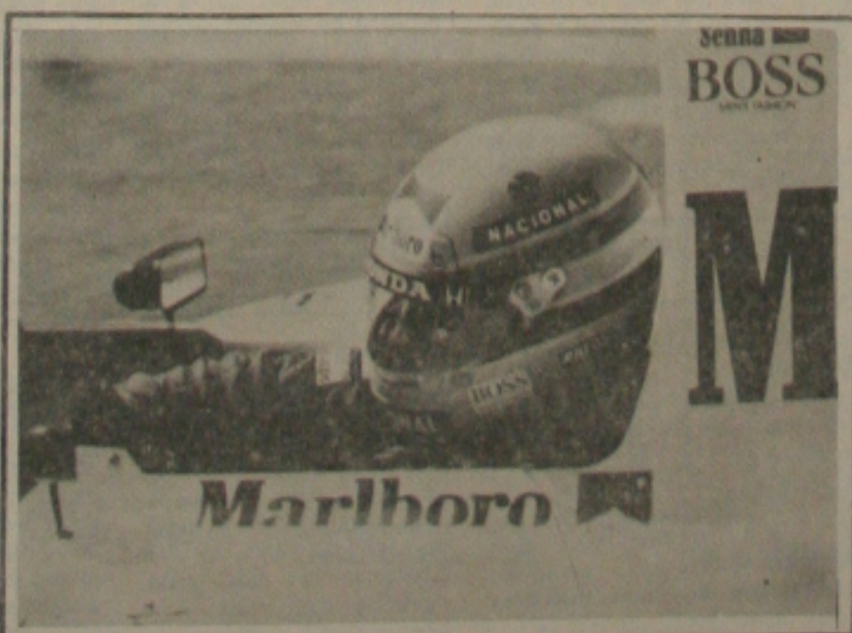
Senna reconhece maior potência das Williams.

1º) McLaren Honda, 67; 2º) Williams Renault, 55; 3º) Ferrari, 29; 4º) Benneton Ford, 23; 5º) Tyrrell Honda, 11; 6º) Jordan Ford, 10; 7º) Dallara Judd, 5; 8º) Minardi Ferrari e Lotus Judd, 3; 10º) Larousse Cosworth, 2 pontos.