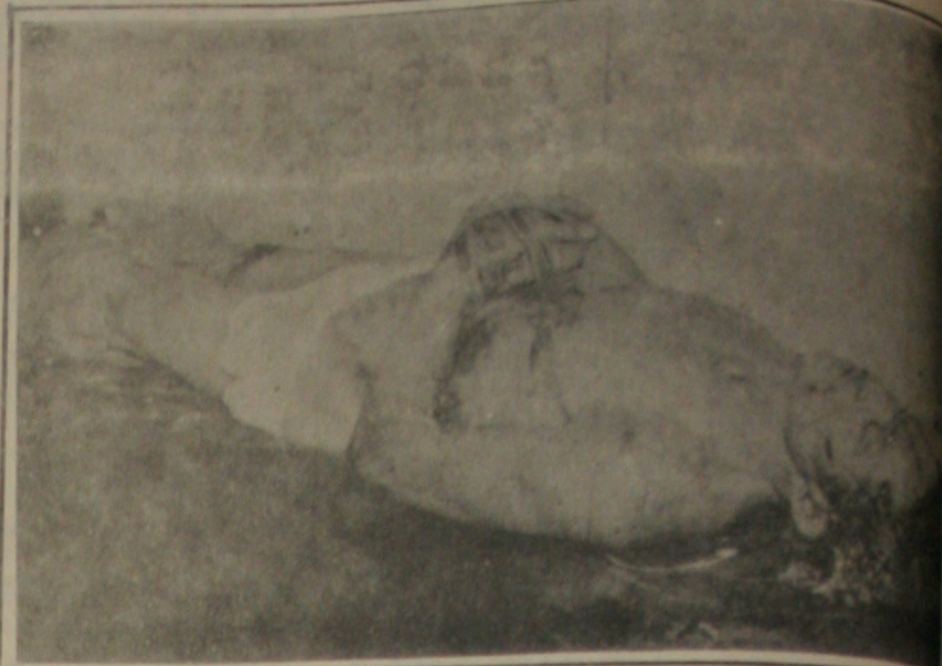
...e o resultado na morte de cinco bandidos, entre eles Antonio Aurelino Batista