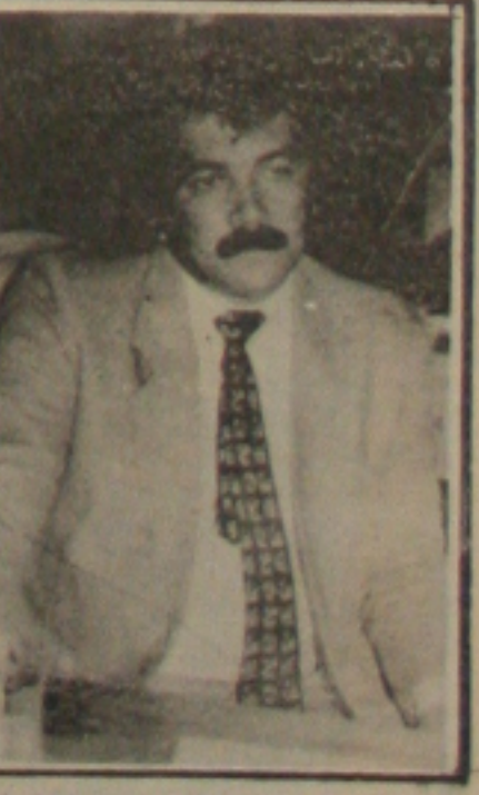
Almeida quer o Governo agindo dentro da lei

Os valores válidos até o dia 31 de setembro para efeito de atos de licitação estão fixados entre Cr$ 11 milhões a Cr$ 341 milhões para tomadas de preços e a partir de Cr$ 341 milhões pra concorrência pública.