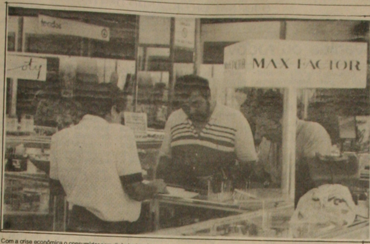
Com a crise econômica o consumidor sem dinheiro termina emitindo mais cheque sem fundo.