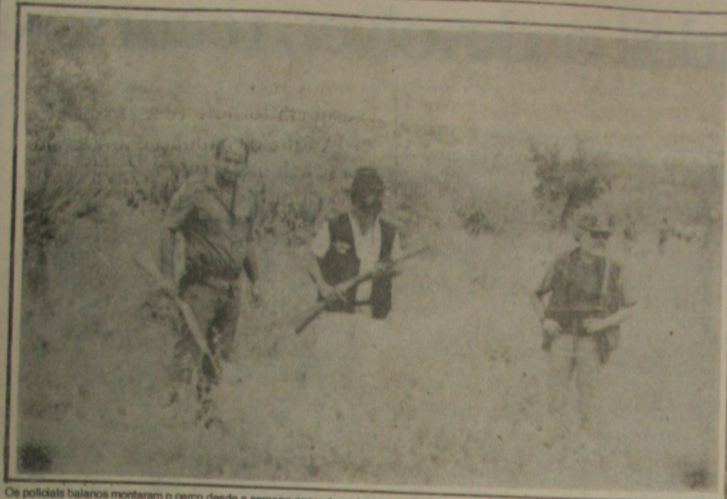
Os policiais baianos montaram o cerco desde a semana passada no interior do Estado...