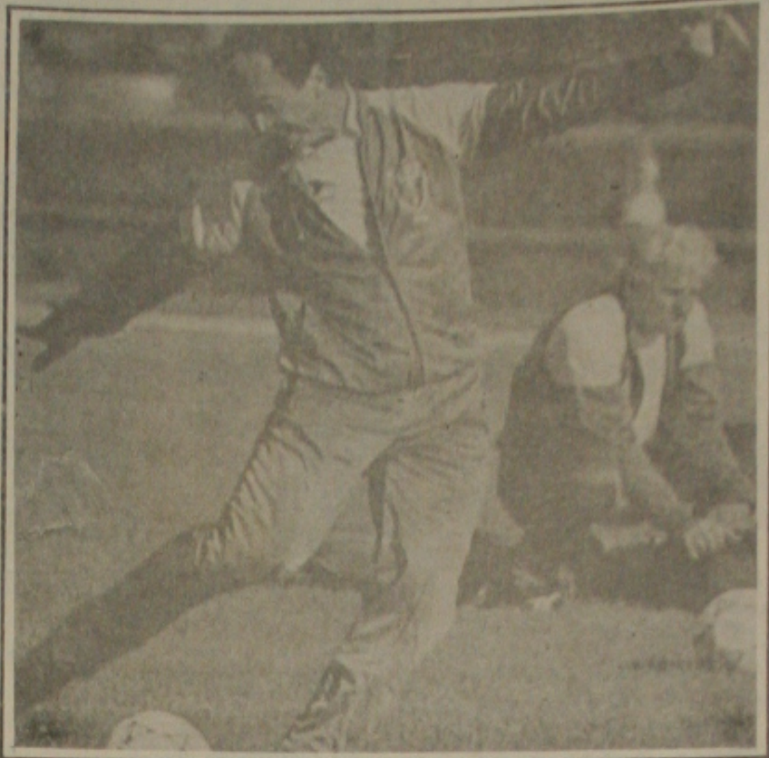
Falcão entra em retiro para fazer relatório sobre a Seleção Brasileira, na Copa América.