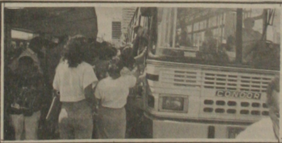
Os passageiros serão orientados pelos painéis nos pontos de ônibus