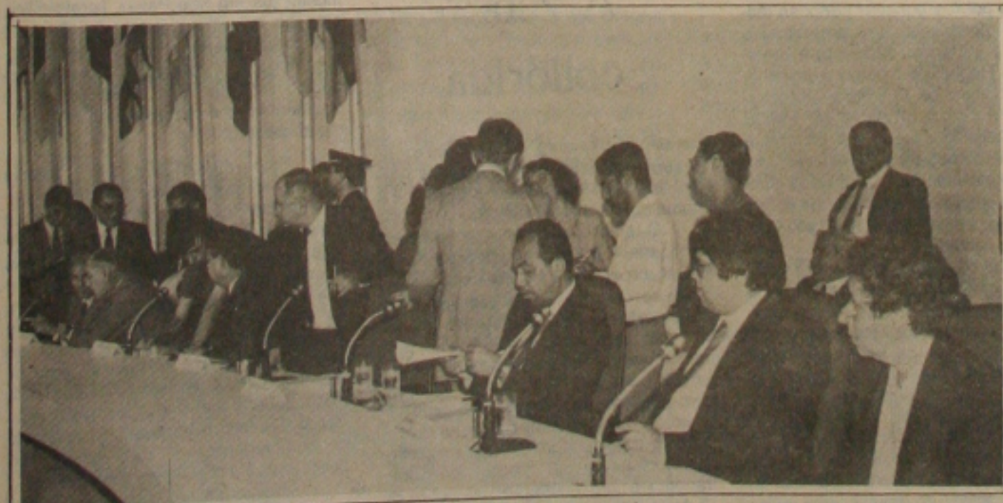
Para não fazer mais críticas ao governo os governadores nordestinos optaram pelo silêncio.

...divergências internas do ...começaram com o racha- ...do ano passado, tive- ...essa semana com ...de um documento in- ...Diretório Municipal, presi- ...nel Silva, encaminhado ao ...Regional. Ele comenta que ...o passado para a im- ...o objetivo de desgastá- ...nas vésperas da reali- ...popular, que aconte- ...à noite. (Página 3)