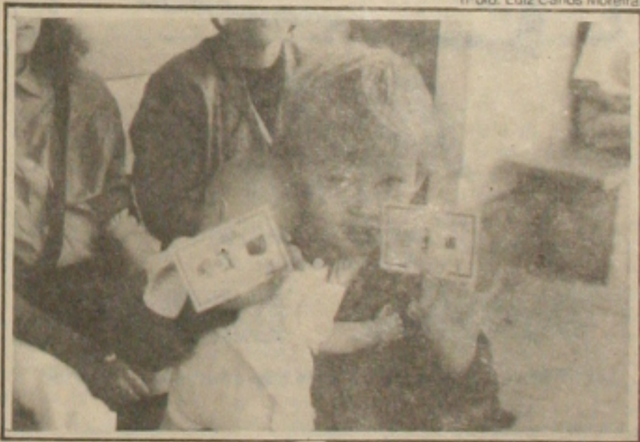
As crianças também tiram as cédulas de identidade