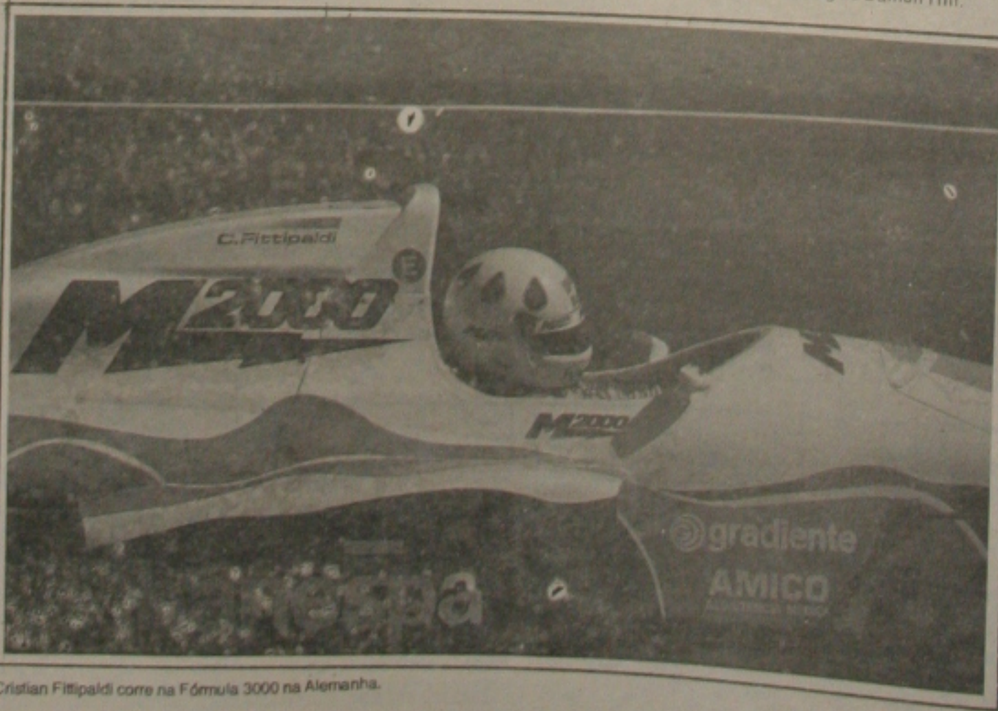
Cristian Fittipaldi corre na Fórmula 3000 na Alemanha.

Na temporada passada, o italiano Marco Apicella conquistou a pole position percorrendo os 6,81 km da pista em 1min56s262. Apicella também foi o autor da melhor volta, com 1min59s97. O vencedor da corrida, no entanto, foi o inglês Eddie Irvine, seguido pelo italiano. O recorde do circuito é 1min56s146 e pertence ao inglês Damon Hill.