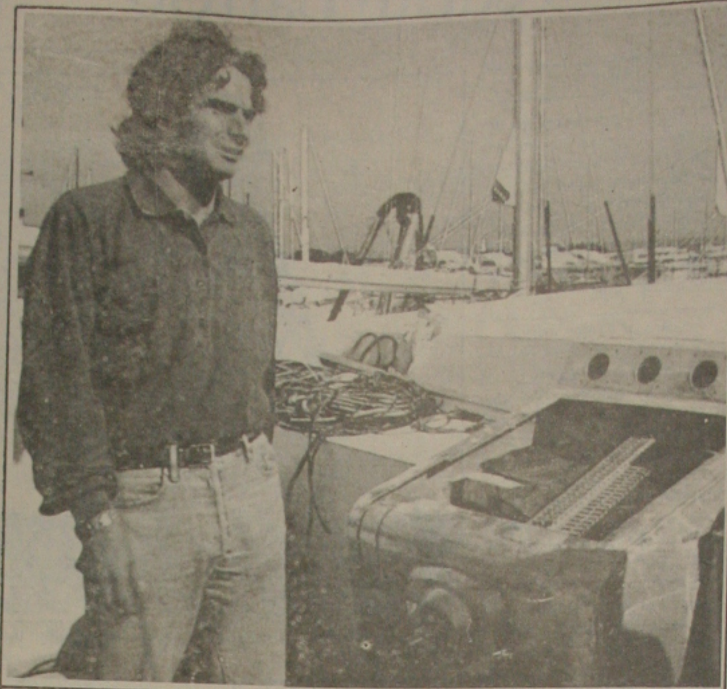
Piquet com oitavo lugar acredita numa boa corrida.