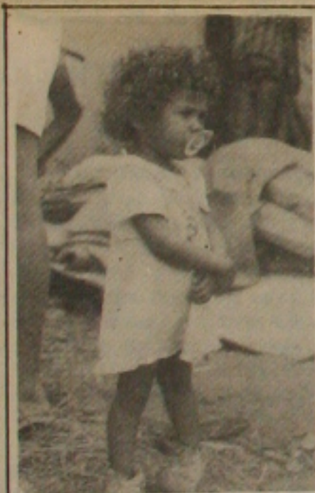
Ausência de esperança.