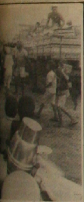
Em suas caminhões.

Logo que se instalaram no Conjunto Siri, aproveitando as casas abandonadas e fechadas, os invasores tentaram com interferência de políticos sensibilizar o Governo do Estado para que liberasse as casas. Sem sucesso, eles ainda procuraram a primeira dama do Estado, D. Maria do Carmo do Nascimento Alves. Mas enquanto eles se mobilizavam para permanecer nas casas, a Companhia de Habitação Popular entrava com ação de reintegração de posse na Comarca de Laranjeiras, e ontem um oficial de Justiça, acompanhado de dois representantes da Companhia e de quinze soldados da Polícia Militar, cumpriram a decisão judicial com a desocupação das casas. Não houve violência física, mas destruição de muitos objetos e a desocupação terminou dramática para as pessoas que ficaram no meio da rua. (Página 1B)