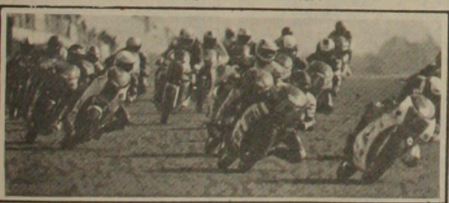
Amanhã em Cascavel segunda etapa do Brasileiro da Copa Yamaha.