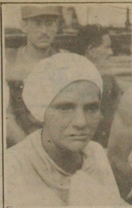
Expressão de sofrimento.