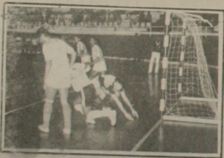
Federação de Futebol de Salão vai promover quadrangular.