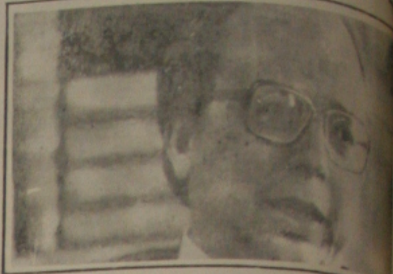
Marcílio Marques Moreira

Está acertado que o limite dos saldos a serem liberados integralmente é de NCz$ 200 mil. Mais da metade das contas em Cruzados Novos serão desbloqueadas de uma só vez com o limite de NCz$ 200 mil para a liberação do dinheiro retido a partir de 2 de setembro. De acordo com dados da Federação Brasileira dos Bancos (FEBRA-