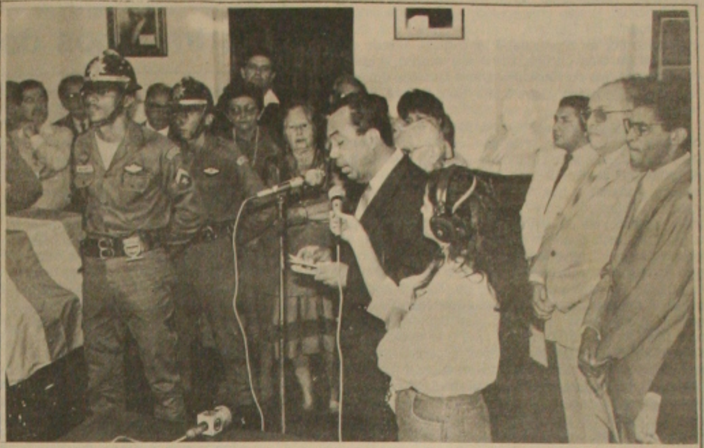
O governador João Alves discursando na entrega dos restos mortais de Horácio Hora

estava enterrado na cidade de Paris, onde morreu no dia 1º de março de 1890. No ano passado, dentro da programação comemorativa do IV Centenário da Conquista de Sergipe, o Governo do Estado promoveu a remoção dos restos mortais e para isso contou com a interferência da Embaixada do Brasil na França que manteve os entendimentos com a Prefeitura de Paris. Ontem ao fazer a entrega solene da urna funerária, o governador João Alves Filho destacou que com o ato o Governo de Sergipe "resgata dívida para com Horácio Hora, trazendo-o de volta para sua querida Laranjeiras, onde desabrochou para a vida e ensaiou seus primeiros e tímidos traços". (Página 3B)