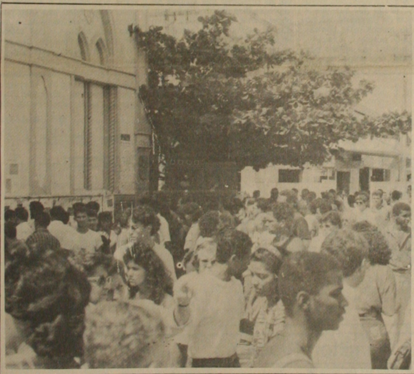
Os professores da UFS ocuparam as calçadas do centro comercial

As escolas públicas da rede estadual de ensino poderão permanecer sem aulas, mesmo com o início do ano letivo marcado para a quinta-feira, se o governador João Alves Filho não responder positivamente as reivindicações dos professores, que esperam ter as posturas ainda hoje, na audiência tentará manter com o governador do Estado. A decisão pela greve dos professores foi tomada em reunião realizada na semana passada por os dirigentes das entidades que representam os professores da rede estadual. Eles reivindicam além outros itens, a definição do Estado do Magistério Público Estadual, dessa não cumprida pela administração anterior e que foi renovada a atual. Se o Governo não oferecer respostas, já nesta quinta-feira os professores realizam assembleia geral para decidir pela paralisação. Ontem os professores da Universidade Federal de Sergipe, em greve desde o início do mês passado, realizaram manifestações no centro comercial. Eles ocuparam a calçada da Rua da Pessoa com Laranjeiras e miraram aulas, expondo os projetos e pesquisas desenvolvidas na Universidade. (Página 1B)