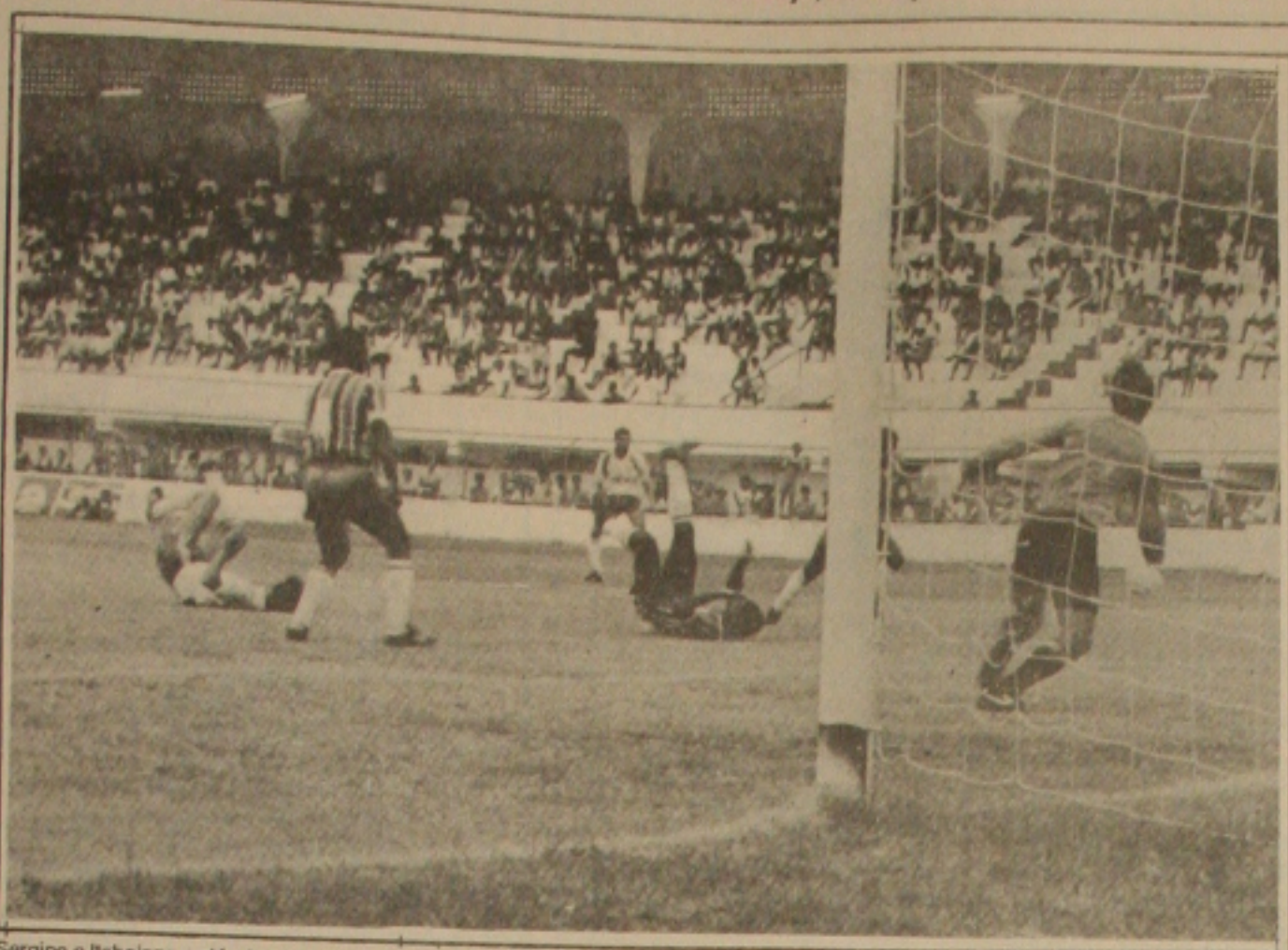
Sergipe e Itabaiana no clássico de domingo

O Campeonato Adulto Masculino Aberto, poderá este ano contar com a participação de mais de 10 equipes. Na reunião desta noite, os dirigentes da mentora da bola ao branco Sergipe, decidirão, a data de realização das inscrições para o campeonato adulto Aberto Masculino.