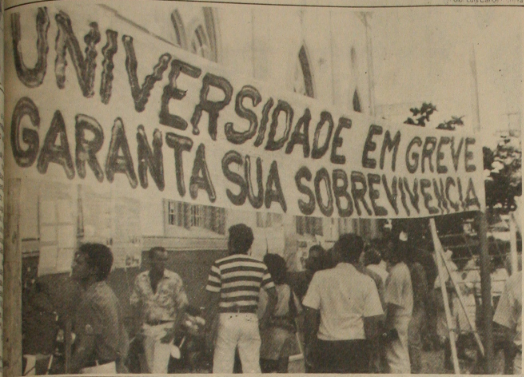
Professores da Universidade Federal de Sergipe realizaram, ontem, no centro da cidade manifestação com aula pública para denunciar o caos da UFS.