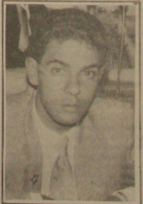
Brandão: rurais abandonados

Os pequenos produtores rurais do município de Canindé do São Francisco, especialmente os que desenvolvem suas atividades no Projeto Califórnia, estão sendo discriminados pelo Governo do Estado, enquanto que os médios produtores estão recebendo tratores, caminhões e outros equipamentos agrícolas. A denúncia foi feita ontem pelo deputado Renato Brandão, líder do Partido dos Trabalhadores na Assembleia Legislativa. Ele disse estranhar o comportamento do Governo através da Secretaria da Agricultura, que tem deliberadamente deixado sem assistência os pequenos produtores, justamente quando o Governo do Estado tem anunciado que a agricultura é uma de suas prioridades. (Página 3)