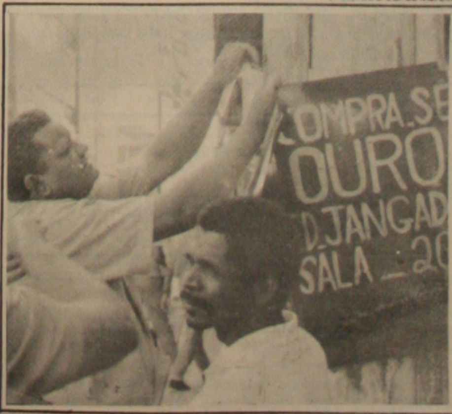
O comércio de ouro desperta ação de quadrilhas especializadas