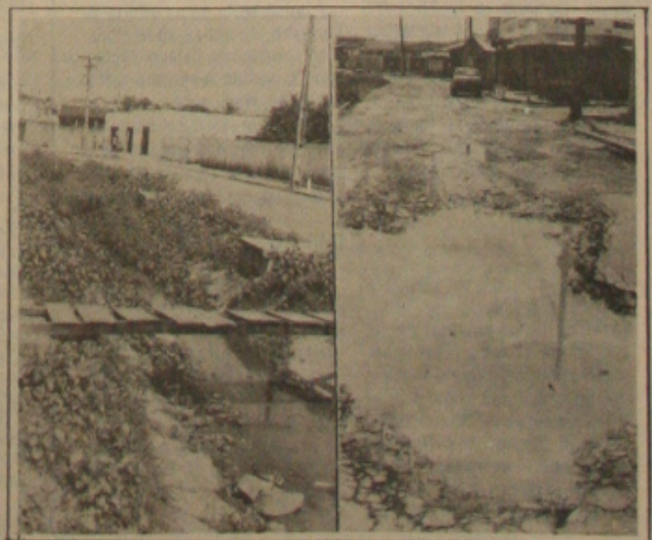
Os uracões nas ruas e os canais ostruídos são mostras do abandono do Estímulo Gomes.

antes de praticarem o assalto, cortaram todos os fios telefônicos do supermercado, a fim de impedir qualquer ligação ou recepção de telefonemas.