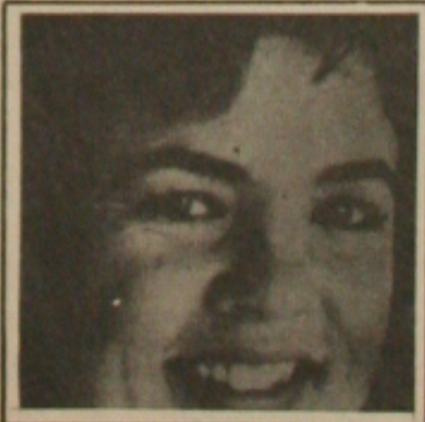
Stockard Channing e uma cientista em As Incríveis Peripécias do Ônibus Atômico — comédia em Domingo no Cinema.

CANAL 13 — 17:30H AS INCRÍVEIS PERIPÉCIAS DO ÔNIBUS ATÔMICO Título Original: The Big Bus Nacionalidade: Americana Ano de Produção: 1976 Direção: James Frawley Elenco: Joseph Bologna, Stockard Channing, Lynn Redgrave, José Ferrer, Ruth Gordon e Sally Kellerman Gozação na linha de "Apertem os Cintos o Piloto Sumiu", só que com um ônibus gigante e sem metade da graça. Ele é o melhor e o mais possante ônibus do mundo, movido a energia nuclear e sai em sua viagem inaugural com uma cara famosa em cada assento e igual número de placas, umas engraçadas, outras nem tanto. Tudo bem pesado, dá para divertir, sem maiores compromissos. Cor.