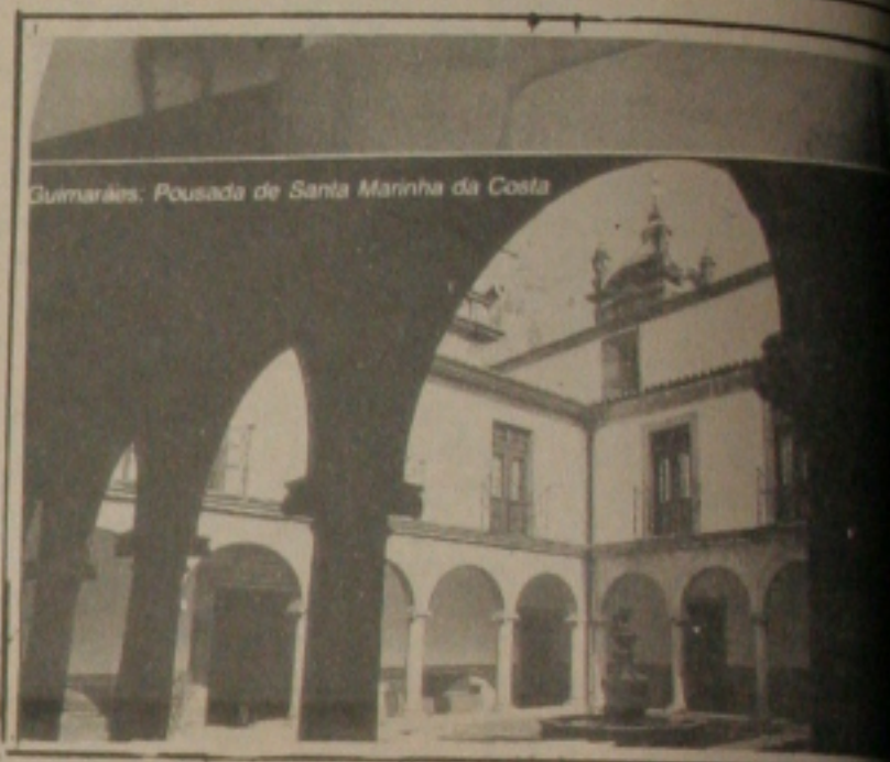
Guimarães. Pousada de Santa Marinha da Costa

A agência PROPAGTUR inova o mercado de viagens internacionais em Sergipe colocando para seus clientes a Carteira de Viagem Programada, com a finalidade de facilitar a aquisição de passagem aérea, hospedagem e passeios pelo exterior.