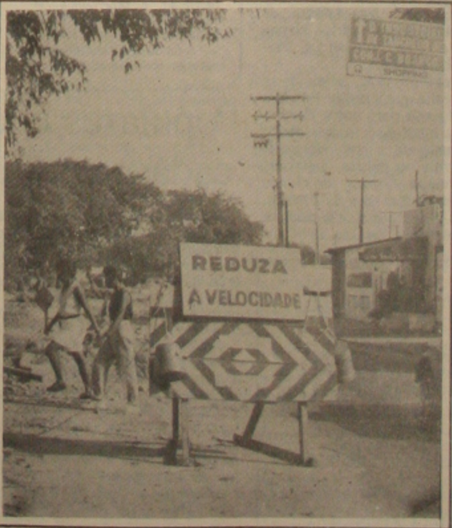
As obras prejudicam trânsito em Aracaju