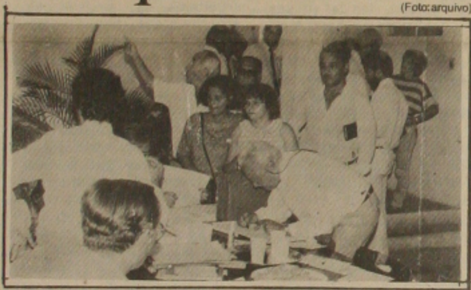
Os advogados prontos para participar do congresso