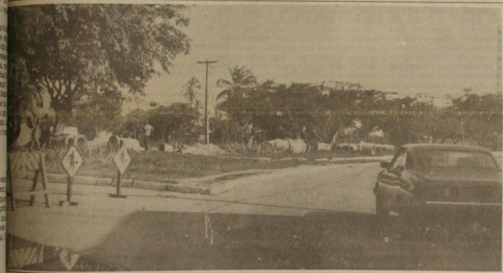
Camelôs terminam causando transtornos e irritam a população.

Argumentando que tinham recebido autorização do presidente da Emsurb, Bosco Mendonça, os camelôs fecharam o trânsito na manhã de ontem, no trecho compreendido entre Av. Ceolho e Campos e rua Florentino Menezes, gerando mais uma confusão no centro da cidade, dificultando o trânsito de veículos e pedestres, com prejuízos para os taxistas, que deixaram de faturar com os passageiros que faziam feira.