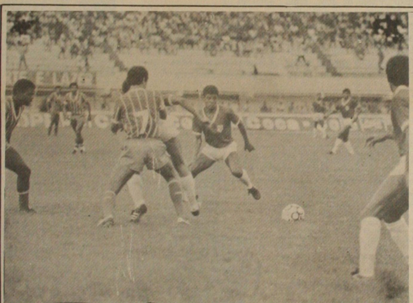
Sergipe e Itabaiana, o clássico do Batistão pode levar um bom público ao estádio.