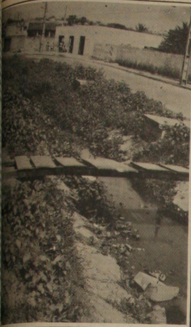
...enquanto em outro trecho a rua está praticamente interditada pelos buracos...