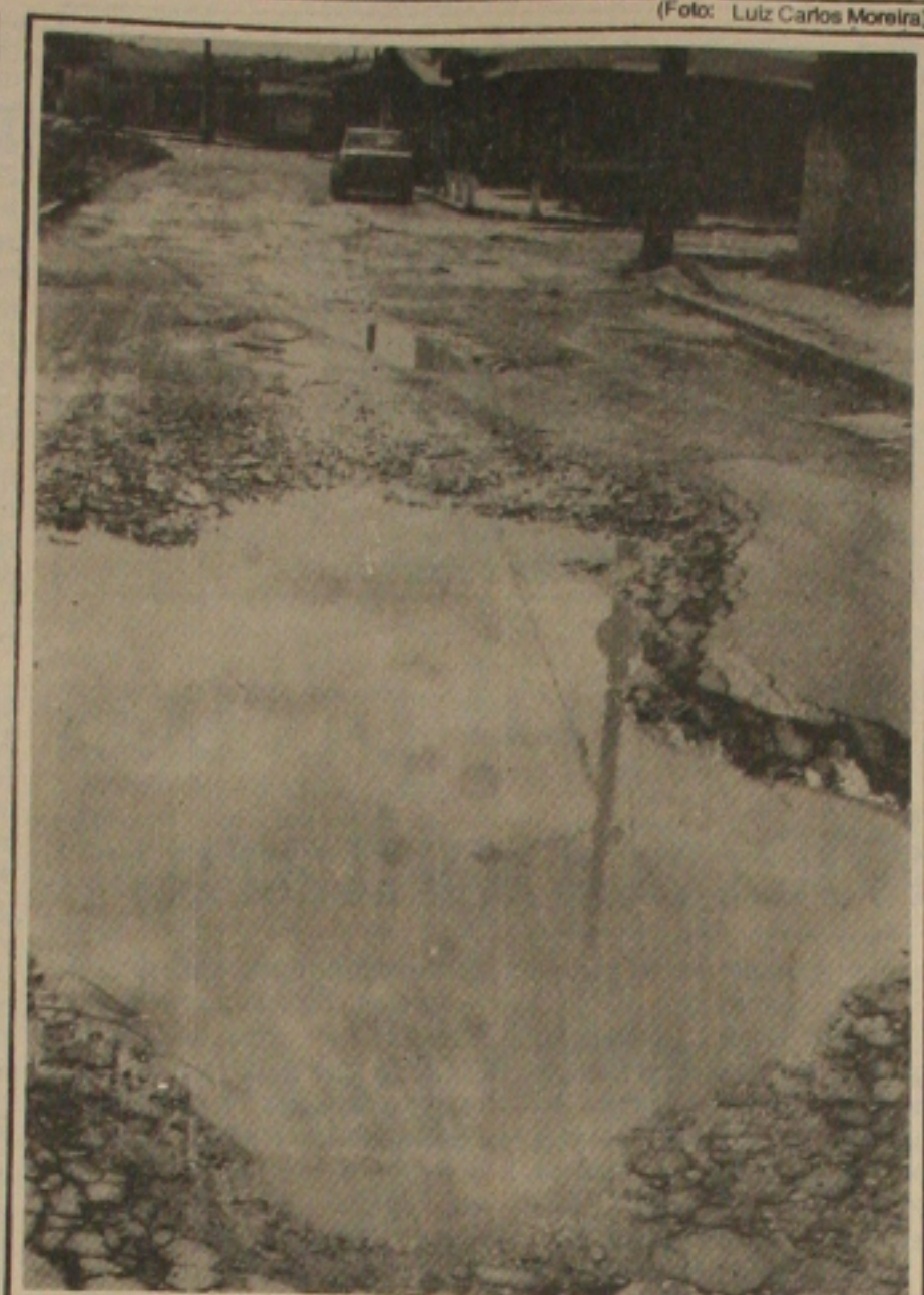
...enquanto em outro trecho a rua está praticamente interditada pelos buracos

Apenas neste início de ano, em Aracaju, já foram registrados 16 assassinatos de menores envolvidos no consumo de drogas. A informação foi prestada pelo Juiz da Infância e da Juventude, José Rivaldo dos Santos, acrescentando que dos menores assassinados, 13 foram adolescentes: 3 meninas.