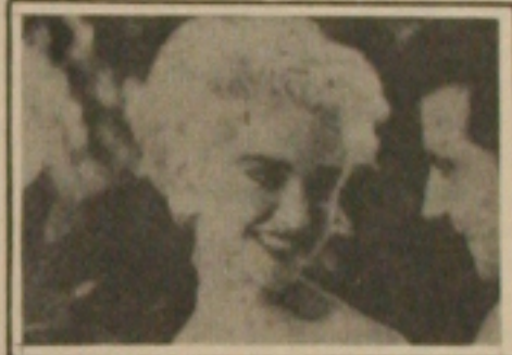
Madonna (E): ex-presidiária

CANAL 4 — 13:45H QUEM É ESTA GAROTA? Título Original: Who's That Girl? Nacionalidade: Americana Ano de Produção: 1967 Direção: James Foley Elenco: Madonna, Griffin Dunne, Haviland Morris, John McMartin, John Mills, Bibi Besch, Robert Swan, Drew Pillsbury, Coati Mundi, Dennis Burkley, Cecile Callan, Jim Dietz, Karen Baldwin, Kimberlin Brown. O advogado yuppie Loudon Trott (Dunne) está prestes a se casar com a bela e fútil Wendy (Morris), filha de seu patrão, o milionário Simon Worthington (Mc Martin). Um dia antes da cerimônia, Loudon recebe do futuro sogro a estranha incumbência de pegar uma jovem, Nikki Finn (Madonna), na saída da penitenciária onde ela ficou por quatro anos e colocá-la num ônibus para a Filadélfia. Afirmando que não cometeu nenhum crime, Nikki recusa-se a entrar no ônibus, até que possa colocar as mãos sobre o verdadeiro criminoso. Para isso, Nikki arrasta o pacote Loudon por Nova York. Cor. peripécias por Nova York. Cor.