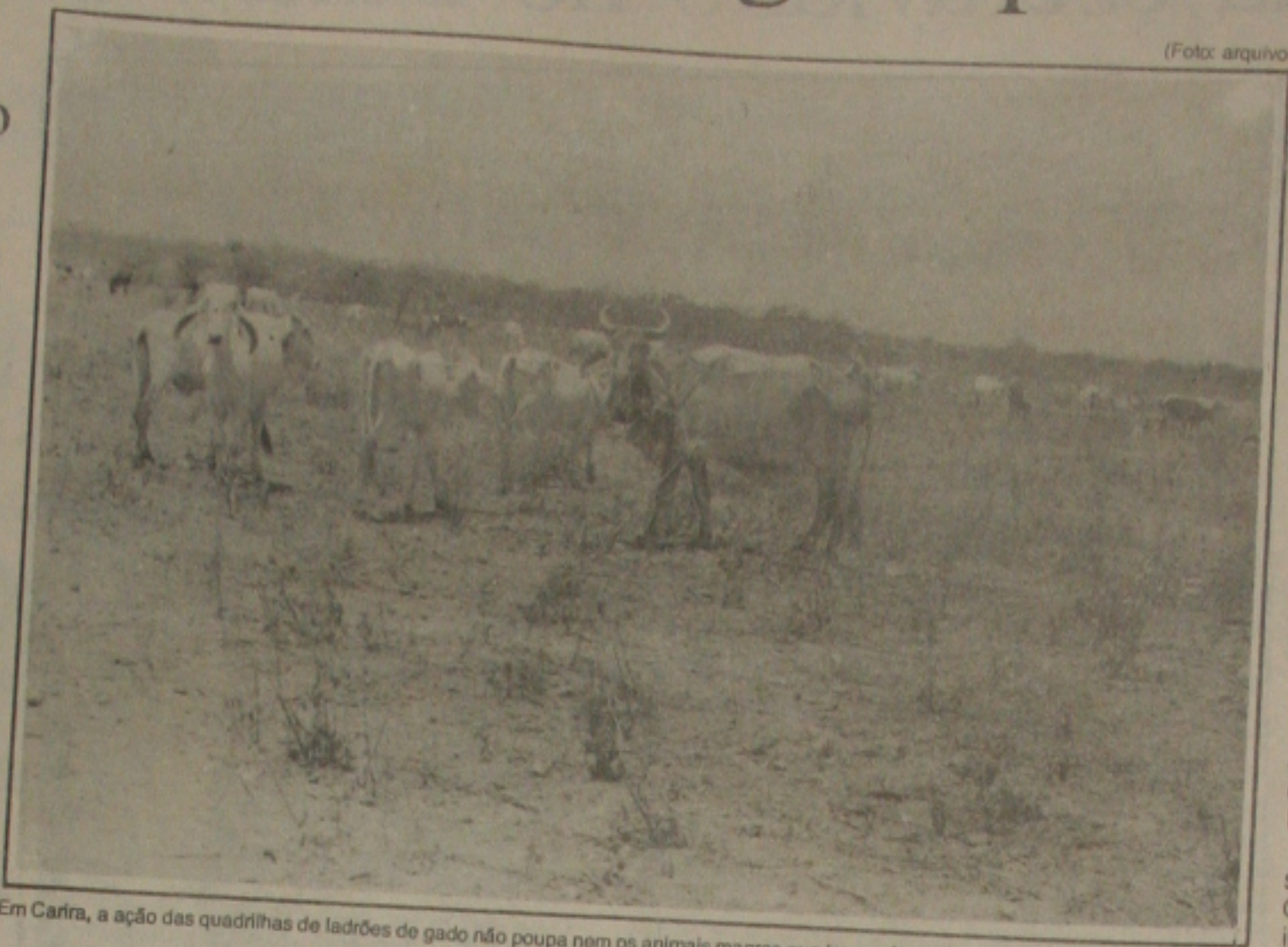
Em Carira, a ação das quadrilhas de ladrões de gado não poupa nem os animais magros que foram vítimas da seca.