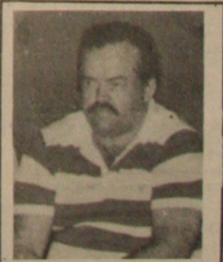
Diretor de esportes promove corrida de ano.