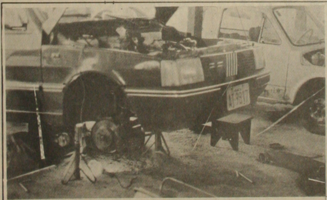
As oficinas superlotam com carros quebrados devido os buracos