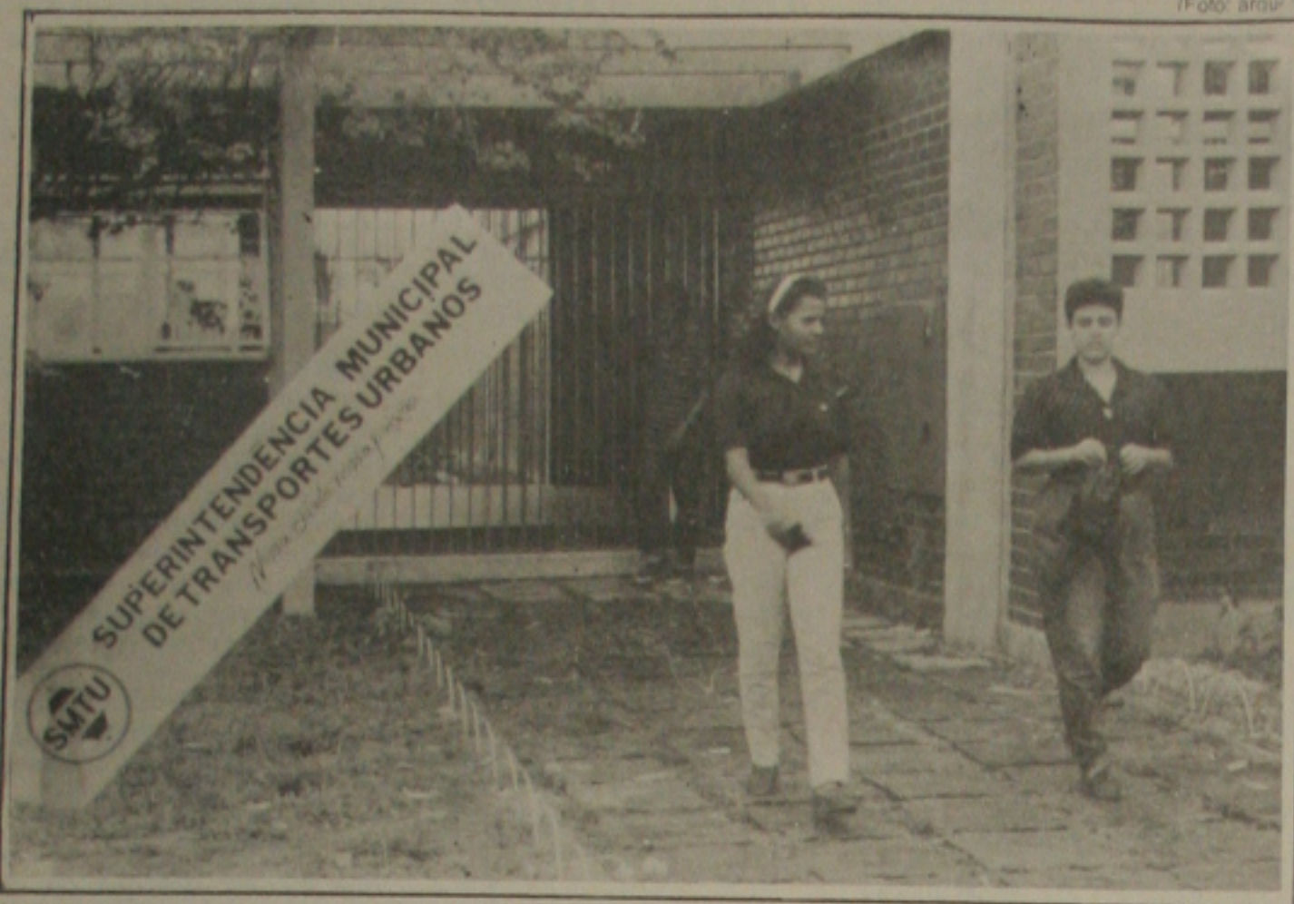
Na Seturb instalou-se uma quadrilha especializada na falsificação de transferência de ponto de táxi