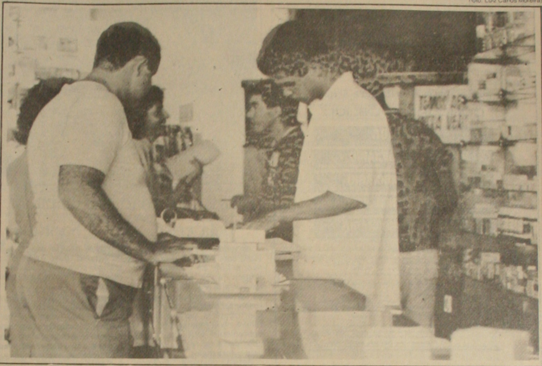
Apesar do alerta do Ministério da Saúde para a suspensão da venda do medicamento Teldane e Plasil, as farmácias continuam a vendê-los normalmente

Mesmo assim em outros Estados os dois medicamentos permanecem com suas vendas suspensas por determinação do Ministério da Saúde. Na Bahia e no Rio de Janeiro, por exemplo, a Secretaria de Estado da Saúde não permite a comercialização até que haja nova determinação do Ministério da Saúde. A Secretaria de Estado da Saúde em São Paulo está apurando as causas determinantes da troca das embalagens. A sede do laboratório responsável pela fabricação de ambos os medicamentos; o Merrel Lepetit, está localizada na Avenida Mário Lopes Leão, 1500, em São Paulo.