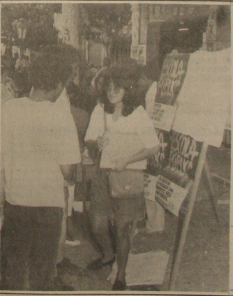
Comércio também preparado para pegar os cruzados novos