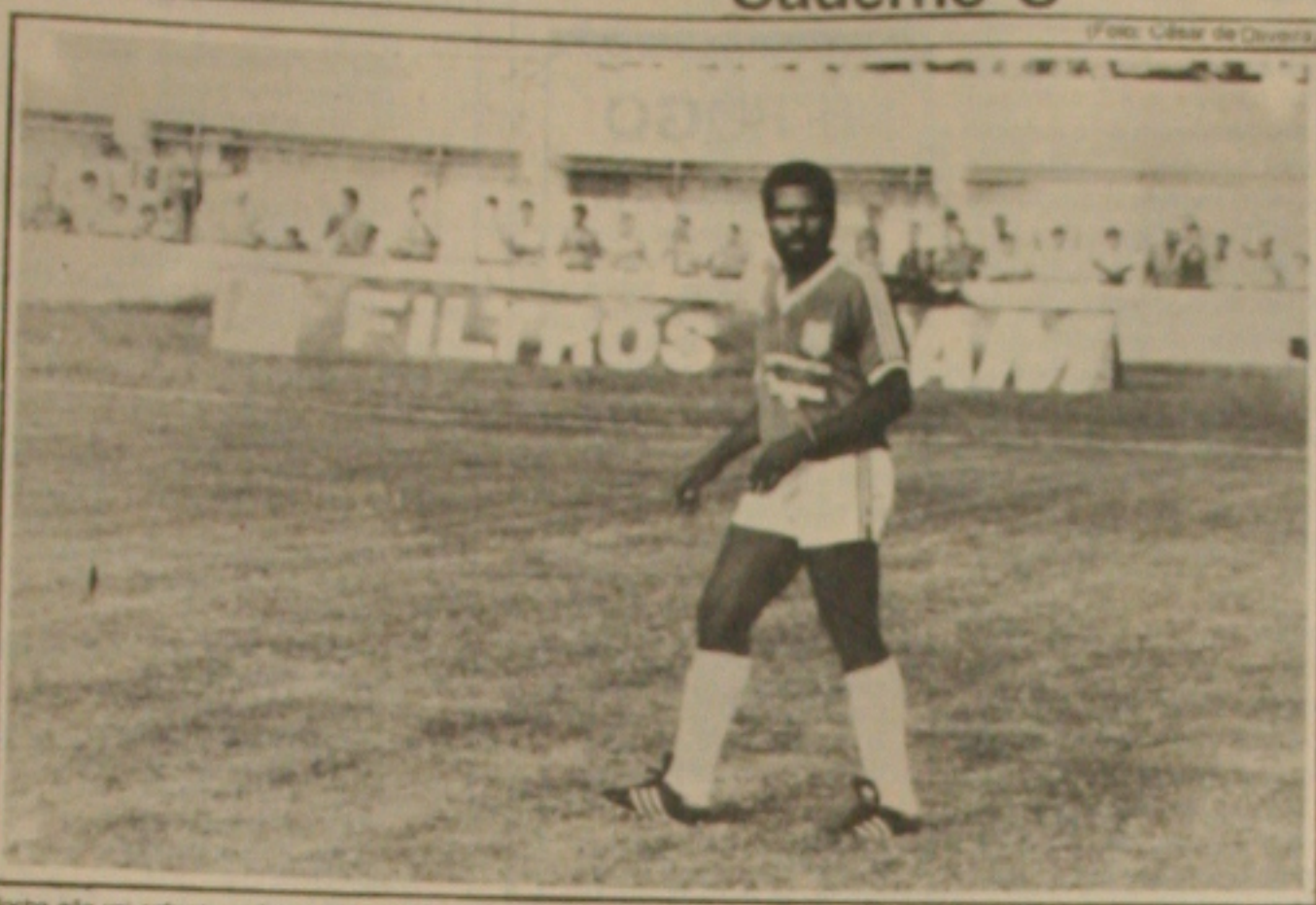
Rocha não vai enfrentar o Amadense em Tobias Barreto.

Esclarecendo as dúvidas Isaldo disse que o Cotinguiba está somando seis pontos, computando o ponto que conquistou como primeiro da primeira fase. O ponto que esse ponto, não pode ser computado para o primeiro técnico de desempenho. Esse o primeiro jogador dos decanos. O segundo artigo do artigo 39 o desmerece através de uma série de pontos que se verificaria caso o Cotinguiba tivesse que decidir o ponto que não vem a ser computado para ilustrar o exemplo mostrou a classificação de São Cristóvão e Guarani, que estão empatados e vão decidir o título melhor de três a partir de domingo.