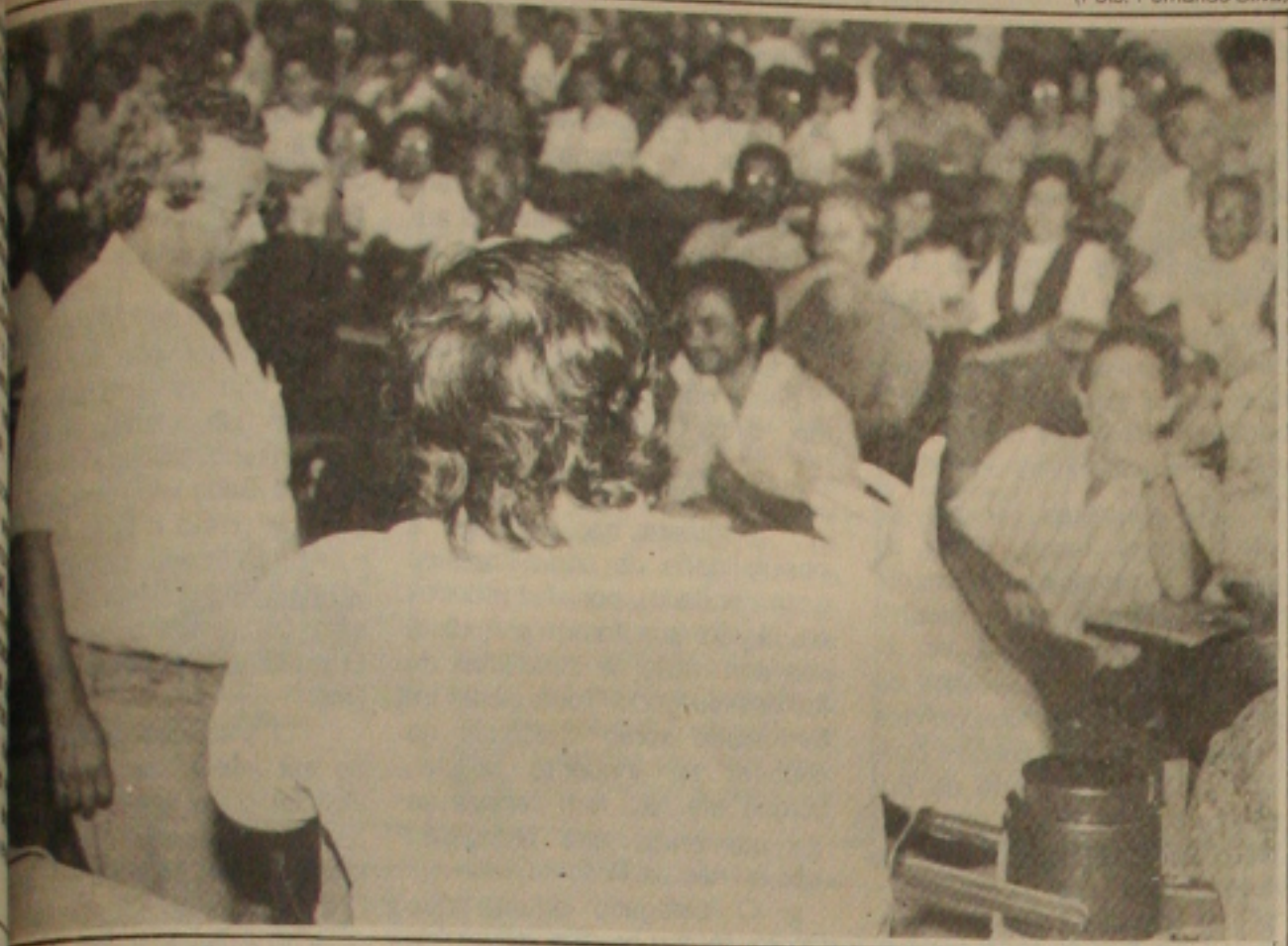
Professores da UFS decidiram ontem em sessão geral retornar ao trabalho na segunda-feira, após 93 dias de greve

Finalmente termina na próxima segunda-feira a greve dos professores da Universidade Federal de Sergipe (UFS) que hoje completa 93 dias. A decisão de suspender o movimento grevista foi tomada ontem pela categoria durante a realização de uma assembleia geral, realizada a partir das 125 horas, no auditório da Reitoria no Campus Universitário.