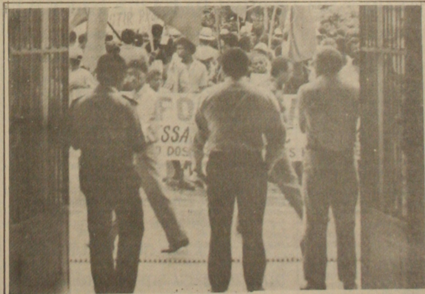
Os trabalhadores vão se concentrar hoje à tarde na Praça Olímpio Campos