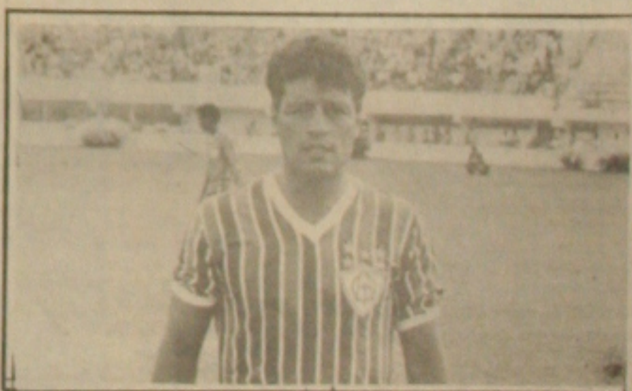
Castrolândia não mostrou seu futebol