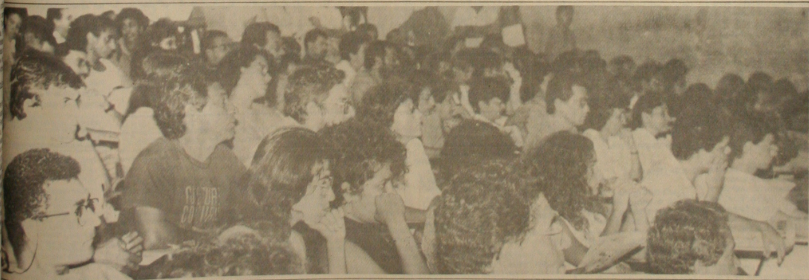
Assembléia realizada ontem, no Campus, os professores da UFS decidiram suspender a greve e voltam as salas de aula nesta segunda-feira.