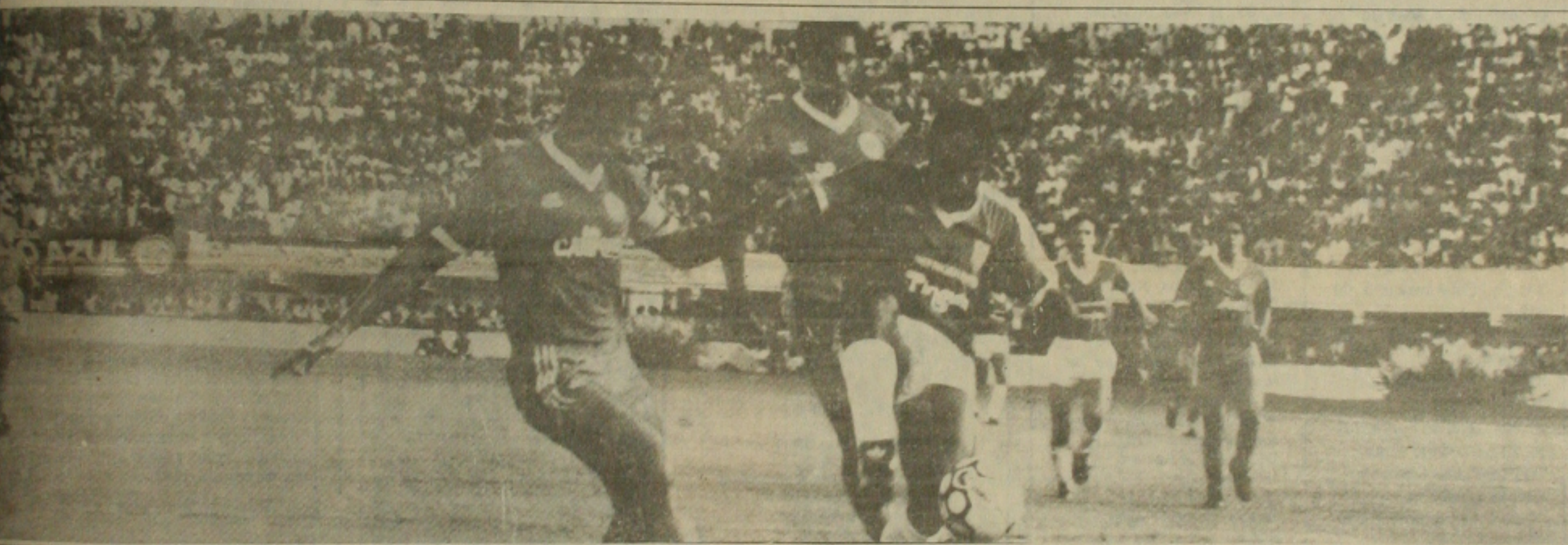
...e Confiança um jogo de muitas emoções