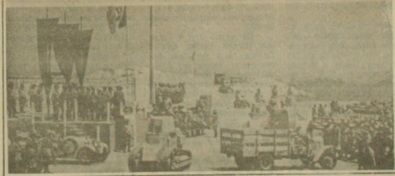
O Leão do Deserto, a minissérie que a Rede Manchete estreia nesta semana, traz grandes nomes do cinema como Anthony Quinn, Raf Vallone e Irene Papas.