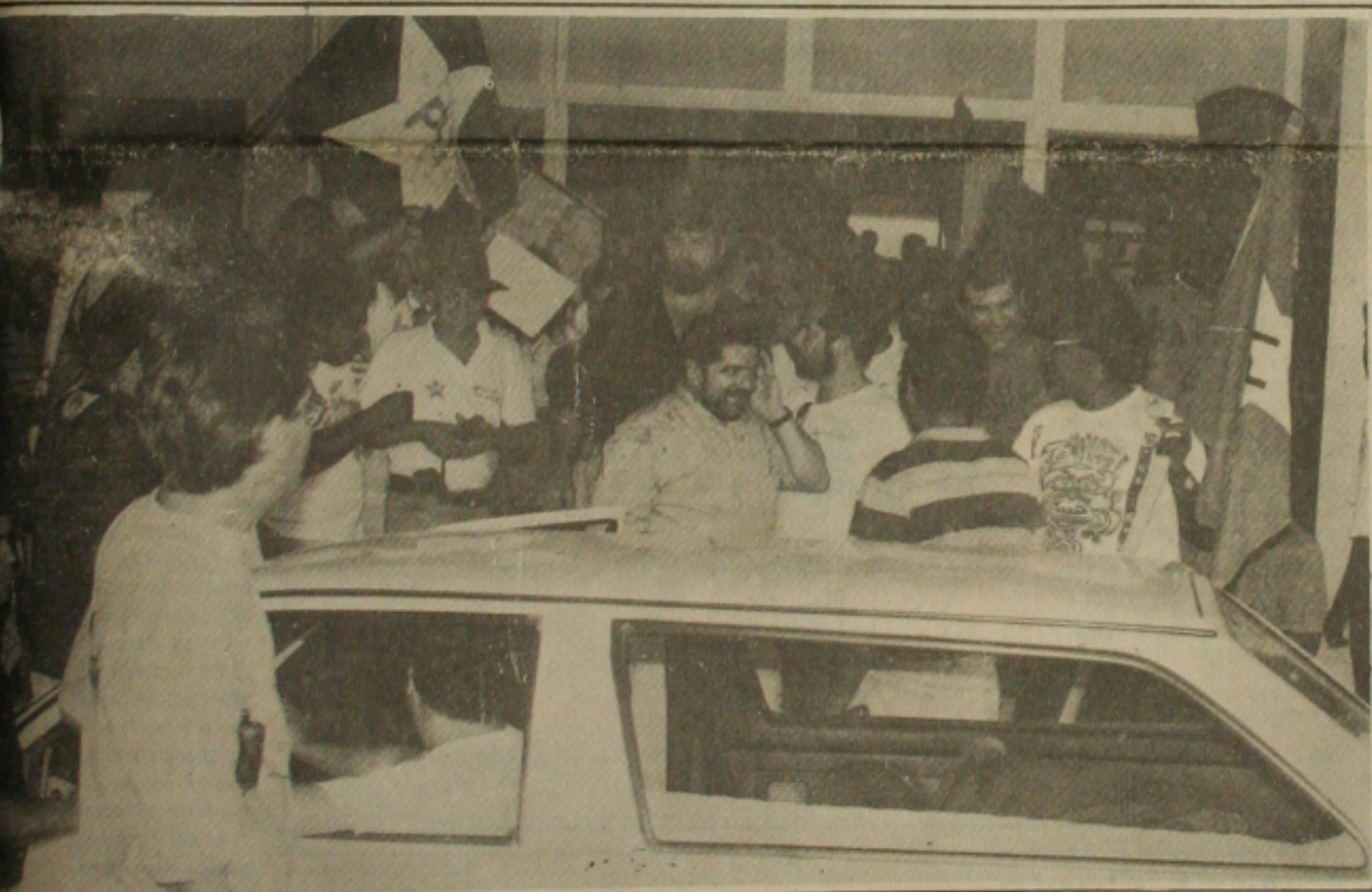
Manifestantes esqueceram as divergências internas e foram ao aeroporto para a recepção a Lula que veio para apagar o incêndio.

Farsante, charlatão mentiroso foram algumas das palavras ditas por Lula ontem ao desembarcar no Aeroporto de Aracaju, procedente de Maceió, para participar de uma reunião com petistas, visando apaziguar os ânimos do partido em Sergipe, para classificar o presidente Collor de Mello para quem perdeu as eleições presidenciais de 89.