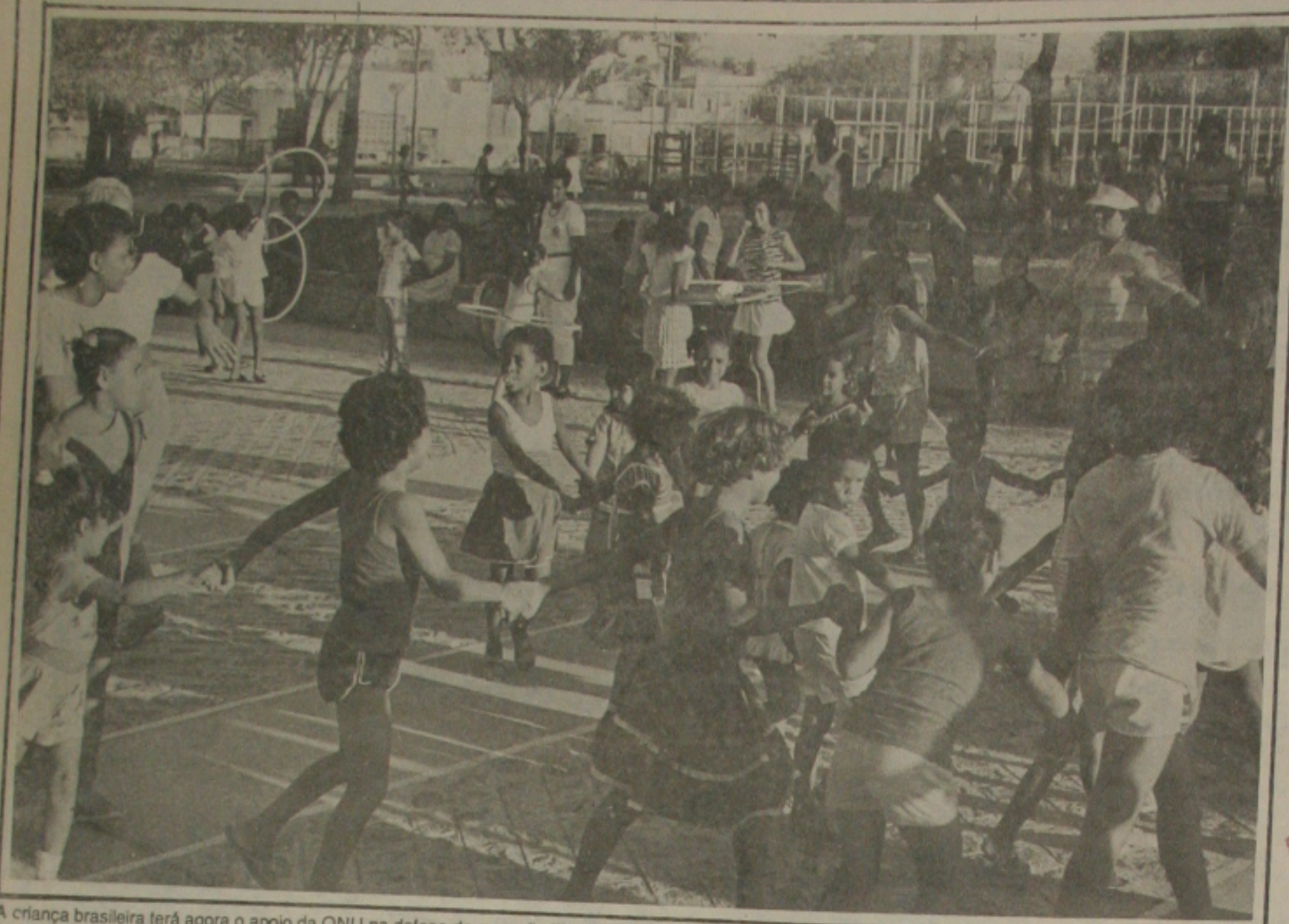
A criança brasileira terá agora o apoio da ONU na defesa de seus direitos