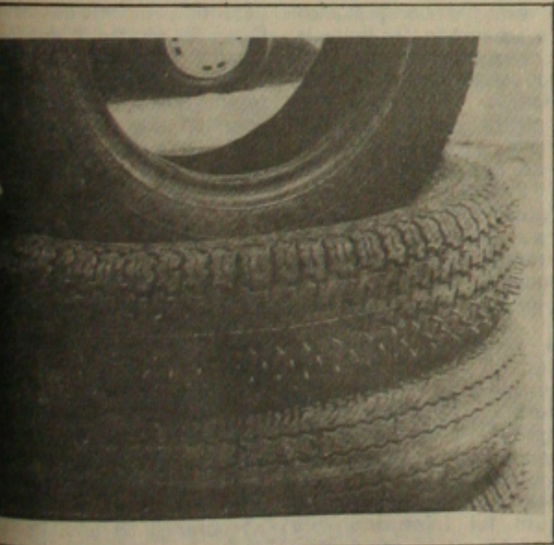
Outro reajuste de preço a partir de amanhã