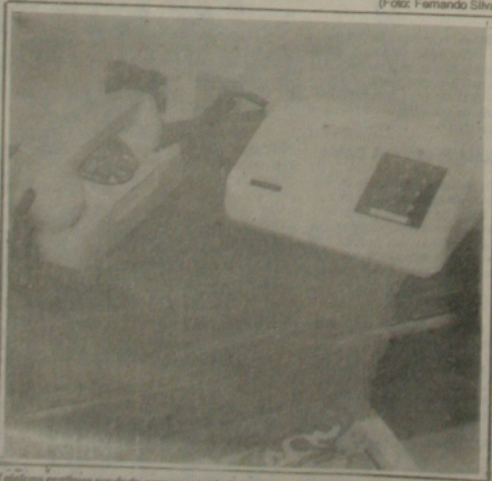
Telefones públicos servindo para escutar à distância