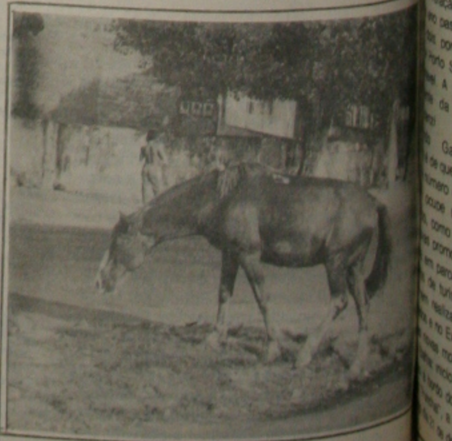
Os animais pastam nas ruas e põem em risco a vida dos motoristas