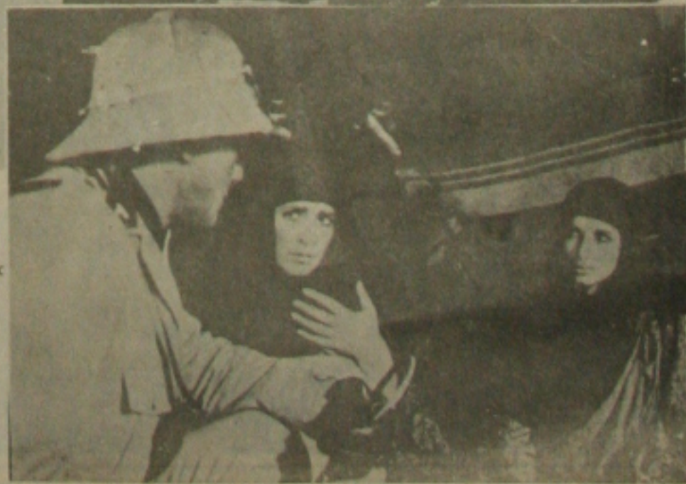
O Leão do Deserto é um filme magistral com grande elenco e grandes astros e estrelas internacionais.