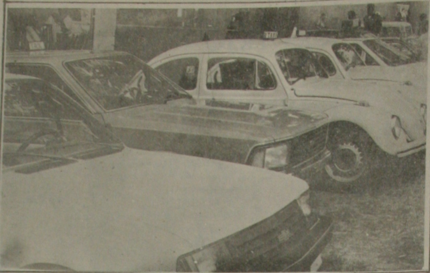
A frota de táxi de Aracaju pode não ser renovada pelo alto preço no financiamento de veículos

Já para o representante da Fundação Nacional de Saúde no Grupo Técnico de IX CNS, Flávio Goulart, "é grande a mobilização em torno da IX Conferência e seria importante manter o prazo anteriormente definido, até porque a correlação de forças dos governos municipais e estaduais,