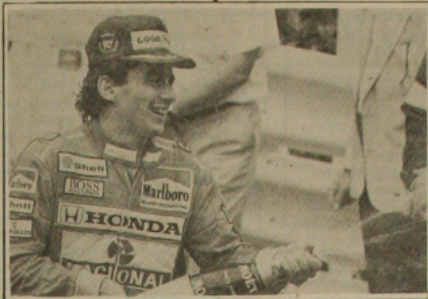
Senna só depende dele para ganhar o tri hoje

O treino de ontem causou muitas surpresas para os pilotos e técnicos das equipes. Uma pista nova e de aderência desconhecida, levou a muitas alternativas na troca de pneus para se conseguir superar os tempos obtidos na sexta-feira. O brasileiro Ayrton Senna que pode conquistar o tricampeonato hoje chegou a ter problemas mecânicos aos 37 minutos do treino. Seu carro derramou muito óleo e o treino foi suspenso. Depois ninguém conseguiu obter qualquer melhoria na performance. Senna está a sete pontos da conquista do tri.