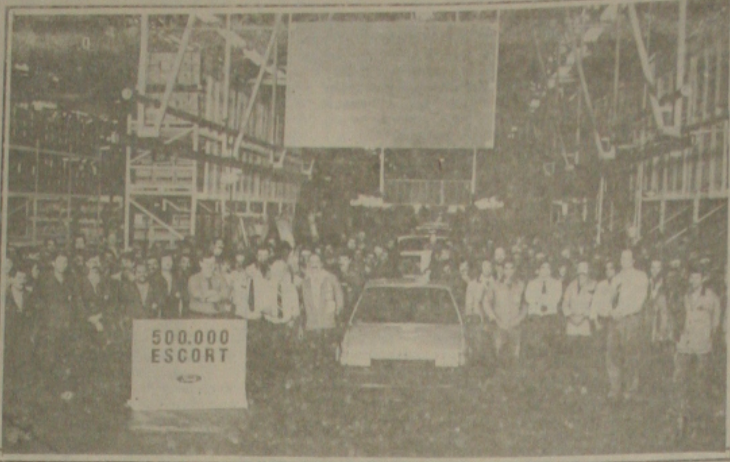
A Ford comemora o lançamento dos 500.000 carros Escort

O mini-carro do futuro é um protótipo inteiramente funcional que, de acordo com os especialistas da área, pode ser a primeira base e concreta para o Swatch Car, ou Swatchwagen que a Volkswagen pretende desenvolver em cooperação com o grupo relojoeiro suíço SMH (Sociedade Microeletrônica de Relojoaria) controlado pelo empreendedor Nicholas Hayeck (63), proprietário, entre outros, das marcas Swatch, Omega e Tissot.