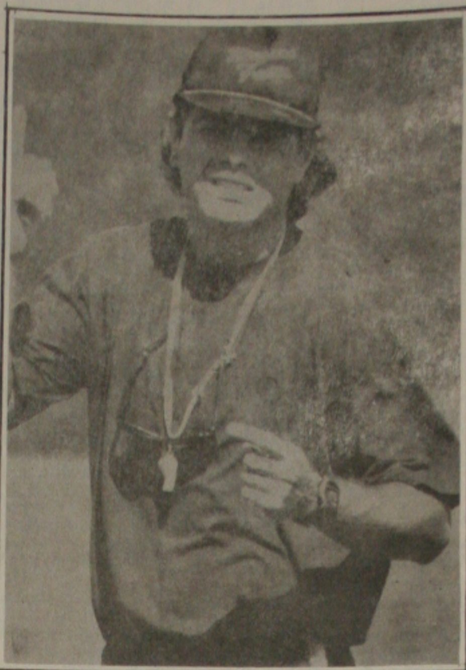
Edinho deve escalar time reserva para os próximos jogos.

— Com os dois times embalados é possível se sonhar com uma grande renda capaz de resolver estes problemas — assegurou Paulo Dantas.