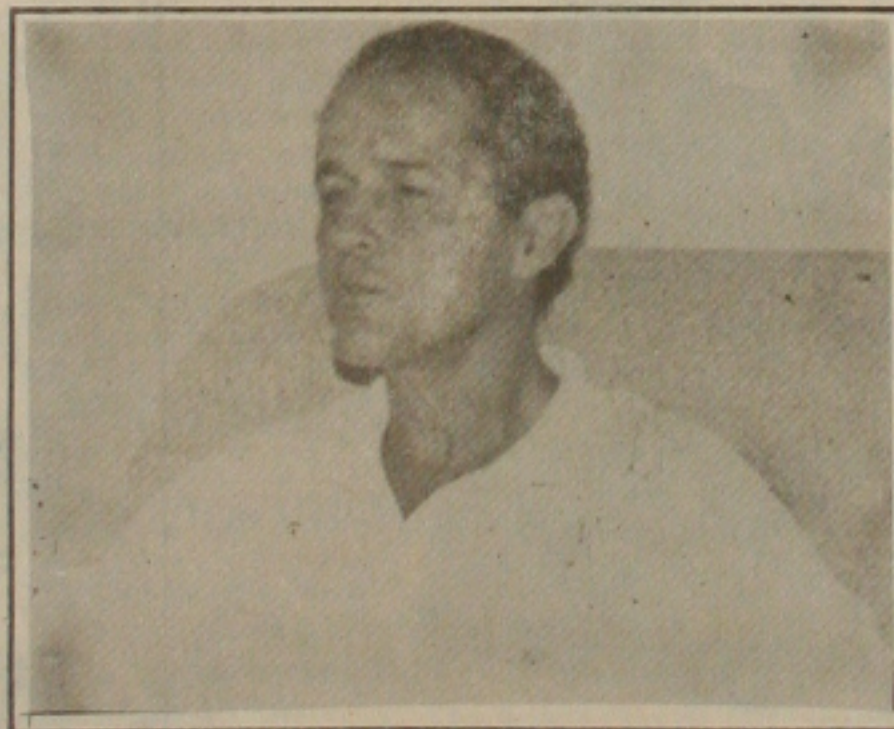
Santiago denuncia as irregularidades no Hospital João Alves Filho

cansado de vê o sofrimento do povo e, por isso resolveu denunciar as irregularidades do João Alves a fim de que as autoridades competentes tomem as providências cabíveis objetivando melhorar o atendimento médico naquele Pronto Socorro e, por conseguinte, a população de um modo geral seja beneficiada. "Não posso permitir o descaso com a coisa pública, não faz sentido gastar o que foi gasto no João Alves e hoje ele chegar ao descredito", finalizou.