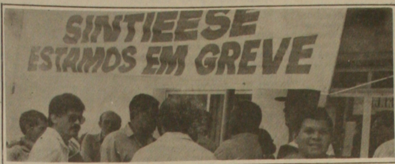
Os eletricitários realizam hoje nova assembleia e vão definir atos públicos.

Sem qualquer perspectiva de acordo para o retorno ao trabalho, os trabalhadores da Energipe realizam hoje, pela manhã, no Instituto Histórico, nova assembleia geral para avaliação da greve iniciada na última segunda-feira. Na reunião de hoje os eletricitários vão definir a realização de manifestações públicas, como passeatas, concentrações e distribuição de panfletos, esclarecendo à população os motivos da paralisação por tempo indeterminado. Os trabalhadores querem reajuste de 307% e a Energipe apresentou contraproposta rejeitada pelos grevistas. (Página 3B)