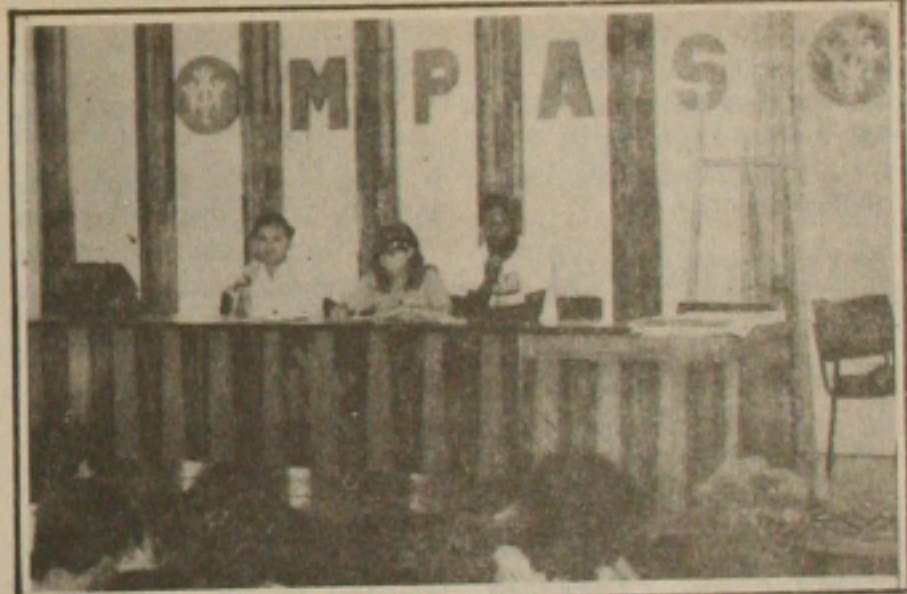
Em assembleia, previdenciários decidem pelo estado de greve