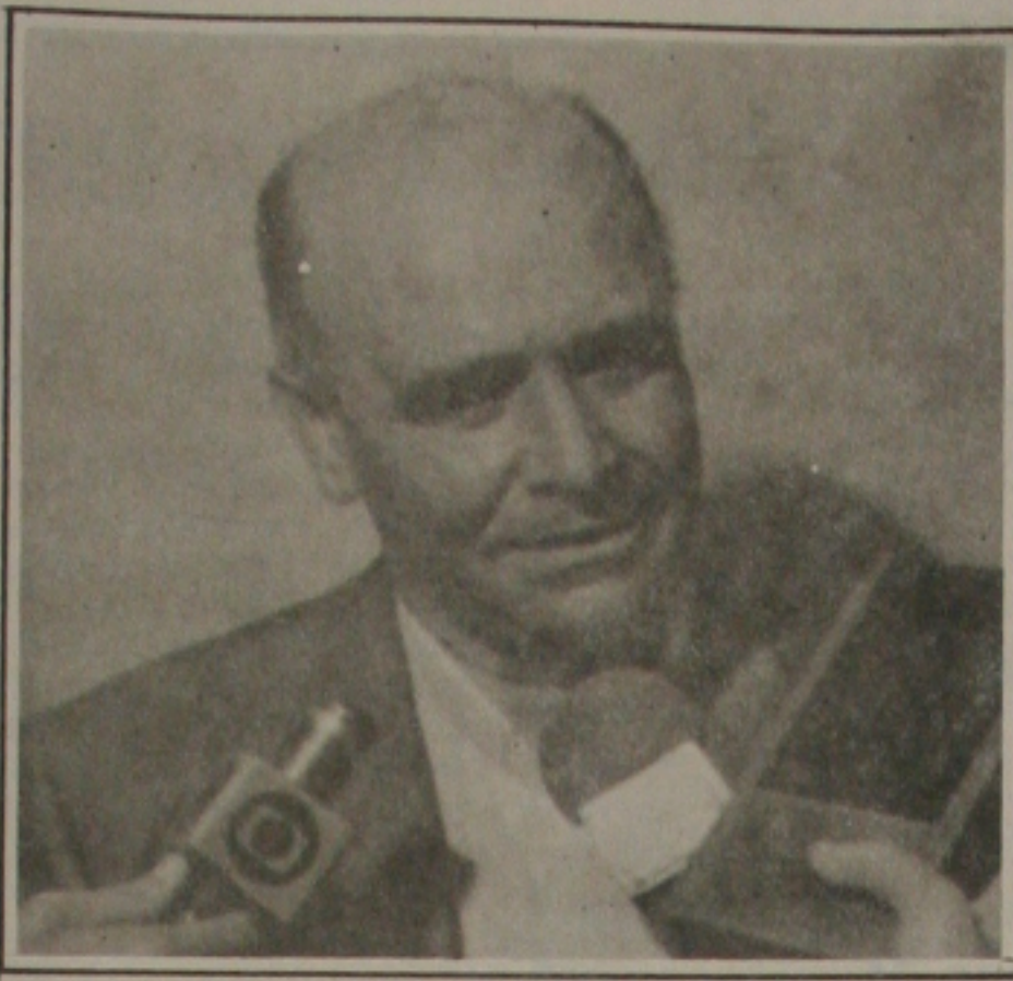
D. Palmeira Lessa, Bispo de Propriá, fala sobre a desnutrição e morte no Nordeste.

Bosco Mendonça enfatizou que a administração municipal não tem esforços para manter a cidade limpa, utilizando inclusive carroças onde os caminhões não conseguem passar e até mesmo caminhos de mãos em áreas não oferecem condições de acesso para os veículos movidos a tração animal.