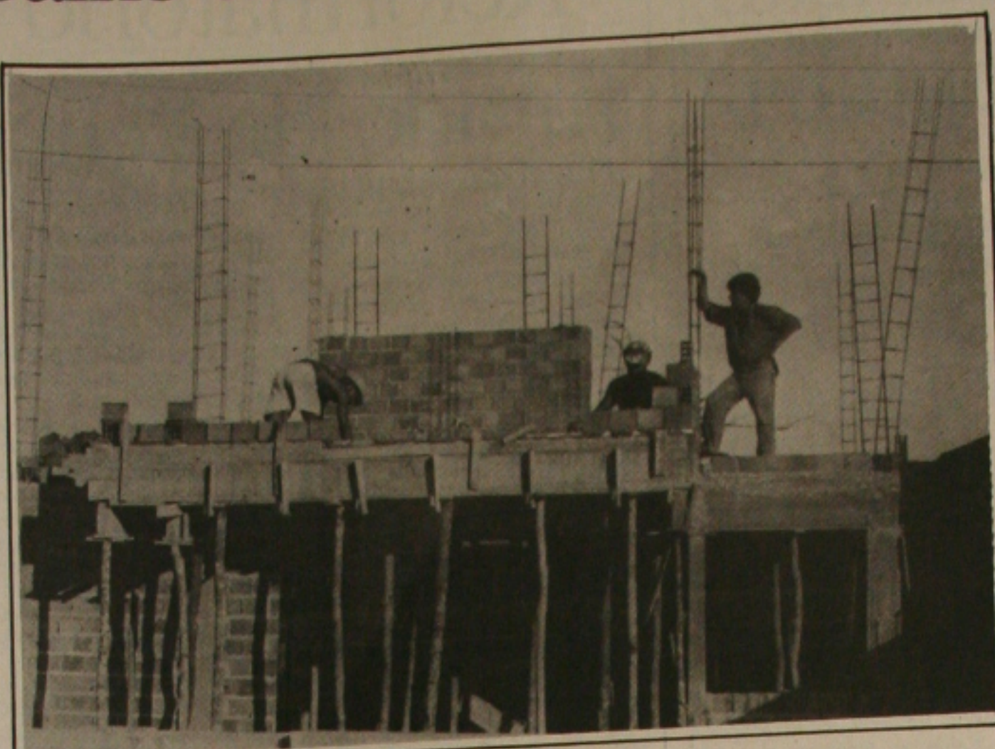
A construção civil é recordista em número de acidentes de trabalho no Estado

Para mostrar aos visitantes Izildinha informou que estarão expostos fotografias, documentos, troféus, medalhas e placas sobre a exposição agropecuária, nas suas diversas épocas. Além disso terá exposto um resumo de toda a história desse evento anual.