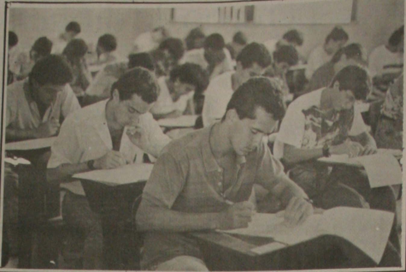
A disputa por uma vaga na UFS começa hoje, às 8 horas, com nove mil candidatos

O diretor do Adauto Botelho, disse que "não sabe se os homossexuais têm que ser curados". Ele alega que o comportamento deles um desvio, ou opção como eles mesmos costumam se posicionar quando a sociedade os criticam. Disse ainda o psiquiatra sergipano que o colega baiano é totalmente desconhecido nos congressos internacionais como afirma estar desenvolvendo o seu método não convencional há 12 anos e foi apresentado ao Brasil e fora dele.