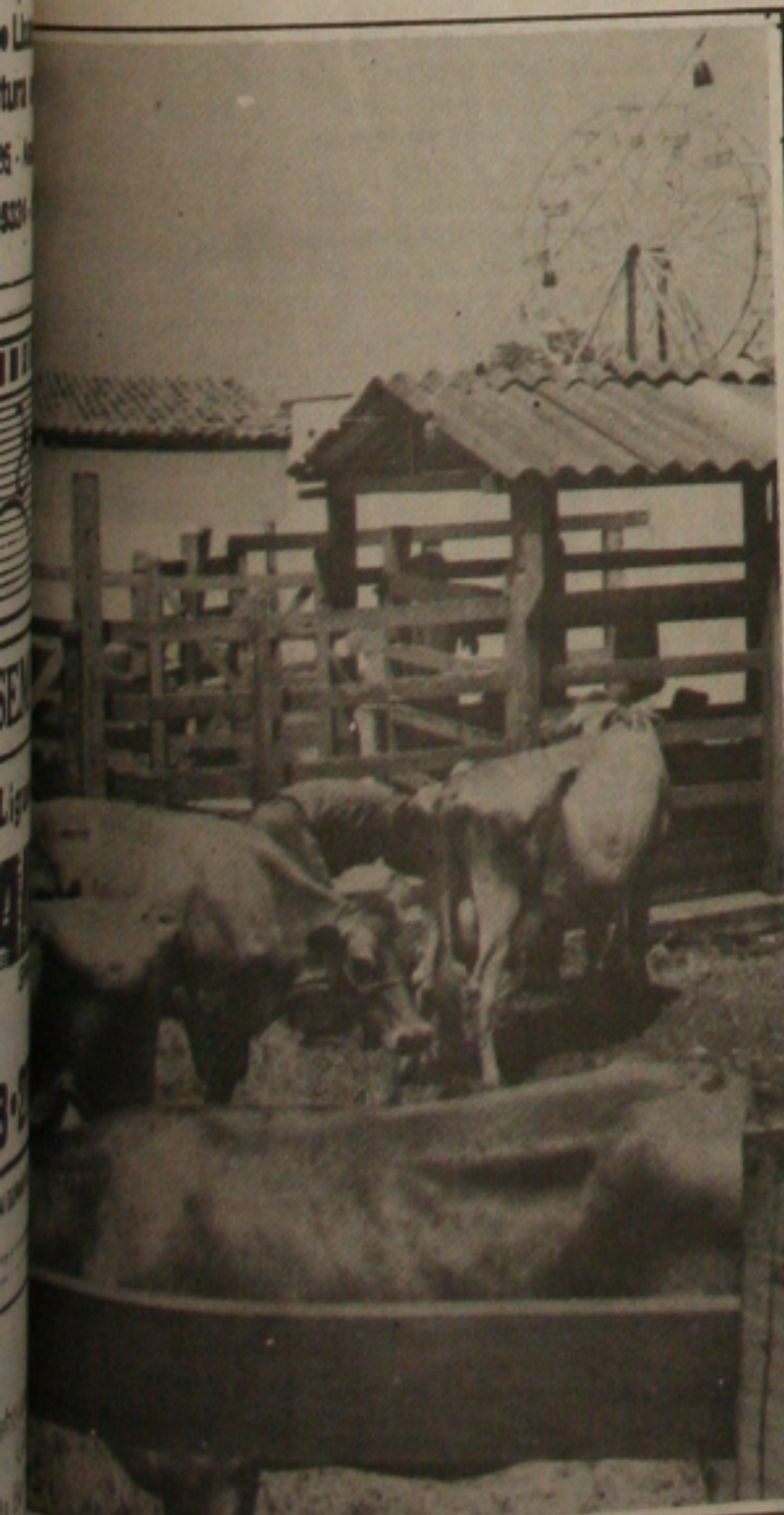
Exposição agropecuária no Parque João Cleofas