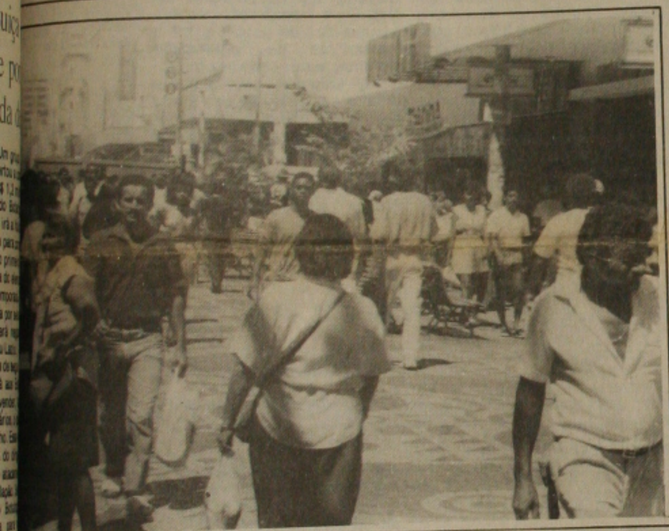
Partir de amanhã o comércio funciona até as 20 horas para atrair consumidores. (Pá

Um estranho e absurdo caso de tráfico de criança para o exterior, com o envolvimento da Casa Santa Zita e do Juizado da Infância e da Juventude esteve para ser concretizado em Aracaju esta semana e só foi frustrado porque o passaporte da criança não ficou pronto a tempo e a mãe terminou descobrindo tudo.