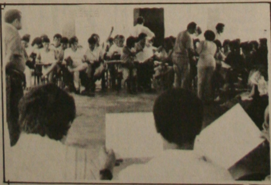
Os servidores da UFS adiam paralisação para janeiro

reivindicações que a classe está fazendo ao Governo as principais são: recuperar as perdas de mais de 40 por cento só neste ano; isonomia salarial que o Governo não cumpriu no acordo salarial deste ano; igualdade da tabela de Plano Único e Classificação Redistribuição de Cargos e Empregos (Pucre) e Plano de Classificação de Cargo (PCC); contraria a política recessiva; a privatização dos estatais que estão sendo sucateadas, além do acordo com o Fundo Monetário Internacional (FMI) que prevê arrocho salarial por dois anos, disse o diretor Wellington.