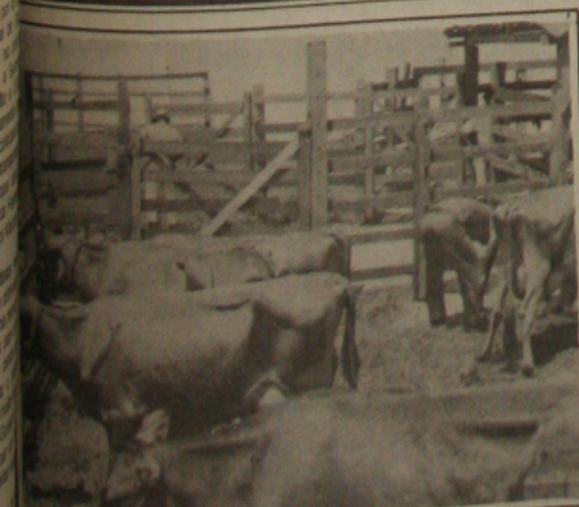
Os animais chegaram para a Exposição.

Em solenidade que vai acontecer hoje a partir das 20 horas, a ser presidida pelo governador do Estado em exercício, José Carlos Teixeira, será aberta a 50ª Exposição Agropecuária do Estado de Sergipe, no Parque João Cleófas, reunindo os principais criadores sergipanos. A exposição vai prosseguir até o próximo domingo e na área técnica a principal inovação este ano é a realização de excursões com a presença no Parque de pequenos produtores do interior, especialmente da área do semi-árido. (Página 3B)