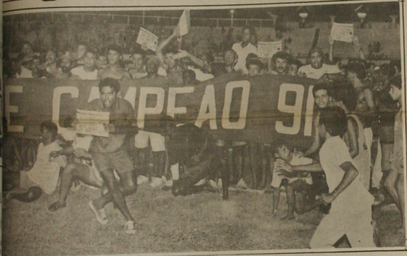
Sergipe promete nova festa no Batistão

A torcida rubra ainda em estado de graça pela conquista do título de 91, promete fazer uma grande festa hoje no Batistão, quando os atletas estarão recebendo as faixas de campeões. Para quem esperou um temporada longa, desgastante e acima de tudo angustiante, os rubros tem motivos para comemorar e apesar de algumas dificuldades, os rubros prometem comparecer ao Batistão.