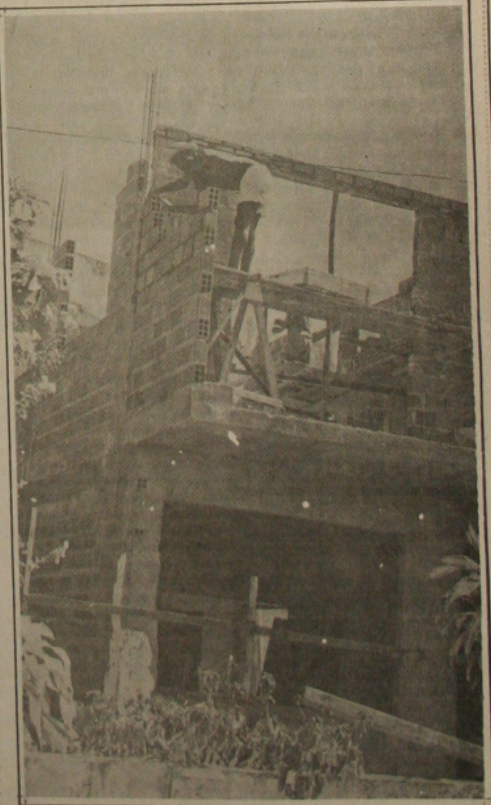
Construção civil: recordista de acidentes.