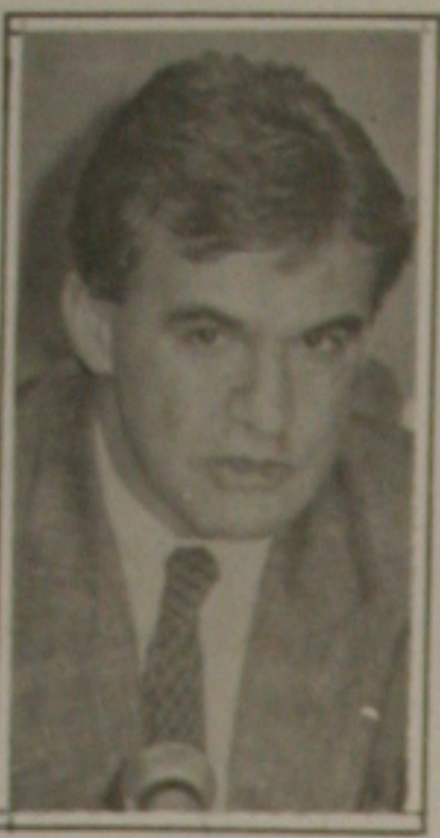
Ministro Alcení Guerra

Collor e Alcení tentaram demonstrar tranquilidade diante da decisão do Tribunal de Contas da União (TCU), que considerou, na quinta-feira, inconstitucional o repasse de verbas do Inamps, do Ministério da Ação e da Previdência da República para a construção de Centros Inte-