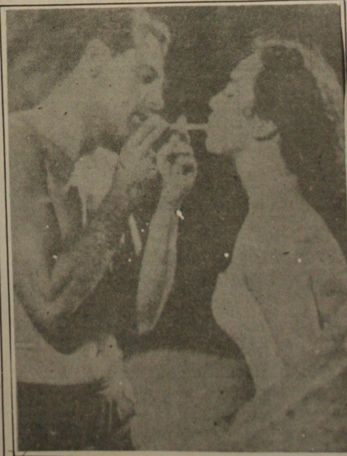
SUPLÍCIO DE UMA SAUDADE William Holden Jennifer Jones.