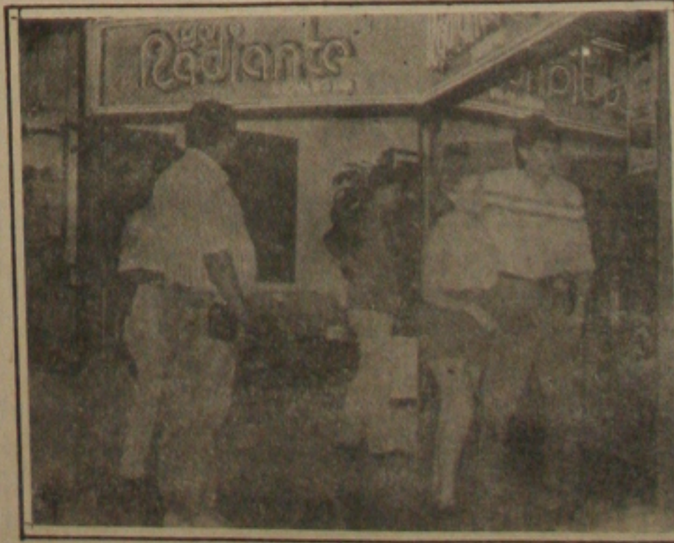
Domingo, o shopping estará aberto para recuperar as vendas nesse final do ano