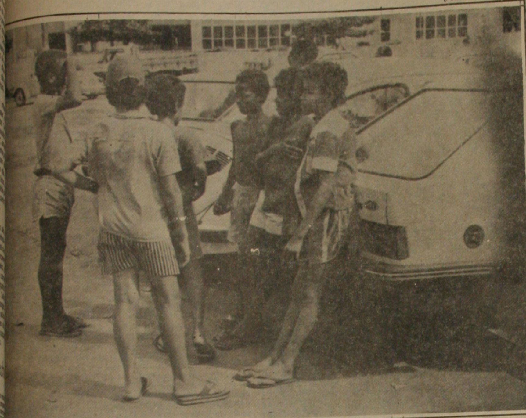
Programa de Doenças Sexualmente Transmissíveis, da Secretaria de Saúde, começa a se preocupar com os Meninos de Rua que são alvo principal para contrair a Aids

Uma novidade nas campanhas de combate à Síndrome da Deficiência Imunológica Adquirida (AIDS), desta feita a Secretaria de Estado da Saúde iniciou um trabalho sobre a doença junto aos meninos de rua. A primeira de um ciclo de palestras foi realizada ontem pela manhã no auditório do Serviço Nacional do Comércio (SESC), na Rua Bahia que foi assistida pelas menores da Fundação Esperança.