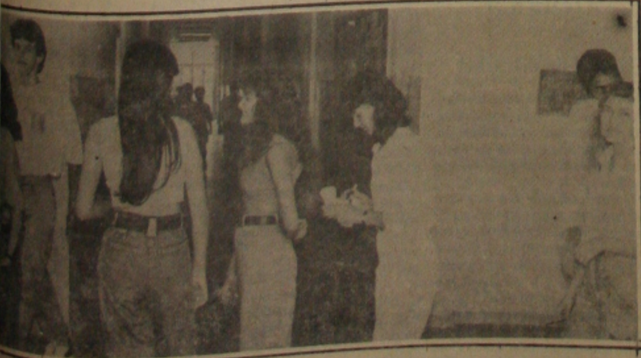
Os candidatos ao concurso de 92 procuram a procura dos gabaritos.