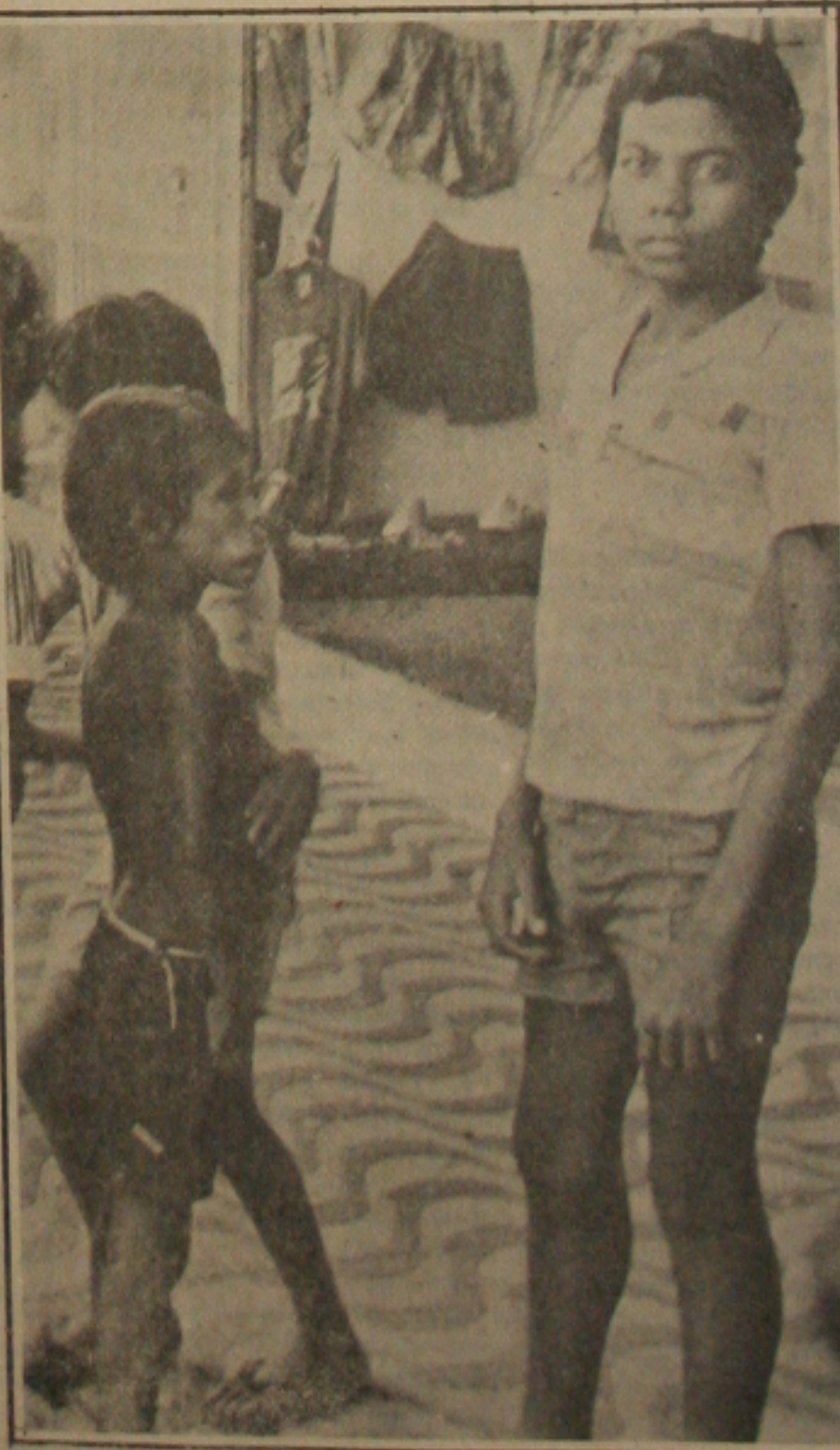
Menores aprendem a prevenção de Aids