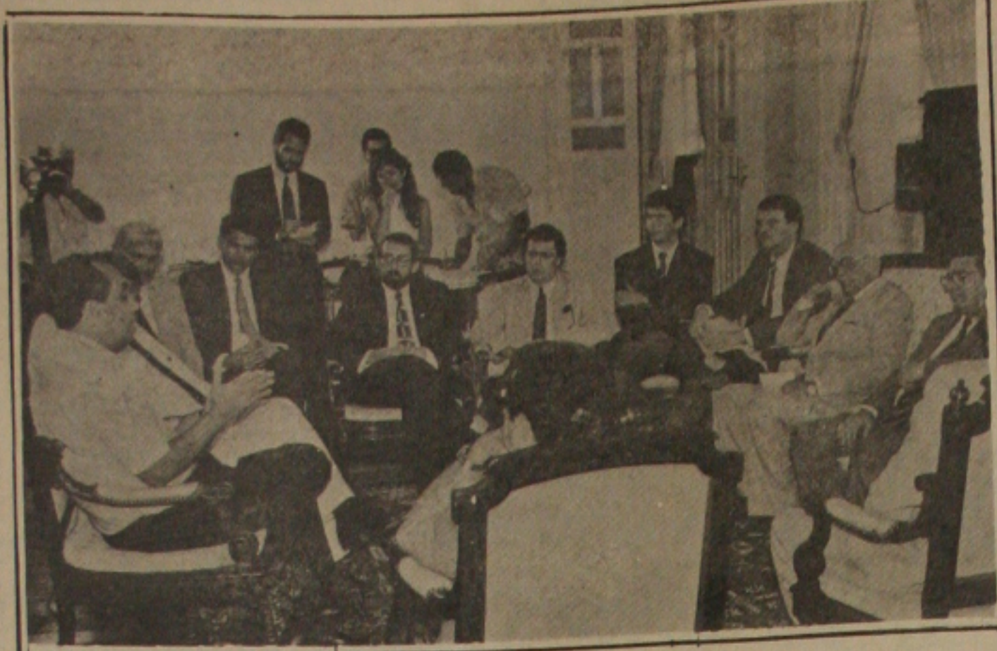
O governador João Alves falou aos deputados do Exato de sua viagem.

A receita arrecadada, segundo o relatório, foi superior à prevista proporcionando um excesso de arrecadação de R$ 3.381.108,38 e superior a despesa realizada ensejando um superávit da execução orçamentária de R$ 493.119,83. A despesa realizada foi inferior a despesa autorizada, havendo, portanto, uma economia orçamentária da ordem de R$ 955,89. Houve um acréscimo no saldo patrimonial de R$ 1.085.404,62. As aplicações nas funções educação e cultura e saúde estão em desacordo com o disposto, no