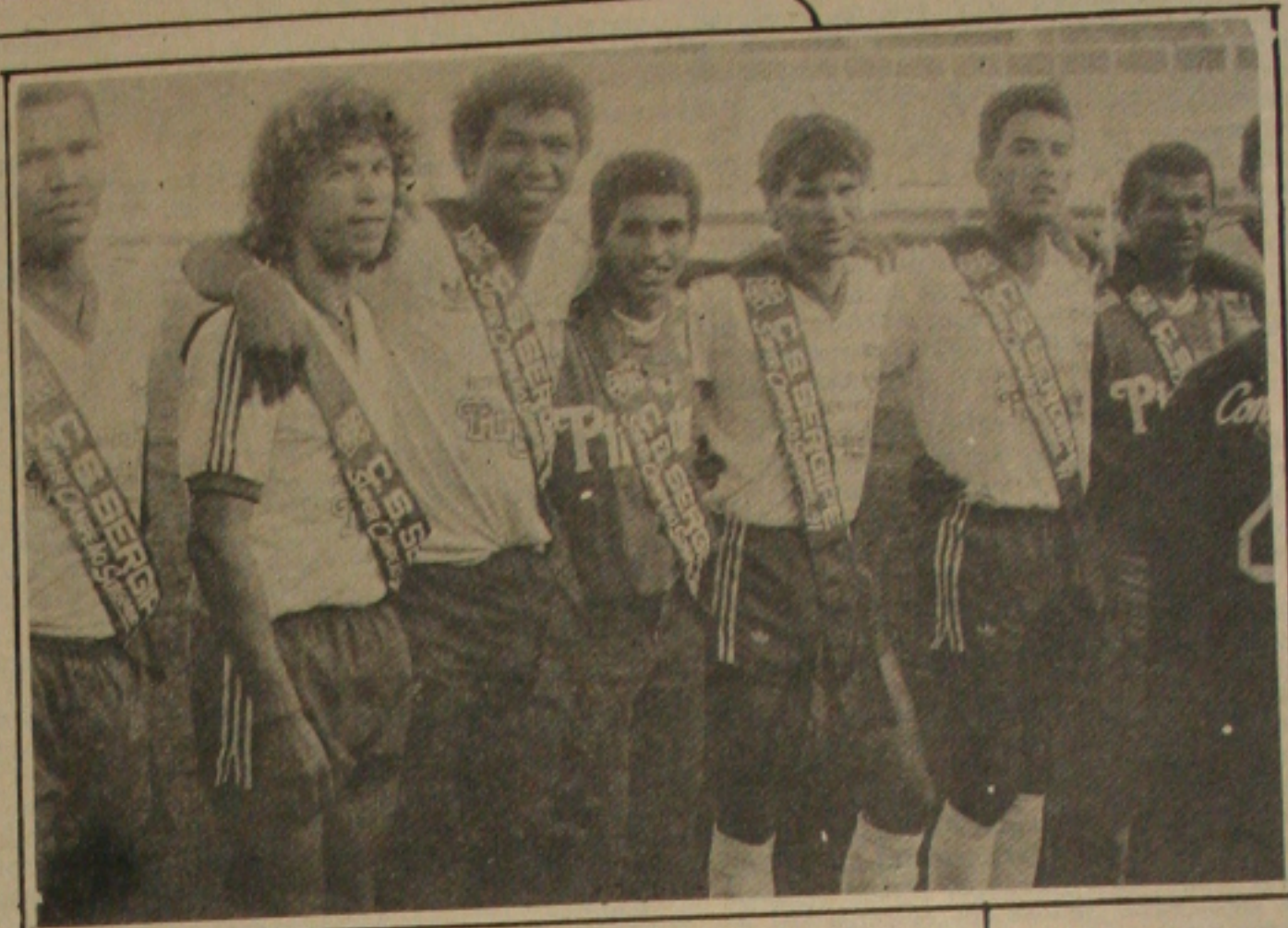
Sergipe perde para Gararu na festa das faixas.