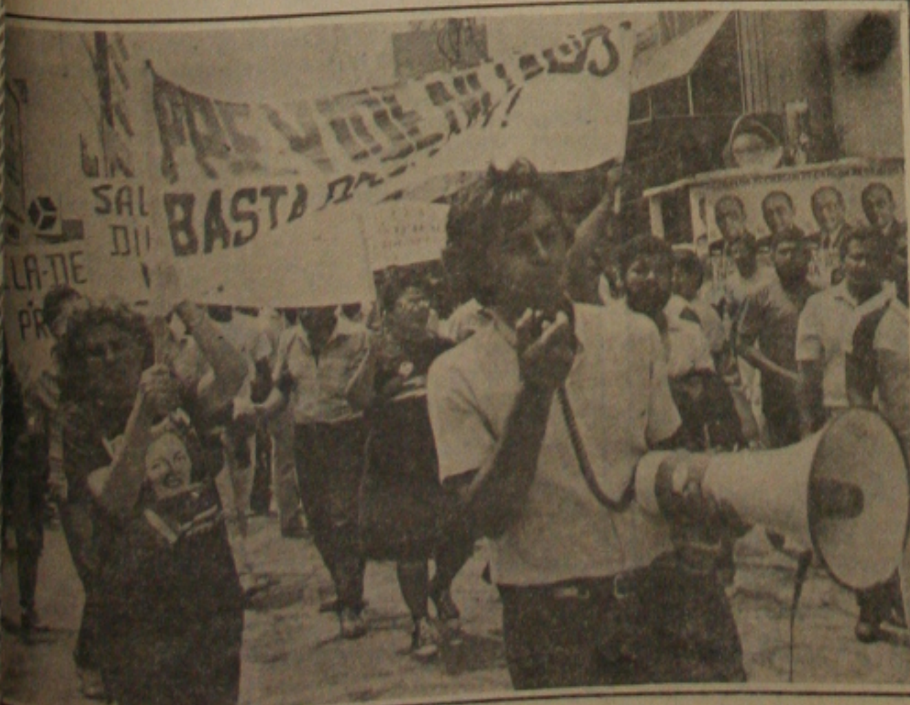
Previdenciários protestaram contra a política recesista do Governo.

As carroças contratadas pela Empresa Municipal de Serviços Urbanos (Emsurb) já recolheram 741.860 quilos de lixo nas comunidades onde foi implantado o Sistema Integrado de Coleta (SIC) que tem produzido bons resultados com um custo de Cr$ 6 mil 414 por cada tonelada de detritos retirada das ruas.