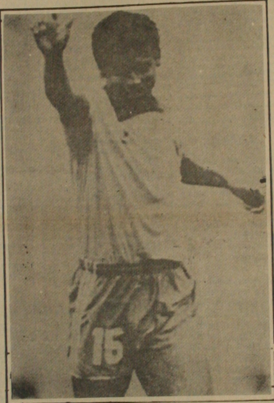
Muller pode ser afastado do amistoso contra os tchecos.

Sobre a situação do treinador Ribeiro Neto, Barros informou que esta é tranquila. O treinador segundo foi informado vai fazer uma viagem com a família e retorna no início de janeiro. A partir deste período, começam as rodadas de negociações. Ribeiro Neto só não fica no Sergipe se não for do seu interesse. Toda a diretoria está empenhada nesse trabalho e conta com o apoio e incentivo da torcida, que até exige a permanência do treinador. Sobre as propostas recebidas por Ribeiro Neto, os dirigentes rubros afirmam que o Sergipe se for necessário cobrirá qualquer proposta para manter o treinador campeão, para o próximo temporada. Após o jogo contra o Gararu ainda no vestiário do Batistão os atletas do Sergipe foram gratificados com uma parte da renda do jogo contra o Confiança e ontem no João Hora os jogadores receberam o complemento da gratificação pela conquista do título de 91. A partir de agora o elenco está de férias e o retorno está confirmado para o dia 25 de janeiro, quando a comissão técnica e a diretoria estarão traçando os planos para a próxima temporada.