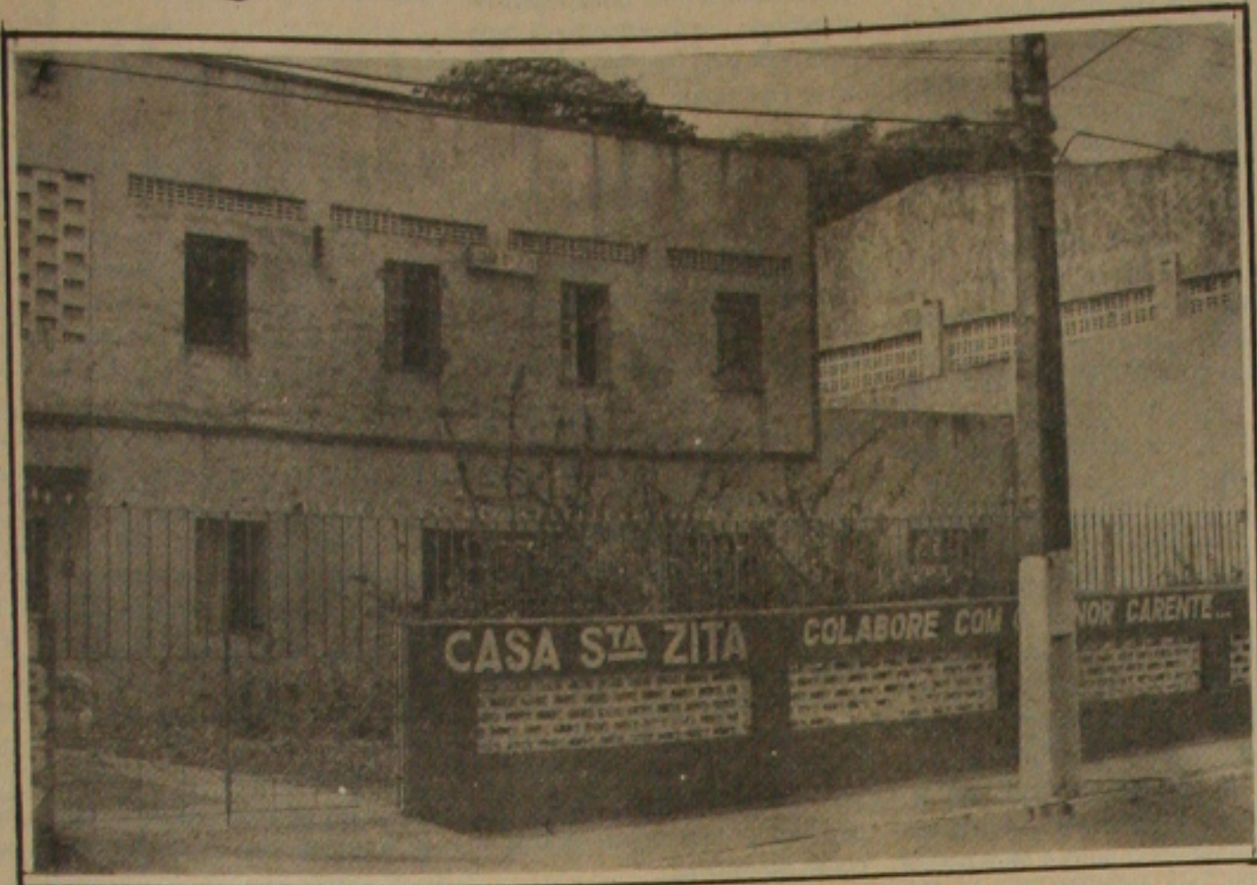
A direção da Casa Santa Zita desmente a transferência de menor para o estrangeiro