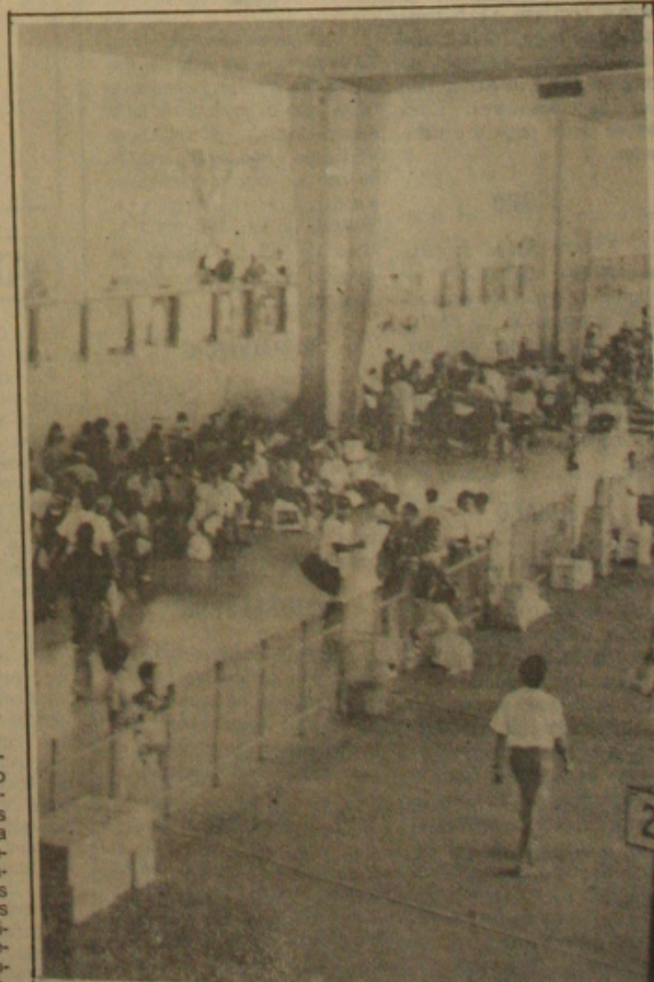
Na rodoviária passageiros só para o interior.

A crise financeira também está sendo apontada como a responsável pela diminuição do número de passageiros que aproveitou a folga do Natal para visitar os familiares em outras capitais. Para se ter uma idéia da queda, no ano passado foram colocados 19 ônibus extras para Salvador e neste Natal apenas um ônibus extra foi acrescentado as viagens normais. O grande movimento foi de passageiros para o interior do Estado e pelo Terminal Rodoviário José Leite, na parte da manhã, transitaram milhares de pessoas. (Página 3B)