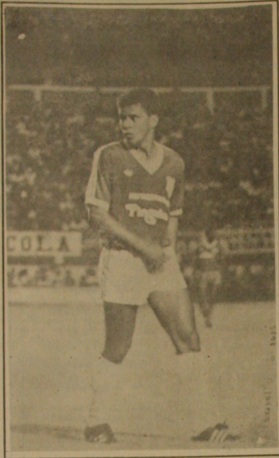
Balaninho continua na mira dos proletores.