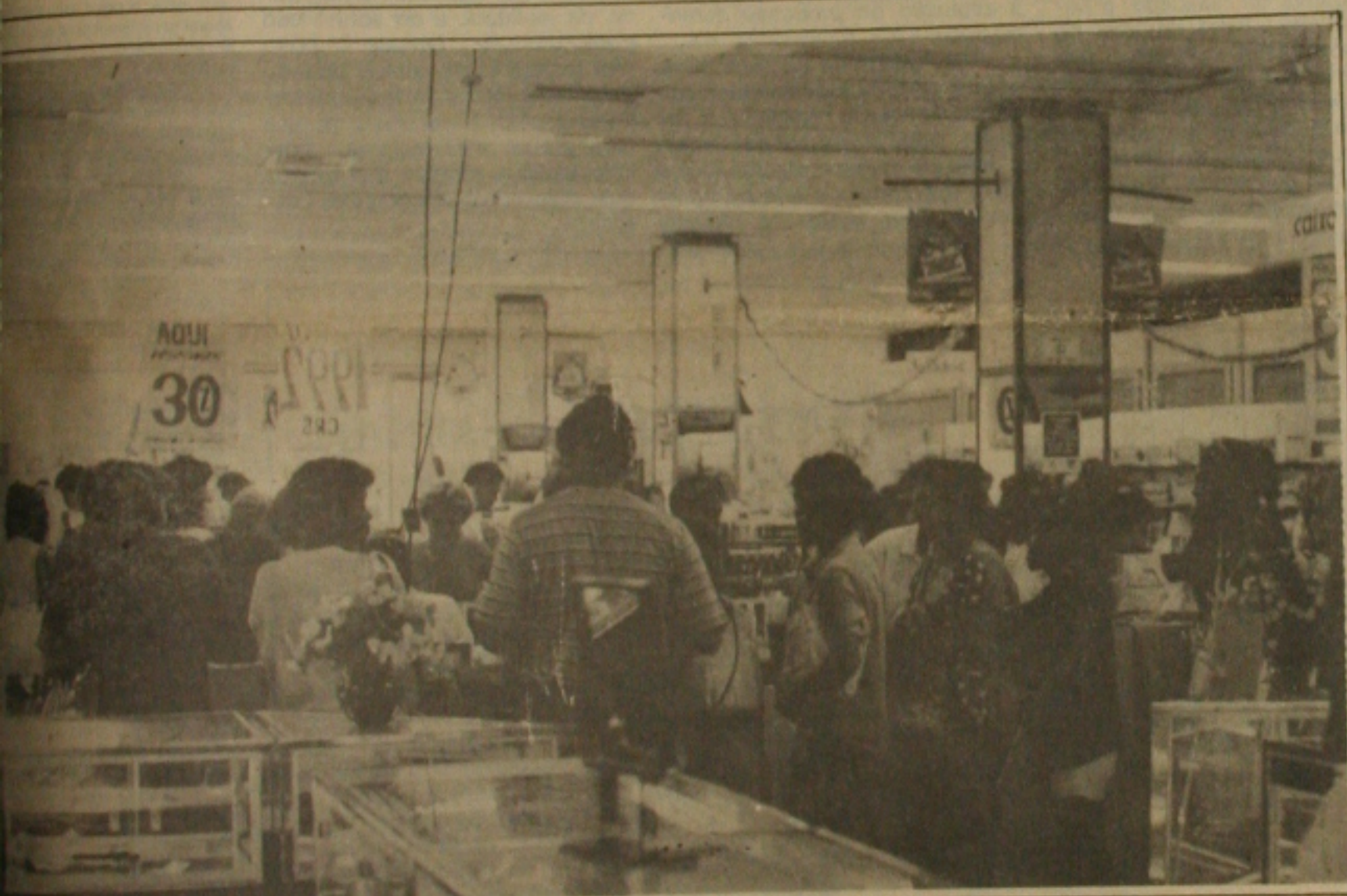
Centro comercial foi tomado pelos consumidores na véspera do Natal.

Se houve culpa pelos incidentes com os funcionários da Prefeitura de Aracaju que insatisfeitos pela suspensão do pagamento do décimo terceiro salário depredaram portas e ornamentos do Palácio Ignácio Barbosa, ela deve ser atribuída ao Governo do Estado e a Prefeitura de Aracaju que não avisaram com a antecedência mínima exigida de 48 horas, que fariam saques para pagamento salarial ao funcionalismo. A afirmação foi feita ontem pelo presidente do Banco do Estado de Sergipe, Camilo Calazans, ao ressaltar que a direção do banco e seus funcionários enviaram todos os esforços e até trabalharam fora do horário de expediente para não prejudicar ainda mais os servidores da Prefeitura de Aracaju.