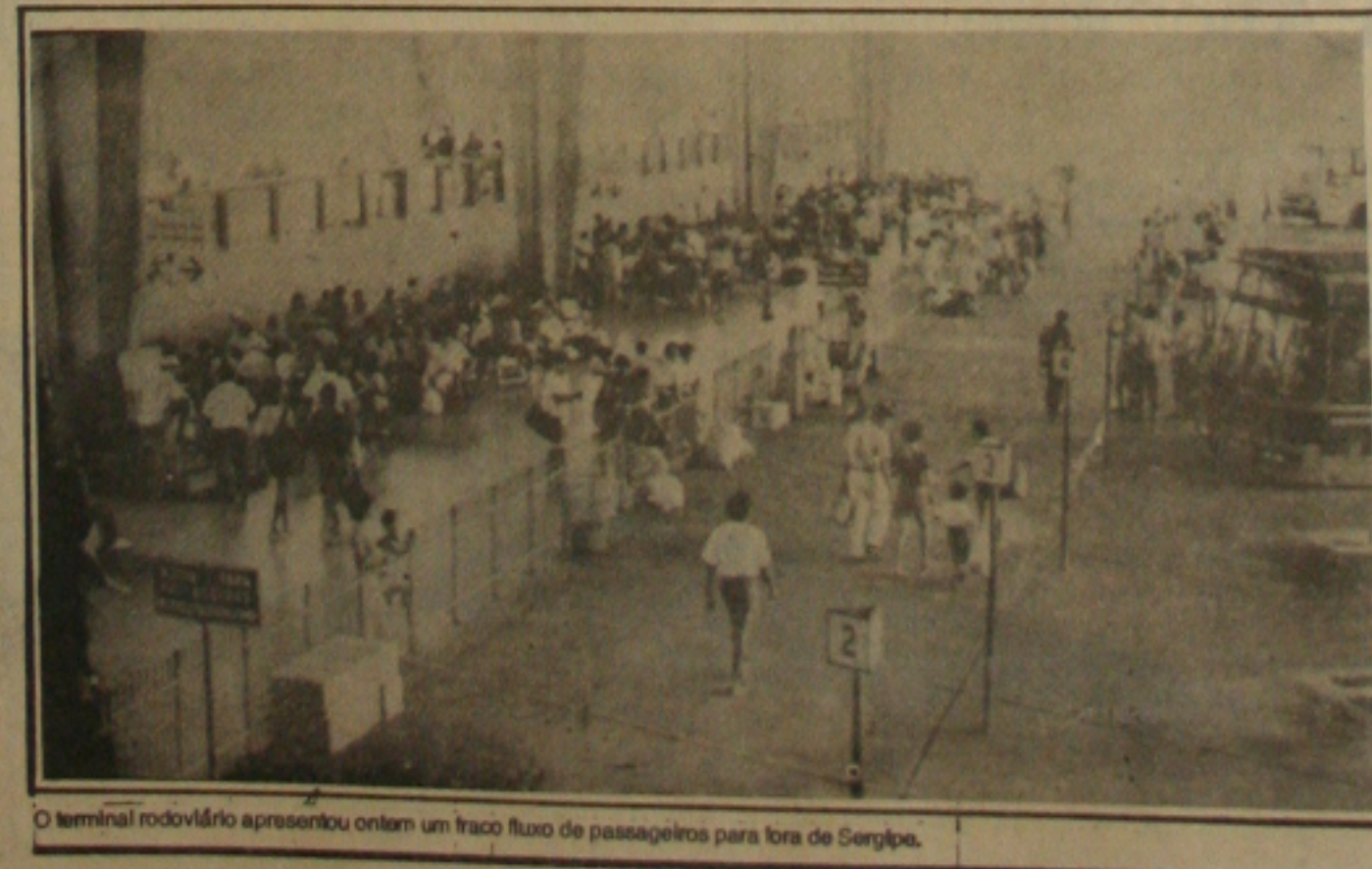
O terminal rodoviário apresentou ontem um fraco fluxo de passageiros para fora de Sergipe.

O administrador do Terminal Rodoviário informou que para estas localidades não há necessidade de se colocar ônibus extras uma vez que o número de carros que fazem o percurso diariamente é suficiente para atender a demanda. "A crise econômica, o momento atual provocou a queda nas vendas das passagens", enfatizou.