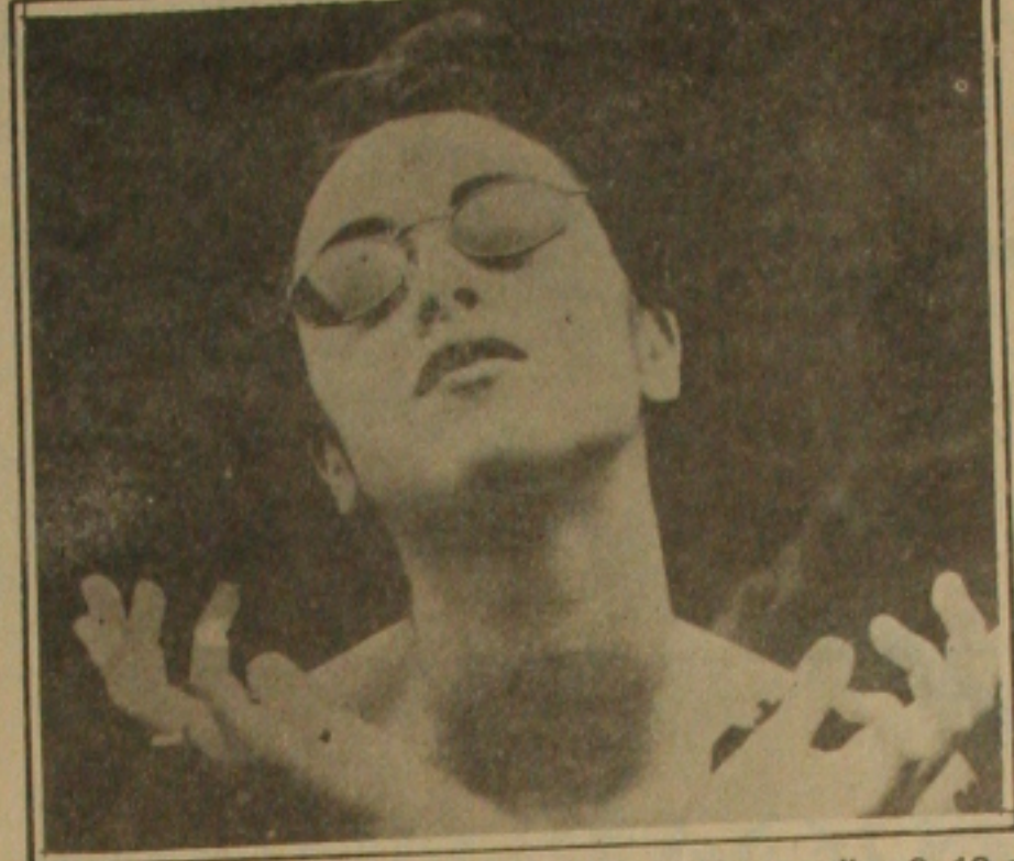
Marisa Monte. A cantora estará em Aracaju nos dias 9, 10 e 11 de janeiro.

Hoje também é o aniversário de fundação da cidade de Natal, do Rio Grande do Norte, em 1599, por Jerônimo de Albuquerque, tendo como núcleo o Forte dos Reis Magos.