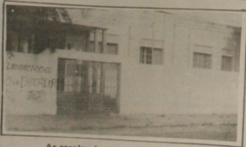
As escolas do município precisam de segurança

As escolas do município precisam de segurança públicas. Nos prédios das referidas escolas, apesar de contar com vigilante, as escolas não tem a mínima segurança, pois os vândalos destroem e roubam tudo, até os vasos sanitários. A Escola Sabino Ribeiro que fica situada no Bairro 18 do Forte é uma das vítimas da ação dos vândalos. Há bem pouco tempo a escola foi arrombada, documentos importantes foram estragados e até jogados nos vasos da escola, além disso vândalos trafegam nas cochilas sem serem molestados.