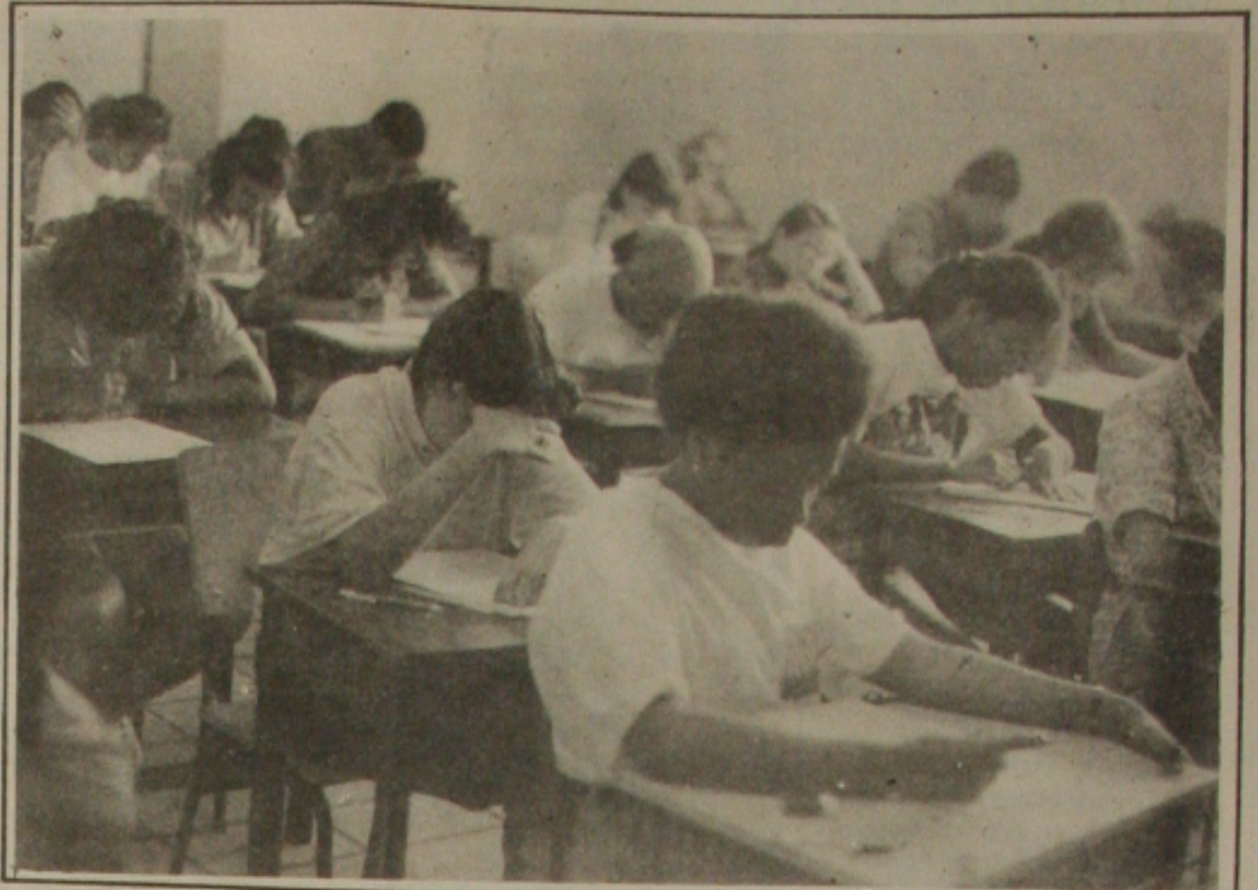
O vestibular da UFS termina hoje com duas provas - química e história (Foto: Fernando Sitva).

Dos candidatos inscritos no curso de direito, 379 foram eliminados na prova de Português, ficando disputando as 40 vagas oferecidas 874 candidatos. No curso de medicina 217 candidatos foram eliminados na prova de Português ficando disputando 1.013 candidatos e em Contábeis foram eliminados 340 candidatos e permaneceu disputando 508 candidatos.