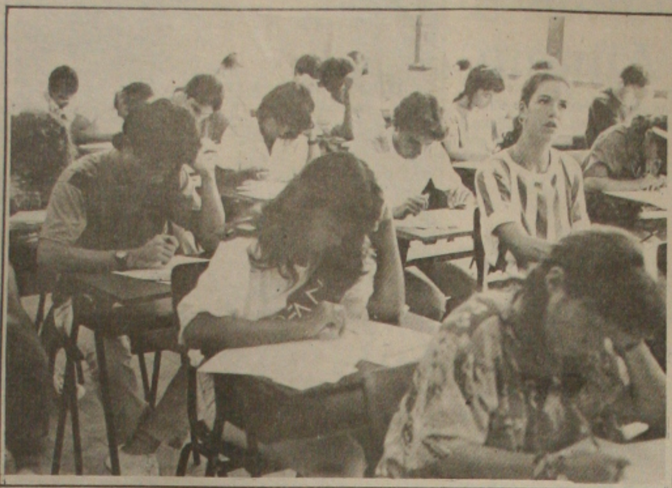
A UFS divulga resultado do Vestibular amanhã, a partir das 15 horas.