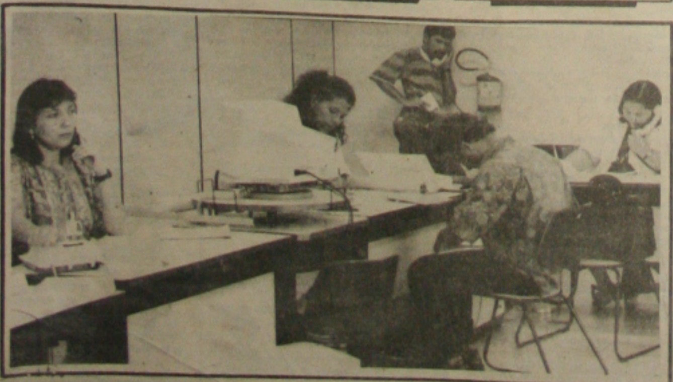
Ontem, depois de 16 dias parados, os eletricitários voltaram a trabalhar normalmente