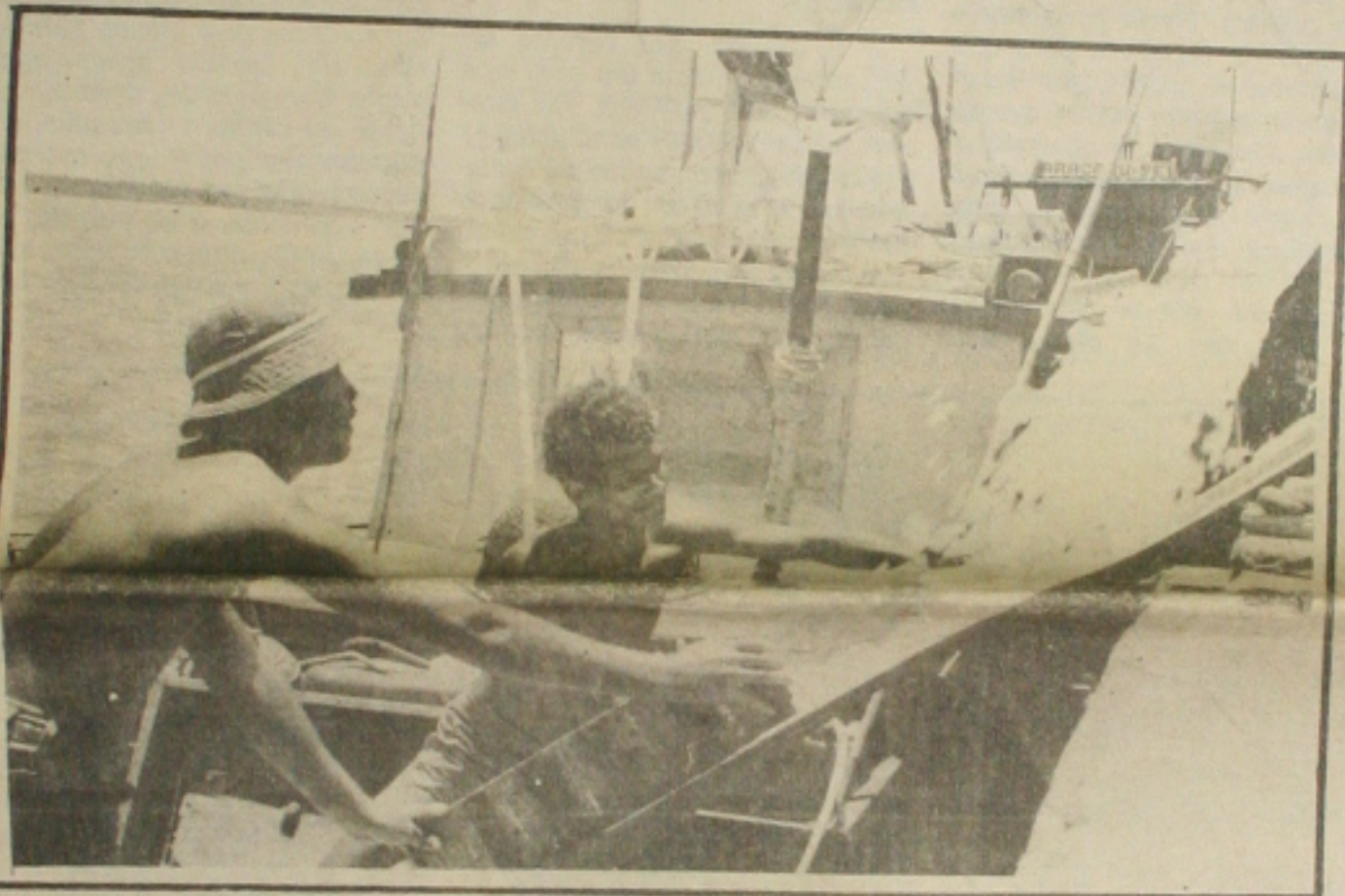
Os pescadores têm reclamado das dificuldades e da falta de incentivo dos órgãos públicos

Os servidores públicos estaduais, inclusive os policiais civis, agentes penitenciários e pessoal da área de Saúde, estão em greve desde a meia noite de ontem em protesto contra a política salarial do Governo do Estado, que prevê a concessão de abonos e o reajuste somente a cada quatro meses. Ontem, as lideranças do movimento passaram a discutir as repartições para mobilizar a categoria. Uma nova assembleia unificada já está marcada para as 14 horas da próxima segunda-feira. Ontem, os eletricitários, que paralisaram as atividades por 16 dias, voltaram a trabalhar, depois de fecharem acordo com a direção da Energipe durante reunião de conciliação no Tribunal Regional do Trabalho. (Página 5A)