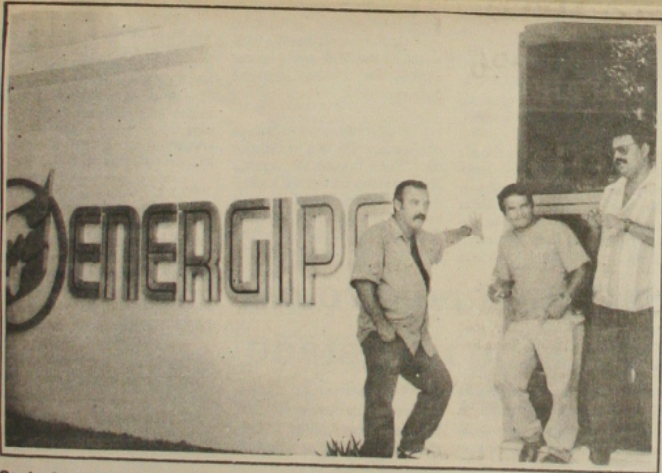
Os eletricitários retornaram ao trabalho e começam a regulamentar os serviços em atraso.

do presidente da Cipa através de uma lista tríplice eleita pelos integrantes da Comissão e assegurada ainda a participação nos lucros conforme acordo anterior, itens ameaçados de extinção pela proposta inicial da diretoria da Energipe.