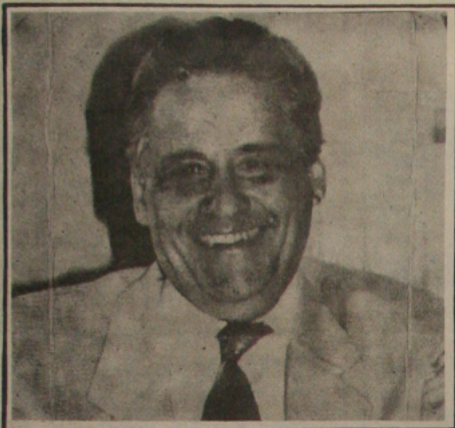
Cardoso vai ao Congresso e ganha apoio

Nomes constam dos relatórios das quatro subcomissões da CPI do Orçamento