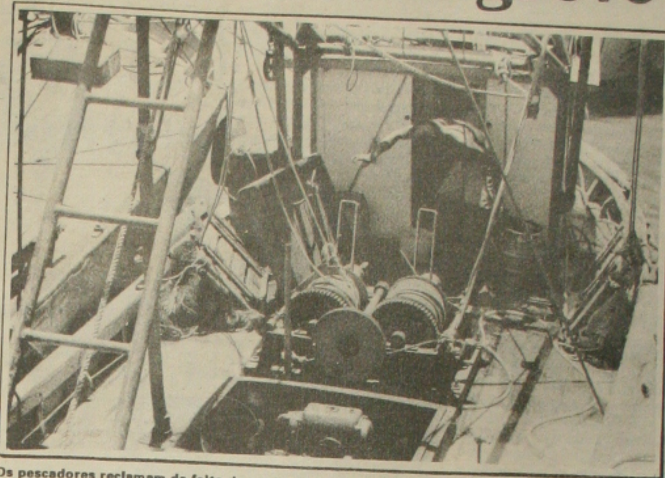
Os pescadores reclamam da falta de apoio dos governantes para desenvolver às atividades.