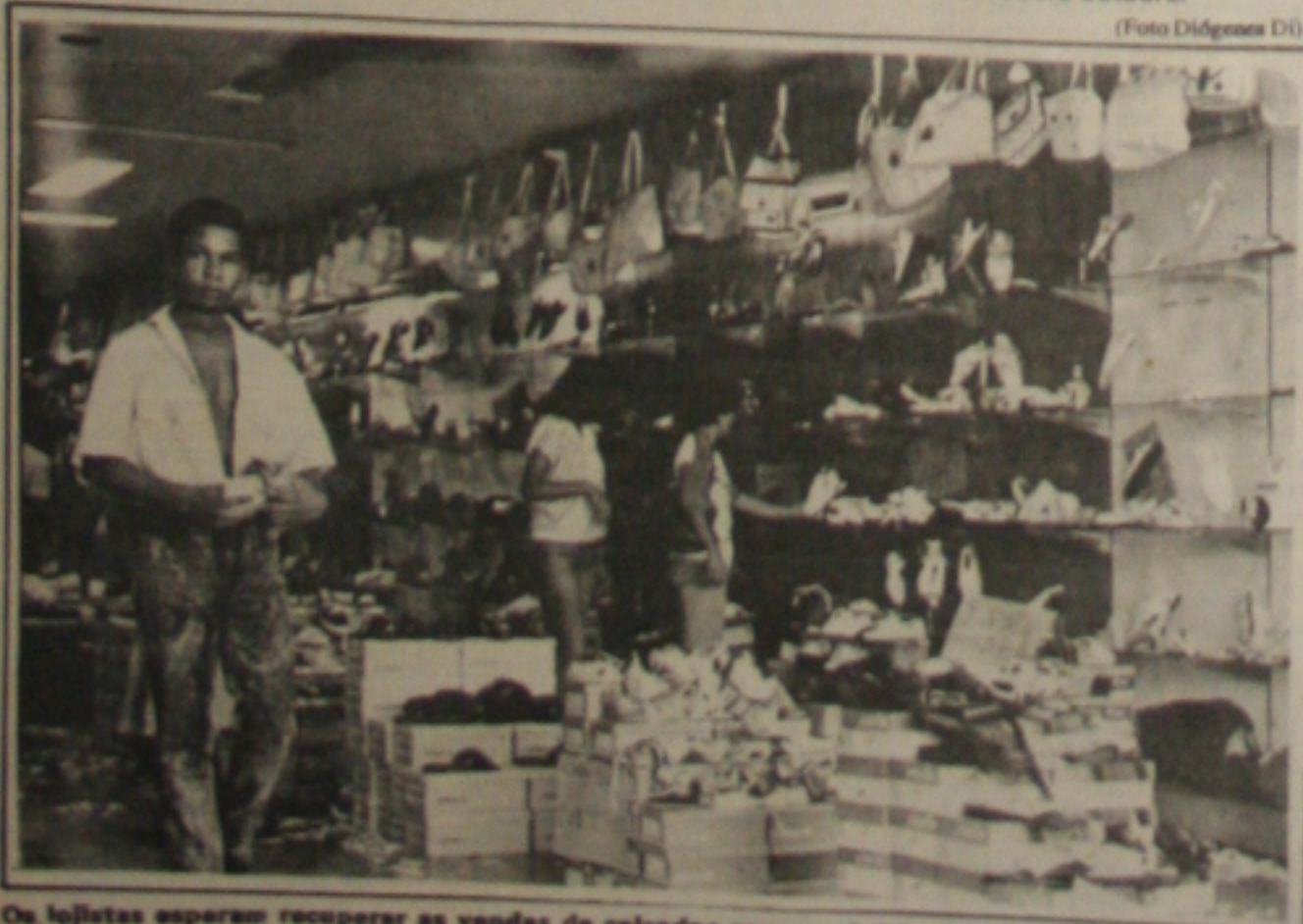
Os lojistas esperam recuperar as vendas de calçados com o início das aulas.

lativa, deputado Reinaldo Moura (PFL), convocou soldados da Polícia Militar para evacuar as galerias. Os funcionários saíram sob protestos mas não foi necessário o uso da força militar. Das 26 emendas apresentadas pelos parlamentares, somente uma foi aprovada, a que obriga o Governo do Estado a fornecer vale-transporte aos servidores. (Página 3A).