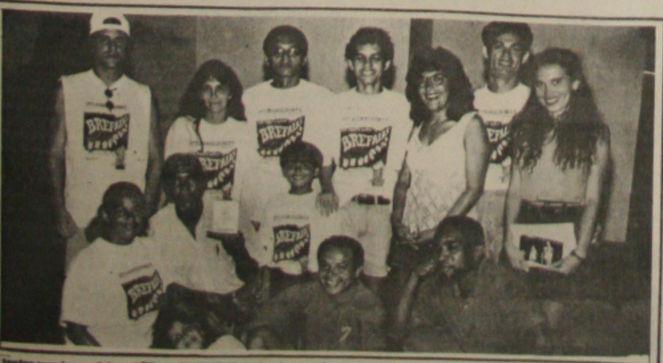
O teatro sergipano foi premiado no festival realizado na Paraíba.

"Brefalás" tem direção de Mariano Ferreira e texto de Agilê F. Alencar e estará no Teatro Atheneu dia 04 de fevereiro, às 21 horas.