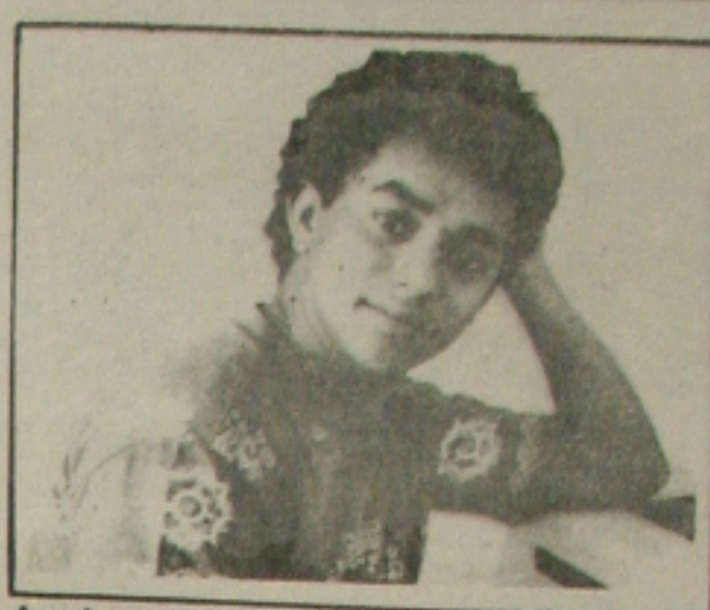
Araripe vai lançar um novo livro