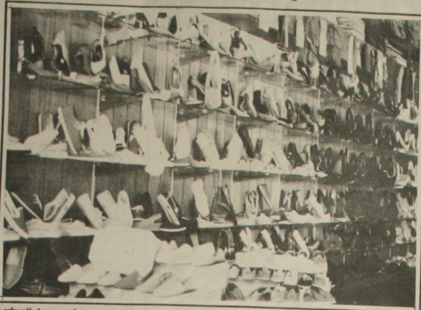
A crise aliada a recessão provocou redução nas vendas de calçados.