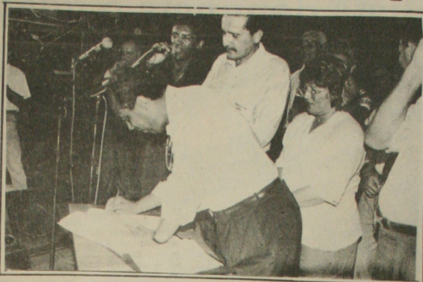
Governador inaugura obras e desmente telefonemas para empreiteiras.

Enumerando suas obras, João Alves Filho voltou a destacar a construção do Porto, do Polo Cloroquímico, de cinco Distritos Industriais, implantação da maior sede de adutoras do Nordeste e do Platô de Neópolis. Também foi enfático ao citar o que vem fazendo na área de turismo "indústria sem chaminé que mais cresce no mundo e mais gera empregos", afirmando que graças as ações do seu Governo neste setor, os hotéis de Aracaju estão completamente lotados, o que traz mais empregos para um grande número de sergipianos, acrescentando que os benefícios provocados pela chegada dos turistas em territórios sergipianos serão ampliados, em breve, com a inauguração da Linha Verde em Sergipe, o que deverá ocorrer dentro de 20 dias, obra que tomará realidade após vencer o grande desafio de ampliar o Aeroporto de Aracaju.