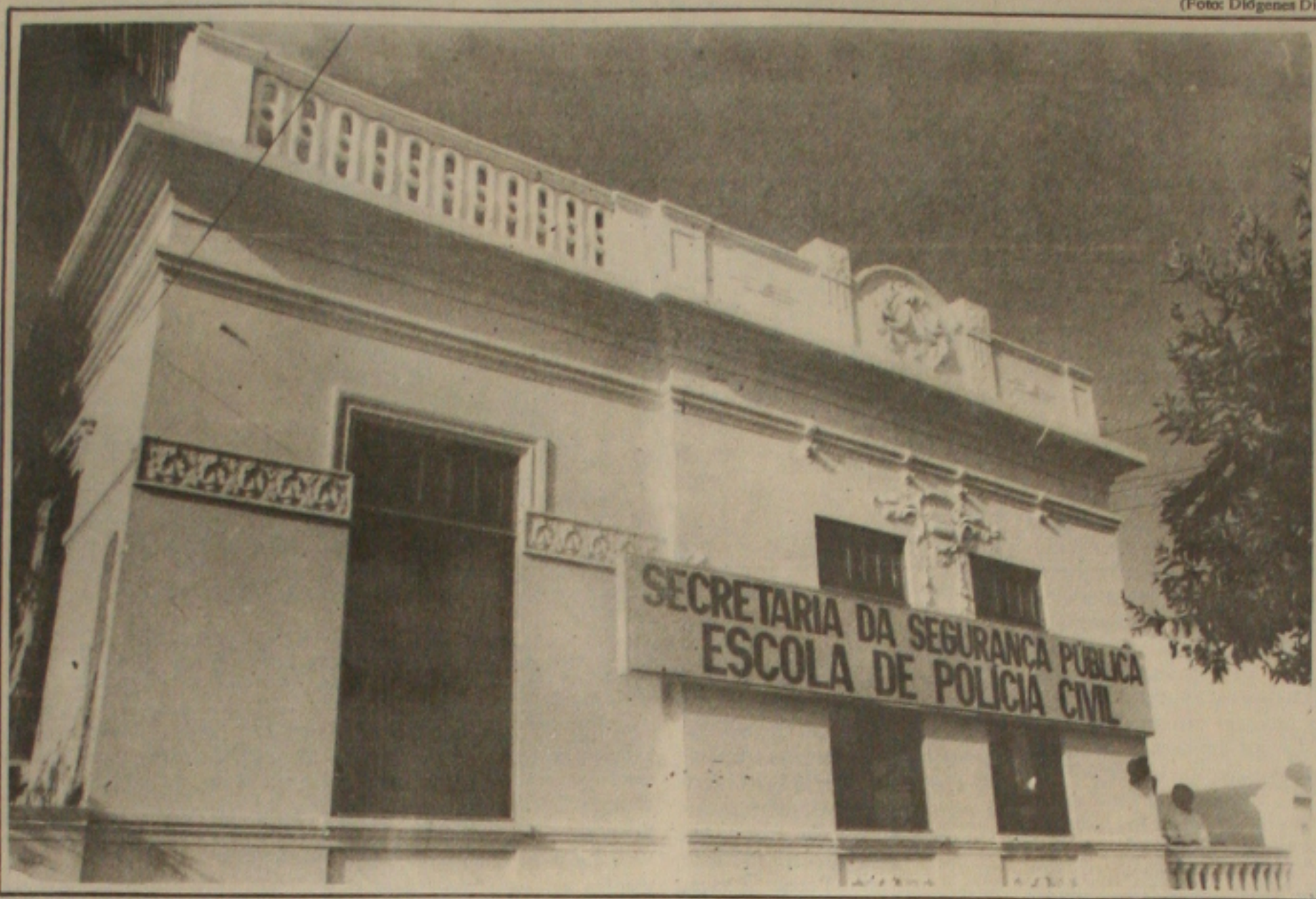
A Escola de Polícia Civil é classificada como elefante branco

As instalações físicas das Delegacias de Polícia são consideradas razoáveis, mas os policiais que exercem devidamente a função durante cada plantão passam por sérias humilhações. As condições de alojamentos são precárias. Os colchonetes estão estragados provocando transtornos nas acomodações. Os policiais são obrigados a fazer reve-