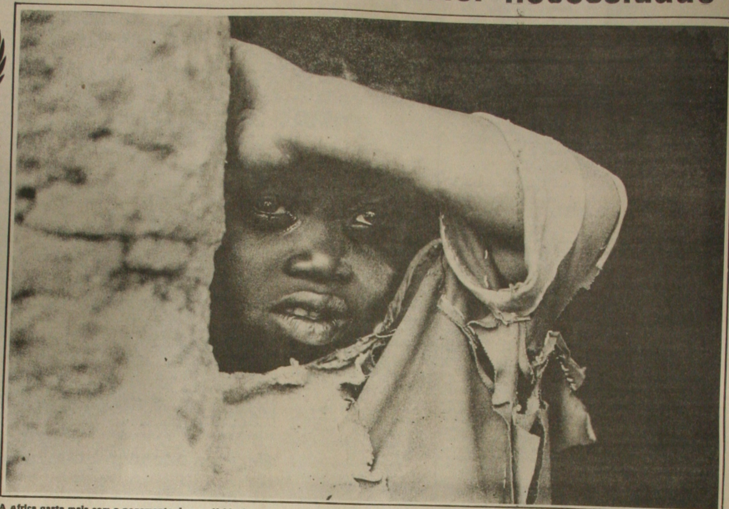
A África gasta mais com o pagamento de sua dívida do que em seus serviços de saúde e educação. O continente está sendo explorado em seu momento de maior necessidade.

países por tantas décadas, a África ao sul do Saara foi também devastada por forças pelas quais o resto do mundo fecididamente também é responsável.