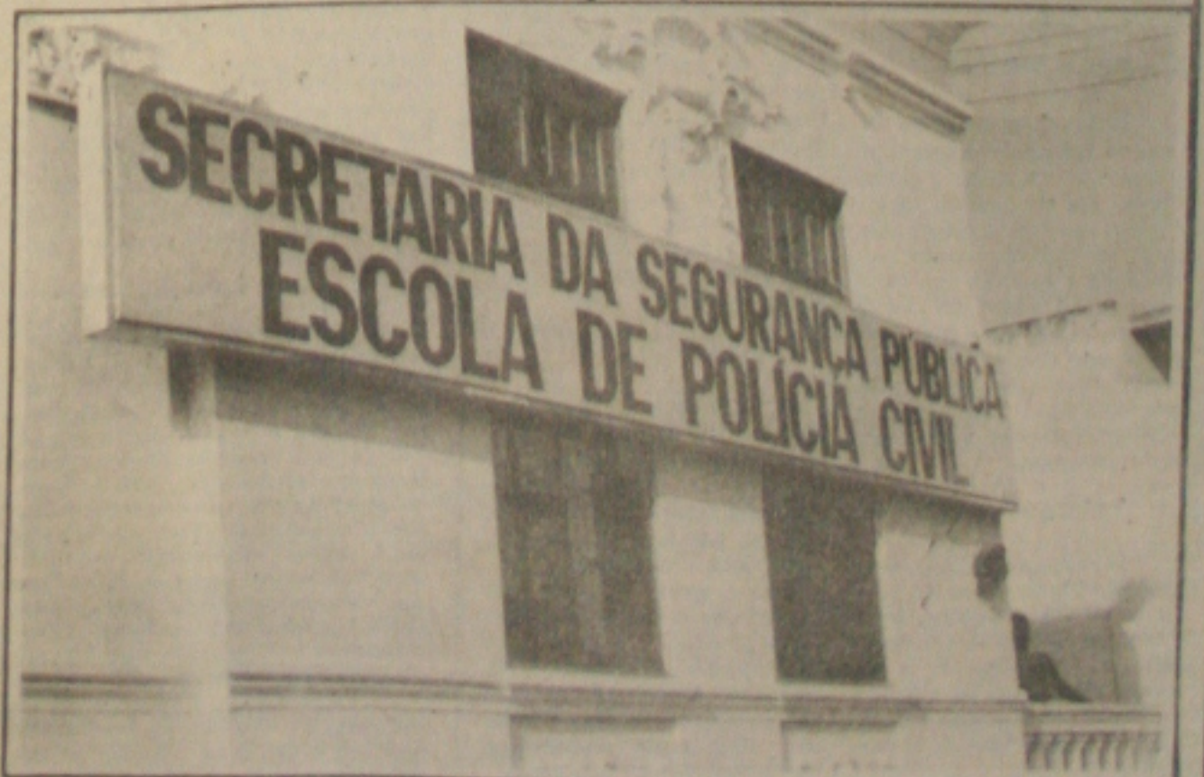
A Escola de Polícia, segundo o sindicalista, até agora não funcionou