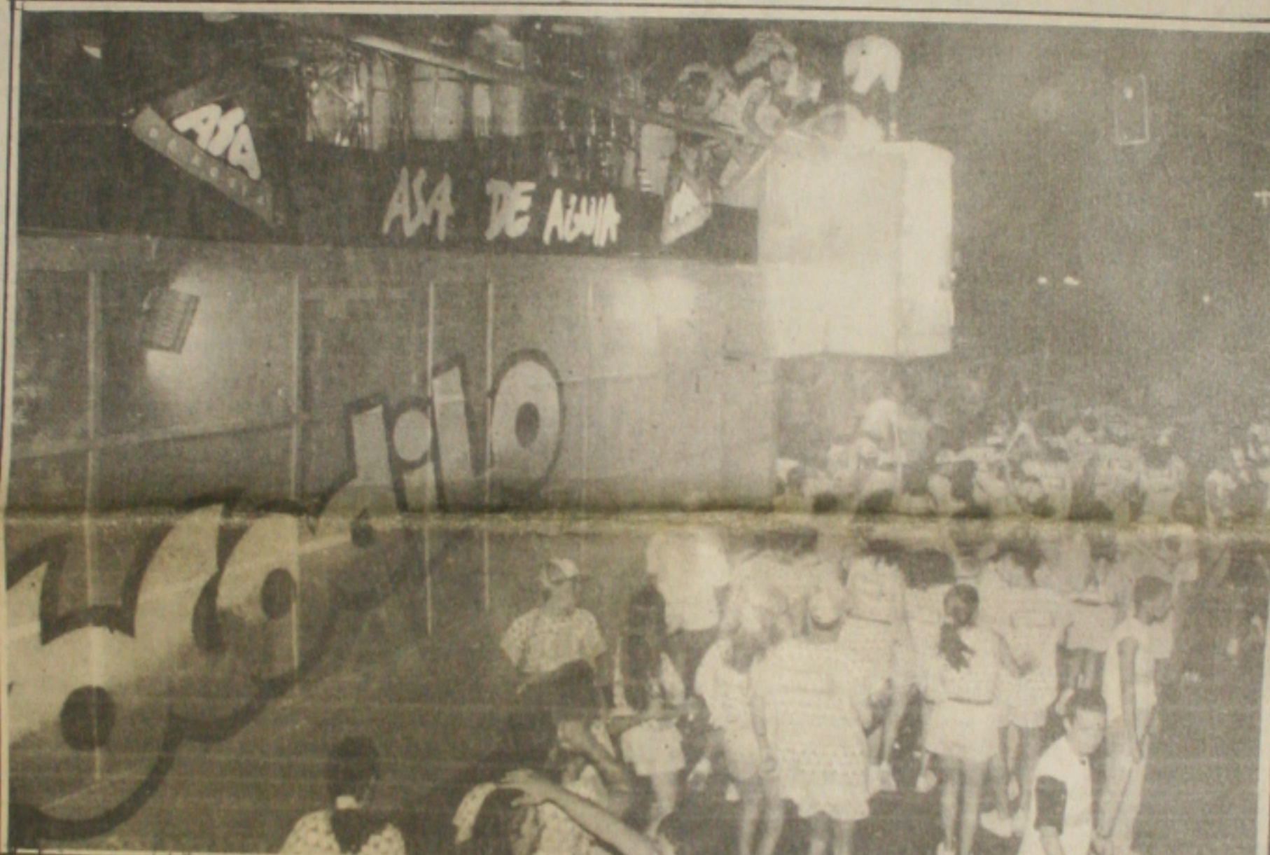
O Pré-Caju atrai milhares de pessoas desde sexta-feira à avenida Barão de Marujm