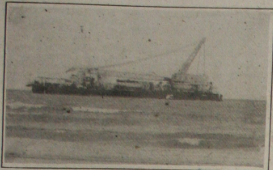
A barça trabalha desde sábado em Sergipe.