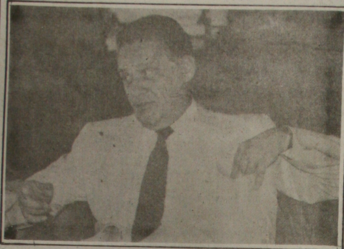
Fernando Henrique gravou seu pronunciamento no Palácio do Planalto

BRASÍLIA - Às vésperas da votação da emenda constitucional com o Fundo Social de Emergência, destinada a equilibrar as contas do Governo, o ministro da Fazenda, Fernando Henrique Cardoso, fez um pronunciamento em cadeia de rádio e TV, ontem à noite, cobrando uma decisão do Congresso e insinuando que poderá deixar o Governo caso sua proposta seja recusada. Enfático, o ministro afirmou ter chegado "ao limite do possível", e criticou a resistência do "Congresso e outros setores" as medidas necessárias para atacar a inflação.