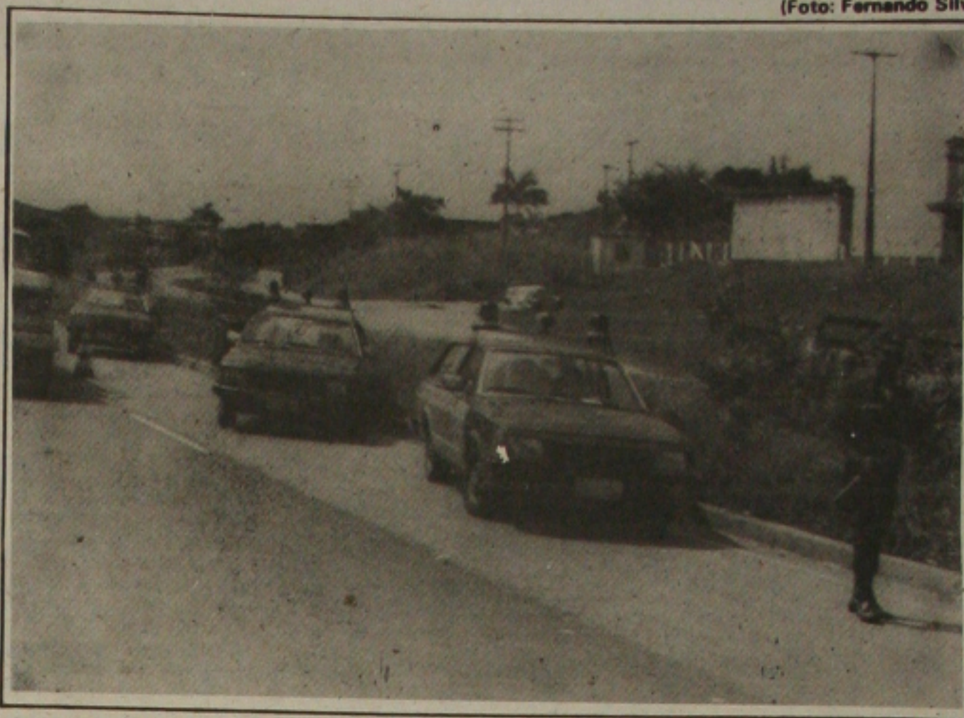
Os patrulheiros colocam seu bloco nas rodovias federais na sexta-feira

Começa na sexta-feira, às 8 horas, a Operação Carnaval, da Polícia Rodoviária Federal nas BR's 101 e 235. A operação tem como finalidade reduzir o número de acidentes durante o período carnavalesco, quando é grande o fluxo de veículos nas rodovias.