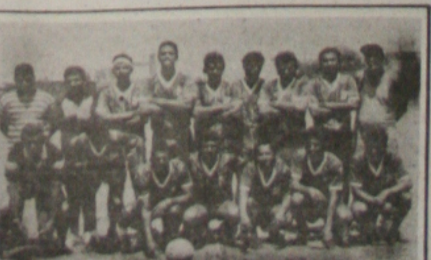
Disk-Táxi campeã da Fugase

Após esta perdendo o jogo por 2 X 1, o time da Disk soube levar o jogo para um belo empate, arrancando na barra e na técnica de seus jogadores. Levando assim o