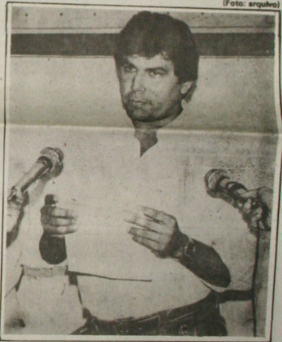
Samarone: é uma intervenção absurda do TST