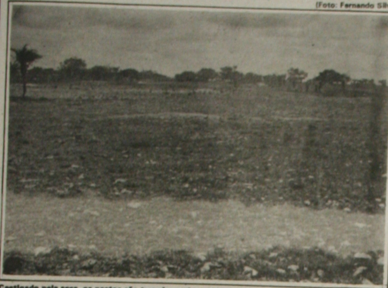
Castigado pela seca, os pastos são transformados em imenso deserto em pleno sertão.

A estiagem está dizimando o rebanho no semi-árido sergipano. A falta de pastagem na região está gerando grandes transtornos e os pecuaristas são obrigados a vender o gado pela metade do preço como forma de evitar prejuízos.