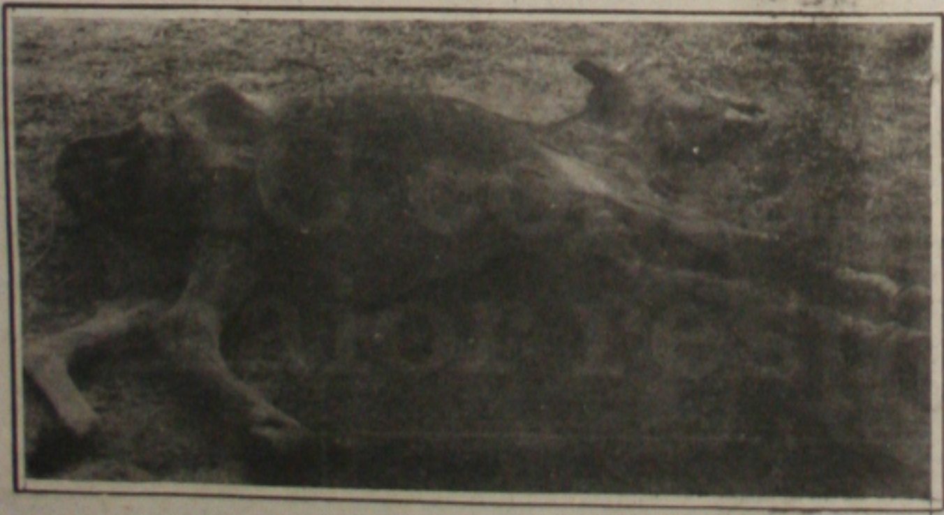
Com a seca, o gado está morrendo de fome.

"Só espero que o deputado não seja covarde, não se esconda atrás de sua imunidade parlamentar para fugir da interpeleção", disse o governador, ao deixar o prédio do STF, em Brasília.