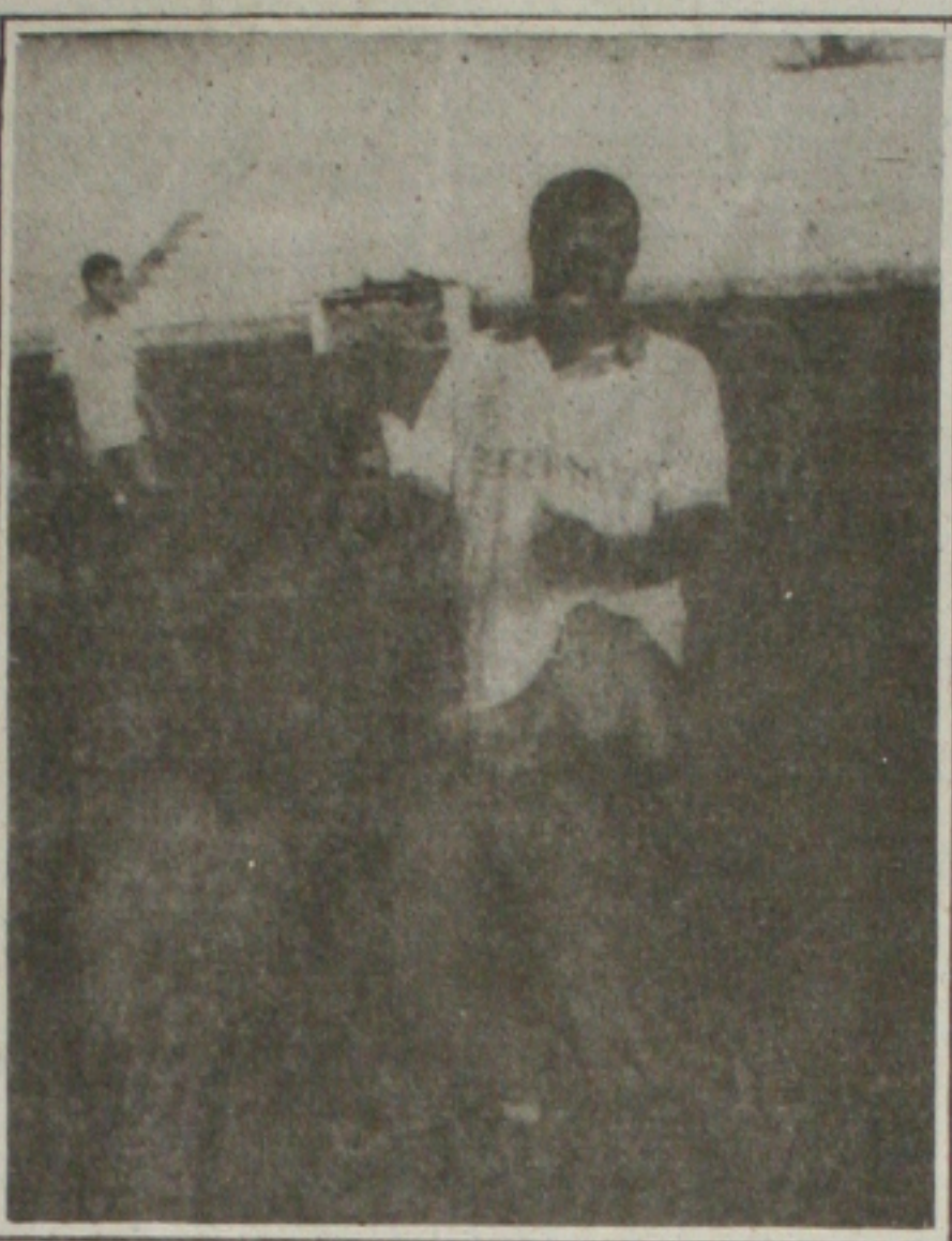
Rocha comandou a meninada na Pajuçara

Aos poucos os dirigentes rubros vão definindo a equipe para o início do campeonato. As contratações estão sendo feitas lentamente, mas de forma responsável e dentro do limite financeiro da equipe. Até o início do campeonato, o time rubro deve apresentar mais duas contratações e resolver os contratos de todos os profissionais.