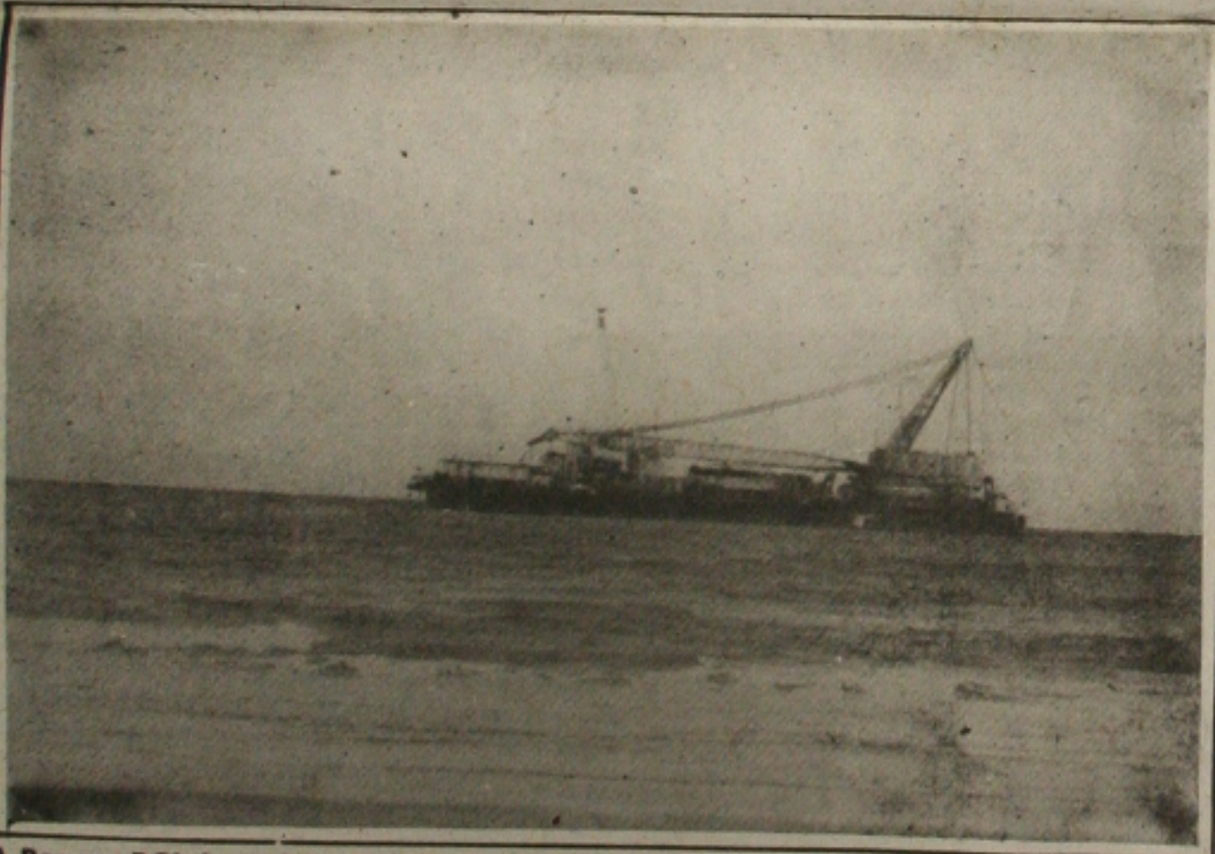
A Barcaça BGL 1 conclui as obras do gasoduto do Tecarmo a Plataforma de Camorim.

gás pobre (gás extraído do gás natural com teor de metano superior a 80%) em poços das plataformas PCML e PCM 2 , de forma a elevar a produção de petróleo e gás rico (gás natural) naquelas plataformas. Com a execução deste projeto serão injetados 250 metros cúbicos de gás por dia durante 10 anos, em Camorim, proporcionando um aumento de produção de petróleo de 700 mil barris ao longo dos 10 anos. Esse projeto é piloto e alcançará apenas 5% do total de óleo contido em Camorim. Caso seja bem-sucedido, será estendido. Deverá a construção do gasoduto que é uma tubulação de aço que conduz o gás - proporcionando uma receita adicional de US$ 26 milhões no período.