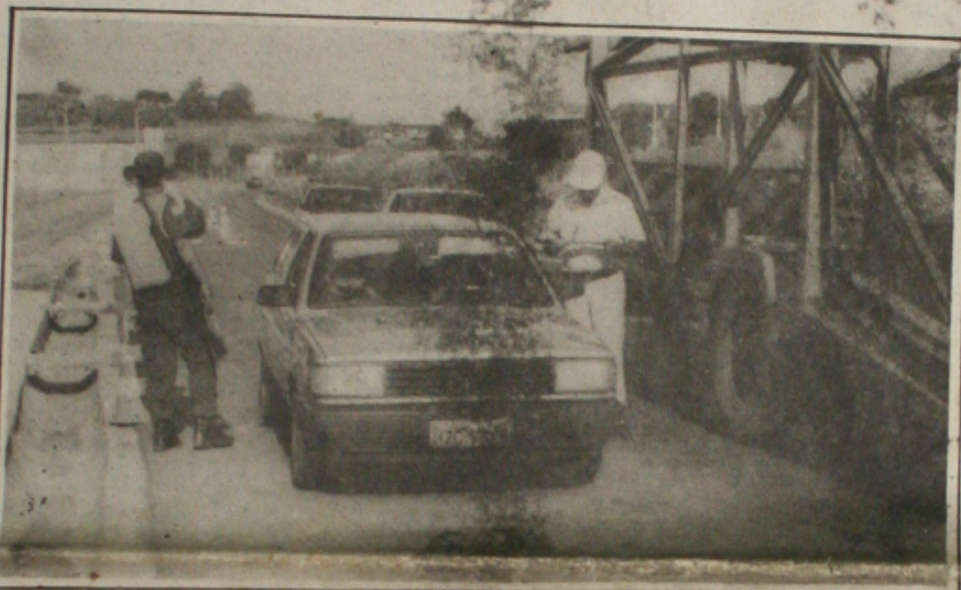
A partir de sexta-feira, os patrulheiros estão a postos em vários trechos das BRs 101 e 235.