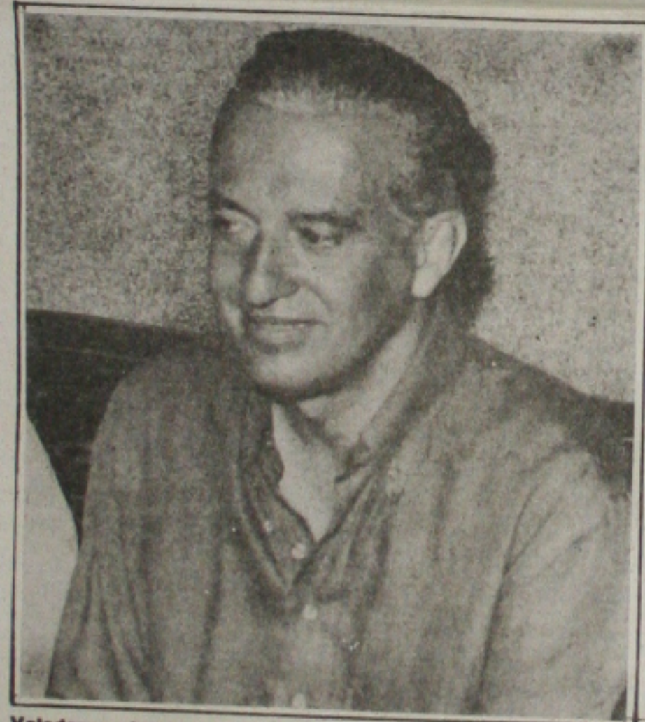
Valadares adverte que o povo é quem manda em Sergipe.

Antônio Carlos Valadares acusou o governador João Alves Filho de querer ser o dono de Sergipe, esquecendo que o Estado pertence ao povo.