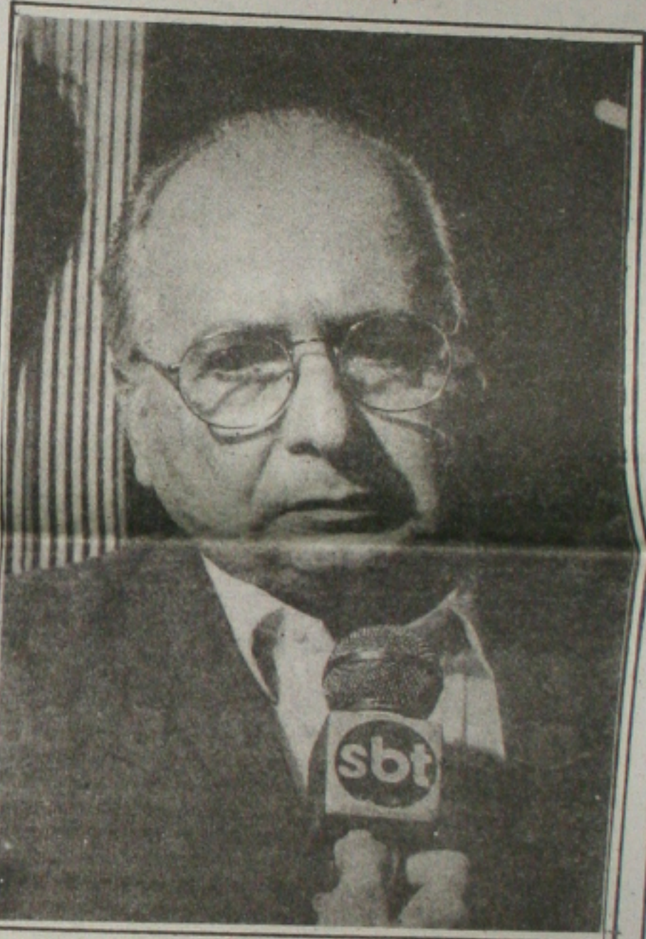
Rollemborg defende que os políticos conheçam pobreza.

disputará nas eleições de 94, pois tudo dependerá do que decidirá o bloco político em que se encontra.