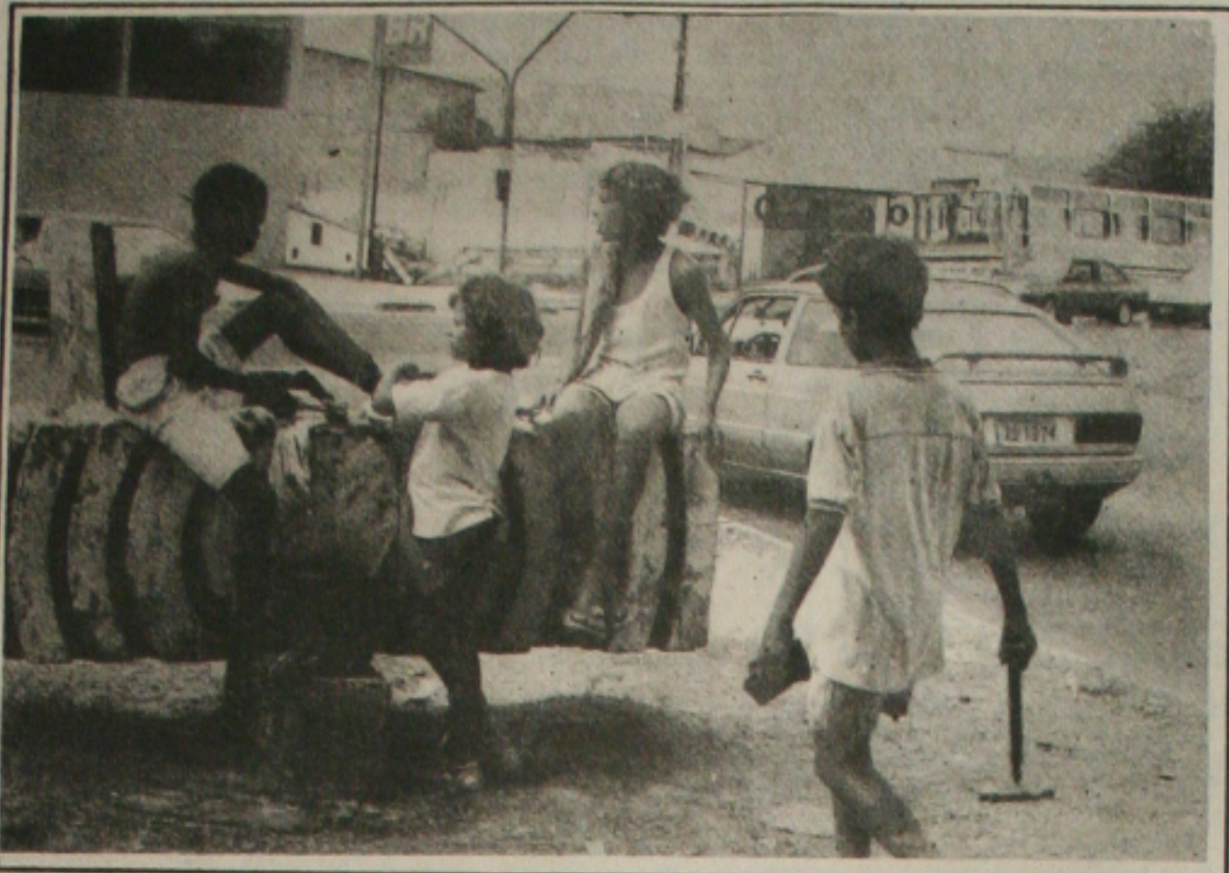
A Prefeitura de Aracaju vai discutir a violência urbana contra crianças e adolescentes.

Os resultados da Portaria assinada pelo superintendente há um mês já se fazem sentir e são os seguintes: redução de comprometimento de recursos de US$ 180 milhões decorrentes de 55 projetos passíveis de caducidade; prorrogação, pelo prazo de um ano, da alocação de recursos de US$ 289 milhões, resultantes de 43 projetos integrantes do sistema; exclusão de apreciação, pelo Conselho, de 15 projetos, reduzindo em mais US$ 86 milhões as pressões de demanda sobre o Finor.