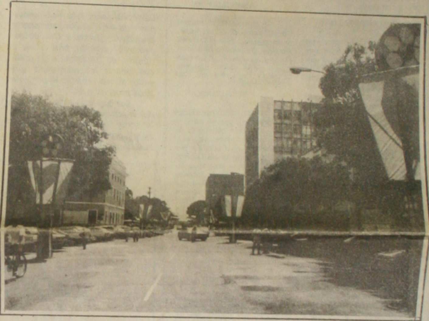
O Clube do Povo recebe hoje os últimos retoques para ser o palco de mais um Carnaval

serão destinados para pagar os inativos e pensionistas da União. Outros US$ 6 bilhões, segundo o Ministro da Fazenda, Fernando Henrique Cardoso, financiarão despesas nas áreas de saúde e previdência. Aos Ministérios militares, da Educação e da Fazenda também está reservada boa parte das verbas do FSE. (Página 4B).