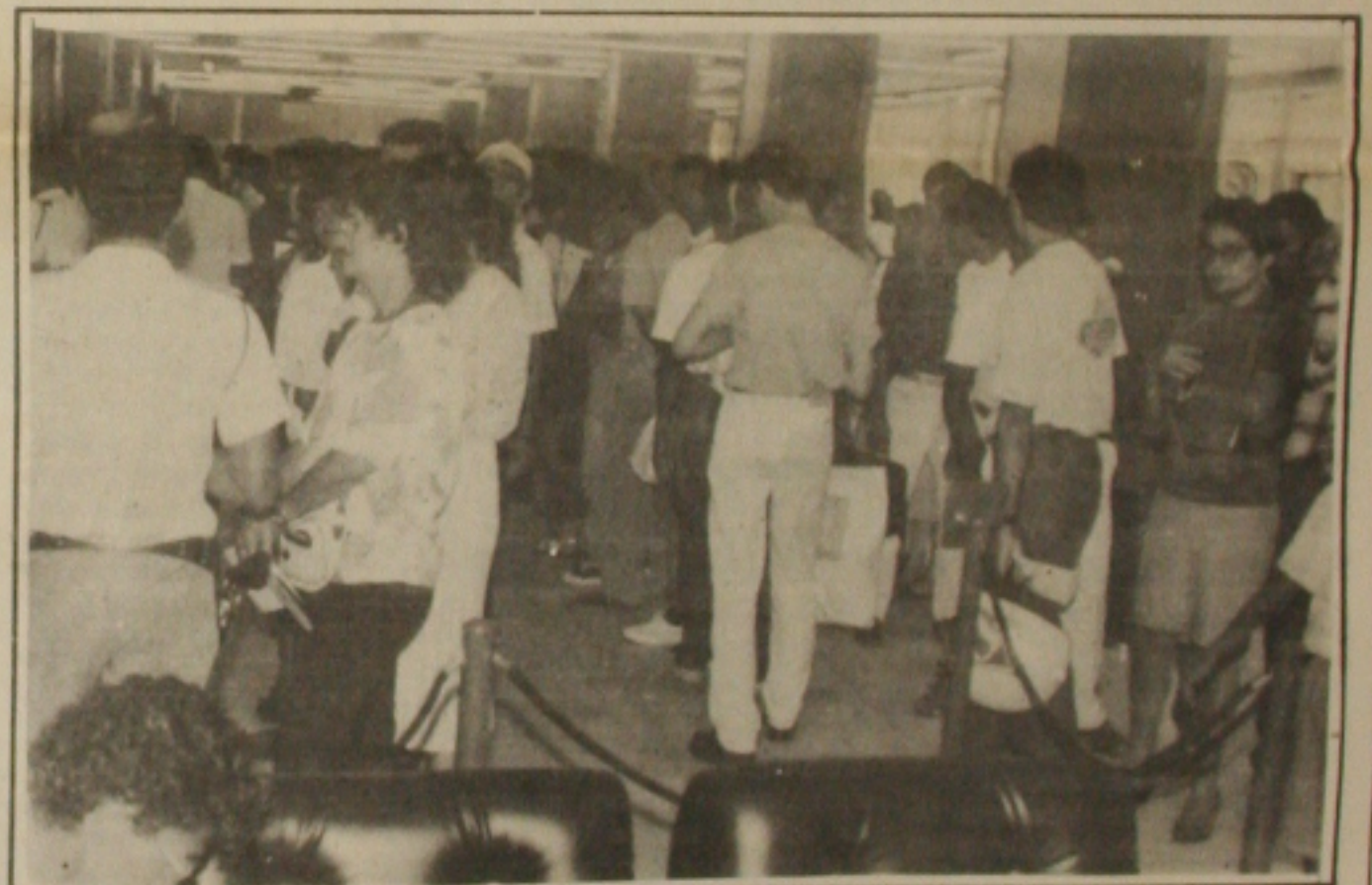
Os bancos fecham hoje, às 16 horas, e só reabrem na quarta-feira de cinzas, ao meio-dia.

Em Sergipe, a Aids já matou 87 pessoas dos 134 casos registrados pela Secretaria de Estado da Saúde desde o ano de 1987. A doença tem se manifestado entre pessoas de faixa etária entre os 22 aos 35 anos incluindo bissexuais, heterossexuais, homossexuais, mulheres e crianças que já nasceram com o vírus.