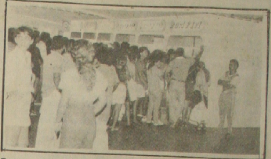
Grandes filas se formaram ontem em frente aos guichês das empresas de ônibus no Terminal Rodoviário

O dia hoje deve ser de grandes filas na maioria das agências bancárias de Aracaju que funcionam normalmente das 10 às 16 horas e somente voltam a abrir a partir do meio dia da Quarta-feira de Cinzas, em plena ressaca do Carnaval. Por causa da expectativa de movimento intenso, alguns bancos prepararam esquemas especiais, com o deslocamento de funcionários de setores burocráticos para o atendimento direto ao público. Ontem, no Terminal Rodoviário Governador José Rollemberg Leite, cresceu consideravelmente a procura por passagens nos guichês das empresas, principalmente para Salvador (BA). (Página 6A).