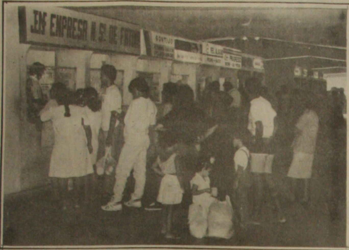
O Terminal Rodoviário José Rollemberg Leite esteve movimentado durante todo o dia de ontem.

É intenso o movimento no Terminal Rodoviário Governador José Rollemberg Leite. Quem deixar para comprar passagens de última hora está sujeito a não encontrar vaga nos ônibus, principalmente se o local escolhido for a capital baiana para onde o fluxo é bem maior.