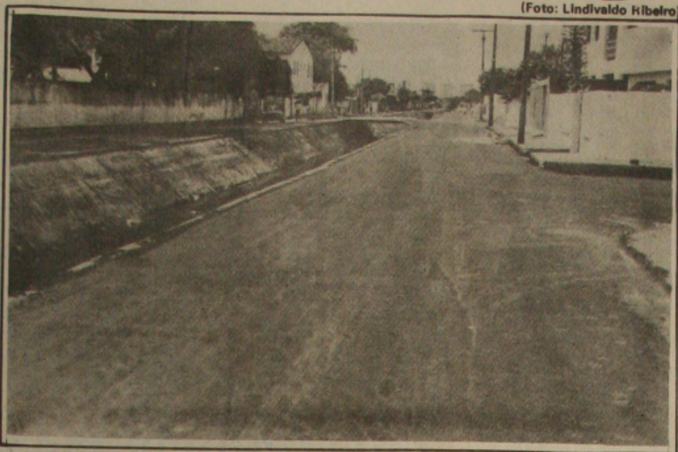
Prefeitura de Aracaju recupera a Avenida Alan Kardec

Para março estão programados dois debates no dia três e outro no dia 18. O primeiro debate vai tratar sobre a questão da moradia, principalmente dos moradores e vilas, na ocasião será discutido uma forma de juntos pleitearem um programa de moradia tendo em vista as dificuldades financeiras.