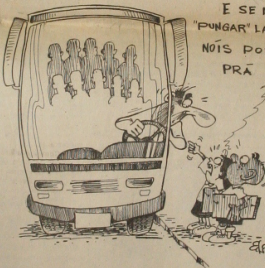
MEIORES DE 12 ANOS SEM DIREITO A ÔNIBUS..

E SE NÓS "PUNGAR" LÁ ATRÁIS NÓS PODE IR PRÁ ESCOLA?!!