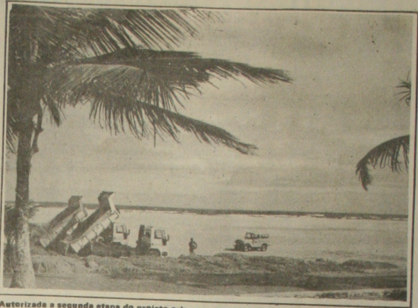
Autorizada a segunda etapa do projeto orla, que mudará a visão da Praia de Atalaia.

Com relação ao Calçadão da Atalaia, a recuperação que será feita pela Cehop praticamente mudará inteiramente seu atual perfil. Nos seus 400 metros de extensão serão implantados novos quiosques, parque infantil, quadras de voleibol, quadras polivalentes, campos de futebol soquete, quadra de tênis de campo, nova iluminação, chuveiros e sanitários. O revestimento será feito todo em pedra portuguesa e todas as ruas perpendiculares que dão acesso ao Calçadão também serão pavimentadas.