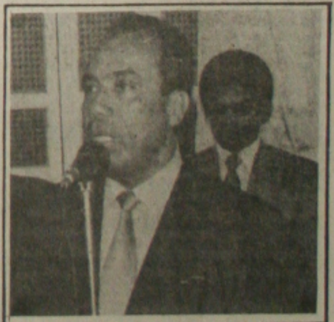
Governador João Alves Filho decreta ponto facultativo.

Tudo isso e muito mais estará na Gazetinha, domingo, resultado da conversa que tive com o Prefeito Jackson Barreto.