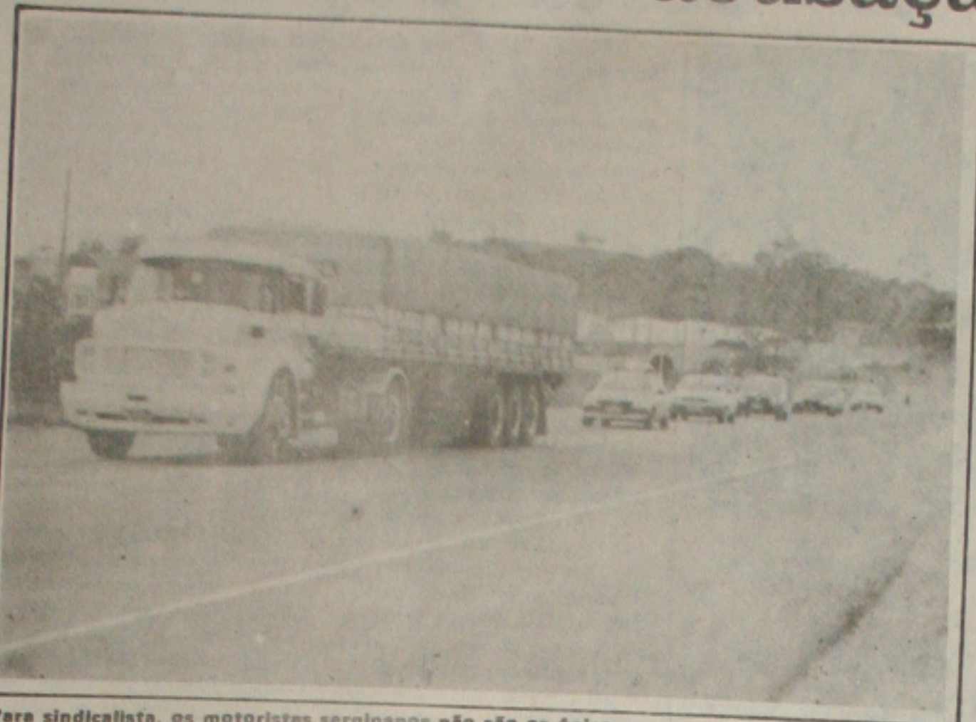
Para sindicalista, os motoristas sergipanos não são os únicos responsáveis por acidentes.

A chegada de cargas por via rodoviária será feita pela estrada de 22 quilômetros de extensão que liga o porto à BR-101. Para a capital, a ligação também pode ser feita pela estrada para a Barra dos Coqueiros, atravessando depois o rio Sergipe por lanchas ou balsas, numa distância de 15 quilômetros. Segundo o presidente da Sergipos, o porto será responsável por viabilizar o Pólo Cloroquímico e a ZPE (Zona de Processamento de Exportação) que estão sendo implantadas ao lado do terminal. Para conseguir atrair empresas interessadas em usar o porto da Barra dos Coqueiros para o escoamento de sua produção, a Sergipos garante que vai praticar uma das menores tarifas do país. "Temos todas as condições para competir com a região", garante Sérgio Tavares. Para isso, ele conta com outra vantagem: a localização do porto. Para se ter uma idéia disso, o porto de Sergipe fica mais próximo do porto produtor de Petróleo, em Pernambuco, do que o porto de Recife.