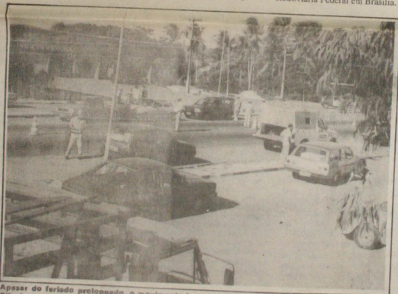
Apesar do feriado prolongado, o movimento intenso não provocou acidentes.