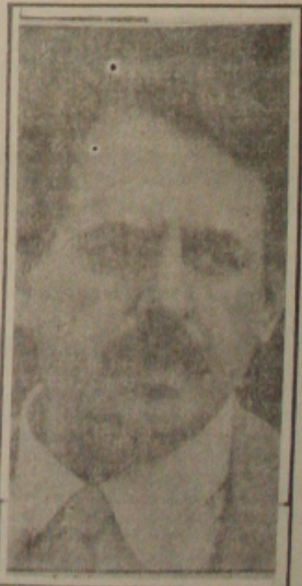
Jobim: nova fórmula

Mas se os detentores de cargos executivos disputarem outros cargos majoritários (de governadores para senador ou