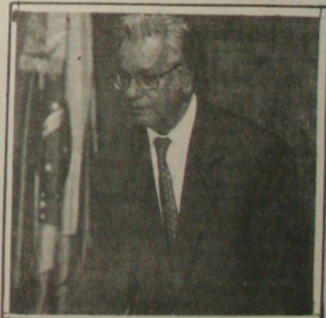
Presidente Itamar Franco.

Todo cidadão deve ter o seu direito inquestionável. E por que não o Itamar Franco, simplesmente porque ocupa o cargo de Presidente? Achei o episódio do encontro de Itamar com Lilian Ramos, algo natural, explorado é claro pelos que gostam de tumultuar e pelo falsos moralistas e pudicos de última hora, desejosos de fazerem média com os virtuosos deste País. Aqui para nós. Escândalo mesmo é que até agora só quem está preso nessa safadeza toda é o PC Farias, o José Carlos pronto. Escândalo mesmo é que ninguém falou de sequestro de bens dos deputados que serão caçados. Escândalo mesmo é o reduzido número de cassações. Itamar ser íntimo de uma modelo e não esconder, isso se chama autenticidade. Fato intolerável para os medíocres.