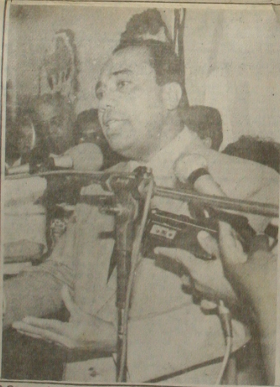
O Governador João Alves Filho participa da solenidade

As federações patronal e de trabalhadores integram-se ao programa através da orientação geral aos seus filiados e de apoio indústria de fiação e tecelagem, por seu turno, compromete-se a garantir a compra do algodão, mediante contrato a ser celebrado com cada produtor, com acréscimo de 20% sobre o custo mínimo de produção.