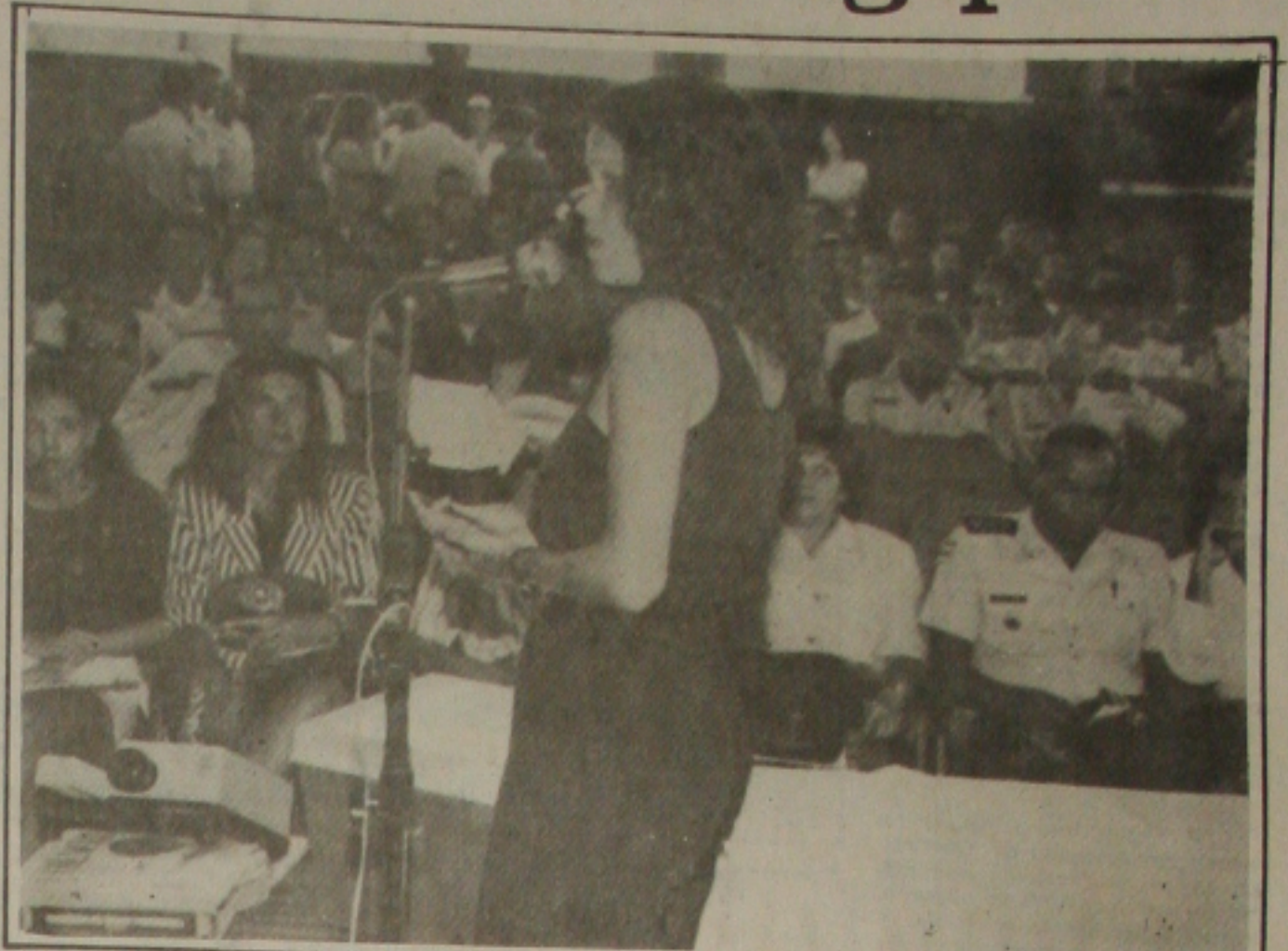
As palestras orientam os militares para aproximação com a sociedade sergipana.

Segundo Tadeu Cruz, a sociedade precisa valorizar mais o profissional de segurança pública como acontece com outras classes; o risco de vida no exercício da profissão é latente porque o crescente empobrecimento da população brasileira aumenta o número de ocorrências policiais e a principal dificuldade para desenvolver um bom trabalho é o reduzido efetivo de pessoal e viaturas que impede a instituição de ampliar as áreas onde a presença de seus integrantes é mais efetiva.