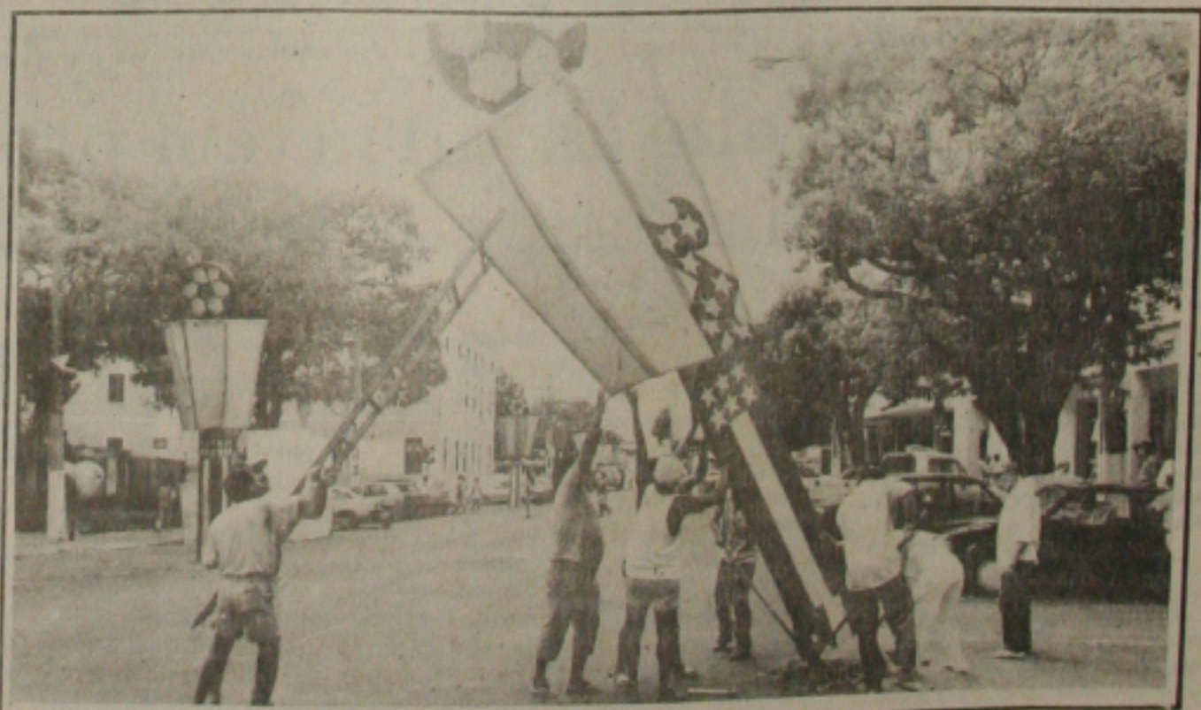
Os servidores da PMA retiram a decoração do Clube do Povo.

Para todos os organizadores do Carnaval aracajuano, a Prefeitura de Aracaju teve êxito com os festejos momescos, conseguindo contentar e contagiar os turistas que frequentaram os diversos espaços, com destaque para o Clube do Povo e a orla de Atalaia Velha.