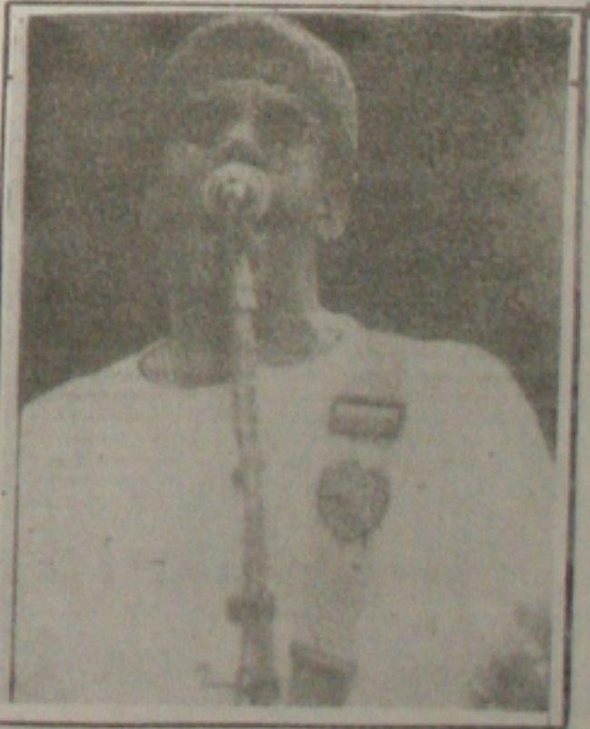
Jorge Ben Jor destaque maior nesta sexta-feira no Augustu's.

Artesão do Centro de Turismo estão reclamando da inexistência de divulgação sobre o artesanato sergipano. Reclamam das baixas vendas, por falta de uma promoção que atraia os turistas para aquele local.