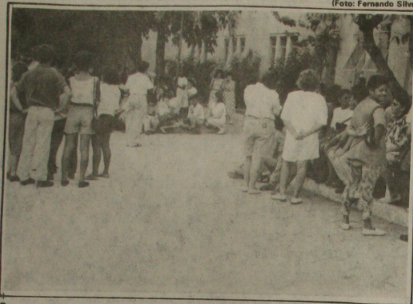
Em assembleia-geral, os servidores da Saúde suspenderam a greve de 35 dias.

Acaba hoje a greve dos servidores da área de saúde. A decisão foi tomada no início da noite de ontem durante assembleia geral realizada na porta do Hospital Adauto Botelho. A categoria se manteve dividida e, por 48 votos a favor, 36 contra, o fim do movimento grevista acabou saindo vitorioso apesar dos protestos de alguns sindicalistas.