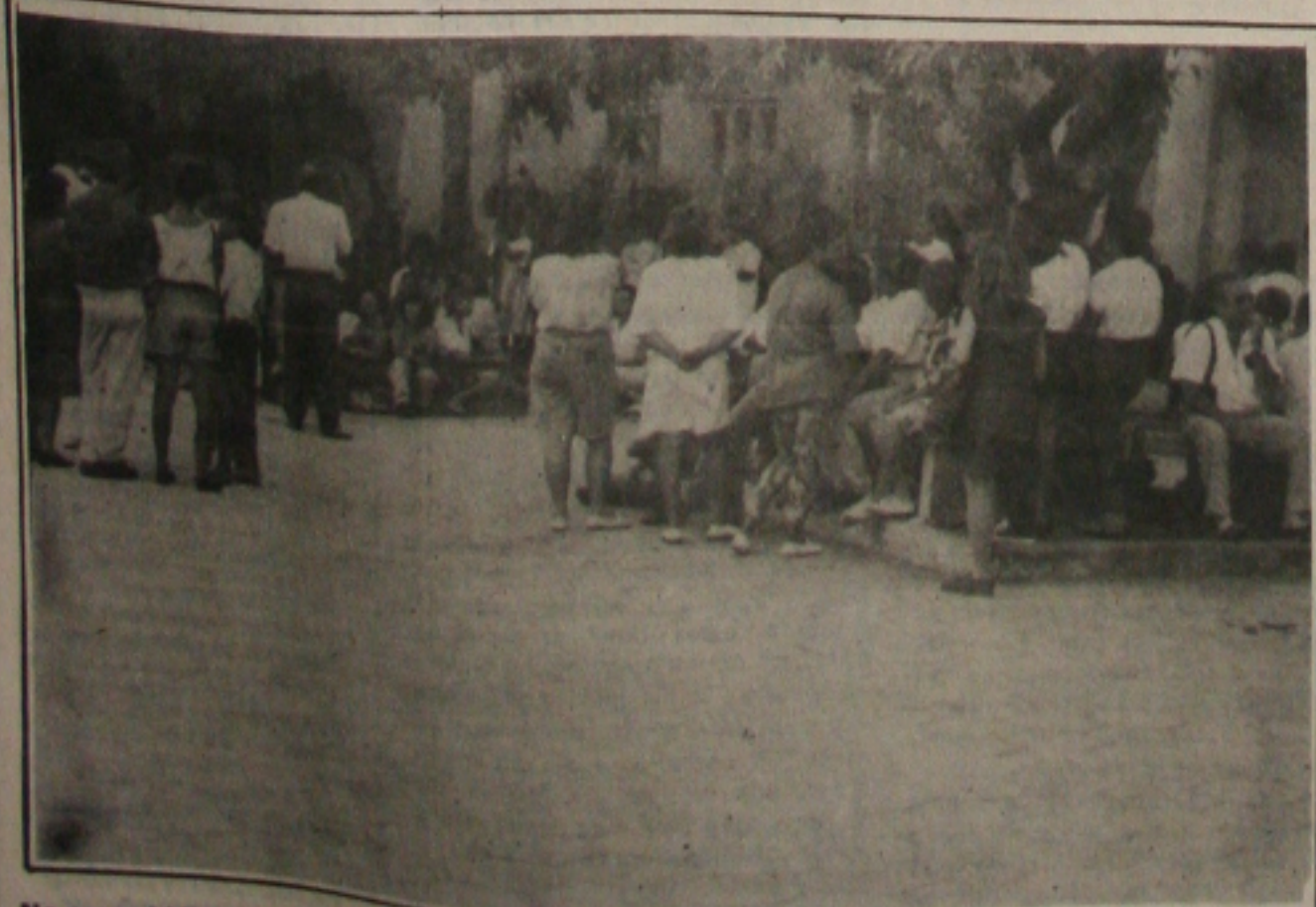
Na assembléia de ontem no Hospital Adauto Botelho, os servidores, em decisão apertada, resolveram pelo fim da greve.