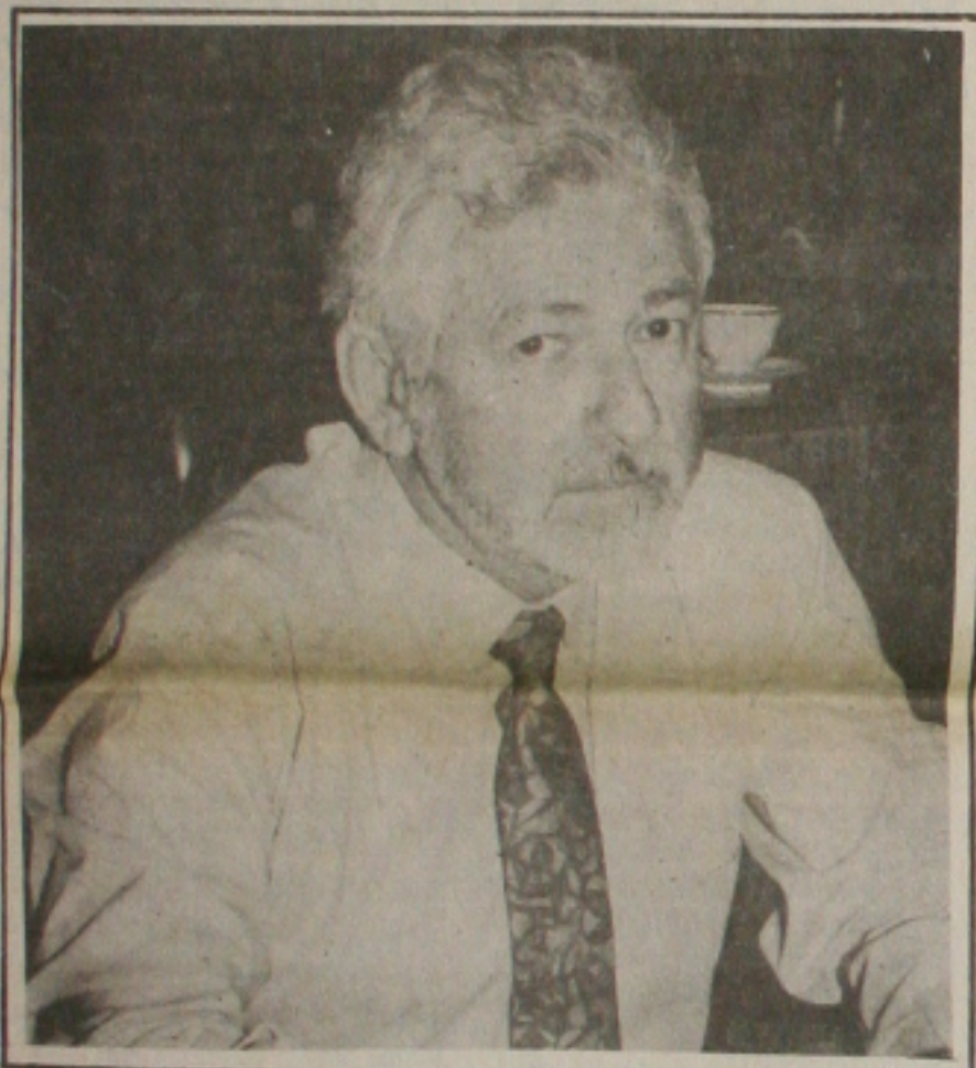
Jorge critica indicação precipitada de Machado para vice-governador.

Por outro lado, o vereador lembra ainda que estão sendo discutidos a nível de revisão Constitucional, proposta do relator que extingue o cargo de vice, proposta esta que o vereador se declara contrário e espera que não seja aprovada no Congresso.