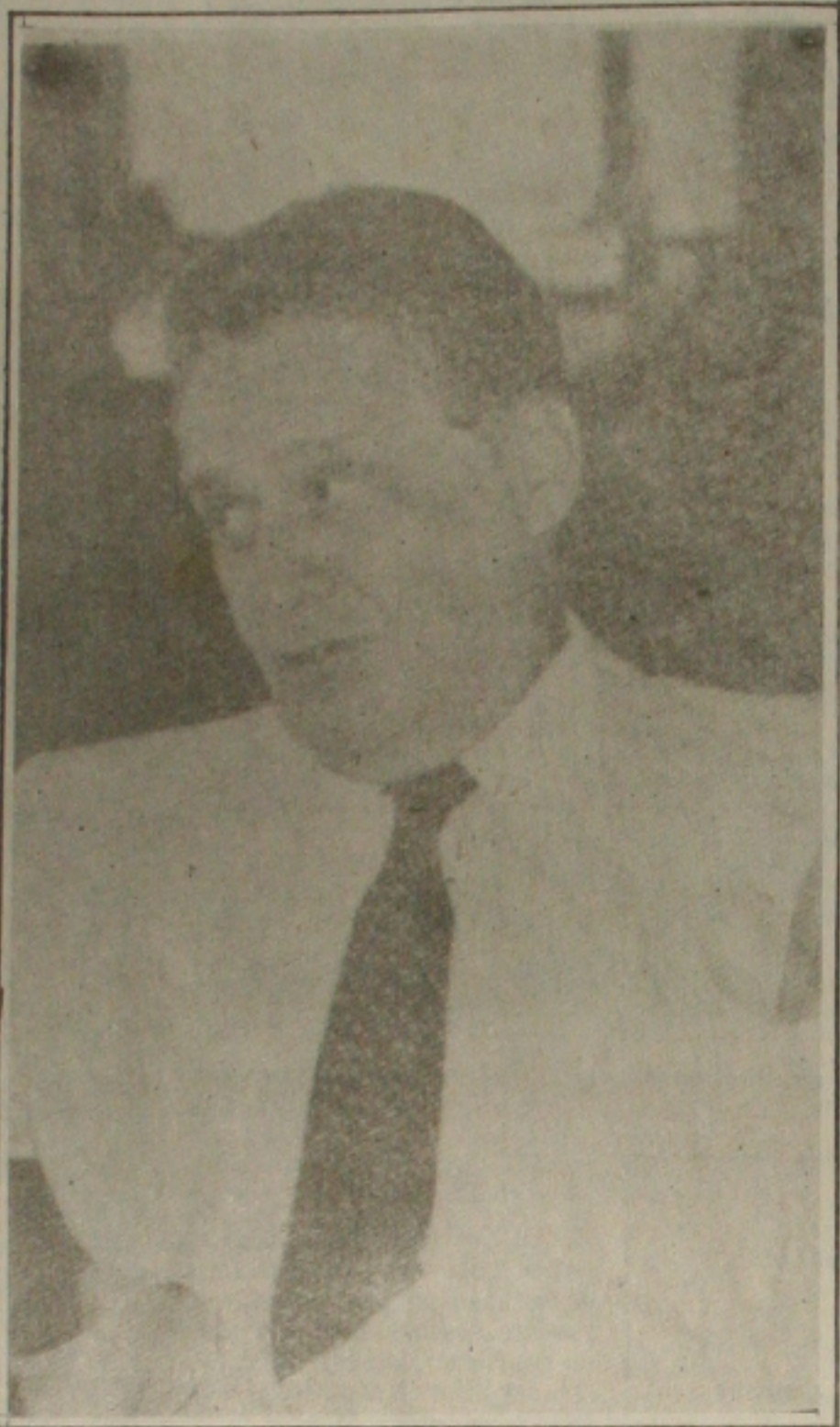
Cardoso: agora sem desculpas