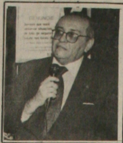
José Carlos Teixeira

Vice-governador garante que o Estado não vai parar por causa da eleição de outubro