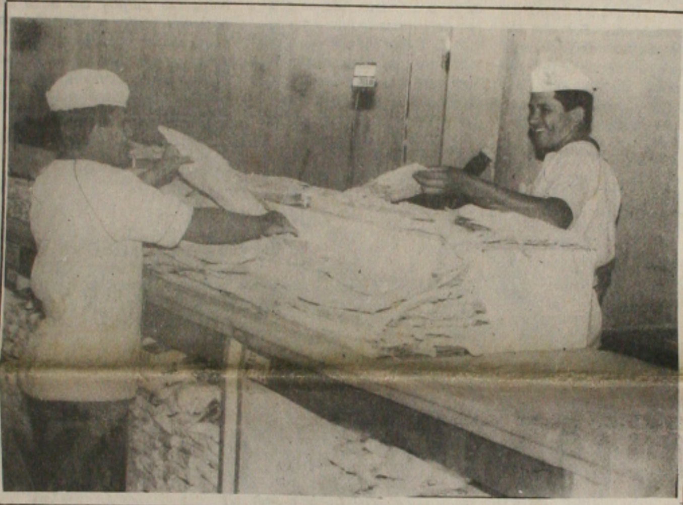
Caro, o bacalhau é cada vez menos consumido pelos sergipanos.

Os combustíveis estão 18,5% mais caros desde hoje. Este mês, os preços do álcool, gasolina, óleo diesel e gás de cozinha subiram 38,05%. No ano, o reajuste acumulado dos derivados de petróleo é de 88,17%. O aumento ficou em torno de dois pontos percentuais abaixo da inflação do mês passado, o que comprova a disposição do Governo em não autorizar reajustes acima da inflação - ressaltou, ontem, o ministro das Minas e Energia, Israel Vargas. As tarifas públicas ficaram pelo menos 90 dias sem reajustes reais. O Ministério da Fazenda, espera, nesse período, concluir a segunda fase do Plano de Estabilização, que consiste na conversão dos preços pela URV. Além disso, o Governo considera que não há mais necessidade de se recuperar os preços públicos, pois a defasagem foi eliminada em 1993.