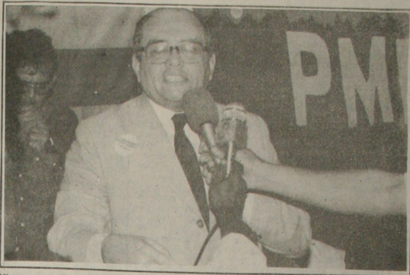
Vice-governador reafirma compromisso com desenvolvimento de Sergipe.