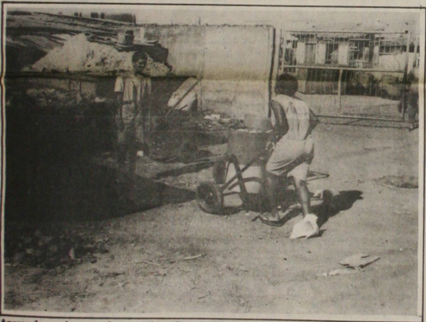
Apesar do movimento, alguns garis estão trabalhando na limpeza da cidade.