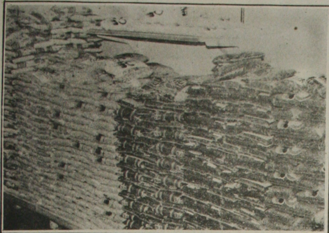
O quilo de feijão em uma semana foi reajustado em 260% nos supermercados.

Quem decidiu comprar feijão ontem nos supermercados, tomou um susto: o quilo do produto que na semana passada chegou a ser cotado a CR$ 500 em algumas lojas, somente foi encontrado nas prateleiras por CR$ 1,8 mil. O reajuste de 260% assustou a clientela e os gerentes das lojas não souberam explicar os motivos do abusivo aumento.