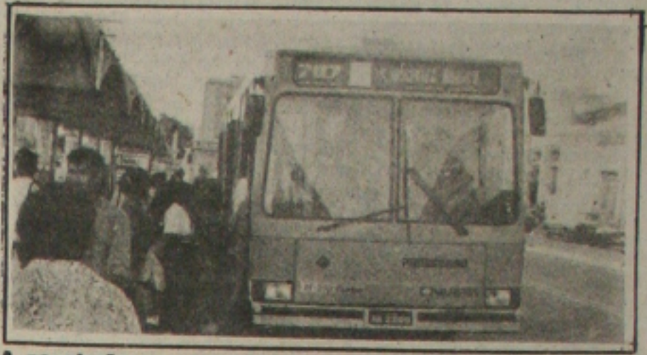
A população amanhece hoje com uma péssima notícia: o reajuste na tarifa de ônibus

O aracajuano inicia o dia hoje pagando mais caro pela tarifa única nos ônibus urbanos. Ontem, a Superintendência Municipal de Transportes Urbanos (SMTU) autorizou um reajuste de 45% no valor da passagem, elevando-a de CR$ 145,00 para CR$ 210,00. A tarifa do estacionamento na Zona Azul aumentou para CR$ 30,00 e a bandeirada dos táxis para CR$ 527,02.