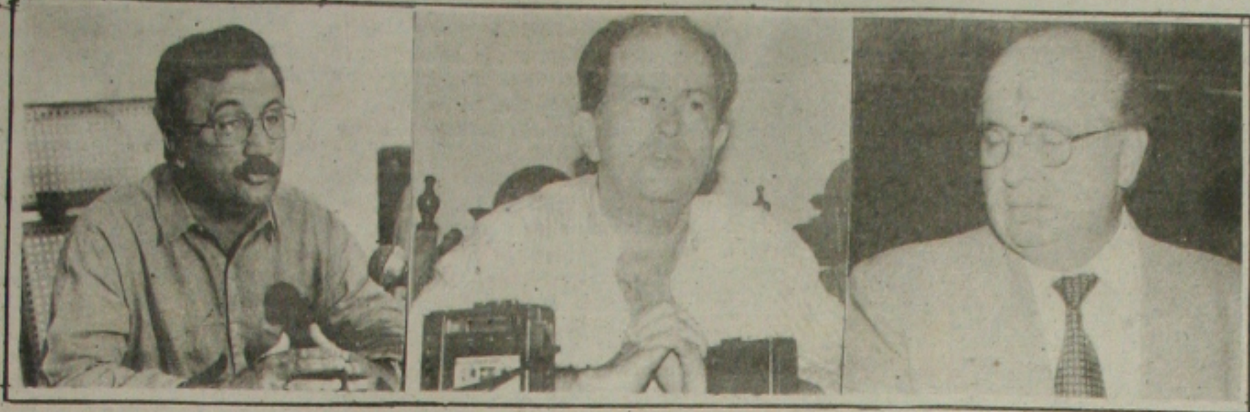
Jackson ganha na pergunta "induzida", com os nomes dos candidatos e perde na espontânea.