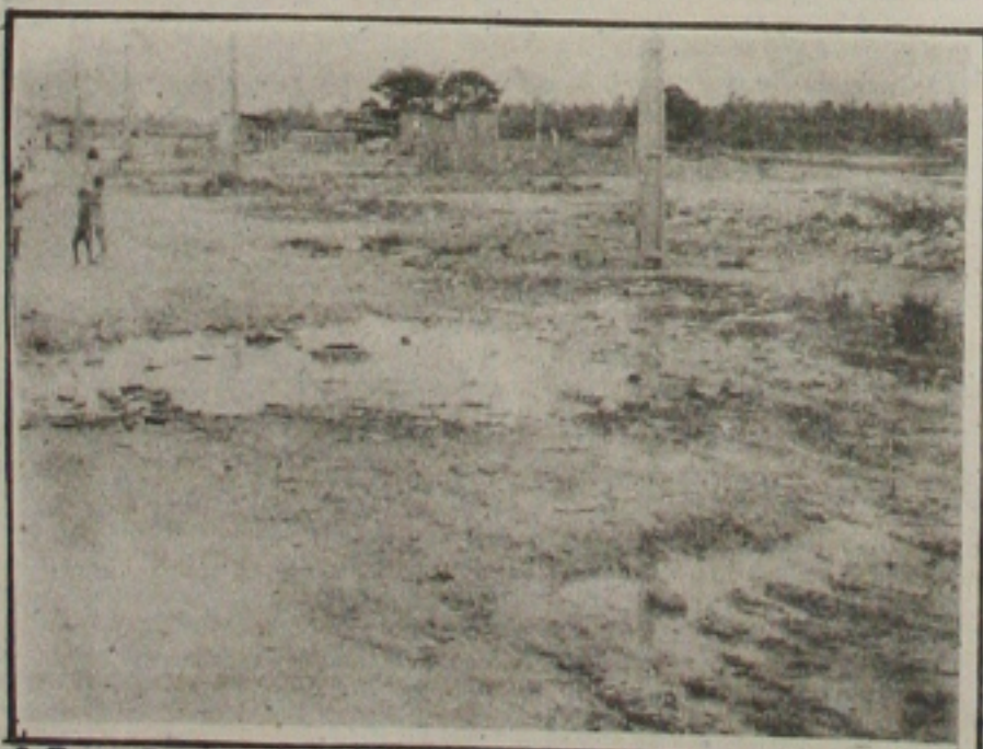
A Terra Dura está enfrentando uma série de dificuldades.

Não há coleta de lixo assim como não há segurança. Os moradores solicitam providências da Secretaria de Segurança Pública um modelo policial. Quando há festas em bares naquela localidade, os moradores enfrentam sérios problemas: aqueles mais inconscientes partem para violência e até matam por motivos fúteis.