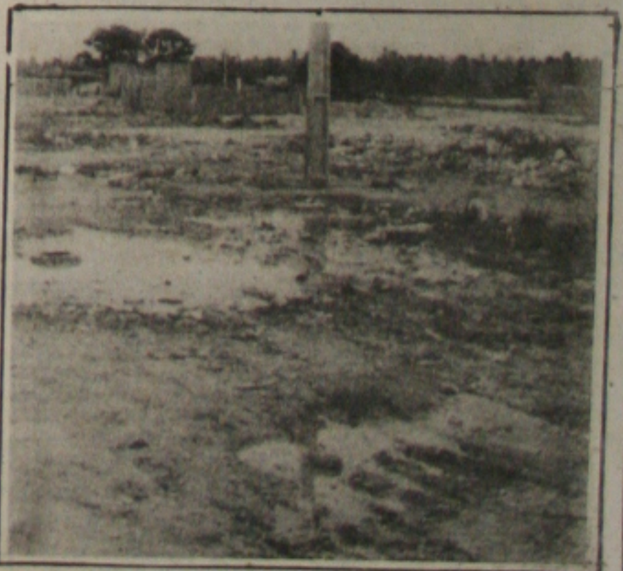
Muito lixo e ruas sem pavimentação predominam na Terra Dura

Os moradores do povoado Terra Dura, no município de São Cristóvão, vivem hoje uma situação dramática, pois enfrentam graves problemas e praticamente não têm a quem recorrer. Isto porque nem a Prefeitura de São Cristóvão nem a de Aracaju providenciam a solução de seus problemas como a falta de água, energia elétrica e principalmente segurança. Além desses transtornos, a população do povoado é obrigada a conviver com uma lixeira que se transformou no grande "cartão postal" da localidade, onde também não há saneamento básico nem as ruas contam com qualquer tipo de pavimentação. Coleta de lixo simplesmente inexistente e os moradores reclamam da Secretaria de Segurança Pública a implantação de pelo menos um módulo policial. (Página 5A).