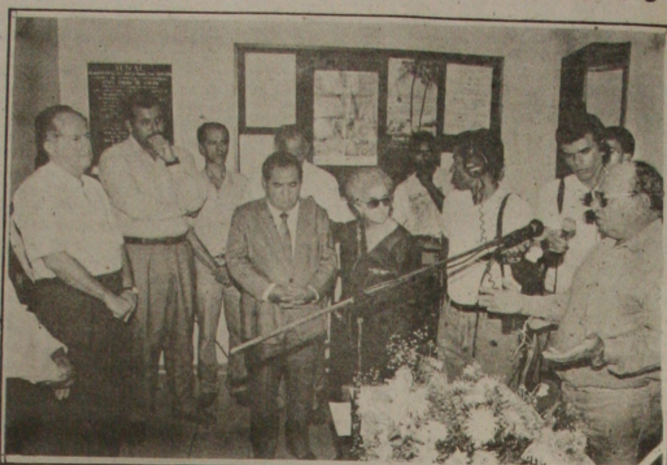
Desde sábado que Tobias Barreto tem um centro do Senac para formar os seus profissionais.

Os estudantes selecionados no 1º Semestre/94 deverão comparecer à CEF de 12 a 31.05.94 com a Regularidade de Matrícula para assinarem o contrato.