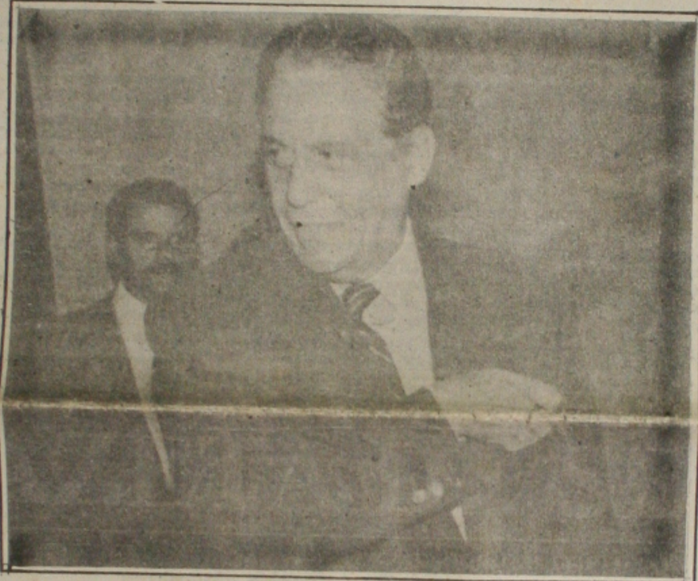
Fernando Henrique explicou as medidas e garantiu que com o plano não há perdas para os salários