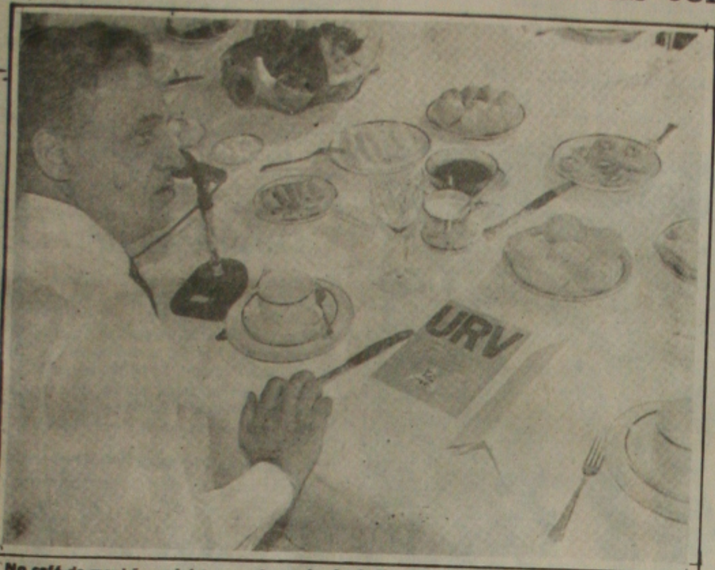
No café-da-manhã, o ministro sentiu a primeira indignação da URV: o anúncio da greve

BRASÍLIA - O ministro da Fazenda, Fernando Henrique Cardoso, admitiu que a conversão dos salários para a Unidade Real de Valor (URV) trará perdas para algumas categorias profissionais, como apontam as centrais sindicais. Mas deixou claro que não acredita no sucesso de uma greve geral proposta pelo Movimento Sindical para tentar pressionar o governo a mudar o critério de conversão dos salários. Ao invés da greve, o ministro sugere que os trabalhadores negociem com as empresas para obter aumentos superiores a média determinada pelo governo.