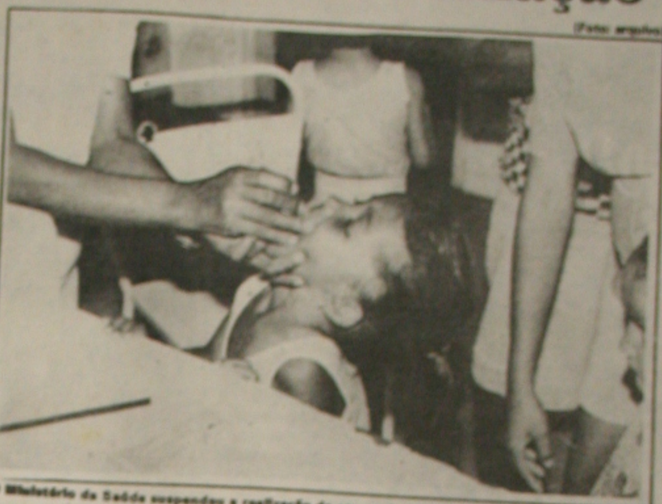
O Ministério da Saúde suspendeu a realização de campanha de vacinação em todo o país.

É pretendido da Secretaria de Saúde vacinar em todo o Estado neste ano 49.710 crianças menores de um ano. No total deverão ser vacinadas 4.142 crianças que receberam as doses contra a paralisia infantil, a tríplice contra coqueluche, difteria e tétano, a BCG contra a tuberculose e ainda uma outra dose contra o sarampo. Depois de um ano de idade, os pais devem programar informações detalhadas sobre o estado vacinal de seu filho e programar as novas doses que devem ser aplicadas. A previsão é que durante o ano sejam vacinadas 37.640 crianças contra a paralisia infantil assegurando uma média de 2.800 crianças ao mês. Devem receber doses de tríplice este ano 36.193 crianças menores de um ano e menores de cinco, e 3.012 ao mês. Contra o sarampo deverão ser vacinadas 36.563 crianças ao ano e 3.044 ao mês e contra a tuberculose deverão ser vacinadas 32.296 durante o ano e 2.699 ao mês.