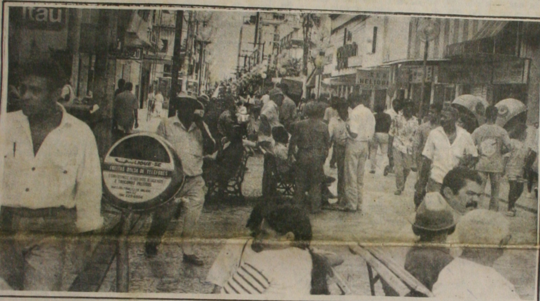
Apesar das dúvidas o sergipano reage com tranquilidade sobre as novas medidas econômicas do Governo

"Os sindicalistas estão perdendo tempo. Perguntem ao trabalhador se, no início de abril, ele prefere receber um salário mínimo de CR$ 55 mil, como previa a lei salarial anterior, ou CR$ 58 mil, com base na variação da URV. Quero ver sair esta greve". Foi o que afirmou ontem o ministro da Fazenda, Fernando Henrique Cardoso, ao duvidar que as centrais sindicais consigam