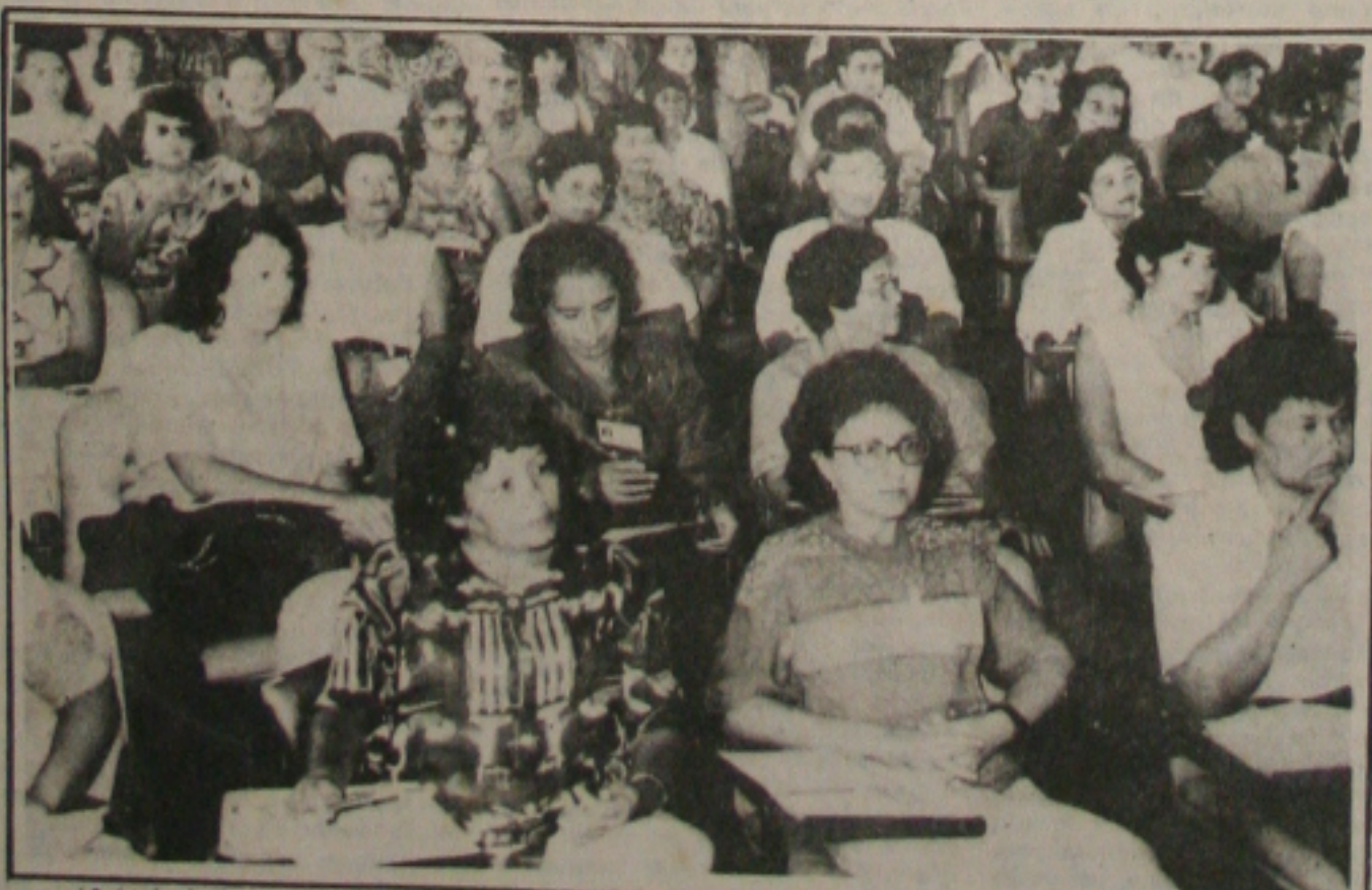
Aracaju sedia desde ontem o Seminário Estadual sobre Direitos Políticos da Família. O evento, movido pelo Governo do Estado com o apoio do Ministério do Bem-Estar Social, foi aberto, no auditório da LBA com uma palestra da secretária Nacional de Promoção Humana do Ministério, Albaria Paulino de Campos Abigail. (Página 5A)

Por 10 votos contra e oito a favor, a Câmara Municipal de Aracaju manteve ontem o veto do prefeito Jackson Barreto (PDT) à emenda que destinava 25 por cento das receitas da Prefeitura de Aracaju previstas no Orçamento do Município ao Legislativo. Dois vereadores anularam o voto e um, Daniel Fortes (PFL), se ausentou da sessão para resolver problemas particulares. A sessão foi tensa e por pouco o veto não foi derrubado, o que garantiria à Câmara recursos superiores aos que atualmente são destinados às áreas de Educação e Saúde. Na Assembleia Legislativa, as discussões giraram em torno da sucessão estadual, em particular ao resultado da pesquisa cujo resultado mostrou um empate técnico entre os dois candidatos declarados ao Governo do Estado, o senador Albano Franco (PSDB) e o prefeito Jackson Barreto. (Página 3A).