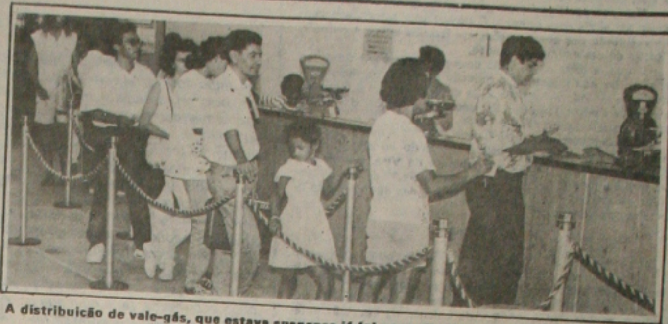
A distribuição de vale-gás, que estava suspensa já foi normalizada

A partir de agora, apenas os titulares das contas de energia elétrica poderão retirar o vale-gás instituído pelo Governo federal para beneficiar a população de baixa renda. A medida consta de portaria baixada pelo Departamento Nacional de Combustíveis (DN) introduzindo algumas mudanças na comercialização do vale-gás, que vai beneficiar agora os consumidores de até 75 Kw/mês. (Página 6A)