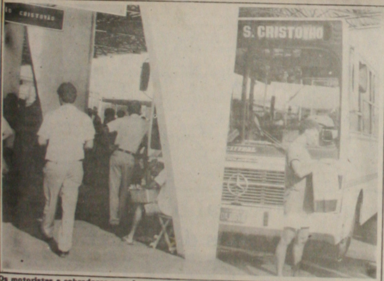
Os motoristas e cobradores apreciam a proposta apresentada pelos empresários.