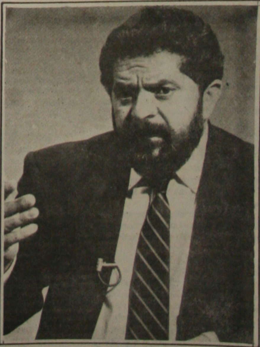
Lula: viagens pagas pela Nutrícia

com base em representação do deputado Campos Machado, feita em novembro do ano passado. No documento, Campos Machado citou viagens feitas por Lula em um jatinho fretado pela Nutrícia em 1992, durante a campanha para as eleições municipais. Ressaltando que a Nutrícia era fornecedora de merenda escolar a Prefeitura Paulista durante a administração Erundina, o deputado do PT registrou na representação que "a suspeita real no possível favorecimento da Nutrícia quanto a licitação e preços praticados na época de sua contratação com a Prefeitura de São Paulo, uma vez que denota nítida compensação de vantagens quanto ao pagamento de tais viagens".