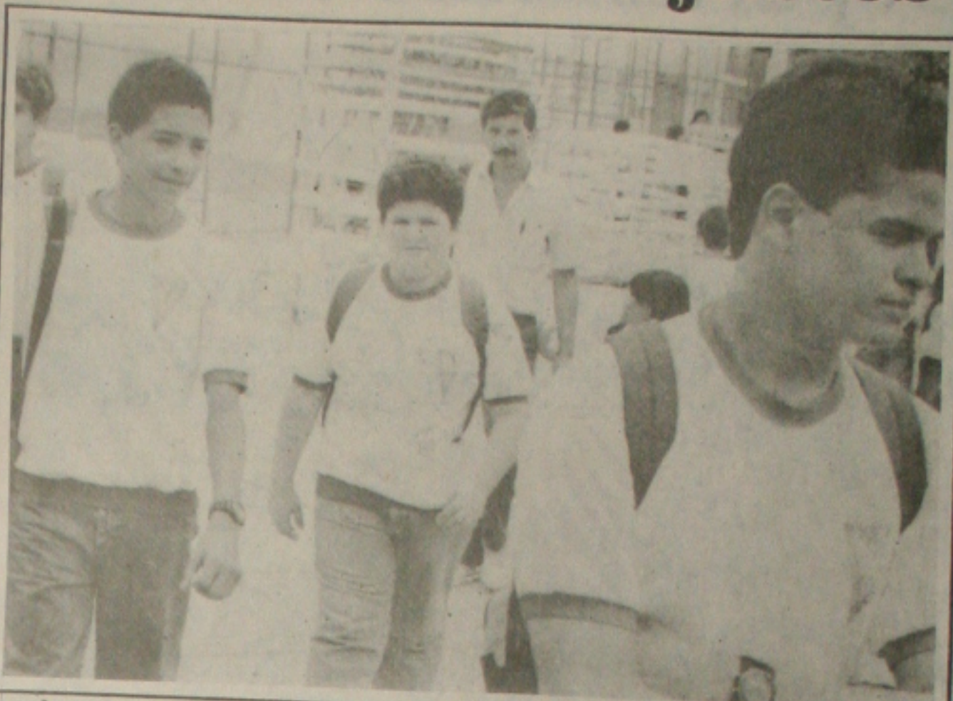
Os valores das mensalidades escolares serão discutidos hoje com o Ministério Público.