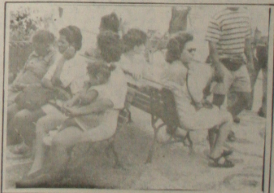
As mulheres sergipanas comemoram hoje seu dia. (Foto: Fernando Silva).

Na quinta-feira, a partir das 16 horas haverá recreação, dança e mostra de vídeo na praça da Concha no Bairro América e à noite haverá oficina de dança afro no espaço cultural Ilê Ocaia e na Praça da Concha no Bairro América se apresentará o grupo Danç'art, Bantus Nação e o Orf Ominirá e uma apresentação de uma mostra de vídeo.