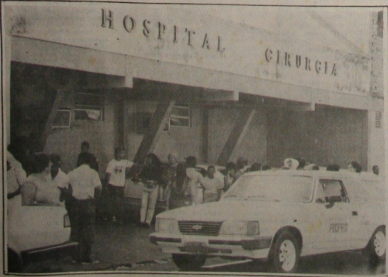
No Cirurgia, o departamento de oncologia pediátrica pode fechar a partir de hoje