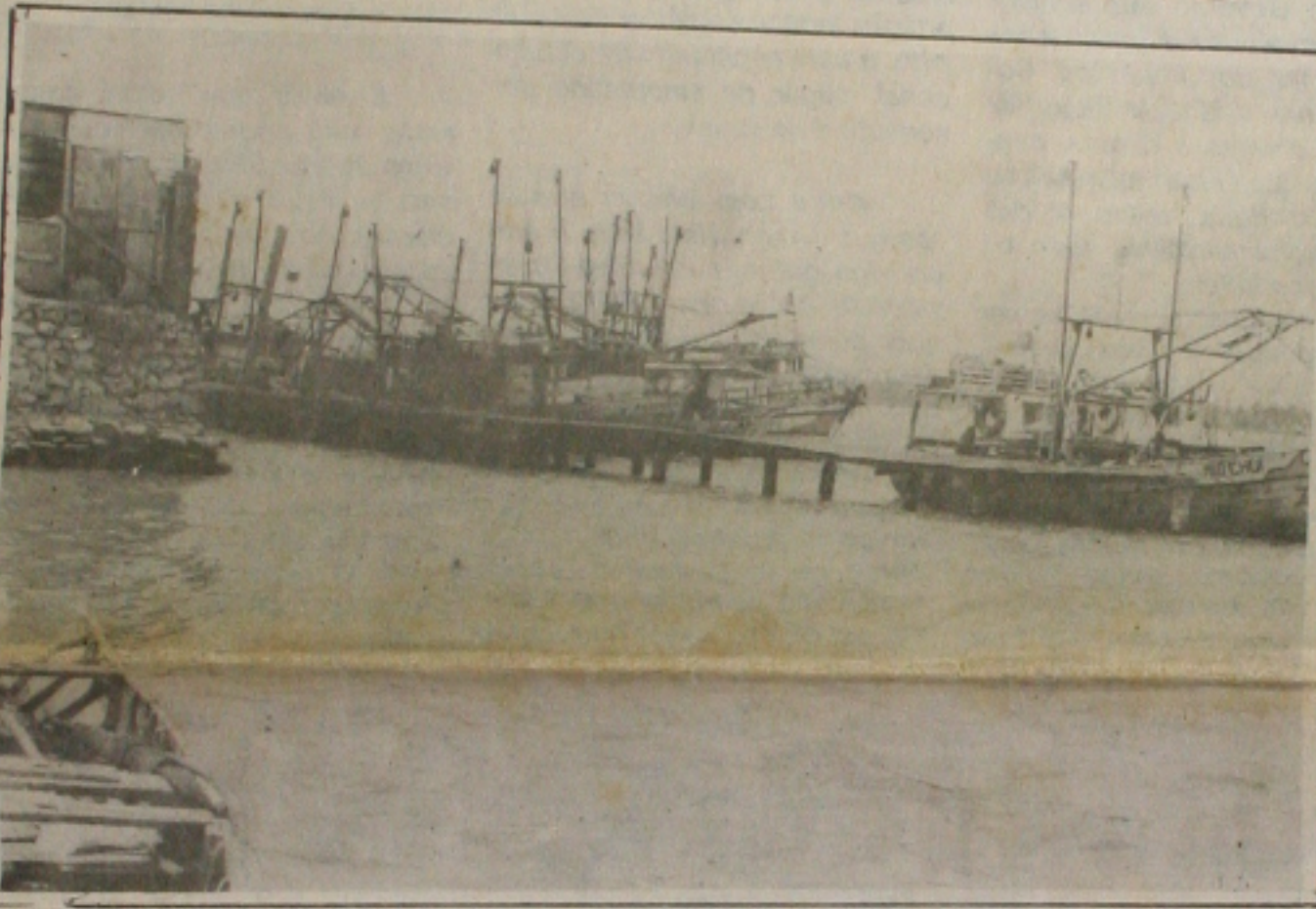
Muitos barcos pesqueiros continuam ancorados à espera da definição do período do defeso

Dirigentes das escolas da rede particular de ensino do Estado e representantes dos pais de alunos se reúnem hoje à tarde para definir a fórmula de reajuste das mensalidades a ser aplicada a partir de agora, em função do plano de estabilização anunciado na semana passada pelo Governador. A reunião, convocada pela Procuradoria de Defesa do Consumidor, acontecerá na sede do Conselho. A proposta principal é a de que as mensalidades sejam reajustadas imediatamente à Unidade Real de Valor, mas os reajustes contratuais só poderão ocorrer a cada 12 meses, segundo prevê a medida provisória que implantou o plano, econômico. (Página 5A).