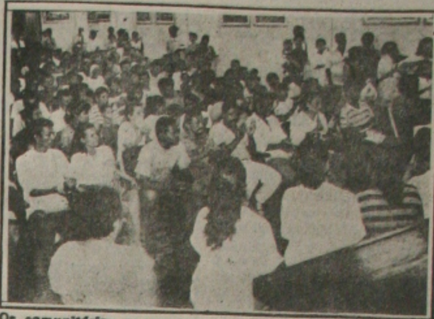
Os comunitários se reuniram na sede da ASI.