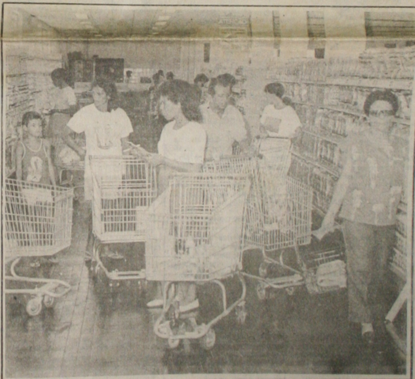
Nos supermercados, os consumidores diariamente têm se defrontado com os aumentos abusivos de preços

O ministro da Fazenda, Fernando Henrique Cardoso, anunciou a primeira medida do Governo destinada a forçar os oligopólios a recuarem nos aumentos especulativos de preços. O ministro avisou que reduzirá, a uma média de 2 por cento, as tarifas do imposto de importação, visando facilitar a entrada no País de itens mais baratos, para competir com os nacionais e, consequentemente, obrigar a redução dos preços. No entanto, os efeitos só deverão ser sentidos no varejo num período de 45 a 60 dias, prazo que demanda uma operação de importação. O próprio presidente Itamar Franco cobrou da área econômica que agilize a adoção de medidas punitivas contra os aumentos abusivos de preços. Ainda hoje o ministro da Fazenda deve assinar pelo menos 10 portarias baixando as alíquotas de praticamente todos os produtos farmacêuticos, de higiene pessoal e de limpeza, eletrodomésticos, petroquímicos - especialmente pneus, corantes e tintas - e alimentos industrializados. (Página 4B).