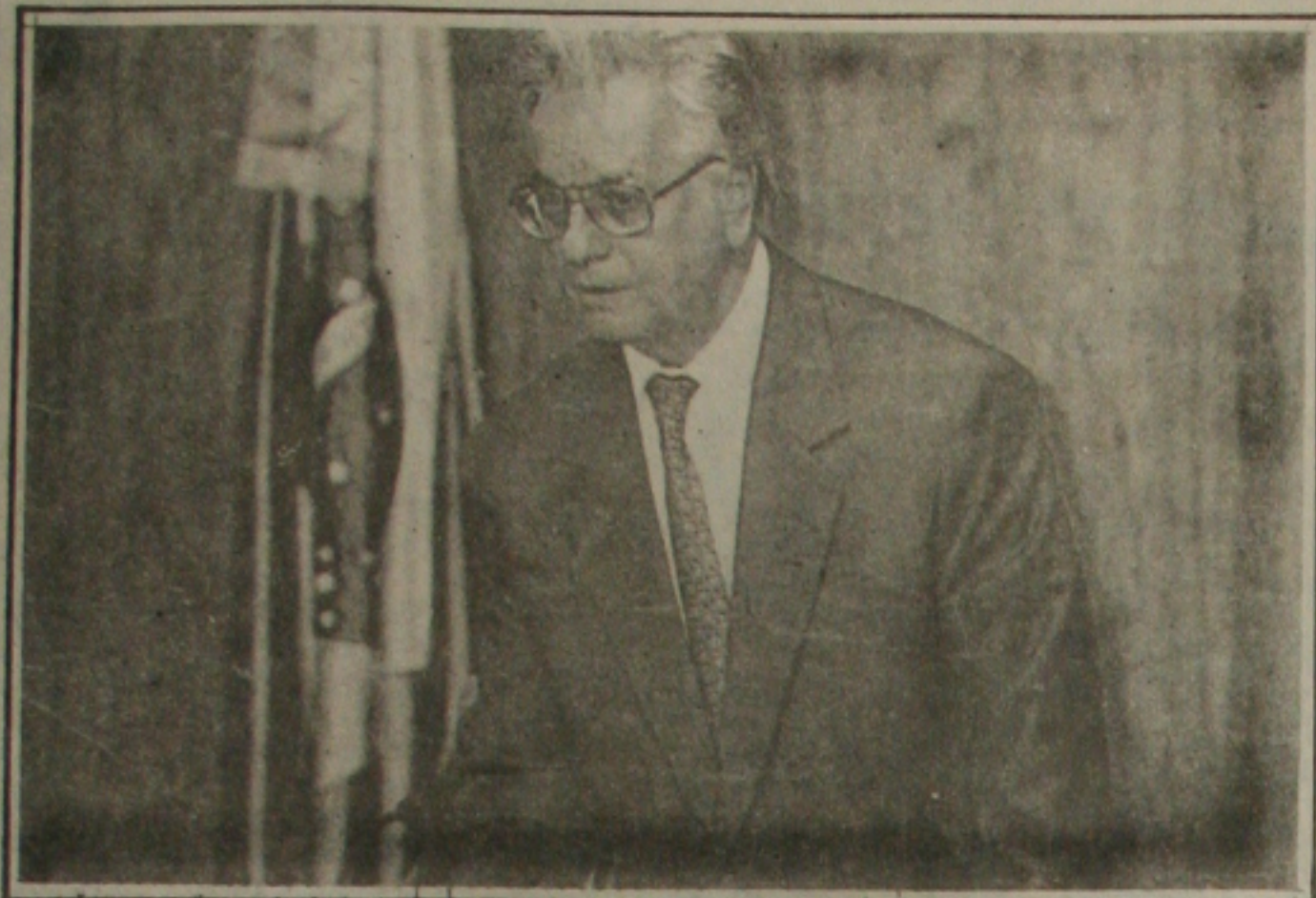
Itamar Franco: pressa na lei para punir os especuladores

A medida é para aumentar a concorrência e provocar queda dos preços especulativos