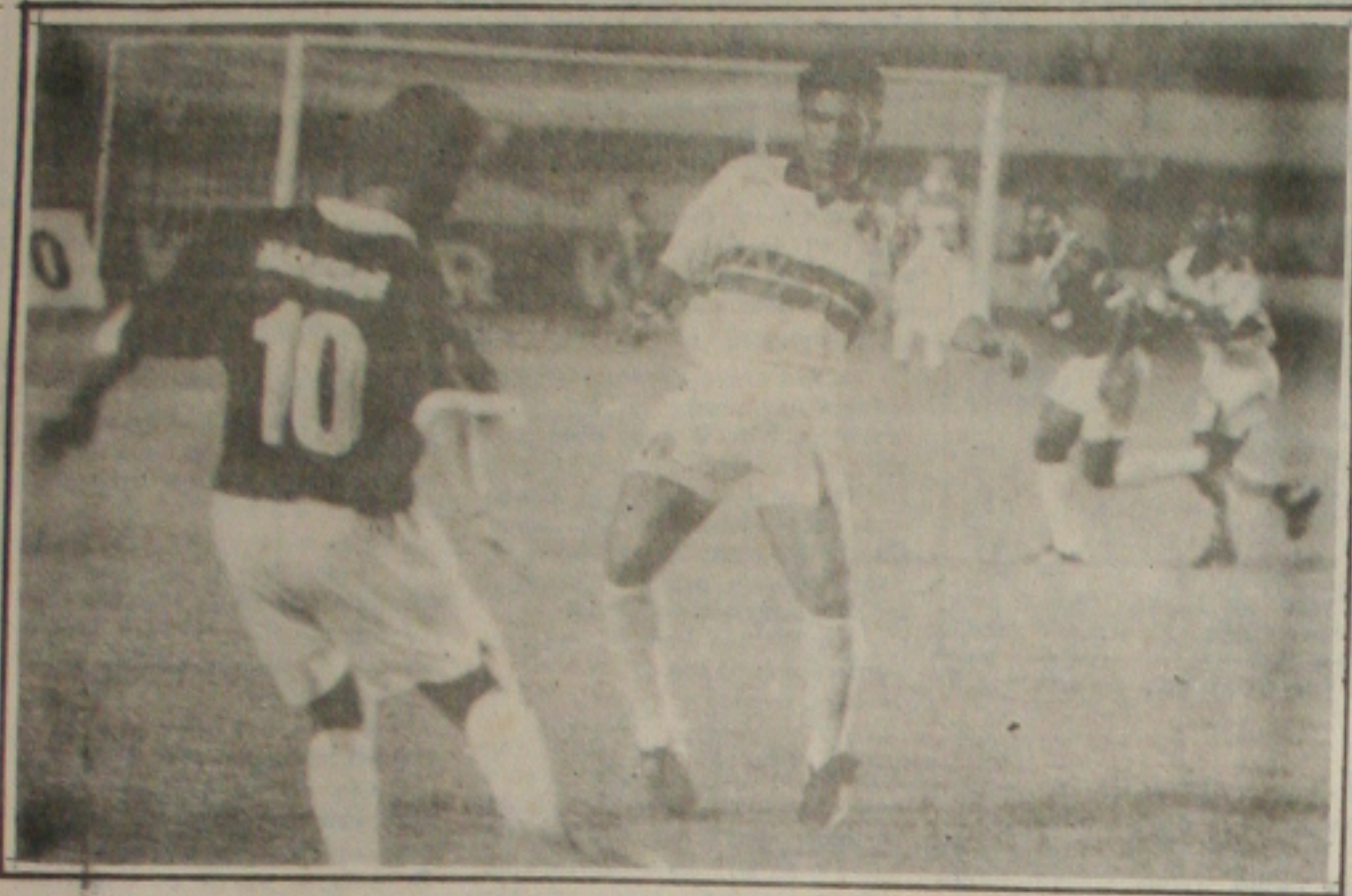
O Santa Cruz será adversário do Sergipe, no campeonato brasileiro.