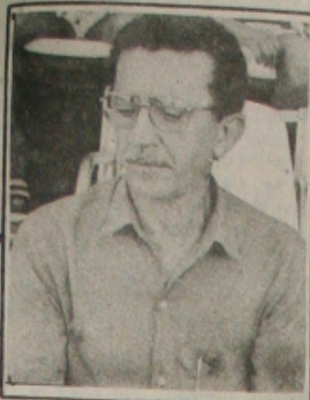
Queiroz deu ultimato

Ex-deputado cobra decisão de prefeito (Plenário)