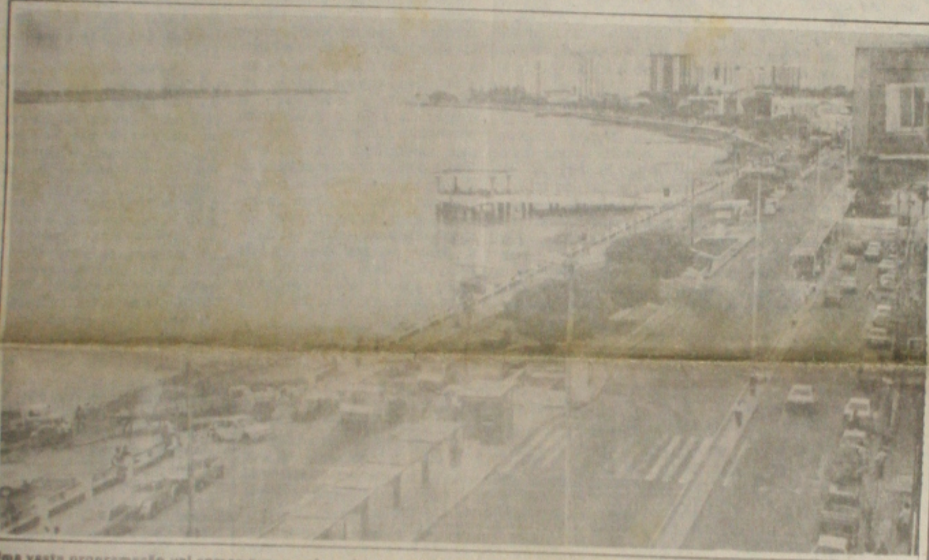
Uma vasta programação vai comemorar o aniversário de Aracaju

O presidente interino da República, Inocêncio Oliveira, decretou ontem estado de calamidade pública no setor de assistência à saúde, como forma de garantir o pagamento aos hospitais conveniados ao Sistema Único de Saúde (SUS). Com base no decreto, Inocêncio, que substituiu ao presidente Itamar Franco, por causa da viagem deste ao Chile, assinou uma medida provisória repassando CR$ 232 bilhões, recursos do Tesouro Nacional, para o Ministério da Saúde. O repasse dos recursos deve ocorrer