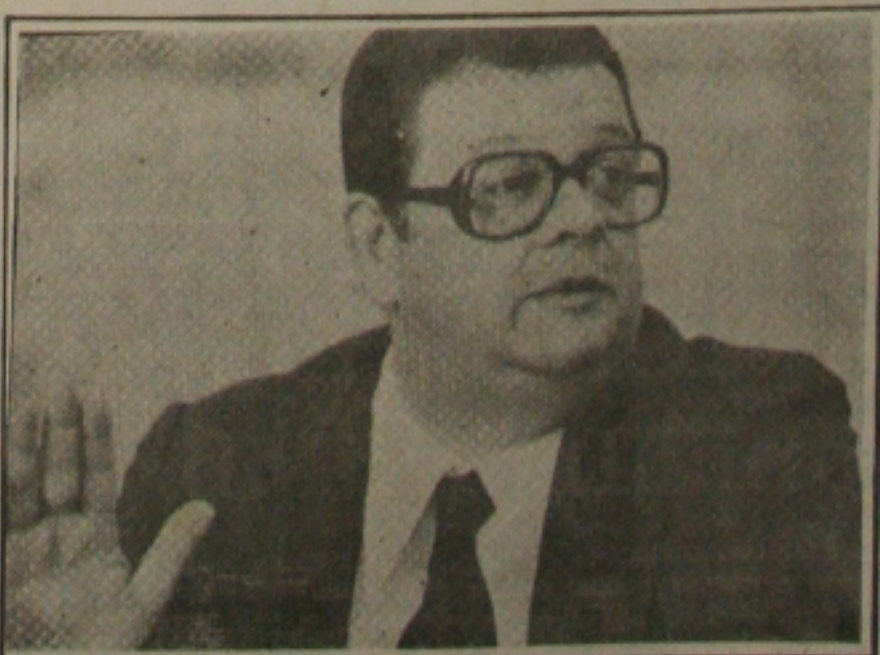
Delfim: efeito retardado

apresentou uma emenda a Comissão Mista do Congresso que analisa a Medida Provisória 434, estabelecendo um prazo mínimo de 90 dias a partir da aprovação da lei do plano econômico para a emissão do Real. Para Suplicy a determinação desse prazo permitiria a adaptação dos contratos a nova unidade de conta evitando a necessidade de tablitas ou outras formas de ruptura das relações contratuais que caracteri-