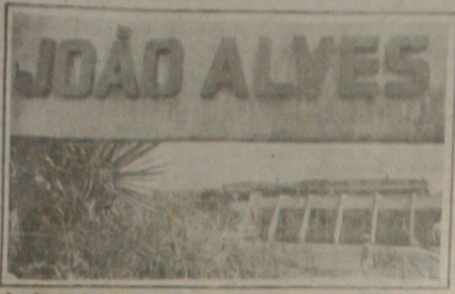
A reforma do hospital deve ser inaugurada no próximo dia 20