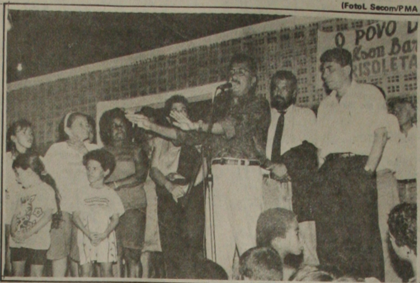
O prefeito Jackson Barreto entrega outra creche a comunidade aracajuana.