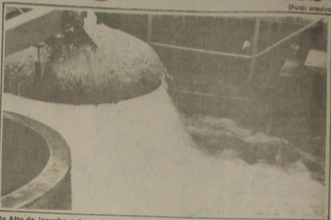
No Alto da Jaqueira, a água não jorra há mais de dois meses, sem explicação do Deso

Ele assegurou que o abastecimento de água na parte inferior está comprometido em mais de 70%, mas mesmo assim há muitas pessoas na área que estão sensibilizadas com as condições do pessoal do alto e então permite também que elas possam usar o líquido de forma racionalizada. "Há realmente um espírito de solidariedade aqui, mas a água que chegou aqui é ainda muito pouca", relata o gerente da casa comercial.