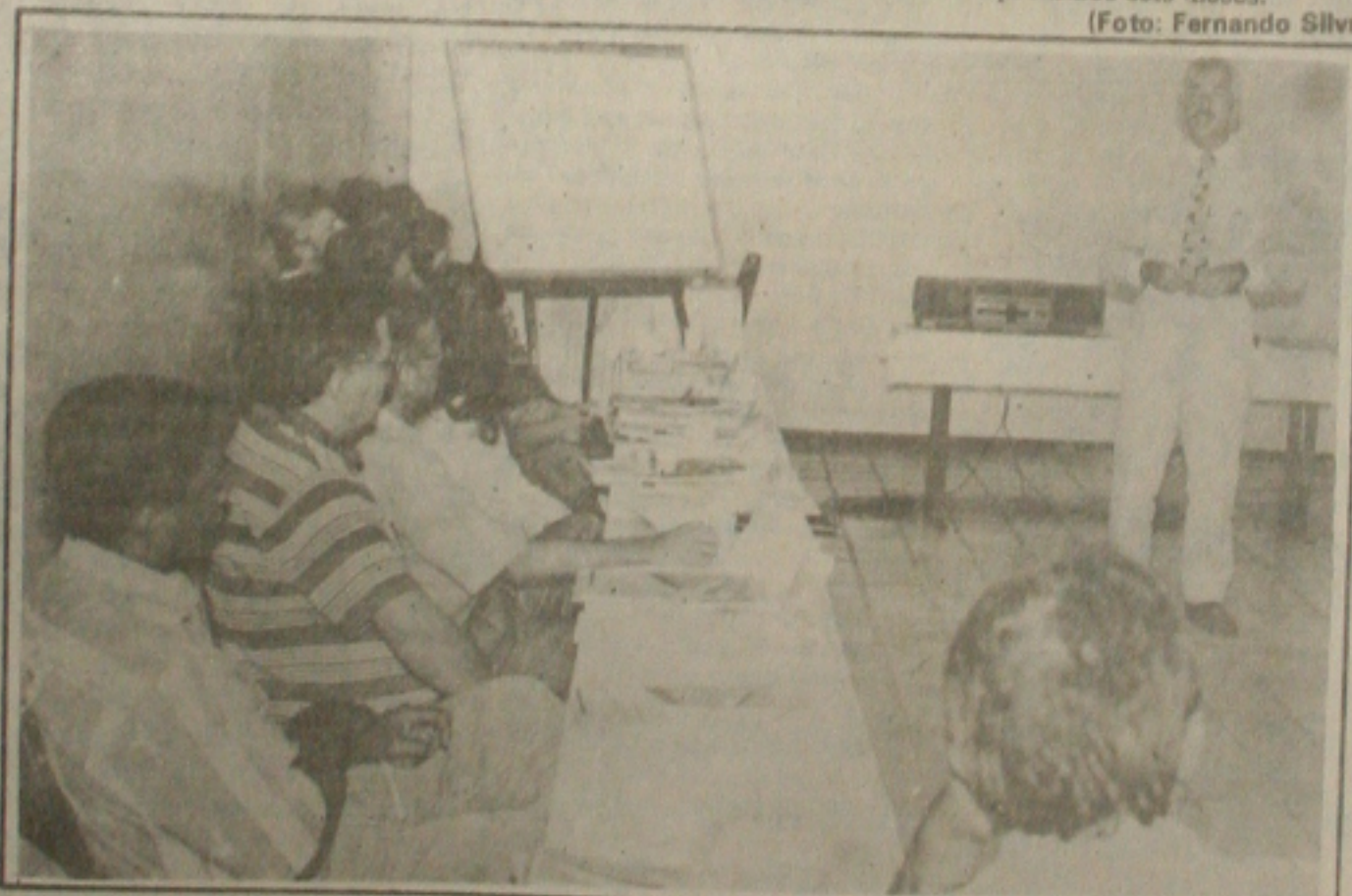
A informática é discutida com diretores de empresas de processamentos de dados de todo o País