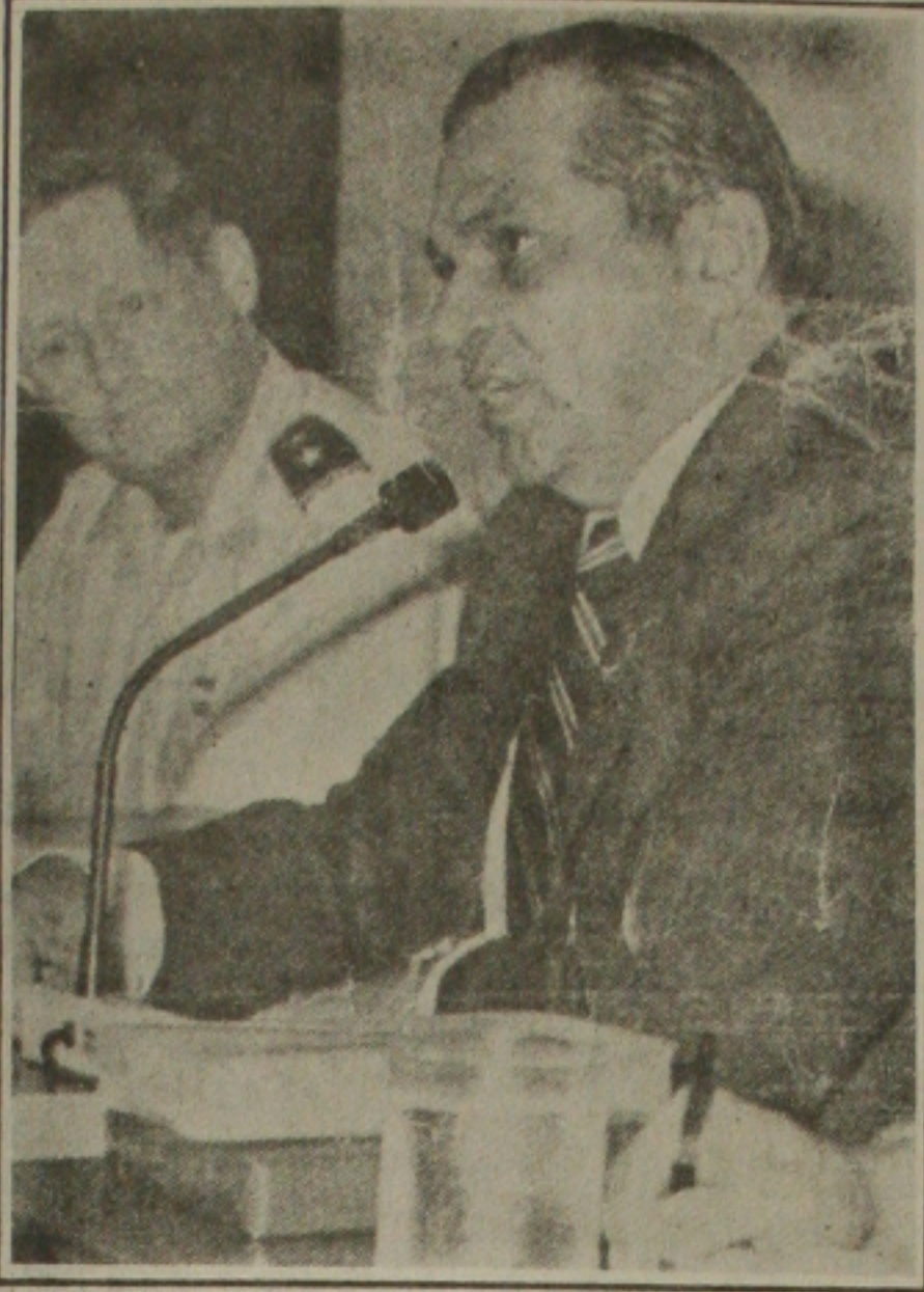
Inocêncio: calamidade assumida

Mais frustrados que o relator estavam os governadores. Para tentar acalmá-los, os líderes deixaram a pauta com pontos secundários e passaram boa parte do dia telefonando para os Estados. A estratégia agora é reaproximar os governadores da revisão, para que não fiquem alheios ao processo de mudanças da Constituição.