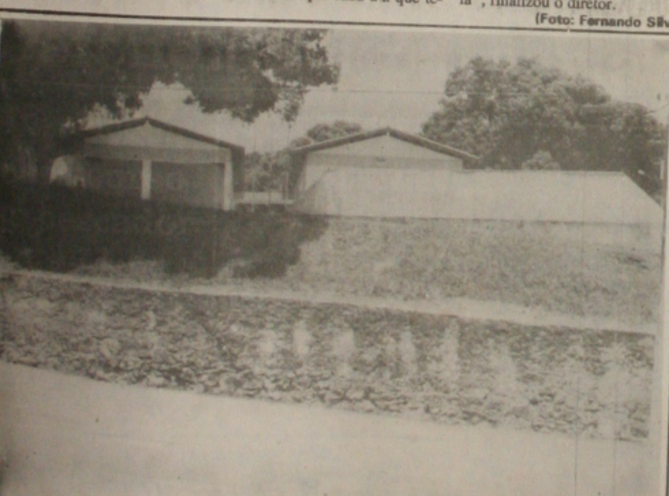
Diretor da Escola Marco Maciel diz que o uniforme é segurança para os alunos