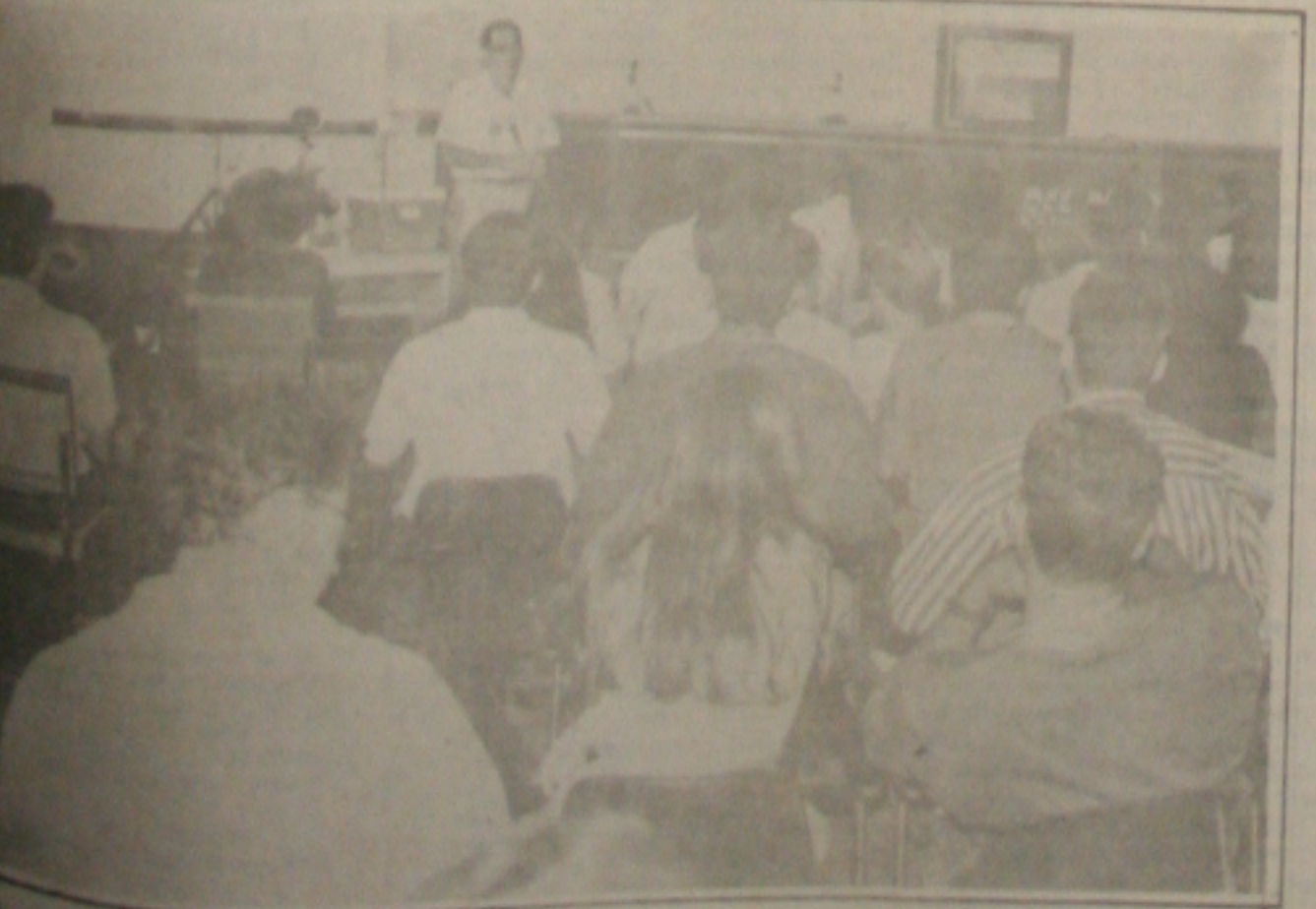
O seminário sobre a Gestão de Qualidade Total reuniu empresários, sindicalistas e outros interessados no programa

visão para março entre 41% e 42%. Ontem, a FGV também divulgou sua taxa de fevereiro do Índice Geral de Preços (IGP): 42,41%, o que representa estabilidade em relação a janeiro (quando a taxa ficou em 42,19%). Ou seja, acabou contrariando as expectativas que eram de queda. A diferença entre os dois IGPs está no período de coleta: o IGP é calculado entre os dias 1 e 30 do mês referência, enquanto o IGP-M é medido entre os dias 21 do mês anterior e 20 do mês referência.