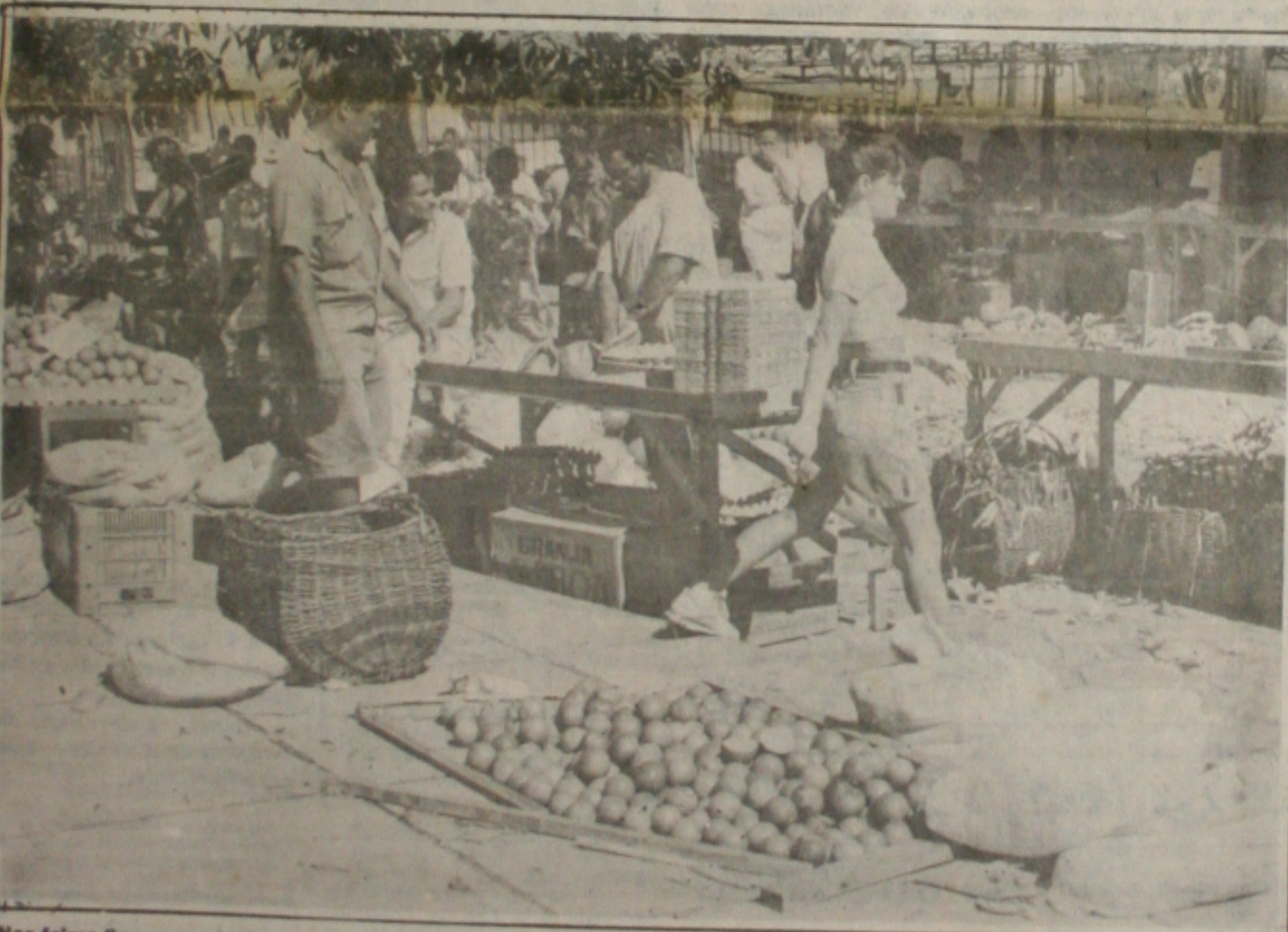
Nas feiras livres, a maioria dos vendedores está desinformada sobre o plano.