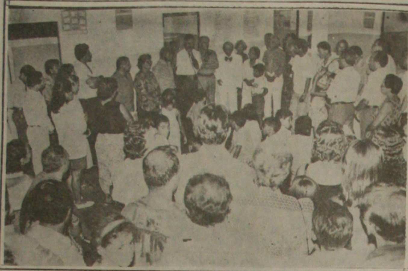
Jackson Barreto inaugura centro de saúde no Povoado Areia Branca.