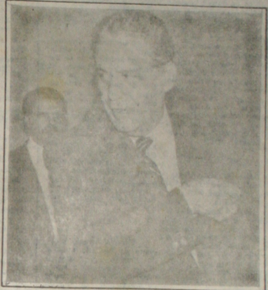
O ministro abriu o caminho para uma negociação com o Congresso

O ministro da Fazenda, Fernando Henrique Cardoso, já admite negociar com o Congresso Nacional mudanças na Medida Provisória 434 que criou a Unidade Real de Valor (URV), como a instituição de mecanismos para repor as perdas decorrentes da conversão dos salários à URV. Fernando Henrique admitiu tal possibilidade durante reunião ontem com a comissão especial que analisa a Medida. O Governo poderá também incluir no texto o compromisso de aumentar o salário mínimo para US$ 100 até o final do ano e discutir ainda uma maneira que garanta a correção diária do salário do trabalhador entre a data do depósito no banco e o saque do valor na boca do caixa. Ontem, o ministro assinou duas portarias, a primeira reduzindo para 2% as alíquotas dos impostos de importação de 41 itens, correspondendo a 132 produtos, para forçar os oligopólios que os produzem a baixar os preços no mercado interno. A outra portaria, autoriza a emissão de carnês de crédito, faturas, duplicatas e faturas de cartões de crédito em URV. (Página 4B)