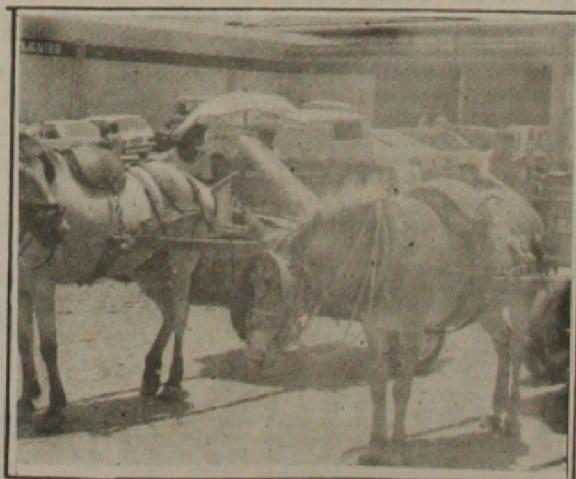
Além dos maltratos, os animais são obrigados a puxar cargas com excessos de peso.

ELEIÇÕES - As gráficas já estão se preparando para as eleições 94, mas, como diz o adágio popular "gato escaldado tem