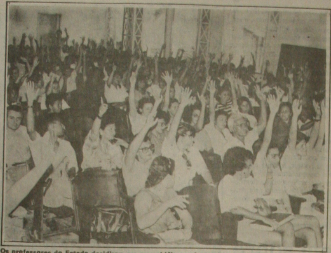
Os professores do Estado decidiram em assembleia-geral que vão parar até o final do semestre.

O diretor Técnico da Emurb explicou também que os serviços de desobstrução de esgoto estão sendo intensificados por causa da chegada das águas de março. Ele explicou que nessa época o trabalho de desobstrução de esgoto é triplicado, onde várias equipes da Empresa Municipal de Obras e Urbanização percorrem os pontos mais críticos da cidade.