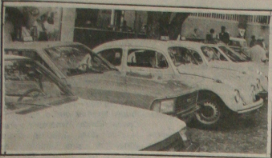
Se a isenção sair, os taxistas alegam que poderão renovar a frota.

Para o ex-deputado estadual Marcelo Déda (PT), o Partido dos Trabalhadores não tem o que temer se a campanha à sucessão estadual se polarizar entre o prefeito de Aracaju, Jackson Barreto (PDT) e o senador Albeno Franco (PSDB) caso o PT tenha candidatura própria. Ele é de opinião que a candidatura presidencial de Luiz Inácio Lula da Silva favorece o PT no Estado. (Página 3A)