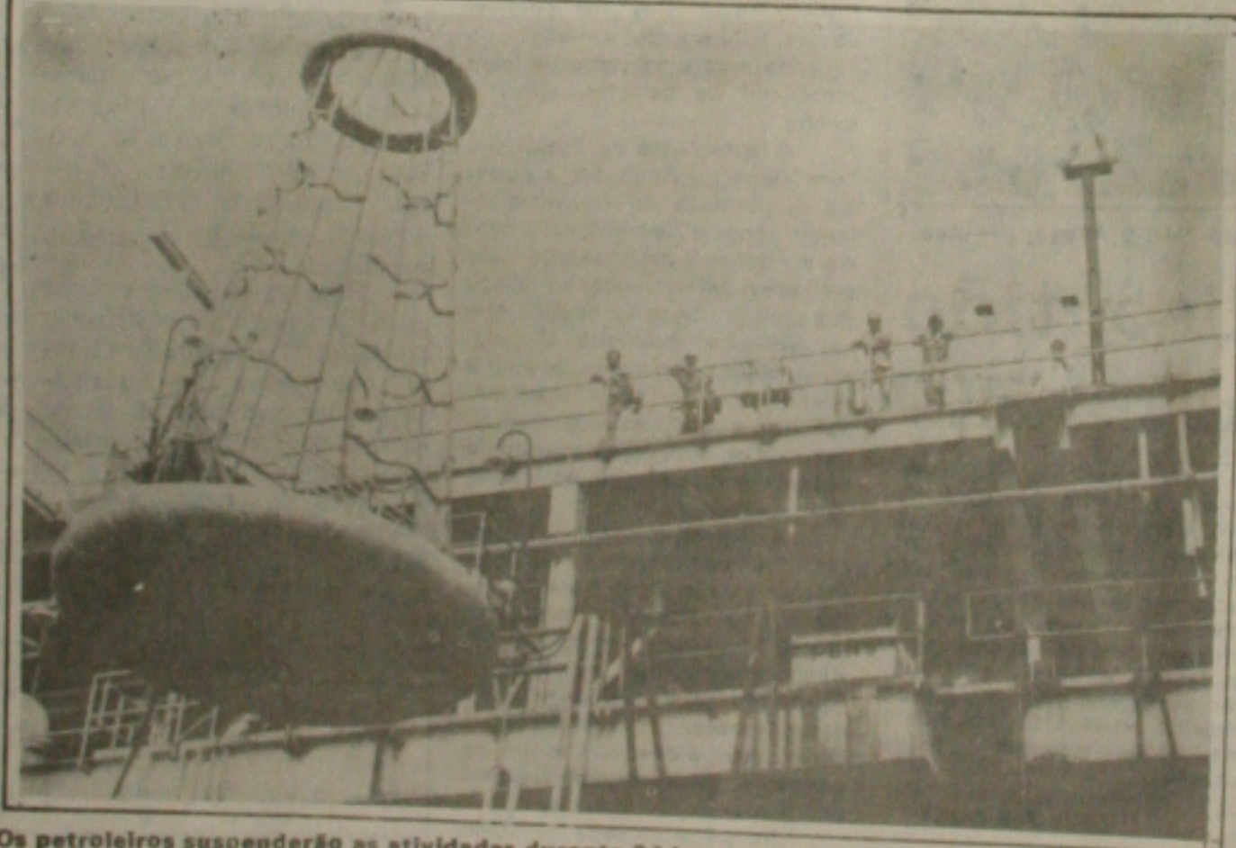
Os petroleiros suspenderão as atividades durante 24 horas na terça-feira.

"A URV é puro engodo - retrata a nota do Sindipetro - cristaliza uma situação salarial desfavorável aos trabalhadores que sempre foram penalizados. Os salários foram penalizados já que os salários vinham sendo corrigidos em percentuais sempre abaixo da inflação".