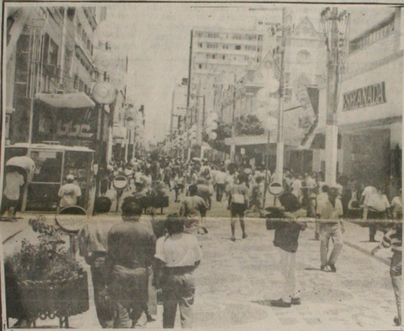
No comércio, a confusão foi muita ontem em torno de uso da URV

O governador João Alves Filho (PFL) deixou claro ontem que pretende disputar as eleições de 1998, mas não quis revelar a qual cargo concorreria. Ele levantou essa possibilidade ontem após a celebração da missa em ação de graças na Catedral Metropolitana de Aracaju em comemoração aos três anos de sua administração. Na ocasião, o governador reafirmou sua decisão de ficar no cargo até o final do mandato, como anunciara na segunda-feira, com exclusividade, para a GAZETA DE SERGIPE. Entre os políticos, a notícia teve grande repercussão. Para alguns deles, a decisão de João Alves muda significativamente o quadro sucessório no Estado. (Página 3A)