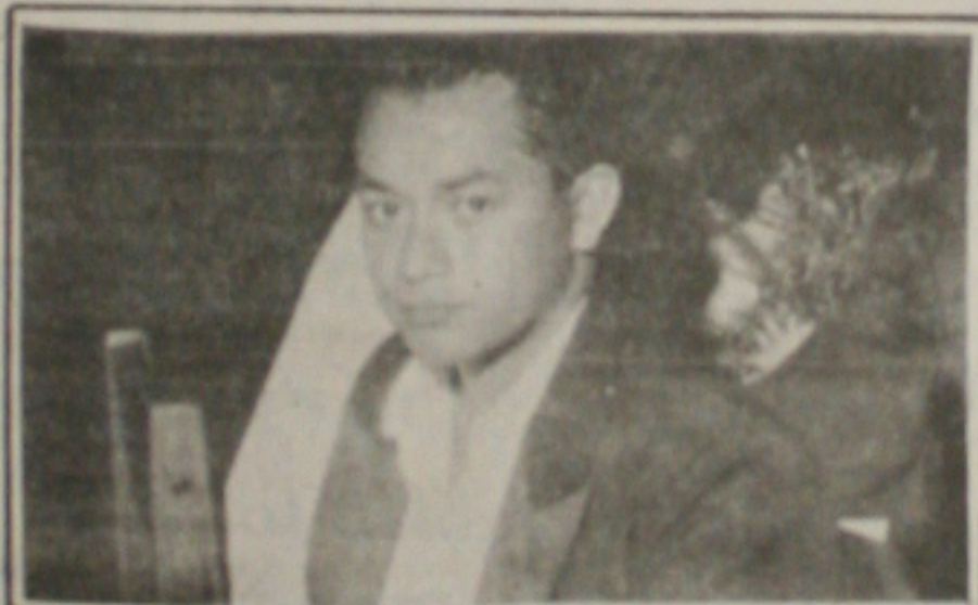
O poeta Araripe Coutinho. A beleza dos seus poemas se destaca.

Desde ontem, no Shopping Riomar, está sendo realizada uma exposição fotográfica das principais obras do Governo João Alves Filho, em comemoração do 3º aniversário de sua administração. Os trabalhos podem ser vistos até sexta-feira.