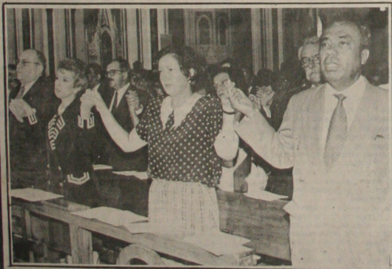
O governador (D) participou da missa ao lado da Primeira Dama, da Ministra e do vice

que deveria ser de 24 horas, foi no entanto de apenas duas, e setorizada. A categoria preferiu recuar para aderir, porém, a greve geral convocada para o próximo dia 23 pelas centrais sindicais do País - CUT, CGT e Força Sindical. (Página 5A)