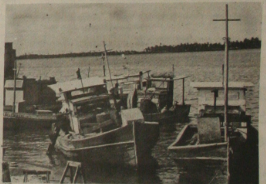
No Crasto serão construídos uma nova frota e em Pirambu serão recuperados os barcos em uso.