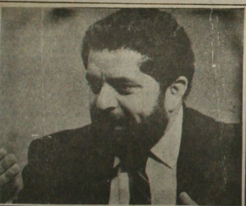
Lula: aborto e homossexualismo

Na bancada, todos cobram mudanças no programa, que deve ser oficializado na Convenção Nacional do PT, marcada para os dias 29 e 30 de abril e 1º de maio, em Brasília. O deputado José Genoíno (PT-SP), defende a elaboração de um outro programa para o Governo Lula.