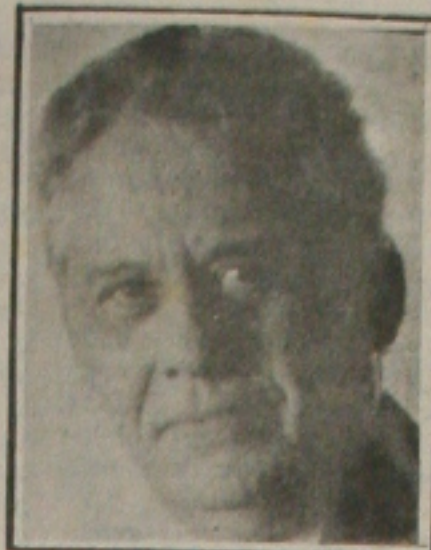
Fernando Henrique Cardoso

Congresso rejeita criação do voto facultativo. Jobim tem outro parecer derrotado (Página 4B)