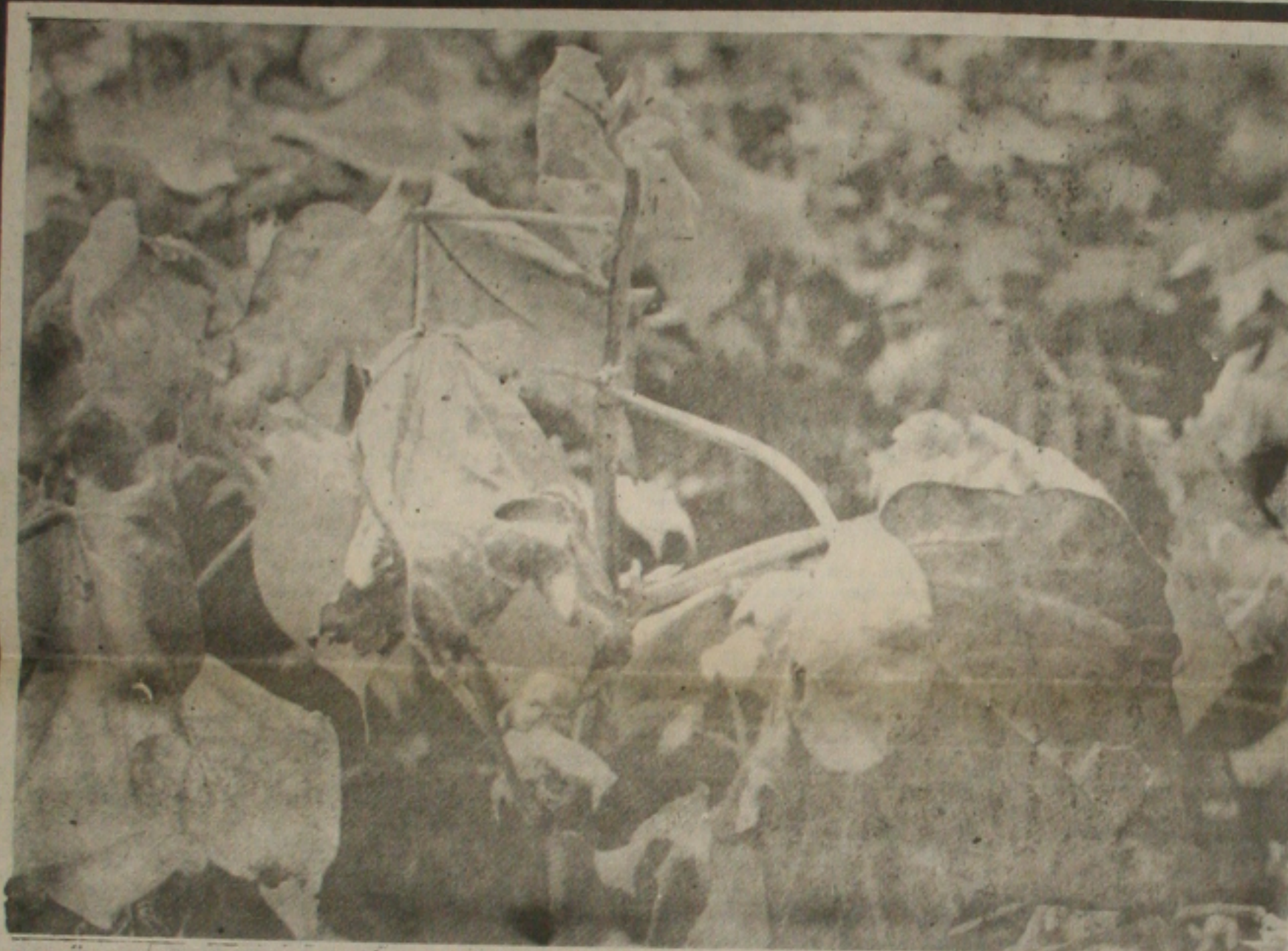
A lavoura do algodão atingida pela "murcha avermelhada" será recuperada através de combate específico e novos investimentos: irão nortear os destinos desta atividade.

"Estas viagens para a Alemanha ao Continente Asiático, têm como objetivo seguir diretrizes traçadas pelo governador João Alves Filho para mostrar aos empresários a imagem de Sergipe, seus incentivos fiscais e, com isso atrair investidores, única maneira de robustecer os cofres do Estado e extirpar com determinação o cancro social gerado pelo desemprego", finalizou José Carlos Teixeira.