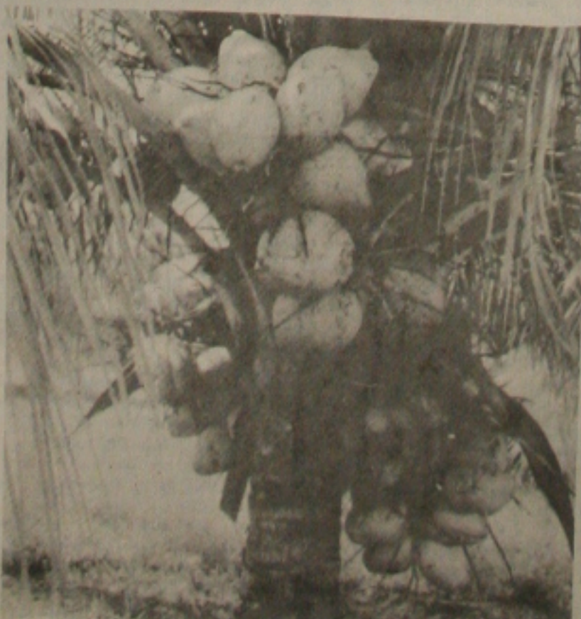
Novos coqueiros serão plantados e as pragas serão combatidas de forma eficiente na tentativa de salvar o coqueiral atingido.

indústria têxtil, representantes da Endagro, Cohidro e Codise para estudar meios que possam tornar mais rentável o sistema de descaroçadeira. O programa de revitalização da indústria já começou por etapas e tem como meta produzir no próximo ano 16 mil toneladas de algodão através de um plantio mais eficaz e produtivo. Atualmente a produção está estimada em apenas 200 toneladas para atender a uma demanda superior a 25 mil toneladas.