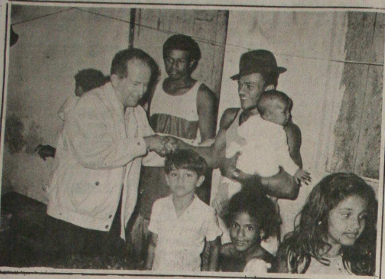
Albano tem no trabalhador sua principal preocupação e prioridade.