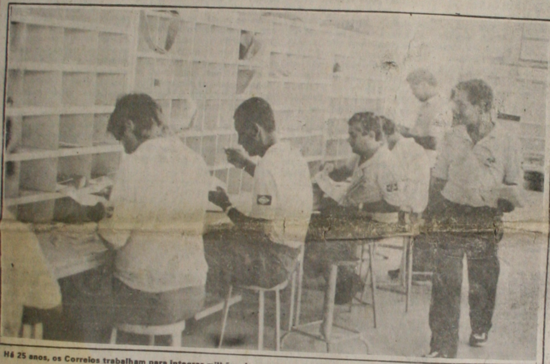
Há 25 anos, os Correios trabalham para integrar milhões de pessoas.

O ministro da Fazenda, Fernando Henrique Cardoso, que retorna neste domingo da viagem de quatro dias que fez aos Estados Unidos, acusou ontem os líderes dos Poderes Legislativo e Judiciário de prática de sabotagem contra o plano de estabilização econômica e o Brasil. O ministro fez a crítica ao comentar as recentes decisões da Câmara dos Deputados e do Su-