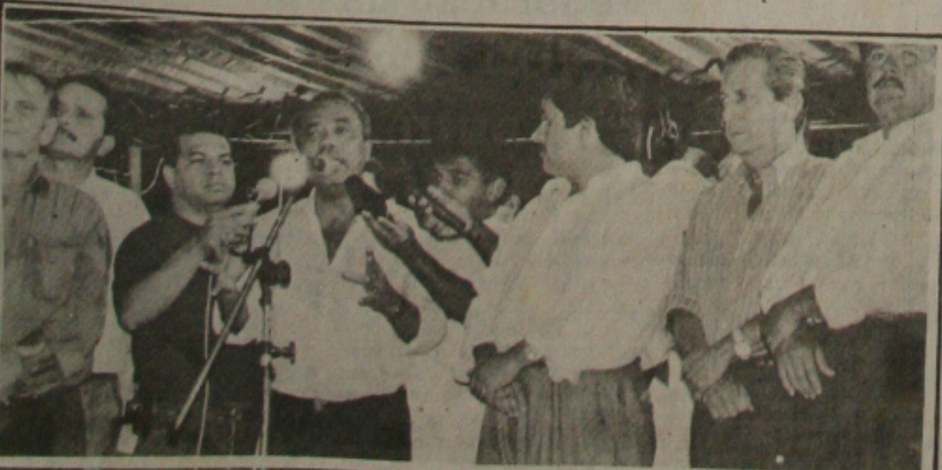
A solenidade de inauguração do ginásio em Itabaiana.

Além do Ginásio de Esportes "Dr. José Milton Machado", o Governo João Alves Filho realizou várias outras obras no município de Itabaiana, dentre as quais o CAIC "Gilberto Amado", Novo Fórum, pavimentação do Conjunto José Luiz da Conceição, eletrificação rural em mais de 16 povoados, recuperação de toda rede escolar e ampliação em 50% de todo o sistema de abastecimento d'água, além da construção da Praça Etelvino Mendonça e implantação do Distrito Industrial daquele município.