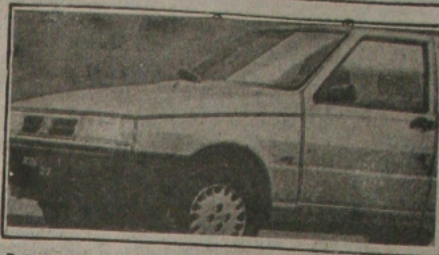
Paseo, o esportivo da Toyota

O Caderno Veículos está de volta na edição deste domingo da GAZETA DE SERGIPE com muitas informações. Numa das reportagens, o suplemento dá dicas importantes sobre como "ressuscitar" seu carro quando ele morre por algum motivo. Destaque também o Paseo, o modelo esportivo da Toyota que chega para agradar em cheio aos amantes da velocidade.