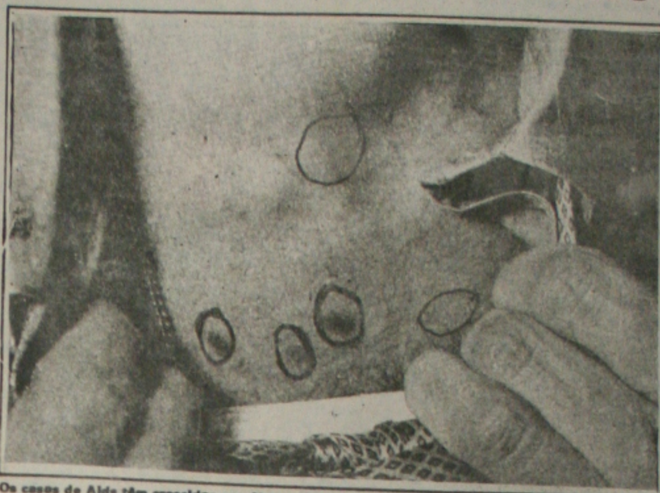
Os casos de Aids têm crescer, nos últimos meses em todo o Estado.