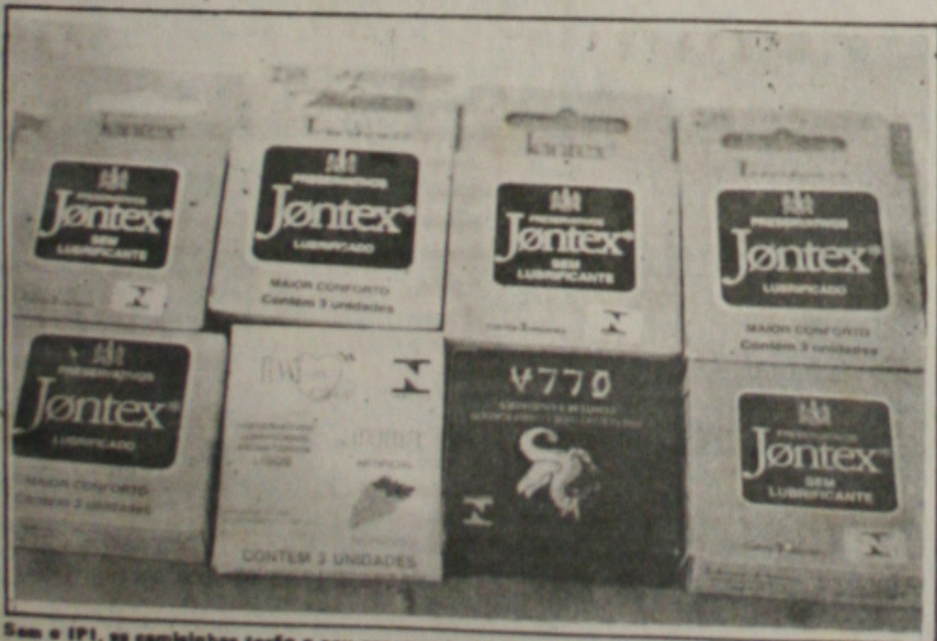
Sem o IPI, as camisinhas terão o seu preço reduzido para o consumidor.

No momento ela solicita o apoio urgente em relação à merenda escolar, pois muitas das alunas estão indo direto do trabalho para a sala de aula sem se alimentar, por não terem o que comer ou por problemas de horário.