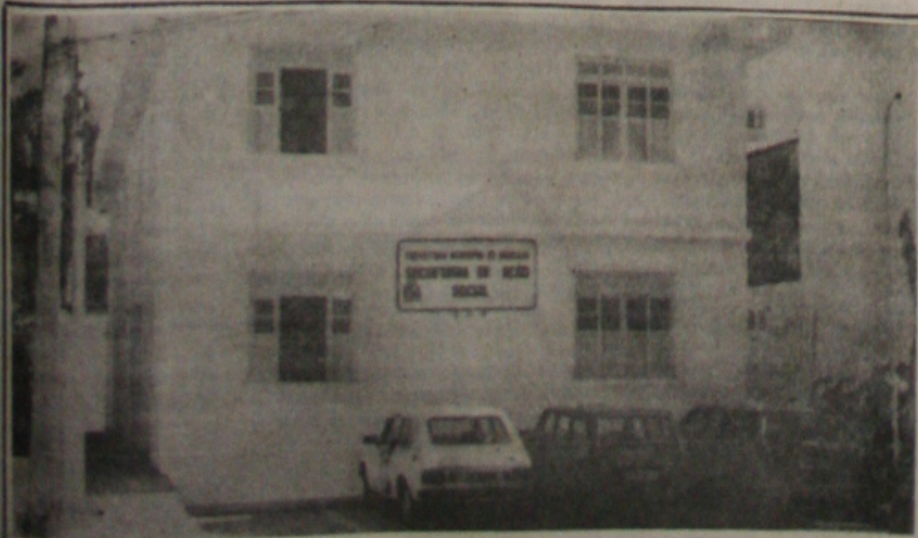
O prédio da Secretaria Municipal está sem água desde ontem