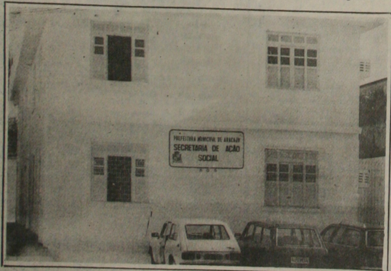
O Deso cortou o fornecimento de água Ação Social por falta de pagamento.