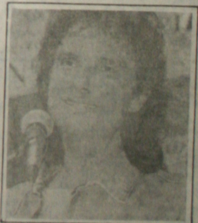
Roberto Carlos vem aí.