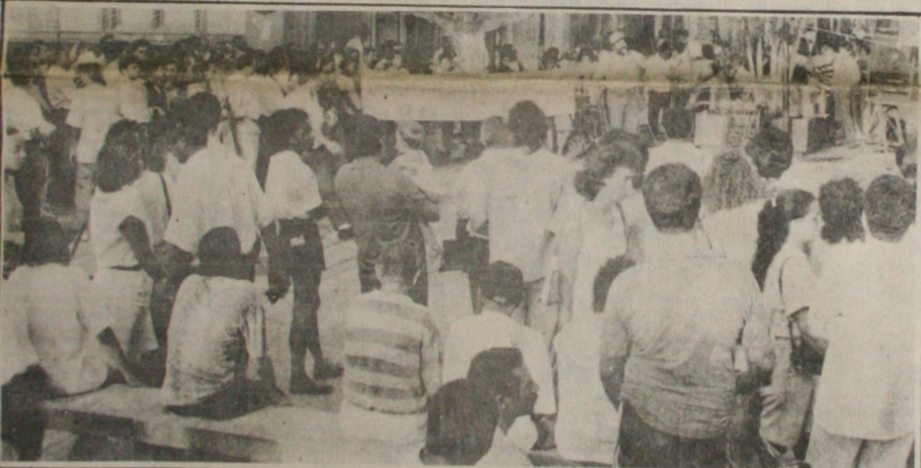
O ato do calçadão contra o plano reuniu dezenas de pessoas