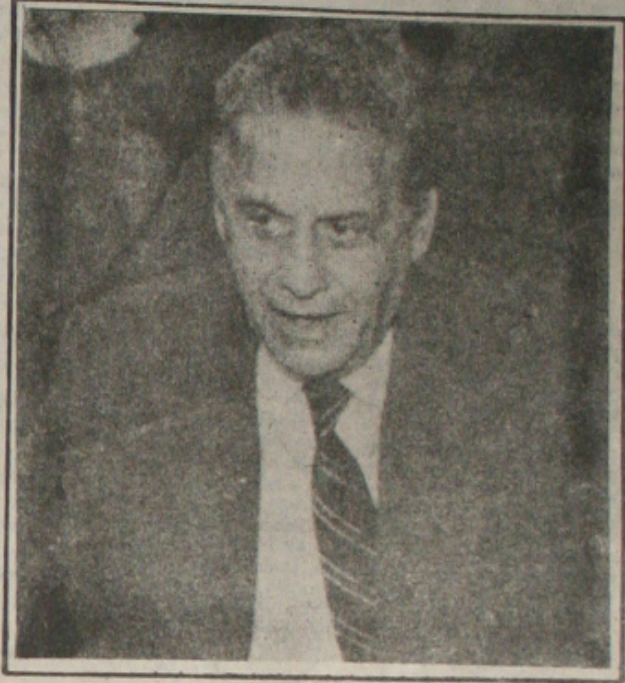
Fernando Henrique quer evitar a votação da MP hoje

Gonzaga Mota (PMDB-CE) deverão ser colocadas em votação, como a reposição das perdas salariais na data-base dos trabalhadores, servidores públicos e aposentados, aumento do salário mínimo para US$ 100, até o final do ano, entre outras. Se a medida não for votada nesta quinta-feira, será reeditada na próxima semana pelo Governo. (Página 4B)