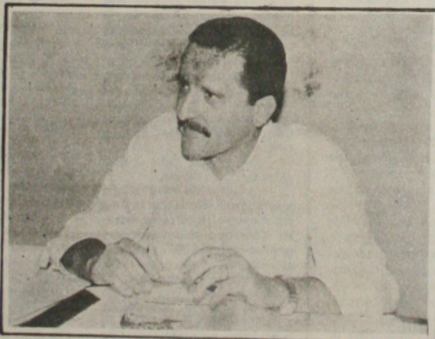
José Carlos Machado: críticas e elogios ao Prefeito Jackson Barreto.

Sílvia Garcez da Tat's Chocolates, recebeu um grande número de encomendas para a Páscoa. São ovos de chocolates e bombons recheados com licor e geléias de frutas. Os bombons têm embalagens especiais para serem presenteados com muito carinho.