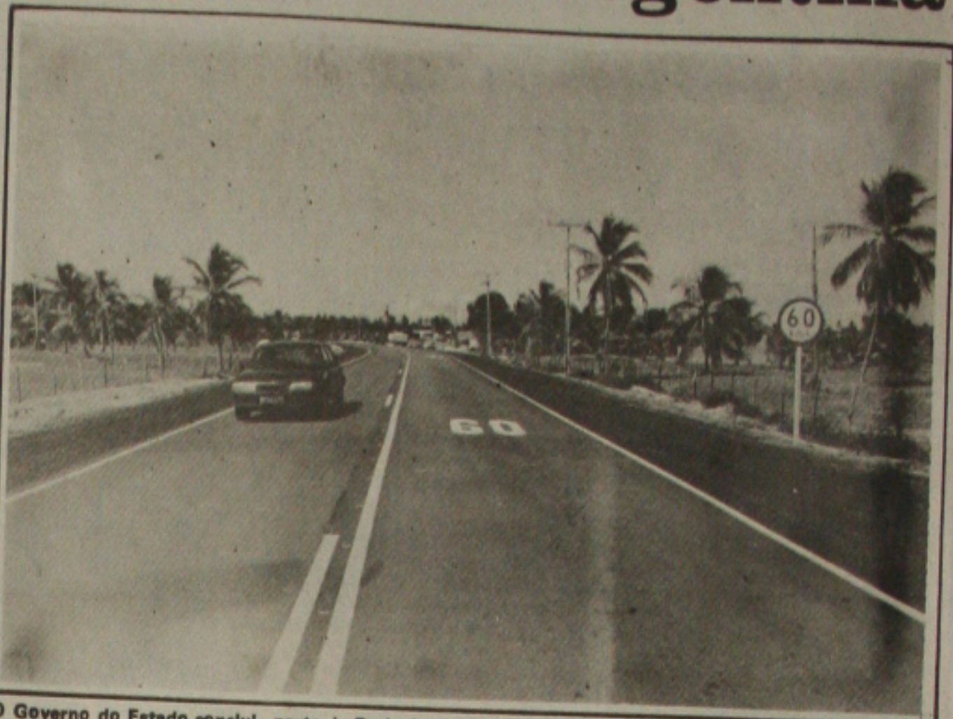
O Governo do Estado conclui parte da Rodovia das Dunas, que liga Aracaju a Salvador.

Nos supermercados é fácil encontrar outras espécies. O cambuçu está sendo comercializado a CR$ 4.555, o atum em posta custa CR$ 2.165 o quilograma, o cavala CR$ 5.140, o pescada branca CR$ 2.950 enquanto que o cavalinha e o pescadinha, as espécies importadas da Argentina custam CR$ 950 e CR$ 990, respectivamente.