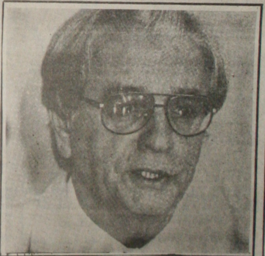
Itamar ficou satisfeito com a afirmação dos testes

cionou-se com o fato de Itamar ter confirmado o nome do embaixador Roberto Ricúpero para sucedê-lo antes que formalizasse sua saída do Governo. Já o presidente reclama da tentativa que os parceiros fizeram de discutir em público o nome do sucessor do ministro, quando nem estava no País. (Página 4B).