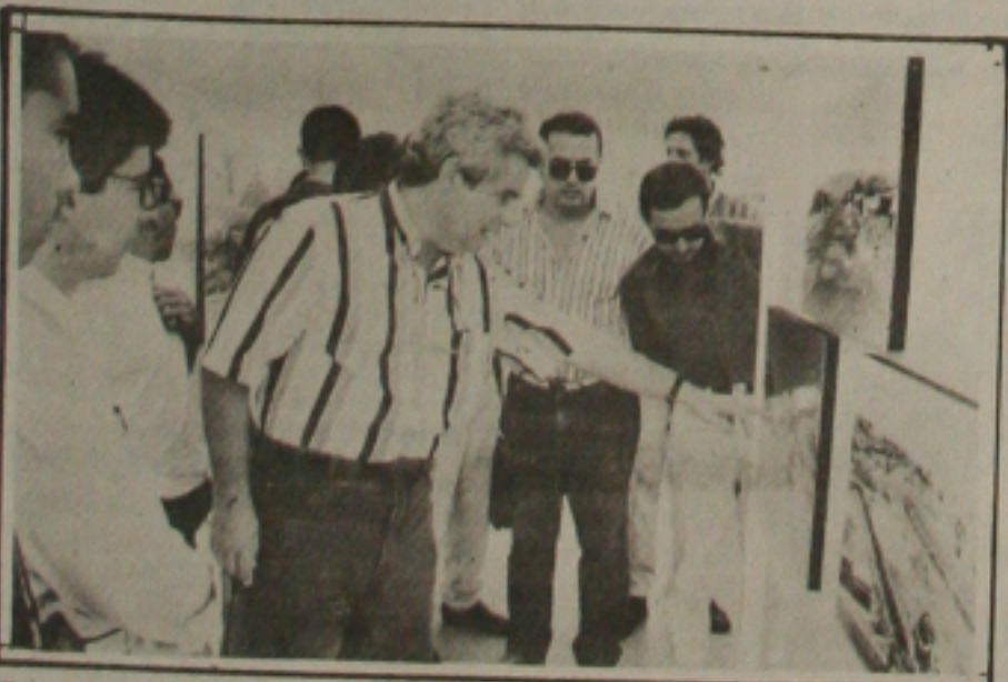
Exposição da Cehop termina amanhã à noite.

Também no dia de ontem a exposição foi visitada pelo embaixador da Áustria, Andreas Somogyi, Embaixador da Alemanha Herbert Limmer, embaixador das Comunidades Europeias Ian Tindall Boeg que estão em Sergipe desde o último domingo.