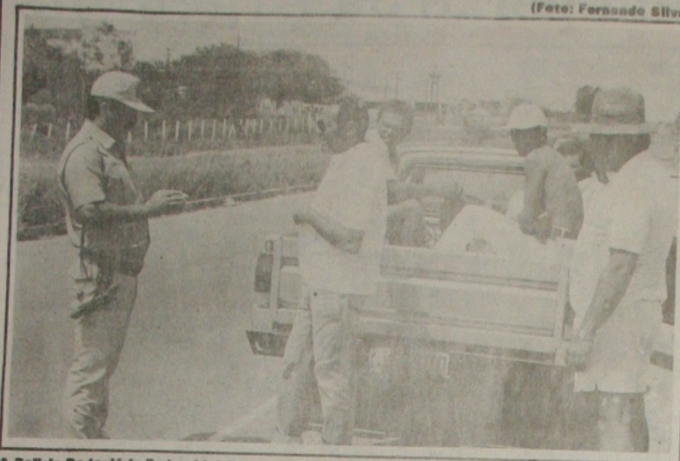
A Polícia Rodoviária Federal inicia amanhã a Operação Semana Santa.