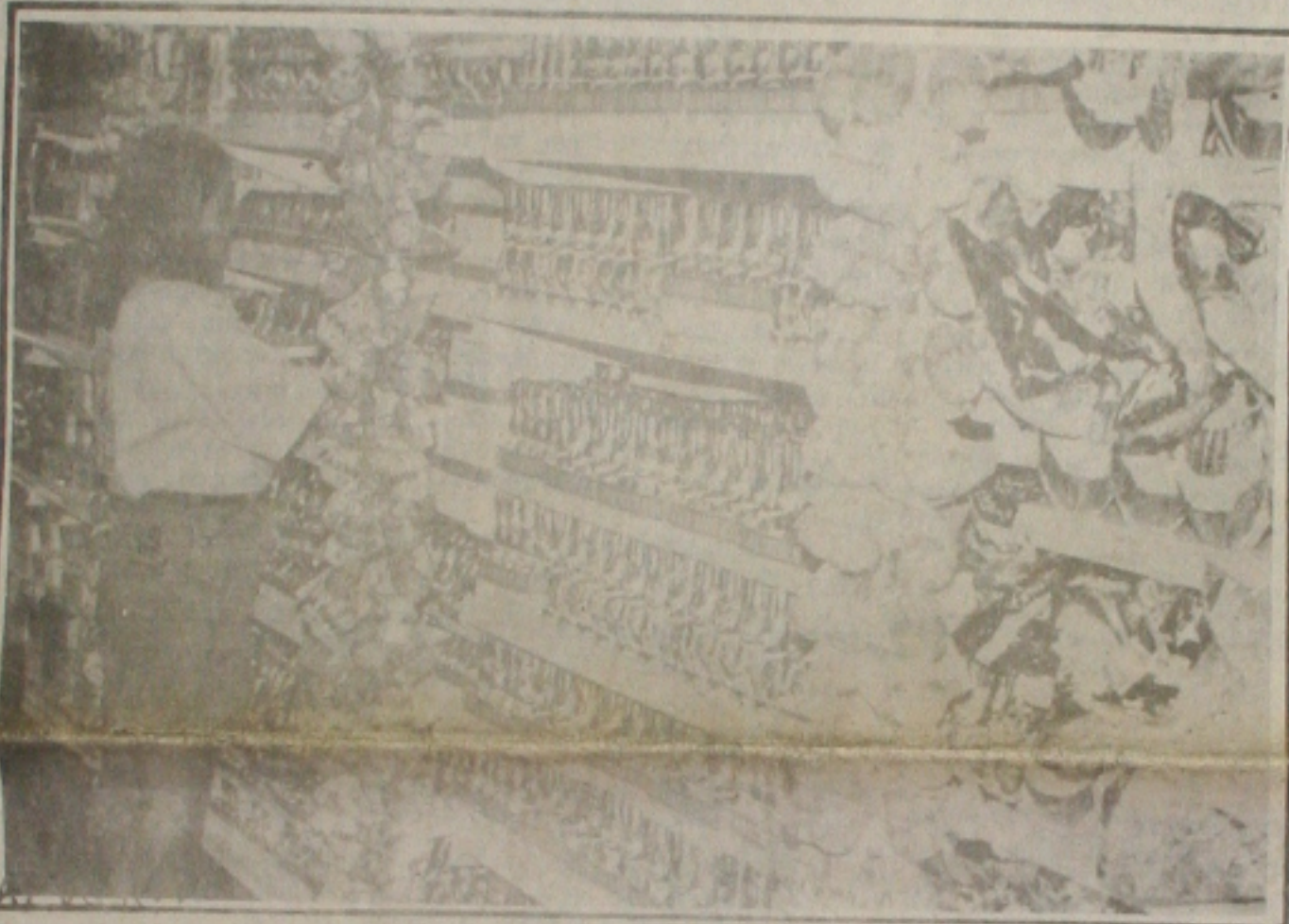
As vendas de ovos de Páscoa devem crescer a partir de hoje.

Os preços altos parecem estar afetando este ano a tradição de presentear parentes e amigos com os Ovos de Páscoa na Semana Santa. Até ontem, as vendas dos chocolates em formato de ovo, estavam aquém das expectativas dos comerciantes, que esperam que elas aumentem a partir de hoje até quinta-feira. Outro produto muito consumido na Semana Santa, o peixe, também está com preços elevados. Uma rede de supermercados da capital já adquiriu cerca de 40 toneladas de peixe importado da Argentina, como forma de atrair a clientela. (Página 6A).