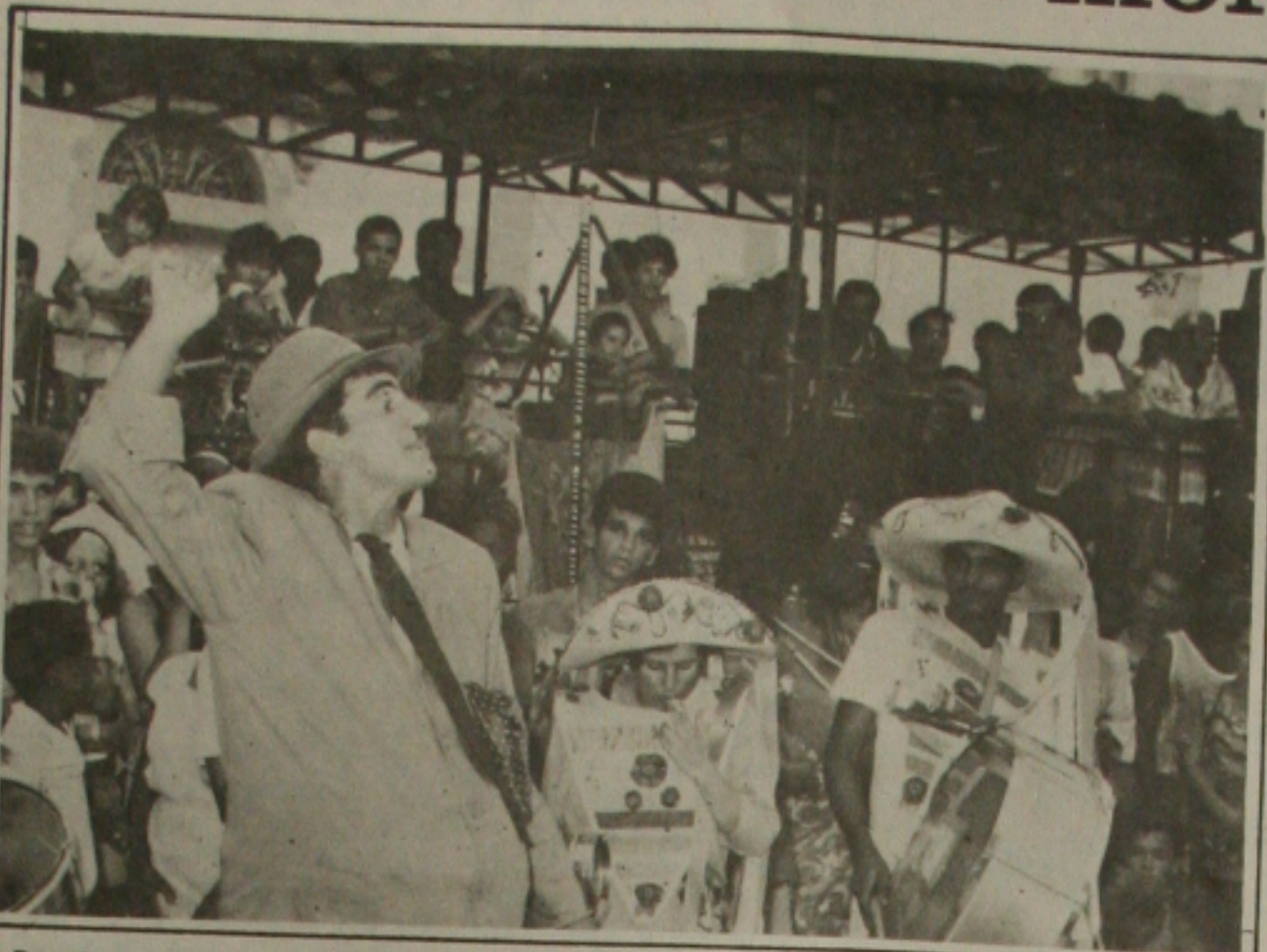
A Premiação na área do teatro foi transferida para uma outra data.

A Mostra Sergipana de Teatro foi criada pelo Cultart/Proext com o objetivo de proporcionar aos artistas sergipanos uma oportunidade de exibirem seu talento, bem como para difundir e valorizar o teatro no Estado. Cinco espetáculos apresentados durante os 10 dias da mostra concorrem ao Arlequim de Mármore: a peça Marly Megaló, apresentada pelo Grupo Imagem no dia 17, O Palhaço Nu, encenada pelo Grupo Cenário de Espetáculos no dia 18, A Farsa dos Opostos, exibida pelo Imbuca Produções Artísticas no dia 19, Juquinha e o Mostro, teatro de bonecos da Companhia Pé de Moleque, exibido no dia 20, e, finalmente, As Presepadas de Benedito, teatro de bonecos, do grupo Mamulengo de Cheiroso, apresentado no dia 25 no próprio Cultart. A Mostra teve o apoio do Governo do Estado, através da Secretaria da Cultura e Fundesc, do Sated e do Centro Editorial e Audiovisual da UFS - CEAV.