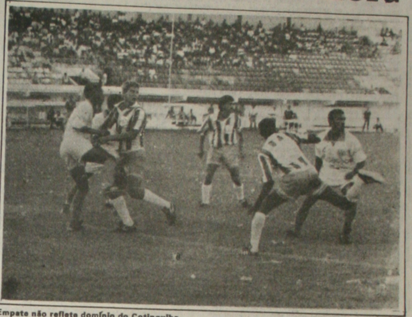
Empate não reflete domínio do Cotiguiuba.