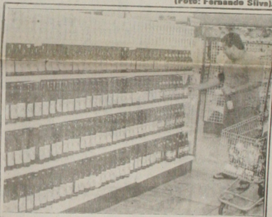
A cerveja passa de CR$ 2,4 mil mais de CR$ 11 mil a caixa.

vendas também voltam ao patamar normal, nunca se deixa de vender", precisou Nelson Alves de Vasconcelos Filho, gerente de mercearia de uma loja de uma grande rede de supermercados da capital.