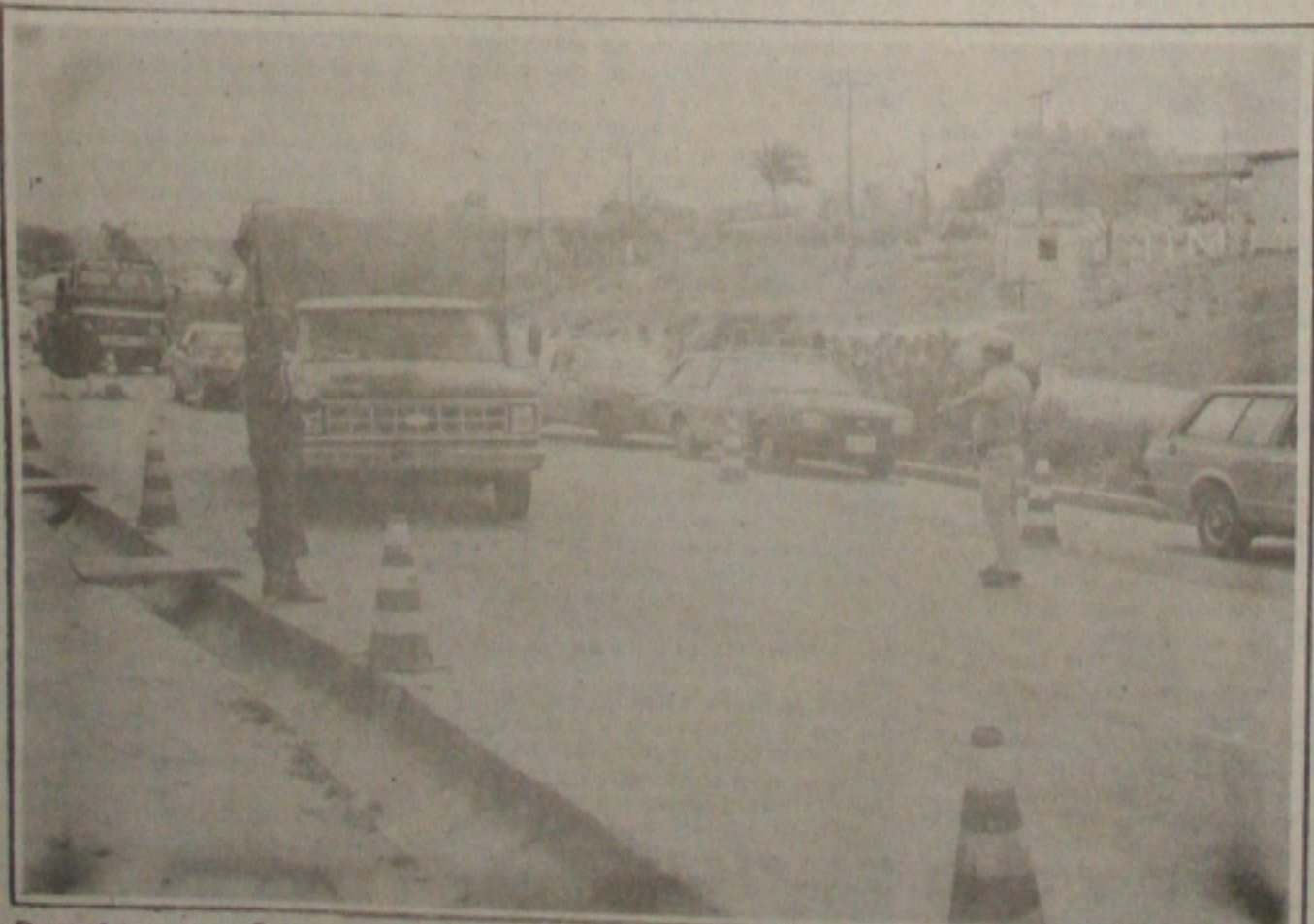
Durante a operação, os patrulheiros fiscalizarão toda a documentação e equipamentos de segurança dos veículos.

O fim de semana dos servidores públicos federais do Executivo começa nesta quinta-feira, segundo aviso circular da Casa Civil da presidência da República, publicado no Diário Oficial de ontem. O aviso palaciano contraria determinação da Secretaria de Administração Federal (SAF), que há quatro dias informou, via ofício, a todos os órgãos públicos que o expediente seria normal na Quinta-Feira Santa. Segundo o aviso circular, foi o próprio presidente Itamar Franco quem decidiu tornar feriado para o funcionalismo a quinta e a sexta-feira "por motivo das solenidades da Semana Santa". Para se defender da contra-ordem do Palácio, a SAF informa que se baseou no telex-circular número 1, de 11 de janeiro deste ano, para decretar a quinta-feira dia normal de trabalho. De acordo com essa circular, só a Sexta-Feira Santa seria feriado.