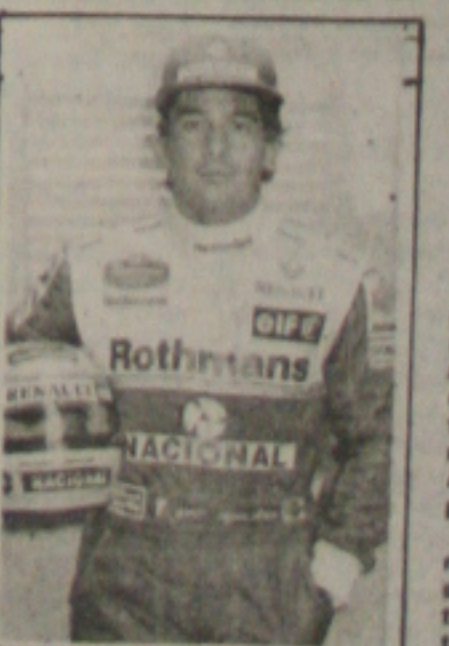
Senna assume culpa pelo erro.

Apenas os pilotos brasileiros permaneceram na terra. Ayrton Senna vai fazer uma grande festa hoje no aeroporto de Congonhas para o lançamento dos carros AUDI no Brasil, onde ele será o representante exclusivo. Sobre a sua rodada em Interlagos, ele admitiu que errou e se desculpu com a equipe e também com a torcida. Senna promete trabalhar duro daqui pra frente no seu Williams. Os outros brasileiros da Fórmula 1, Cristian Fittipaldi e Rubens Barrichello desceram em São Paulo. Cristian disse no domingo, que apesar dos problemas apresentados no câmbio de Arrows, ele confia no potencial da equipe, onde espera marcar muitos pontos na temporada. Ainda não foi confirmado o teste que a Arrows fará em Silverstone na próxima semana. Já Rubens Barrichello se recupera na capital, depois de ter selvado a pátria brasileira em Interlagos, no domingo. Rubinho também deve fazer um novo teste com a Jordan na próxima semana, mas o local ainda não confirmado.