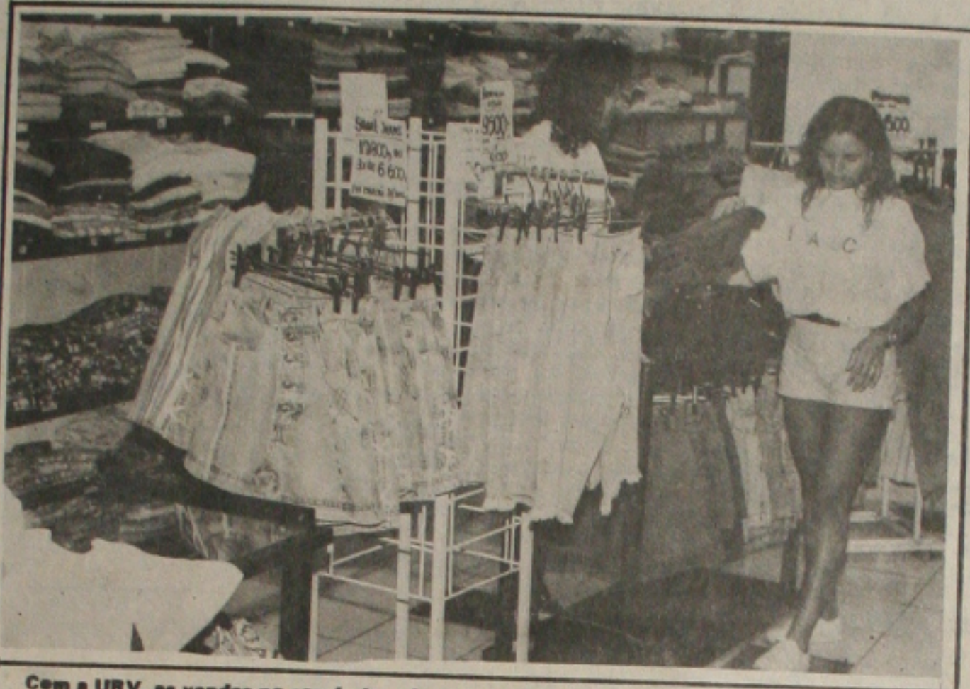
Com a URV, as vendas no comércio caíram mais ainda este mês

O decreto nº 14.446 diz que ficam excluídos de sua aplicação os serviços considerados essenciais, ou que, por sua natureza ou características especiais, não podem ter alterados os seus períodos diários de execução ou não devam sofrer solução de continuidade.