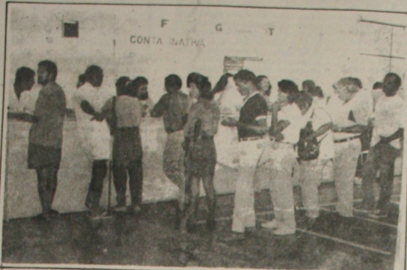
De acordo com a Caixa Econômica, os saques das contas inativas do FGTS caíram 50%.