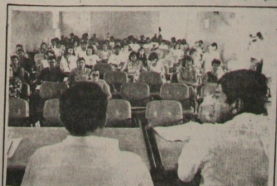
A LBA realiza encontro com entidades.