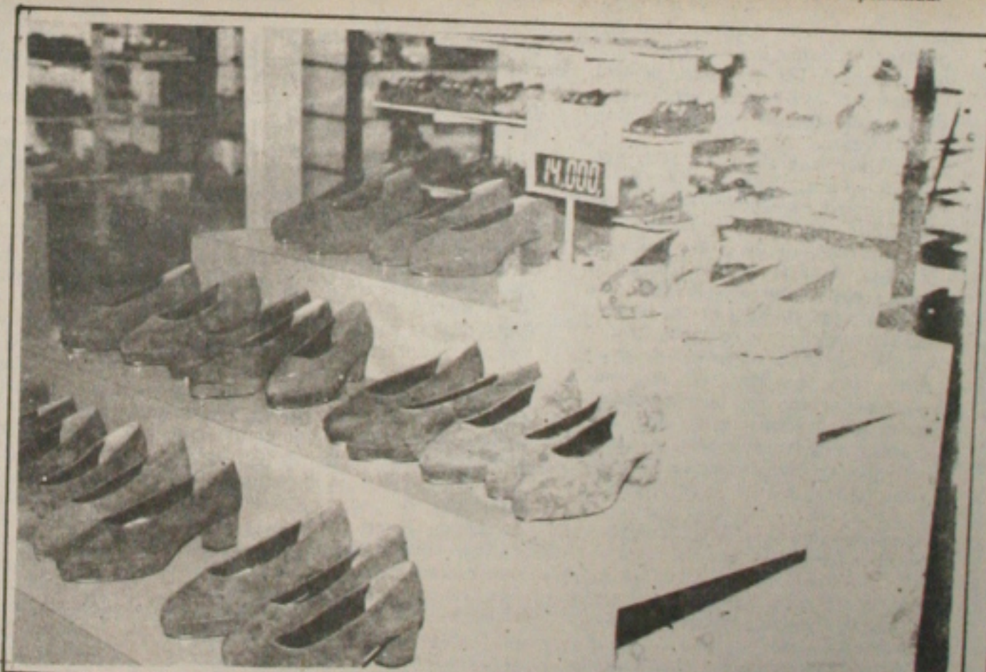
A implantação da URV reduziu as vendas de calçados em Aracaju.