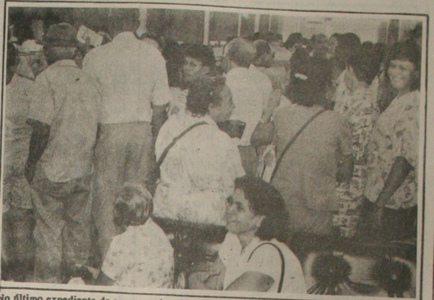
No último expediente da semana e do mês os bancos registram grande movimento.