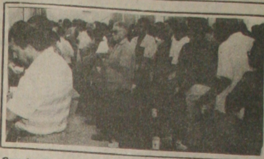
Grandes filas se formaram nos bancos ontem

A maioria das agências bancárias em Aracaju registrou um grande movimento ontem, último dia útil antes do feriadão da Semana Santa. A maior parte das operações foi de saques, segundo os gerentes dos bancos, que agora só reabrem na segunda-feira. (Página 5A).