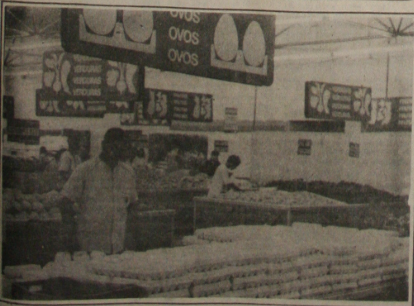
Com a campanha, os consumidores têm acesso a informações sobre os hortifrutigranjeiros

Segundo Antônio Manoel, a reivindicação dos taxistas obteve apoio incondicional do governador João Alves Filho, que determinou os estudos que resultaram na proposta que acaba de ser aprovada pelo Confaz. A isenção recai sobre as transações comerciais com carros novos, com potência bruta até 127 HP, quando destinados a motoristas profissionais. O secretário prevê que, com a isenção do ICMS, muitos taxistas terão condições de trocar o carro velho por um novo, proporcionando também um melhor serviço à comunidade.