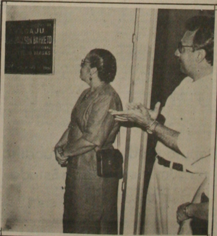
Inaugurada a reforma do presidente Getúlio Vargas.