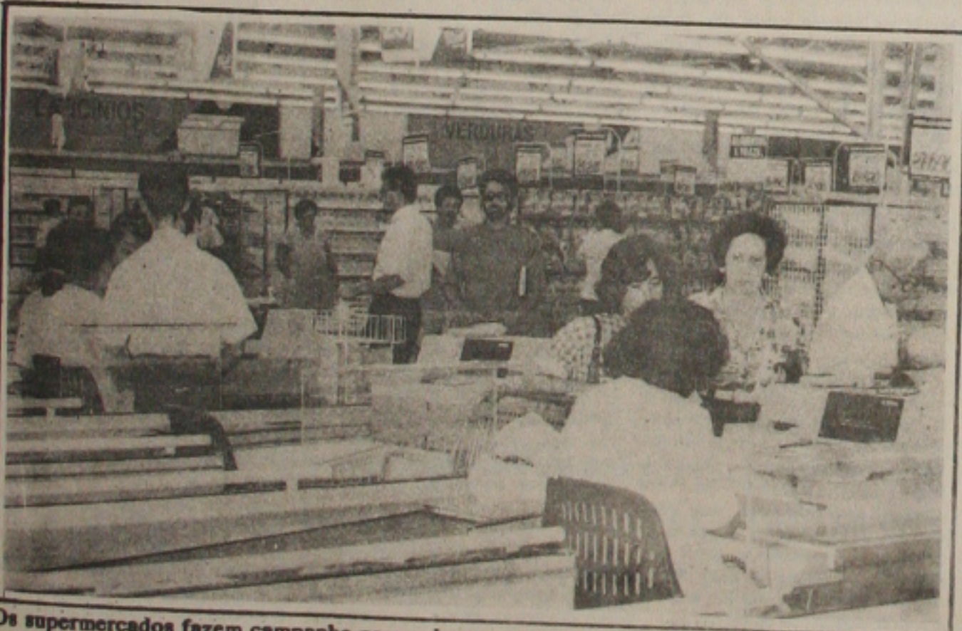
Os supermercados fazem campanha para orientar o consumidor sobre armazenagem de produtos.

De acordo com o informativo hortifrutícola, o abacaxi, por exemplo, começa a ser produzido no mês de junho e para este ano as previsões são favoráveis.