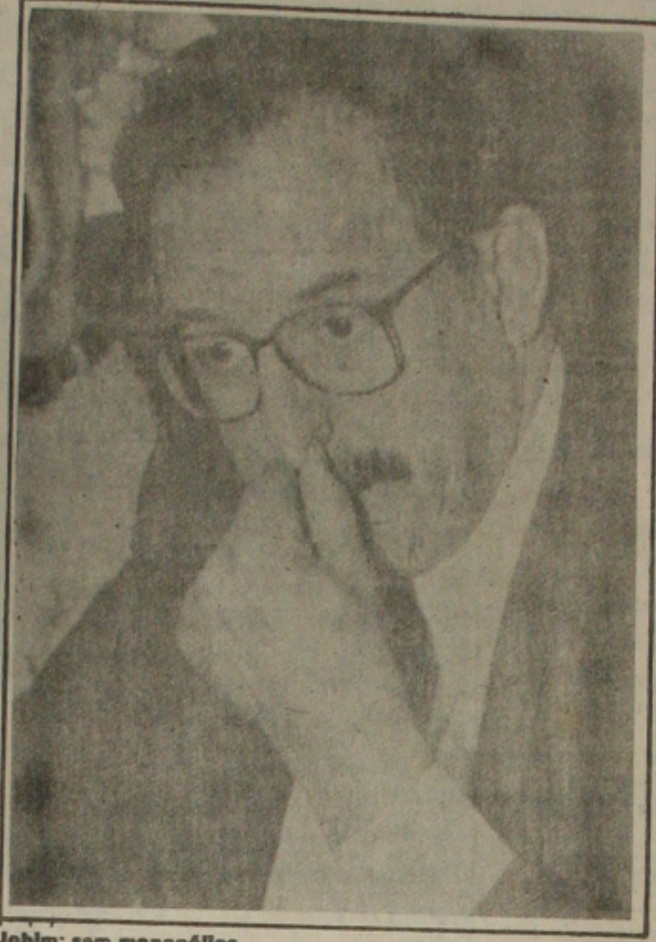
Jobim: sem monopólios

- Alguém está dizendo por aí que o PFL separaria o presidente Itamar Franco do candidato Fernando Henrique. Não acredito. Afinal, o PFL e o governo tem estado próximos. Basta ver as votações e a defesa do plano econômico no Congresso. O PFL tem apoiado o Governo - afirmou Jereissati.