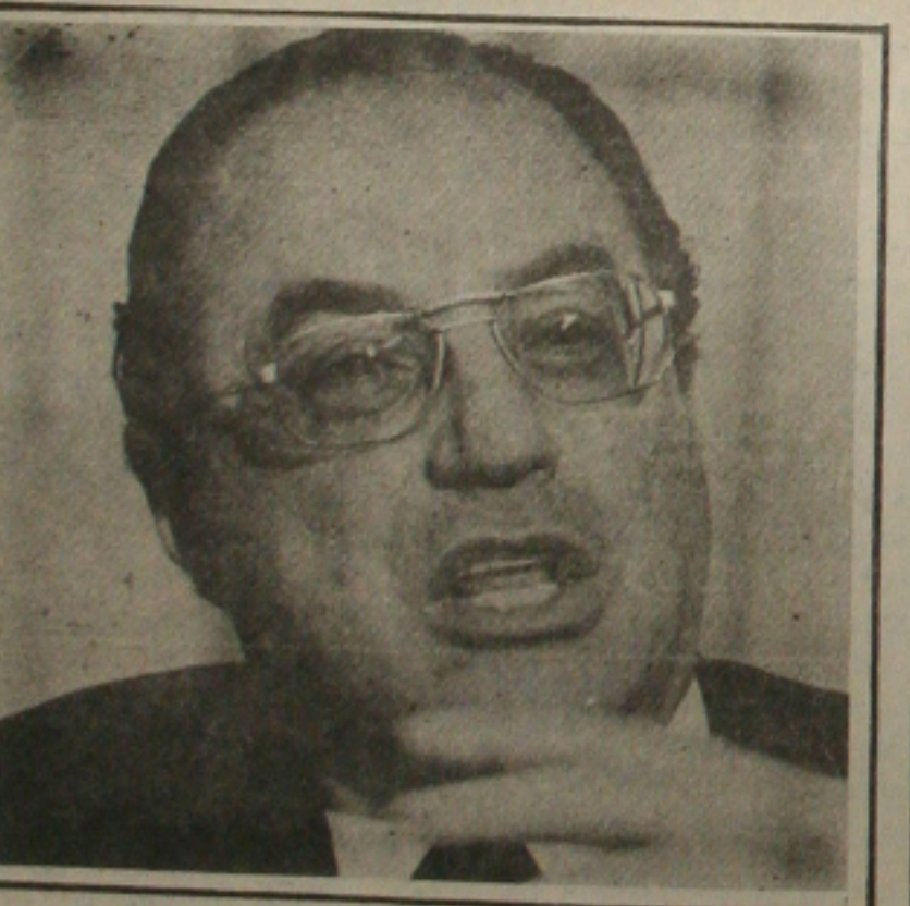
Maluf: difícil decisão