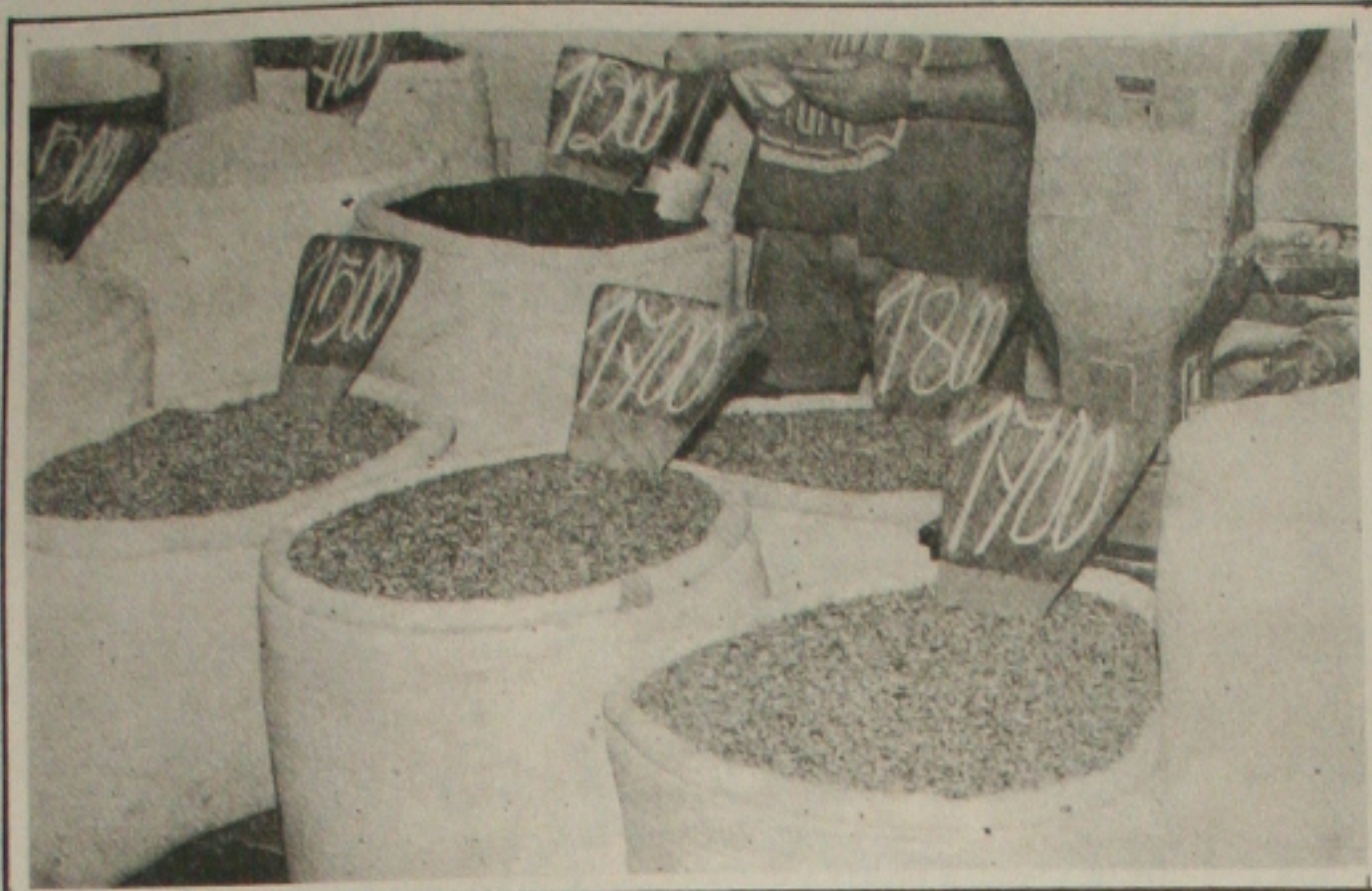
O feijão foi quem mais contribuiu na inflação da cesta básica em março.