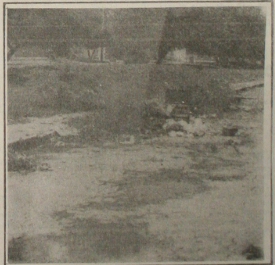
No Beira Mar, a coleta de lixo é irregular

Muito lixo espalhado pelas ruas e a proliferação de mosquitos e muriçocas são os principais problemas que enfrenta atualmente a comunidade do conjunto Beira Mar I, na Atalaia. Como a coleta de lixo realizada pela Prefeitura de Aracaju é irregular, muitos moradores acabam jogando os dejetos residenciais no meio da rua. Com as chuvas que caíram nos últimos dias, o problema se agravou mais ainda, aumentando também os riscos para a saúde das crianças. (Página 5A).