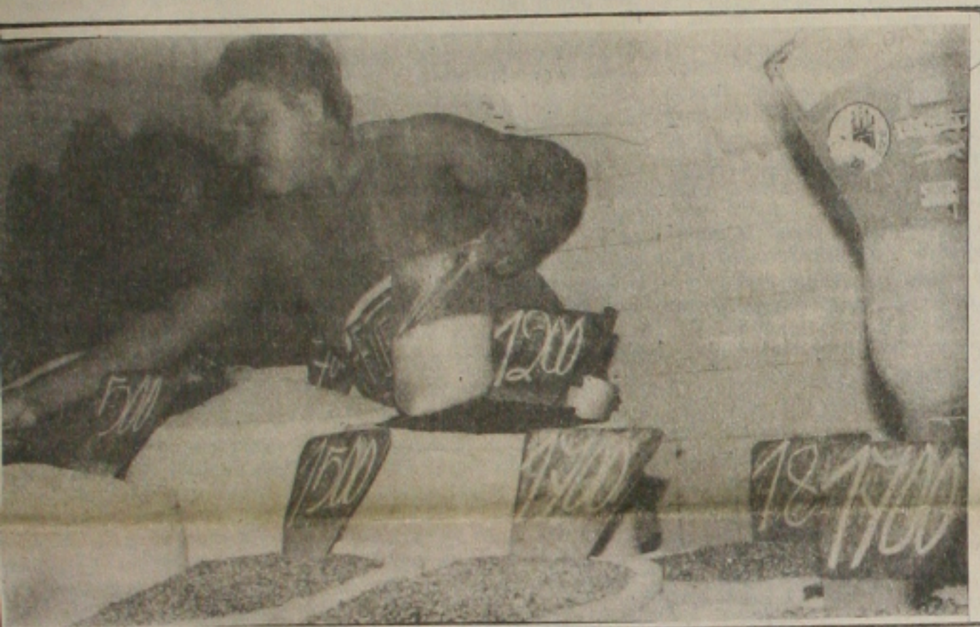
O feijão outra vez puxou a alta da cesta básica em Aracaju

O procurador geral de Justiça do Rio de Janeiro, Antônio Carlos Biscaia, divulgou ontem à tarde, uma lista com mais de 200 nomes, entre políticos, advogados e juizes, acusados de envolvimento direto com o jogo do bicho e que teriam recebido altas quantias provenientes da contravenção. Integram a listagem, o atual prefeito e o ex-pre-