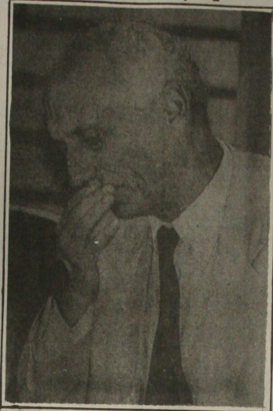
Ricupero: regras para mensalidades

As regras do roteiro são para que os candidatos percorram os mesmos Estados previstos para cada data, mas cada um deve estar em um deles em diferentes horários. Logo em seguida a primeira incursão dos candidatos, no dia 22, será a vez dos Estados de Sergipe, Alagoas e Pernambuco. Dia 23, Paraíba, Rio Grande do Norte e Ceará; dia 24, Piauí e Maranhão; dia 28, Rio Grande do Sul, Santa Catarina, e Paraná; dia 29, São Paulo, Mato Grosso do Sul e Minas Gerais; dia 30, Mato Grosso, Rondônia e Acre. Já em final, no dia 10, Roraima e Amazonas; dia 6, Amapá e Pará e, finalmente, dia 7, Tocantins, Goiás e Distrito Federal.