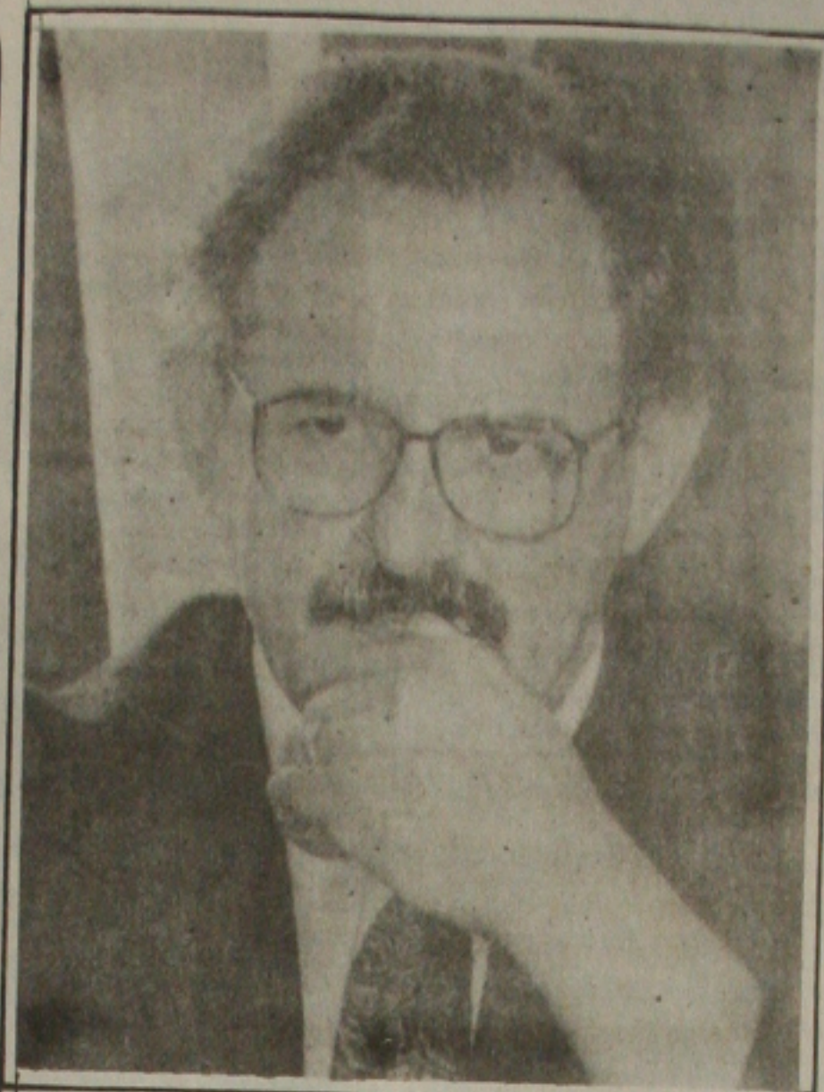
Jobim: alterar a Constituição

Embora Bisol seja o nome preferido pelos petistas, no PSB sua indicação enfrenta a resistência do presidente do partido Miguel Arraes e de alguns diretórios.