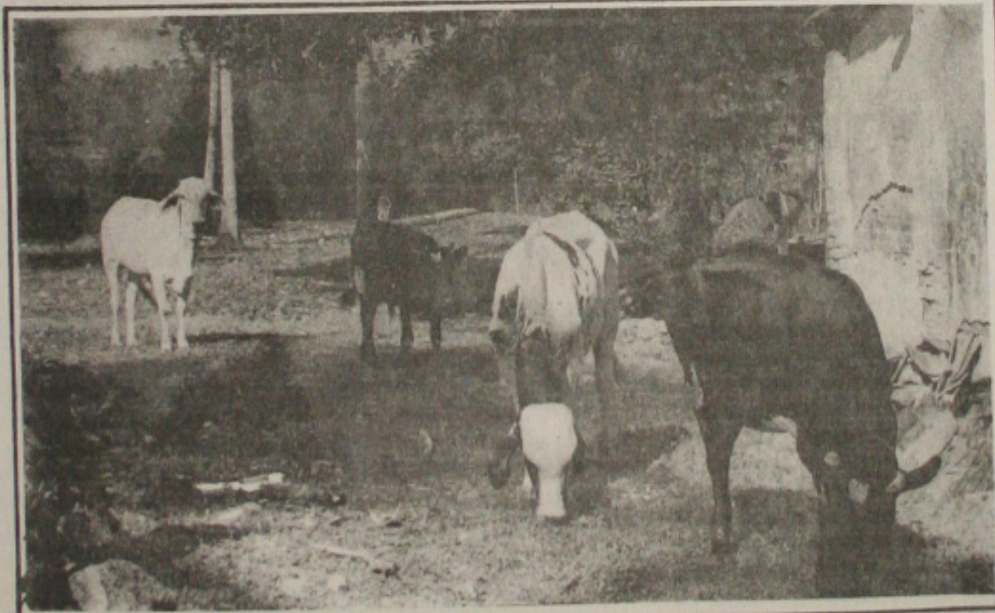
A Emdagro lança hoje em todo o Estado a campanha de combate a febre aftosa.