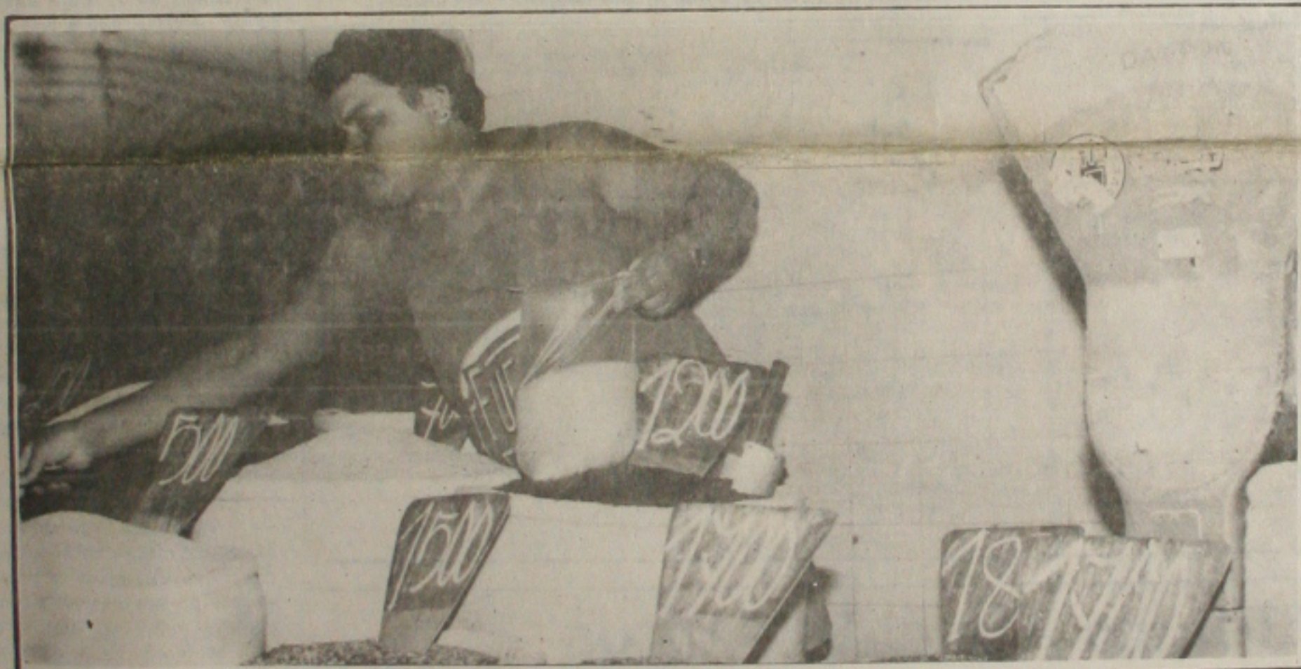
O feijão puxou a alta do custo de vida na capital sergipana, em março.

Os servidores públicos federais entram em greve na próxima terça-feira em Sergipe em adesão ao movimento nacional da categoria, que reivindica, entre outros pontos, reajuste salarial imediato com base no Índice de Custo de Vida calculado pelo Dieese. Ontem, o comando estadual unificado dos servidores se reuniu para definir formas de mobilização da categoria. No primeiro dia de paralisação, será realizado um ato público, na Praça Fausto Cardoso, às 15 horas, em protesto contra a Revisão Constitucional, o plano FHC e a ameaça de quebra dos monopólios do petróleo e das telecomunicações. (Página 4A).