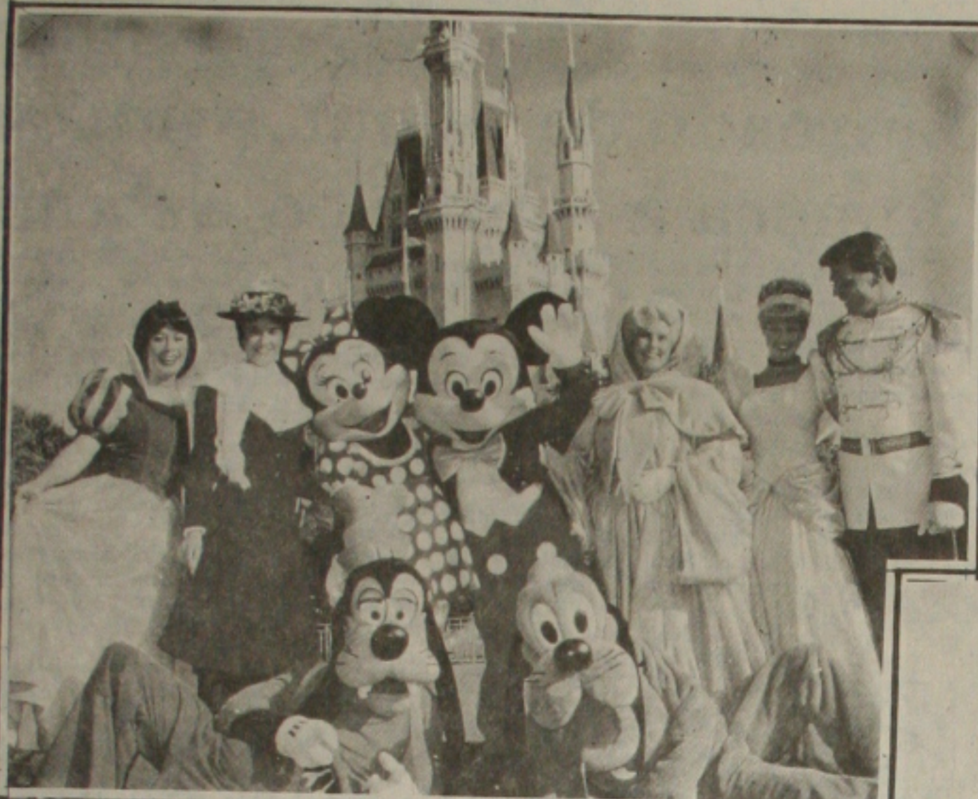
Os personagens Disney e os parques de Orlando atraem cada vez mais os turistas sergipanos.