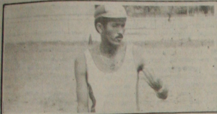
Rubens terá três desfalques para o jogo de domingo.