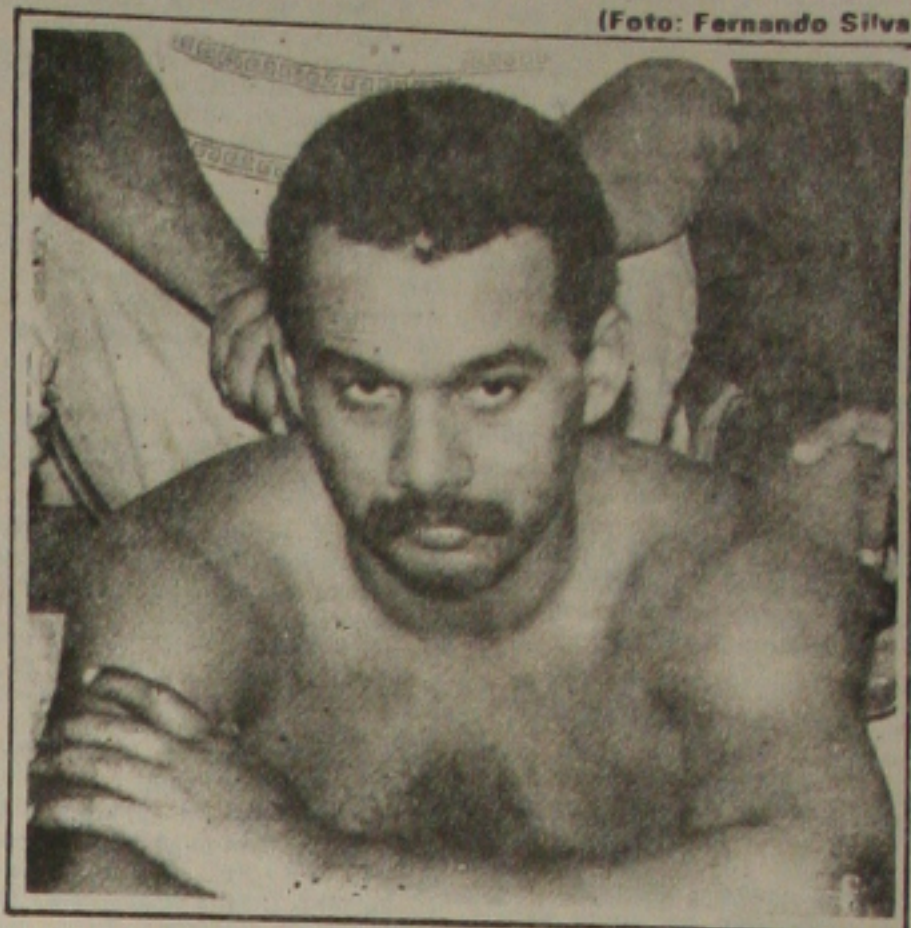
Carira mantém um depósito com produtos roubados

Atualmente, o concurso é patrocinado pelo governo francês e por grandes empresas privadas: BNP e Fujisanki Communication Group de Tokyo.