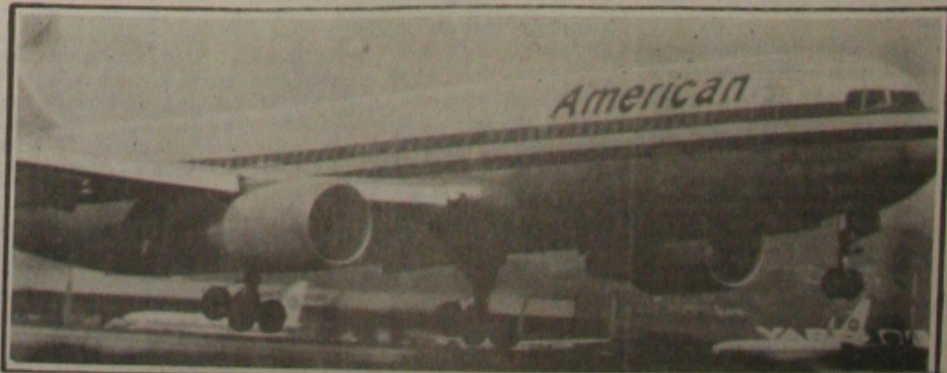
Boeing 767 da American pousado em Guarulhos (SP). De São Paulo há dois serviços diários para Miami e um para Nova York, todos "non stop".