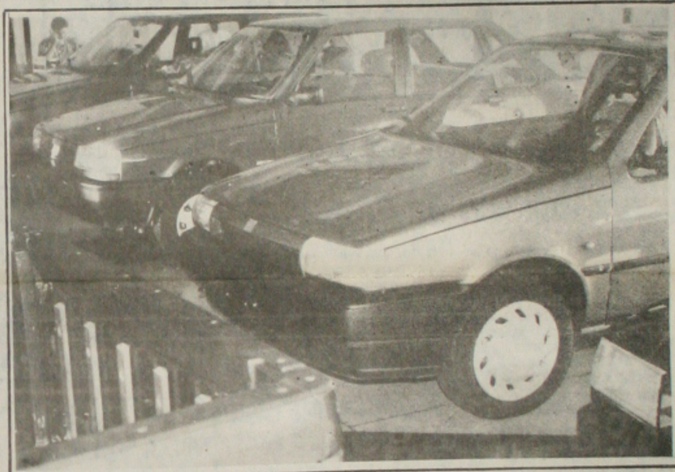
O mercado de carros novos começa a reagir em Sergipe

está custando 36.299 URVs, enquanto o mais barato e também o mais procurado é o Gol 1000 que custa 7.242 URVs. Nestes valores estão excluídas as taxas de frete avaliada em 600 URVs. De acordo com as observações de Carlos Lira, há uma grande aceitação dos modelos Logus que custa 18.000 URVs, o mais comum e há uma variação de até 28.000 URVs dependendo dos opcionais, e também do Parati cujo valor varia entre 13.700 URVs a 23.000 URVs, dependendo dos opcionais.