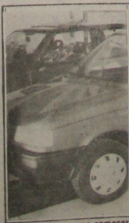
As vendas de carros começaram a melhorar nas revendedoras.

Em retração desde o início do ano, o mercado de carros novos em Aracaju começa a apresentar sinais de recuperação. A expectativa dos empresários do setor é que as vendas cresçam cerca de 20 por cento até o final do mês. Os veículos da chamada linha popular são os mais procurados pelos consumidores, que, apesar da implantação da URV, não têm deixado de fechar negócios nas revendedoras. (Página 5A).