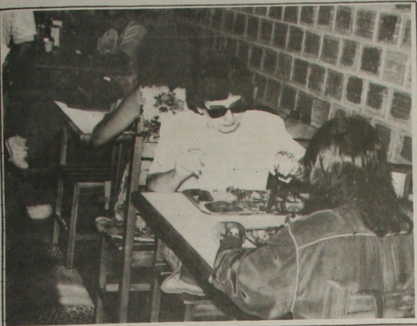
A alimentação foi quem mais contribuiu para o crescimento da inflação em março