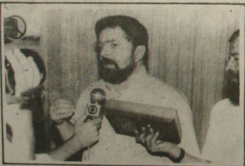
Luís Inácio Lula da Silva

Para sacar a restituição no banco o contribuinte deve dirigir-se a agência indicada