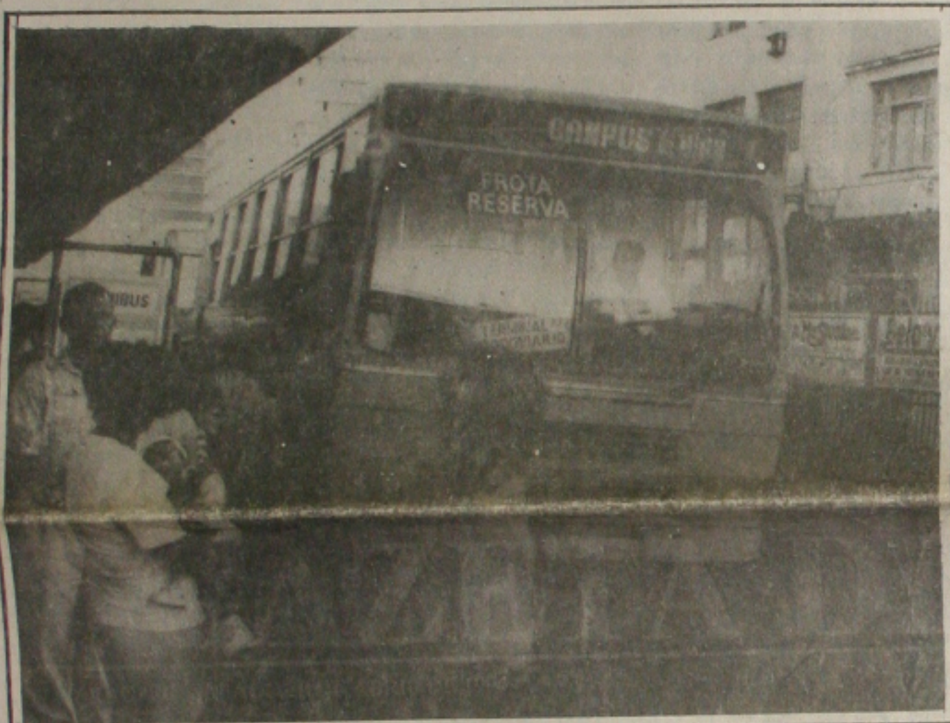
A partir de amanhã, os usuários pagarão mais caro pela tarifa

A inflação cairá de forma rápida e abrupta quando o real entrar em circulação. Foi o que garantiu ontem o ministro da Fazenda, Rubens Ricúpero, ao participar de almoço em São Paulo organizado pelo Movimento Cidadão contra a Inflação. Perante cerca de 500 empresários, Ricúpero disse, no entanto, que há