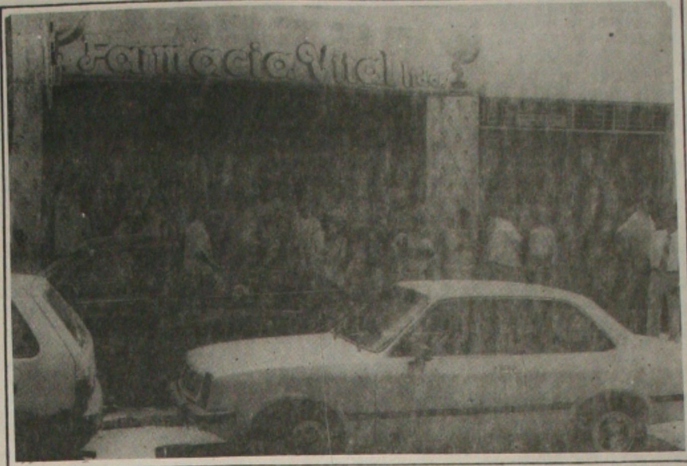
O comerciante foi morto com 9 tiros dentro desta farmácia na noite do dia 20 de março.