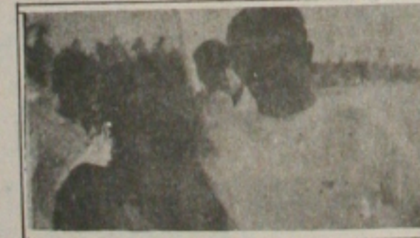
Esta jornalista ladeada pelo fotógrafo Edson Araújo.