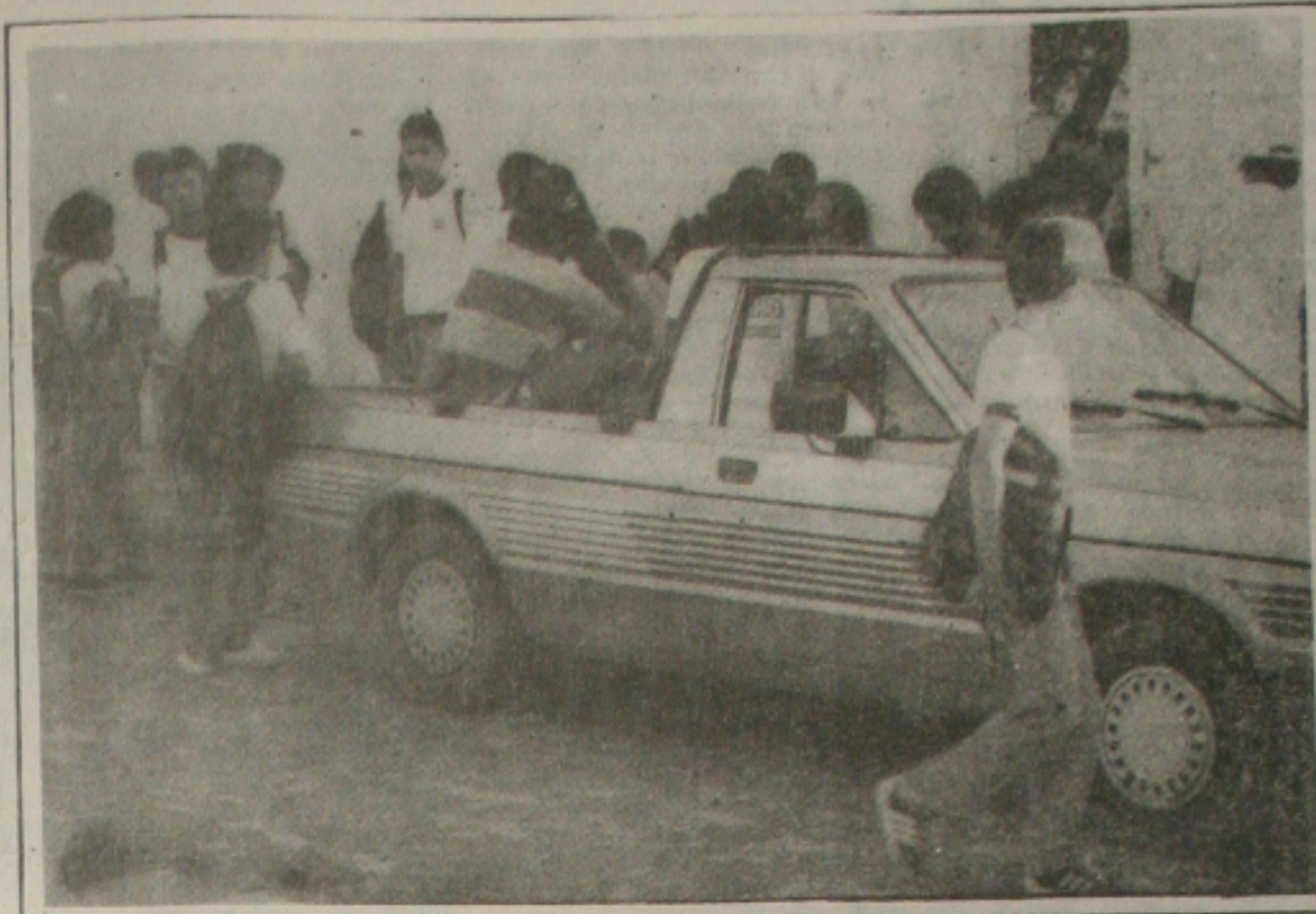
Com a liminar da Justiça, as escolas não poderão cobrar a mensalidade no início do mês.