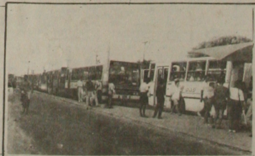
Motoristas não têm condições de dirigir ônibus

MOTORISTA I - O irresponsável motorista ainda saiu xingando o anelão. Alguns passageiros declararam que o motorista estava embriagado, alguns populares ainda tentou comunicar o fato a fiscalização, da SMTU no terminal, mas um