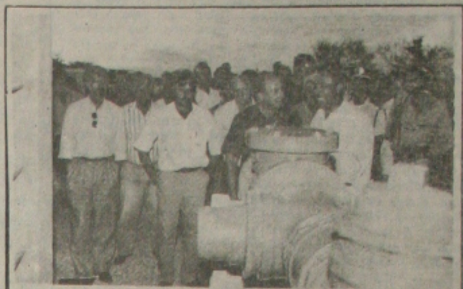
Quinta-feira, o governador visitou várias obras em companhia do prefeito de Lagarto, José Raymundo Ribeiro

O Governo inaugura nos próximos dias a subadutora de reforço do Sistema Piauítinga, em Lagarto, que levará água potável de boa qualidade para cerca de 130 mil pessoas da região centro-sul e do semi-árido sergipano. Nela estão sendo investidos US$ 600 mil, o que, na opinião do governador João Alves, "é o preço da qualidade de vida". (Página 6A).