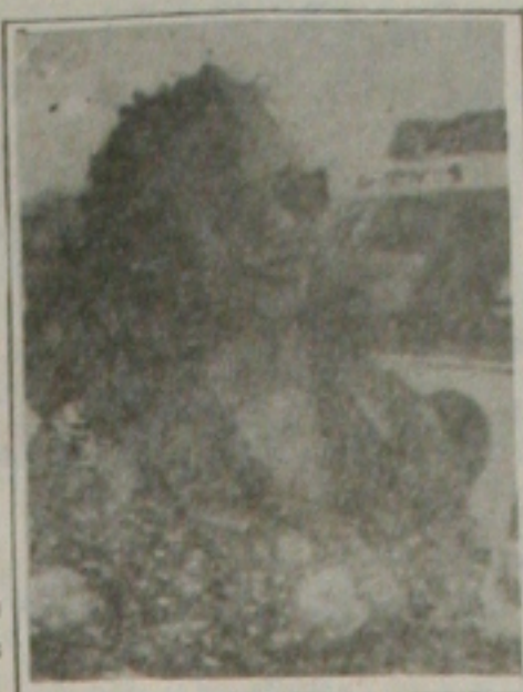
Esta jornalista recepcionando amigos...