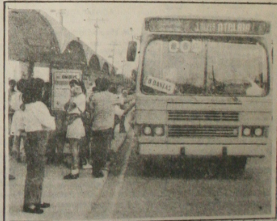
A tarifa dos ônibus urbanos está defasada segundo os empresários do setor.