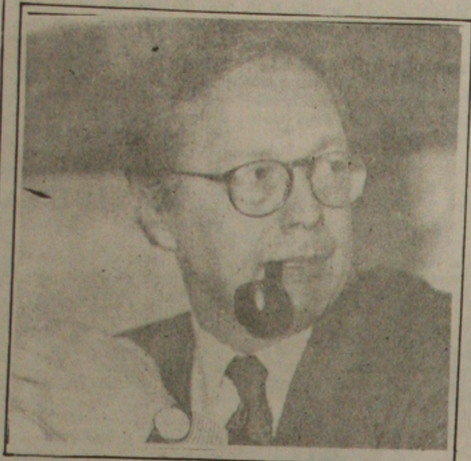
Malan acha que brasileiro tem que perder hábito da inflação.