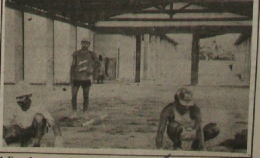
A Emurb recupera mais uma escola do Município.