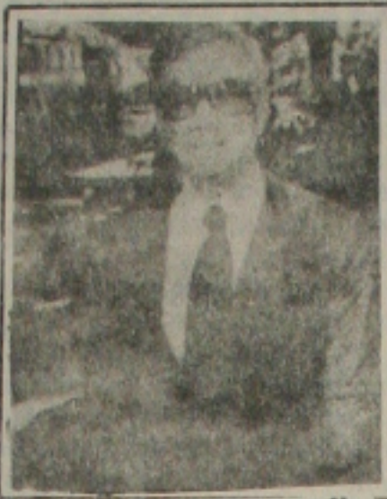
Castor corrompeu coronéis