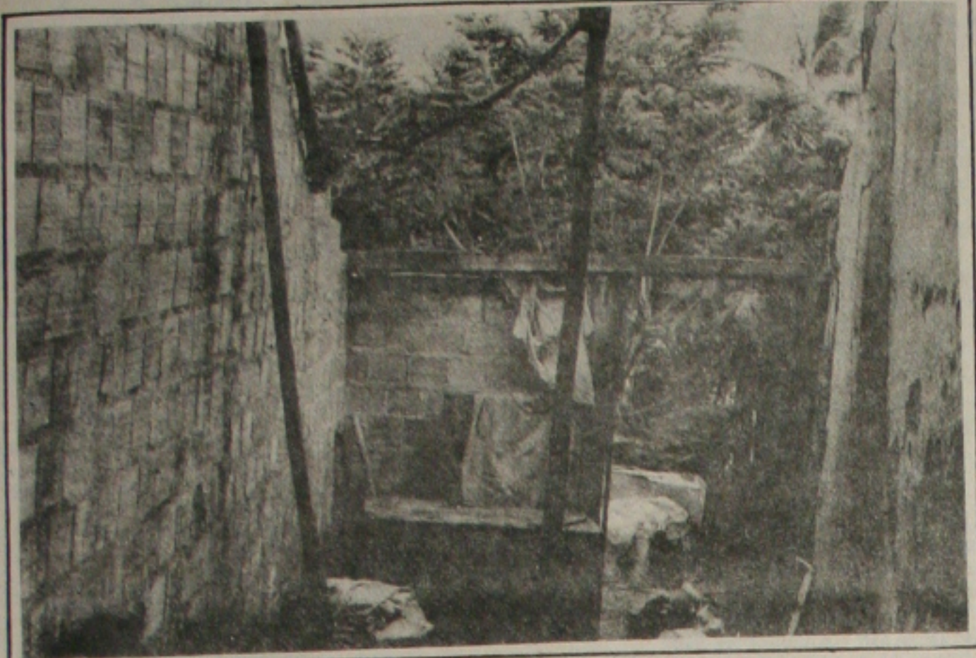
A casa não resiste as constantes chuvas e desaba com 10 pessoas; ninguém ficou ferido

Enquanto no sertão os agricultores torcem pela chegada das chuvas, na capital, a população sofre com suas conseqüências. Mais um desmoronamento foi registrado ontem pela manhã em Aracaju. A casa de número 100 da Rua Joaquim Inácio, no Bairro 18 do Forte ficou completamente danificada, mas por sorte nenhum dos seus moradores sofreu qualquer ferimento.