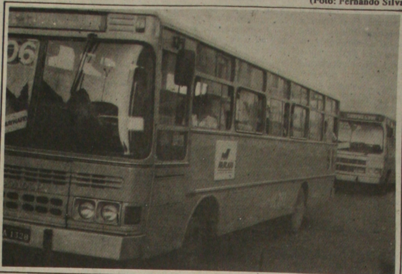
As tarifas de ônibus urbanos de Aracaju poderão ter reajustes quinzenais.