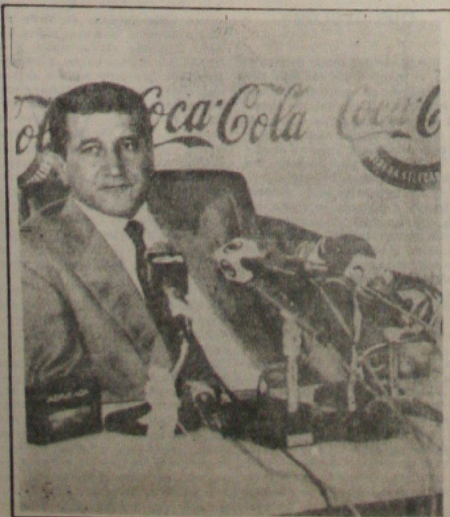
Parreira anunciou a lista já esperada pelos torcedores e pela imprensa.

RIO - O técnico Carlos Alberto Parreira divulgou ontem, no Rio, a lista com os nomes dos 22 jogadores que irão disputar a Copa do Mundo, em junho, nos Estados Unidos. Os convocados são: goleiros - Taffarel (Reggina), Zetti (São Paulo) e Gilmar (Flamengo); laterais - Jorginho (Bayern de Munique), Cafú (São Paulo), Branco (Fluminense) e Leonardo (São Paulo); zagueiro - Ricardo Gomes (Paris-Saint-Germain), Ricardo Rocha (Vasco), Mozer (Benfica) e Márcio Santos (Bordeaux); atacantes - Mauro Silva (La Coruña), Dunga (Stuttgart), Mazinho (Palmeiras), Raf (Paris-Saint-Germain), Zinho (Palmeiras) e Paulo Sérgio (Bayer Leverkusen); e, atacantes - Bebeto (La Coruña), Romário (Barcelona), Viola (Corinthians), Ronaldo (Cruzeiro) e Müller (São Paulo). (Página 1B).