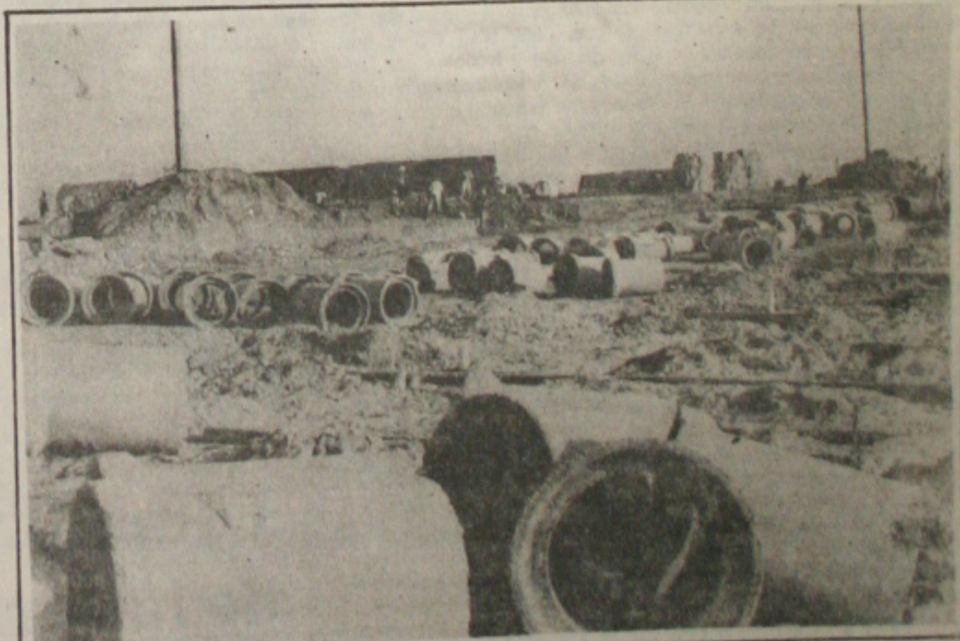
Os operários demitidos se mantêm concentrados no canteiro de obras.