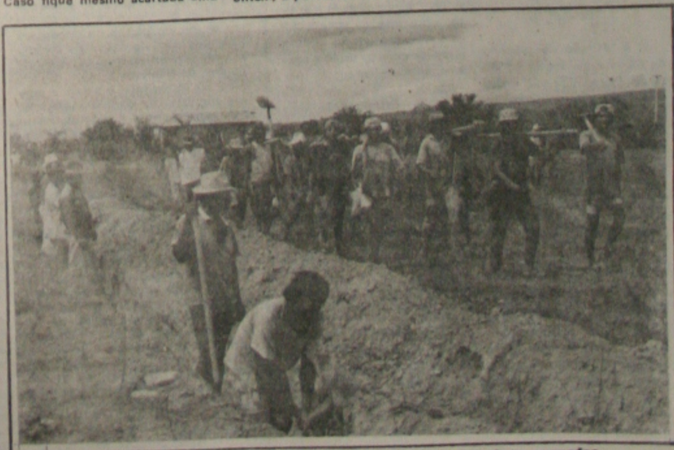
Com o fim das frentes, muitos trabalhadores rurais voltarão a ficar desempregados