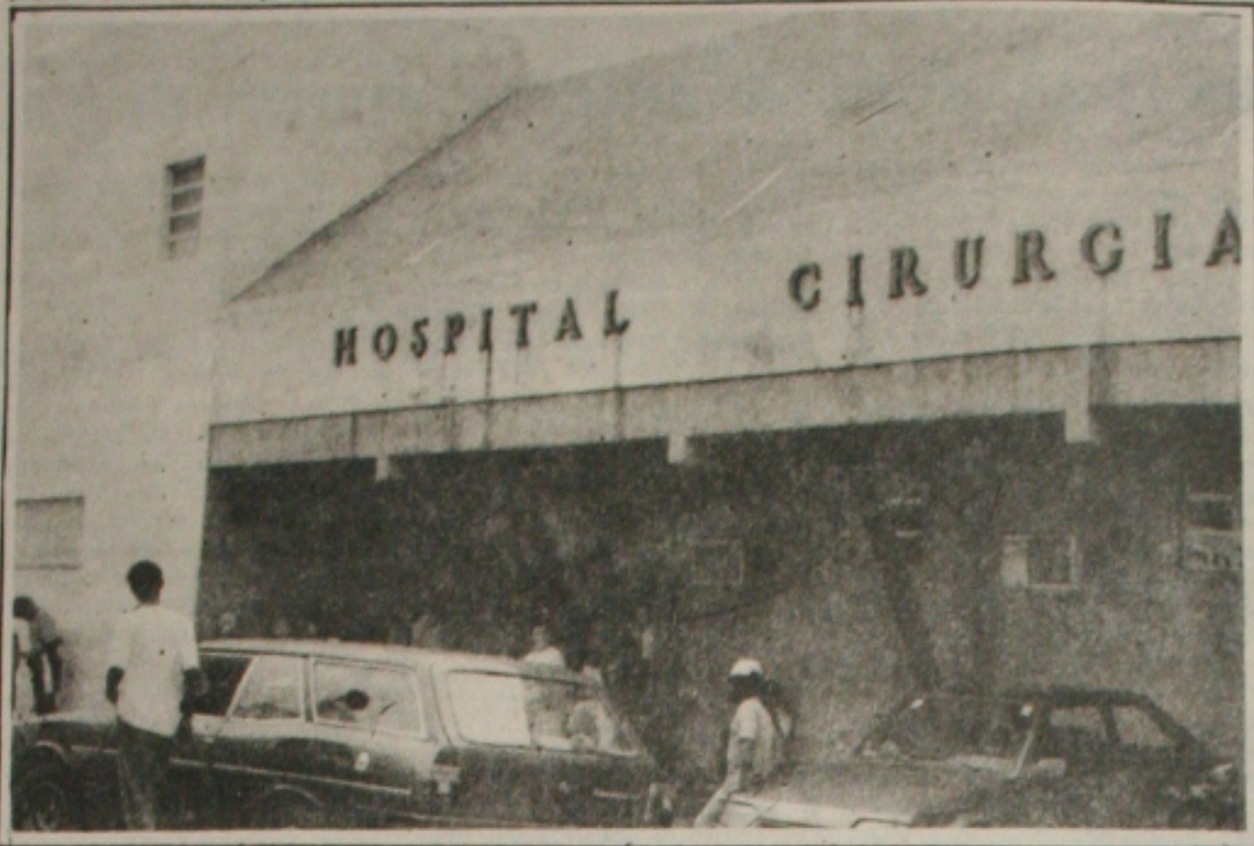
O Cirurgia começa a se recuperar para pagar o débito de CR$ 4 bilhões com os credores.