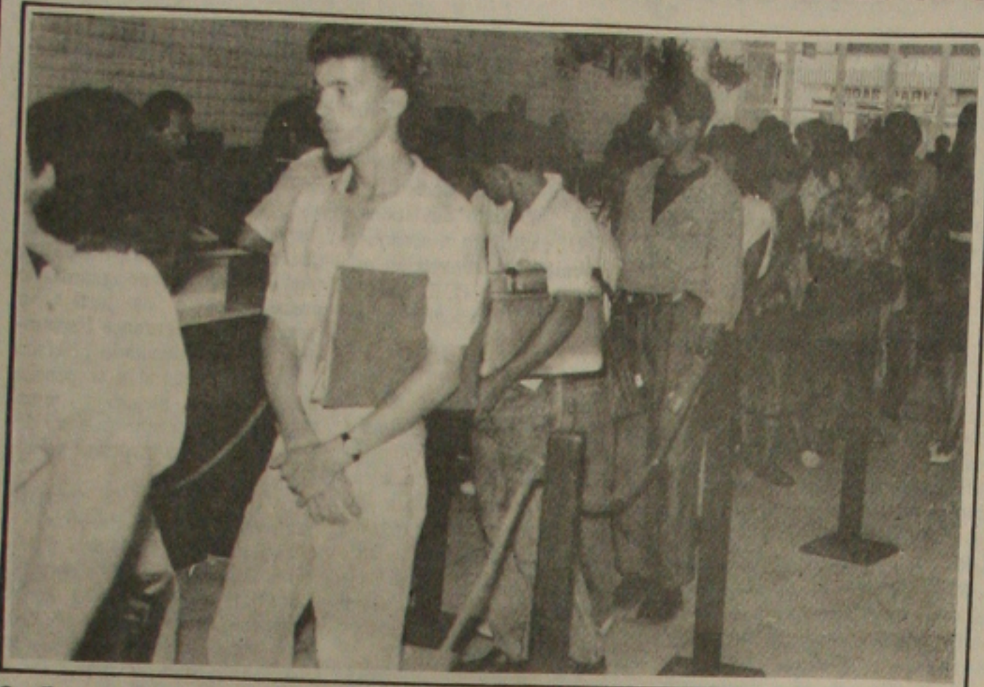
Os clientes pagam por cada talão mensal, com a nova política do Governo