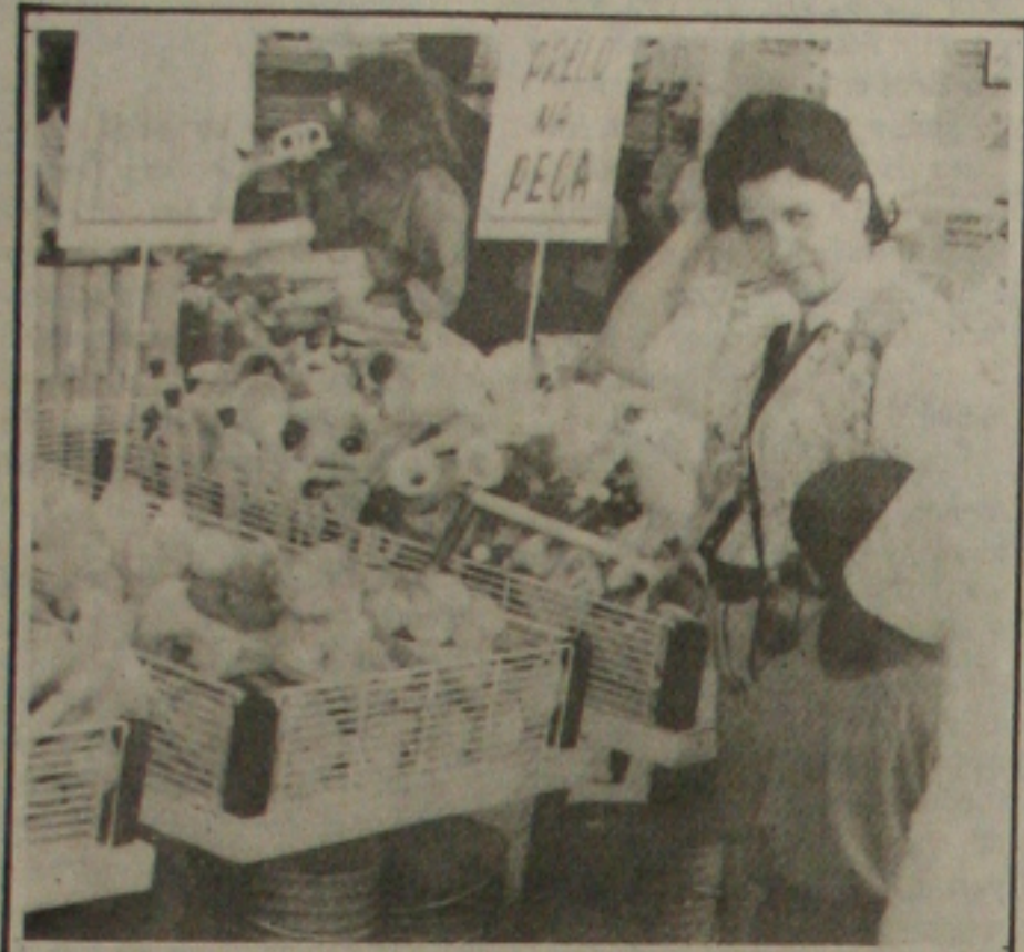
Governo quer os "fiscais de Sarney" atuando numa nova versão: contra o ágio.