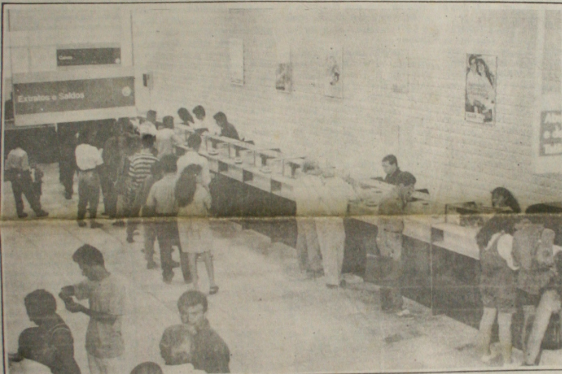
Os clientes dos bancos privados terão que pagar por todos os serviços

O Ministro da Fazenda, Rubens Ricúpero, admitiu ontem, em São Paulo, onde participou de reunião com empresários na sede da Federação das Indústrias do Estado, a possibilidade de desabastecimento de alguns produtos, após a entrada em circulação do Real, em 1º de julho. Os setores que mais preocuparam o Governo são os de alimentos, eletrodomésticos, e carros populares. "Não se trata de um cenário apocalíptico de explosão de consumo, mas pode haver problemas em alguns setores", afirmou Ricúpero. Ele manifes-