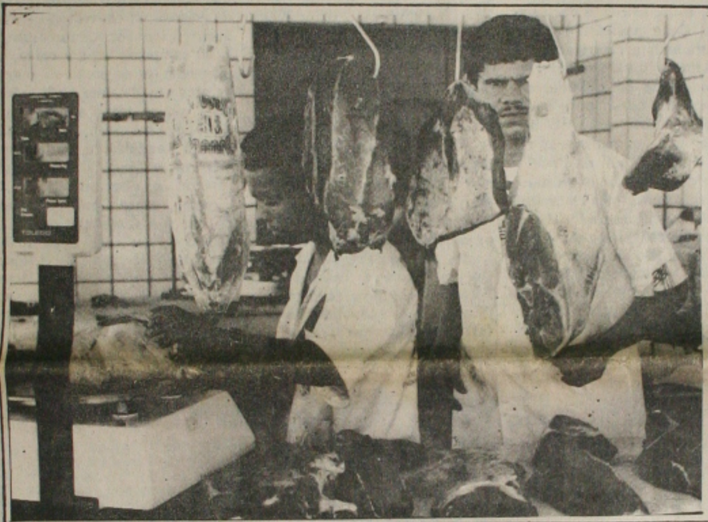
A fiscalização à venda de carne bovina será mais rigorosa.