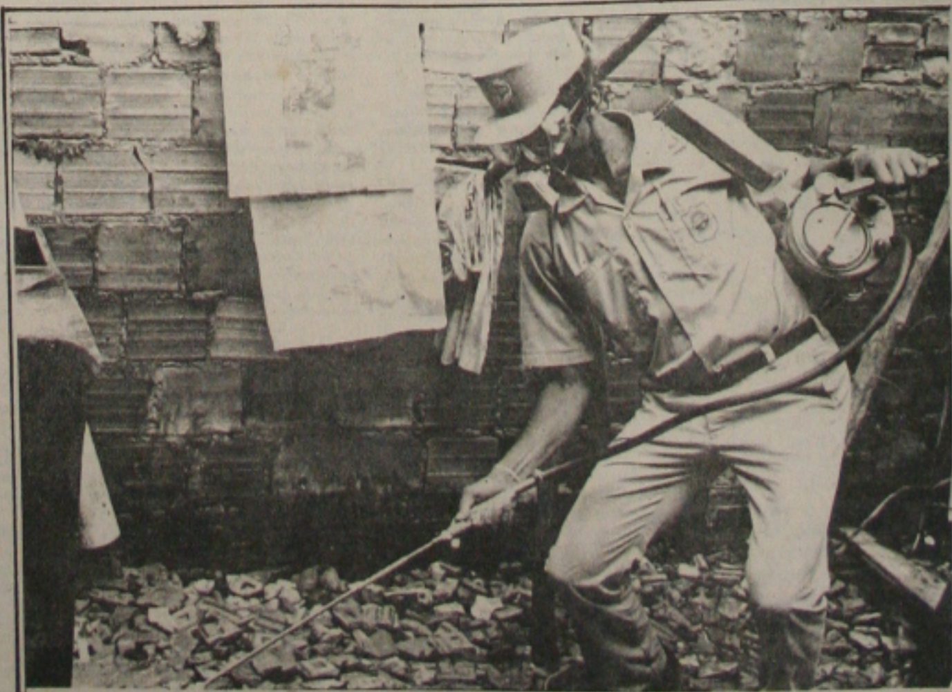
Guarda sanitário borrifava área infectada pelo mosquito da dengue