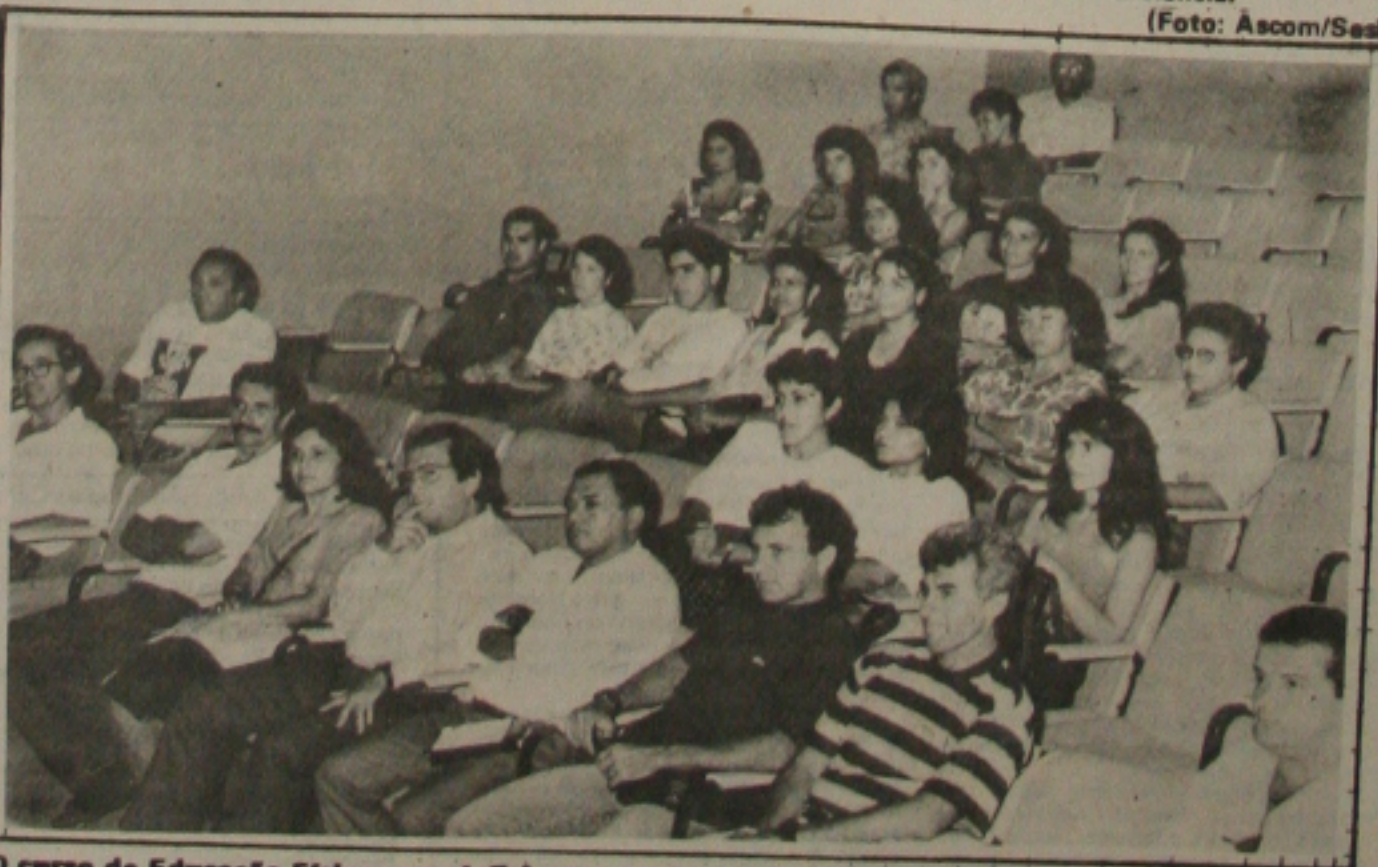
O curso de Educação Física para deficientes contou com vários participantes

para um outro dia a pedido dos advogados de defesa.