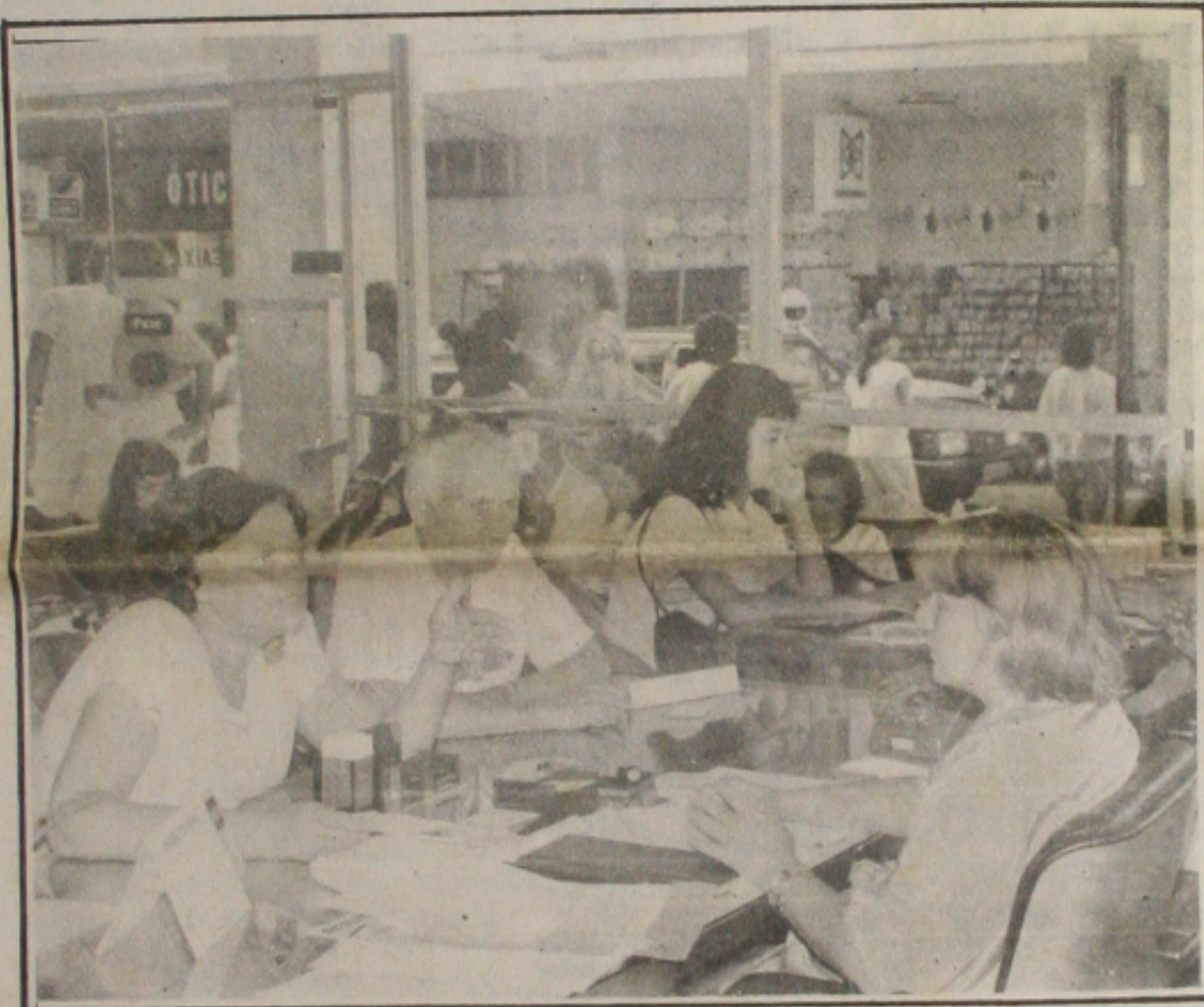
Até terça-feira, o movimento deve ser grande nos bancos, por causa da entrega das declarações do IR.

As medidas de controle direto do crédito ao consumidor estão descartadas por enquanto. O Banco Central, além de administrar o compulsório dos bancos, vai trabalhar com metas apertadas para os agregados monetários, sempre preocupado com o controle da liquidez.