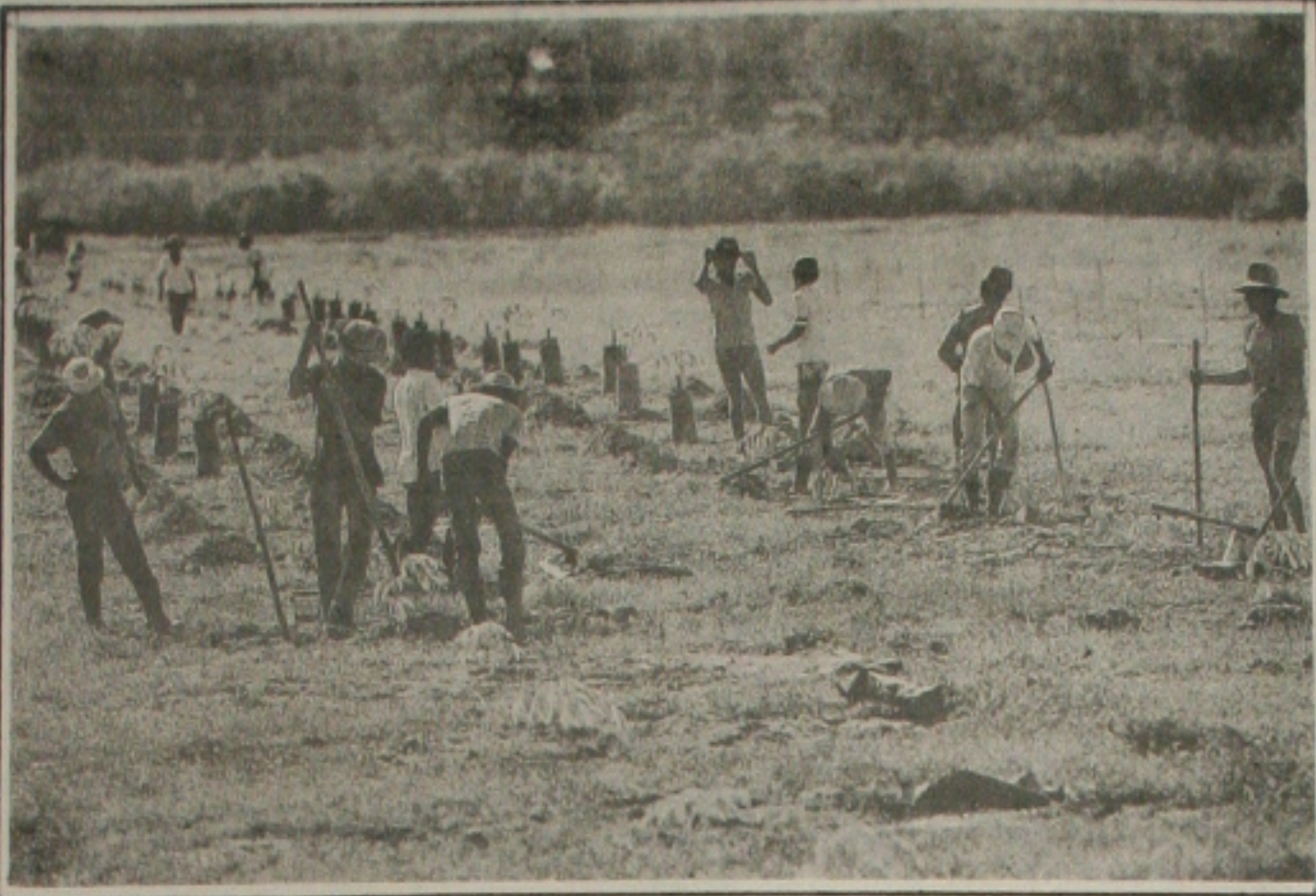
A mandioca é um dos assuntos em discussão no encontro de Lagarto.