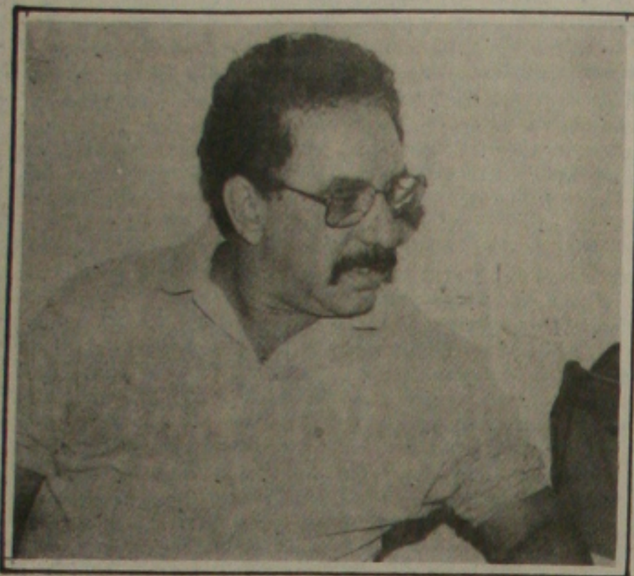
Marcos quer desconcentração, renda para garantir estabilidade

CUT desafiada a colaborar com a retomada do crescimento