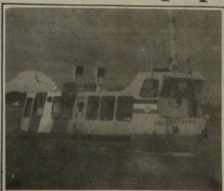
Com a paralisação dos marítimos lanchas e balsas não funcionam.

Disse ainda que a Codevasf, Chesf e Cemig - não foram sequer consultados quanto à viabilidade do projeto e que se fossem, por certo desaconselhariam a sua concepção, visto que o São Francisco está precisando de investimento visando a sua recuperação, com projetos de reflorestamento das suas margens.