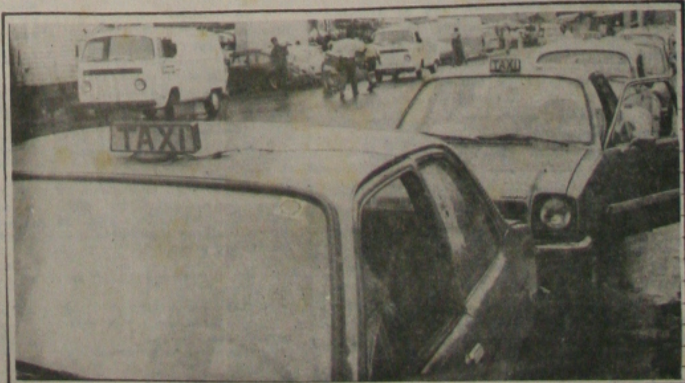
Os taxistas não gostaram do aumento da tarifa, reclamaram e a bandeira dois foi liberada.

A partir de amanhã, os táxis de Aracaju voltam a rodar na bandeira 2. A autorização foi dada ontem pela Superintendência Municipal de Transportes Urbanos, (SMTU), diante da insatisfação dos taxistas em relação ao último reajuste sobre as tarifas do serviço. A bandeira 2 ficará liberada até a SMTU definir a forma de conversão das tarifas de transportes urbanos em URV, como determina o plano econômico do Governo Federal. (Página 5A)