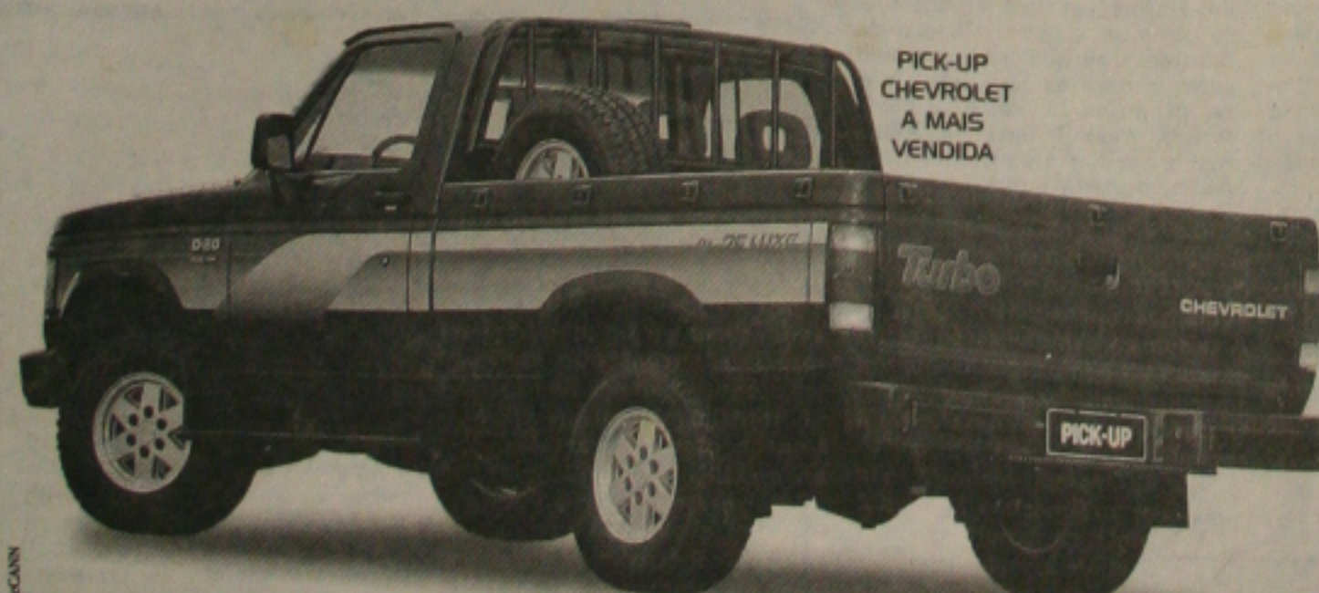
PICK-UP CHEVROLET A MAIS VENDIDA

ENTRADA MÍNIMA DE 30% + 12 x CORRIGIDAS PELA TR, SEM JUROS*.