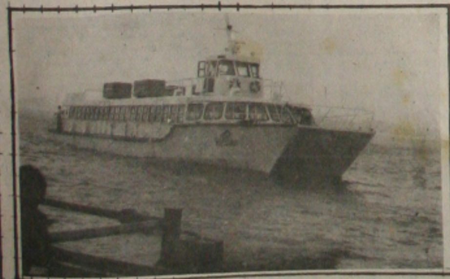
Os marítimos ameaçam parar o trabalho nas embarcações que fazem a travessia.

Foi de 39,53%, em maio, o custo da cesta básica de alimentos na capital sergipana, segundo divulgou ontem a Superintendência de Estudos e Pesquisas da Secretaria Estadual de Planejamento (Seplan). Alguns produtos entretanto registraram isoladamente altas expressivas, como a banana, que, no mês passado teve uma variação média de 122,72%. (Página 5A)