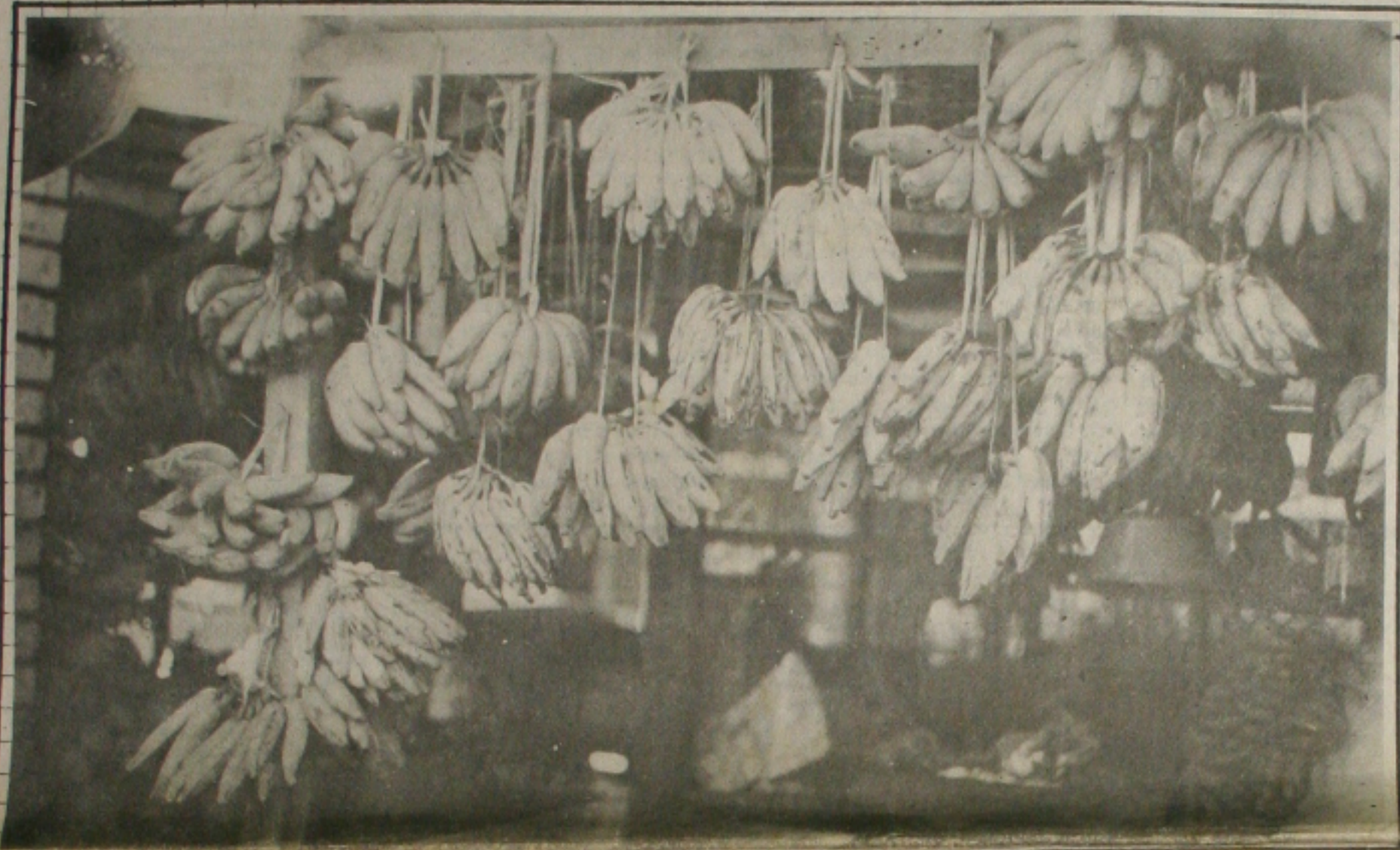
Entre os produtos da cesta básica, a banana registrou a maior alta em maio.