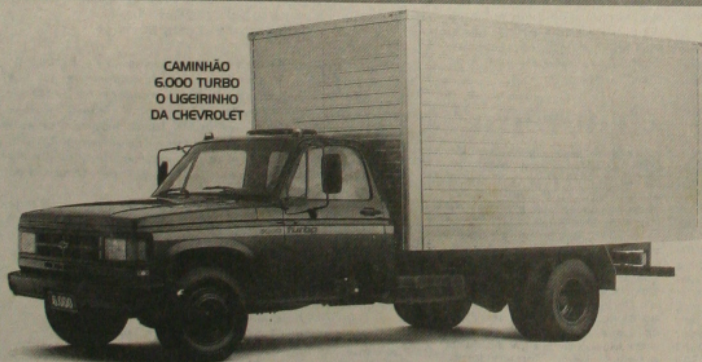
CAMINHÃO 6.000 TURBO O UGEIRINHO DA CHEVROLET