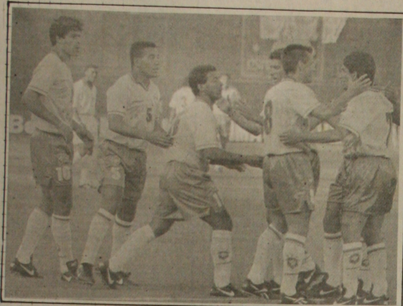
Goleada contra Honduras ameniza o clima na Seleção.