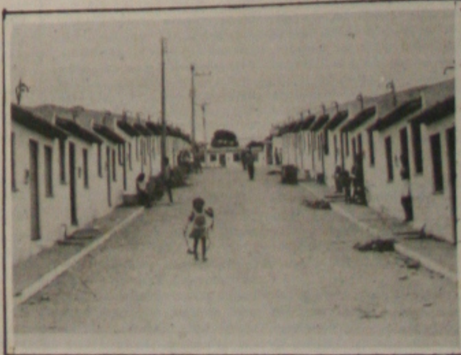
Sergipe só conta com três favelas, segundo o IBGE

Serão fechados hoje os dois últimos túneis da barragem de Xingó, acelerando a elevação do nível do reservatório. Dois outros túneis já haviam sido fechados. Assim o Rio São Francisco ficará barrado em Xingó durante 10 horas. As equipes de campo da Chesf, que atuam na área a ser inundada já resgataram 1.405 animais silvestres. Outras equipes orientam a população quanto ao represamento do rio.