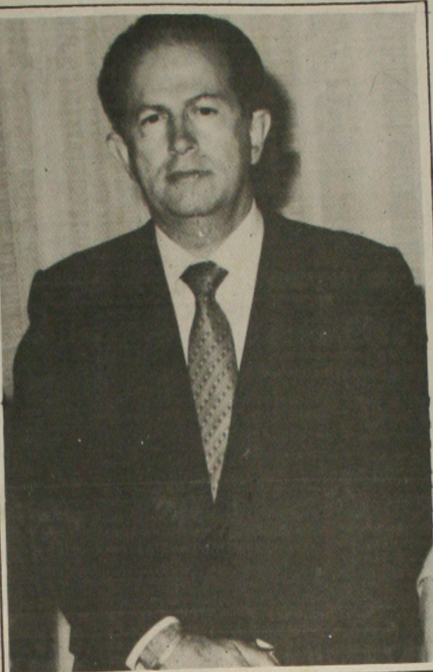
Albano Franco é alvo de muitas críticas em panfleto distribuído na cidade.