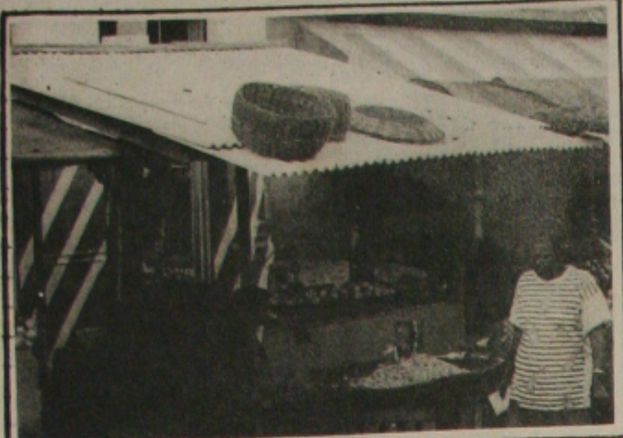
Camelô está atrapalhando comerciantes regularizados.