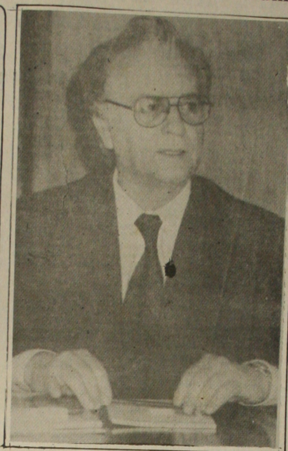
Itamar: eu sou o Presidente

- Com Freire na chapa do senador Garibaldi, conseguiremos um ótimo palanque no Nordeste - anunciou Amin, satisfeito.