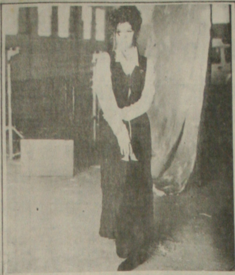
A coleção Outono/Inverno da Mesbla

Tiradores" as apresentações dos Trabalhos Acadêmicos (Área de Administração) - Disciplina Estágio II. A propósito, vale dizer que a FIT'S está de parabéns pela brilhante iniciativa, que movimenta os alunos levando-os a entrar em contato com o mercado de trabalho, contribuindo para o desenvolvimento tecnológico do Estado.