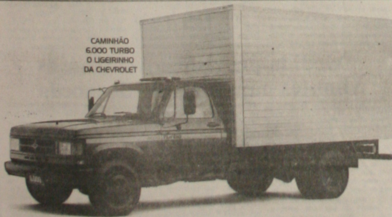
CAMINHÃO 6.000 TURBO O UGEIRINHO DA CHEVROLET