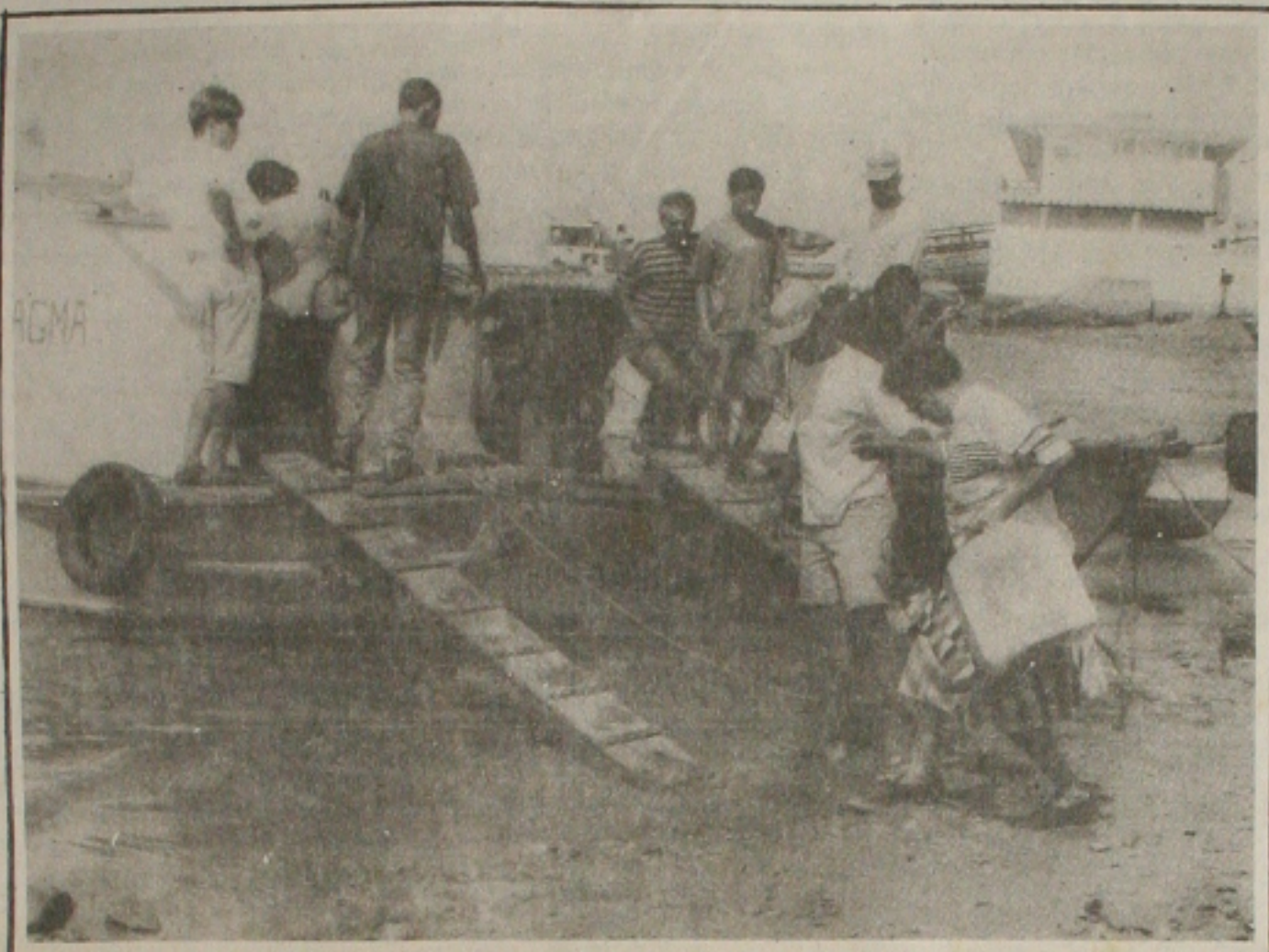
Com a greve dos marítimos, a travessia do rio Sergipe está sendo feita nas conhecidas "to-to-to"