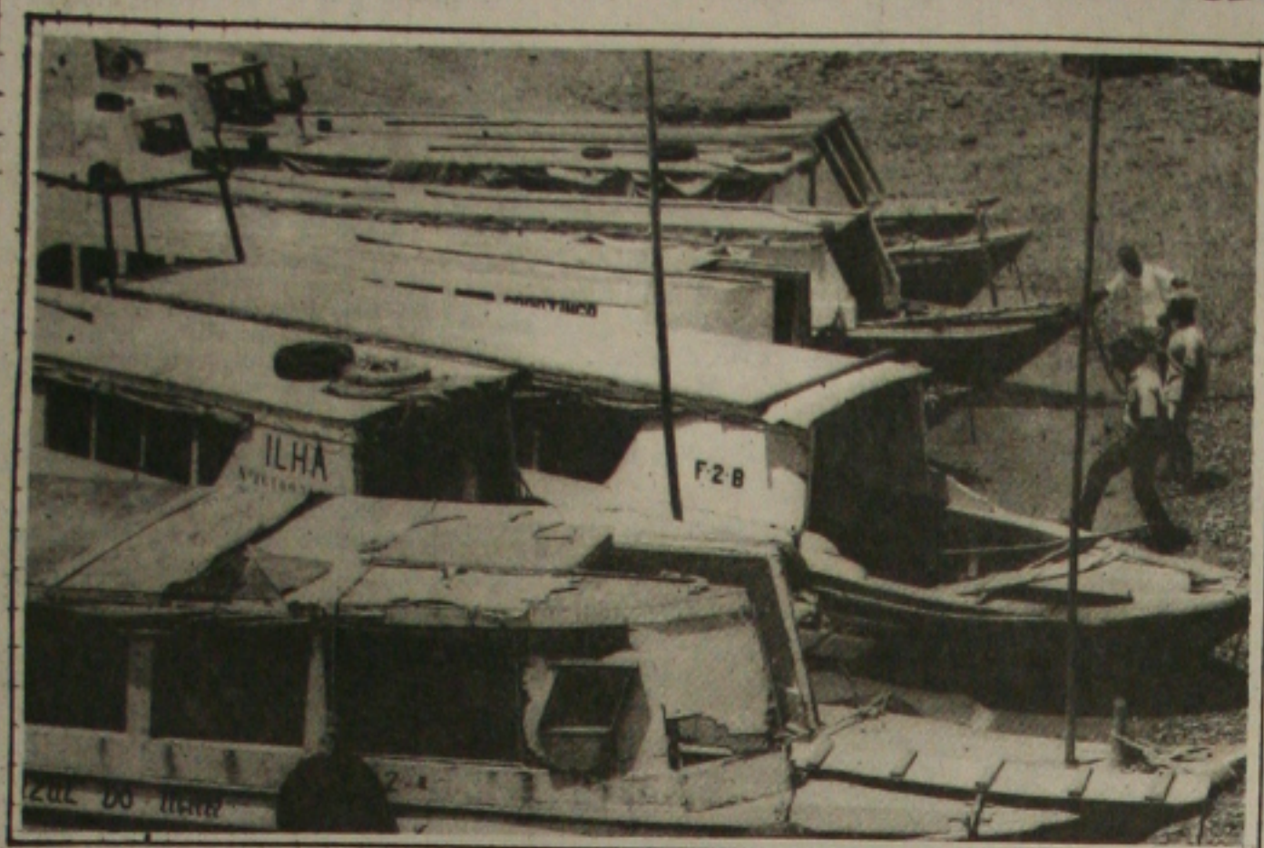
Com a greve dos marítimos, quem quiser ir para Barra tem que usar totô ou ir por Marujá