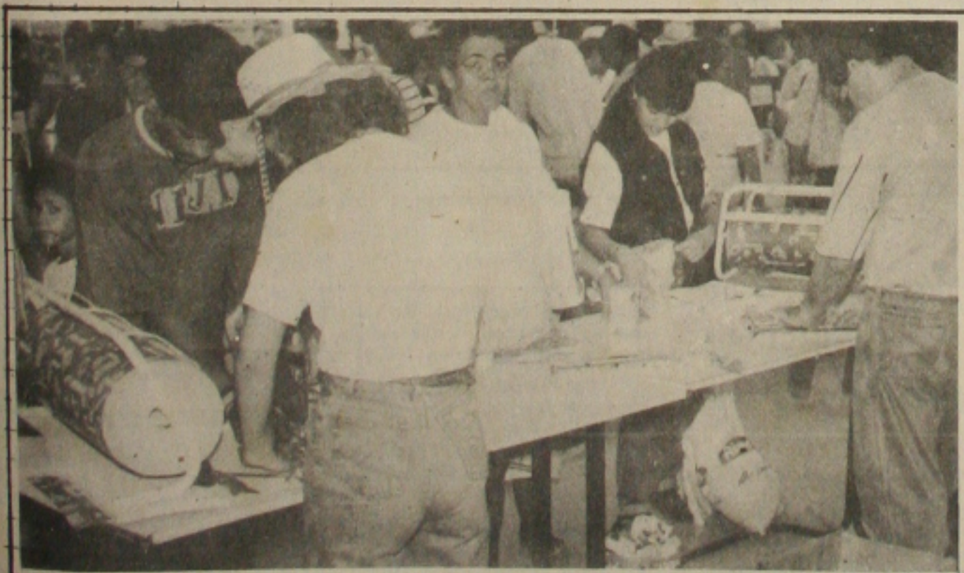
No comércio, as vendas aqueceram nos últimos dias estimuladas entre outros fatores pela comemoração amanhã do Dia dos Namorados