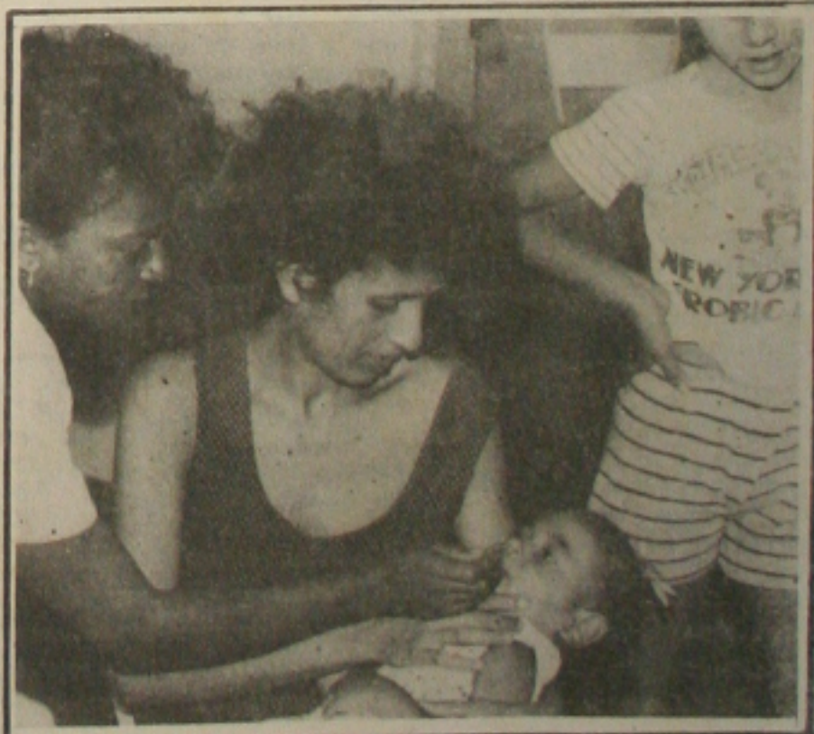
Com a vacinação de hoje, espera-se dar mais um passo para a erradicação da paralisia infantil

O técnico Carlos Alberto Parreira decidiu fazer duas alterações na equipe para a partida de amanhã, contra El Salvador, a última antes da estreia na Copa do Mundo, dia 20 contra a Rússia. No treino de ontem à tarde, no campo da Universidade Santa Clara, Raf treinou na equipe reserva e Mazinho ocupou o seu lugar no meio de campo, enquanto Zetti ganhou a sua oportunidade de substituir Taffarel. Ao final do coletivo, os titulares venceram facilmente os reservas por 10 a 0, cinco gols de Romário, quatro de Bebeto e um Zinho. (Página 4B).