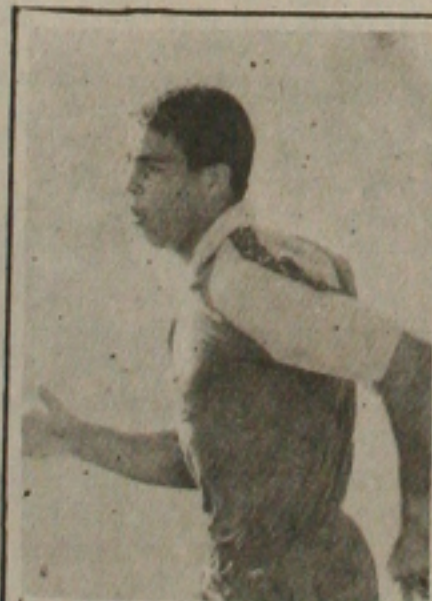
Ronaldo está inibido

LOS GATOS, EUA, (AE) - A estrela do centroavante Ronaldo não tem brilhado na Seleção Brasileira com a mesma intensidade do Cruzeiro. Pressionado pelas inevitáveis comparações com Pelé, que, a exemplo dele, disputou sua primeira Copa com 17 anos, e convivendo com cifras astronômicas para um menino que há dois anos ainda pedia dinheiro emprestado no São Cristóvão para voltar para casa de ônibus, o jogador ainda não conseguiu apresentar nos coletivos o futebol que justifique o apoio da torcida e corresponda às expectativas da comissão técnica. Embora garanta que não está assustado com a responsabilidade, Ronaldo ainda tem encontrado dificuldades para repetir na Seleção o futebol que o consagrou no Cruzeiro. Alvo das brincadeiras dos jogadores, que o tratam como uma espécie de mascote da equipe, o atacante aceita tudo com aparente naturalidade. "Acho legal, não fico chateado", garante. Sobre o desempenho nos treinos, ele acha que tem sido normal.