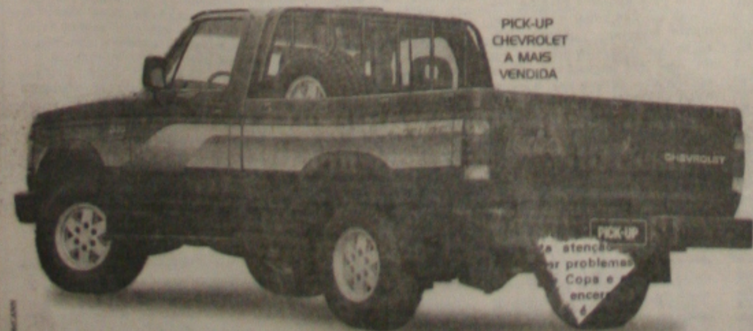
PICK-UP CHEVROLET A MAIS VENDIDA

ENTRADA MÍNIMA DE 30% + 12 x CORRIGIDAS PELA TR, SEM JUROS*.