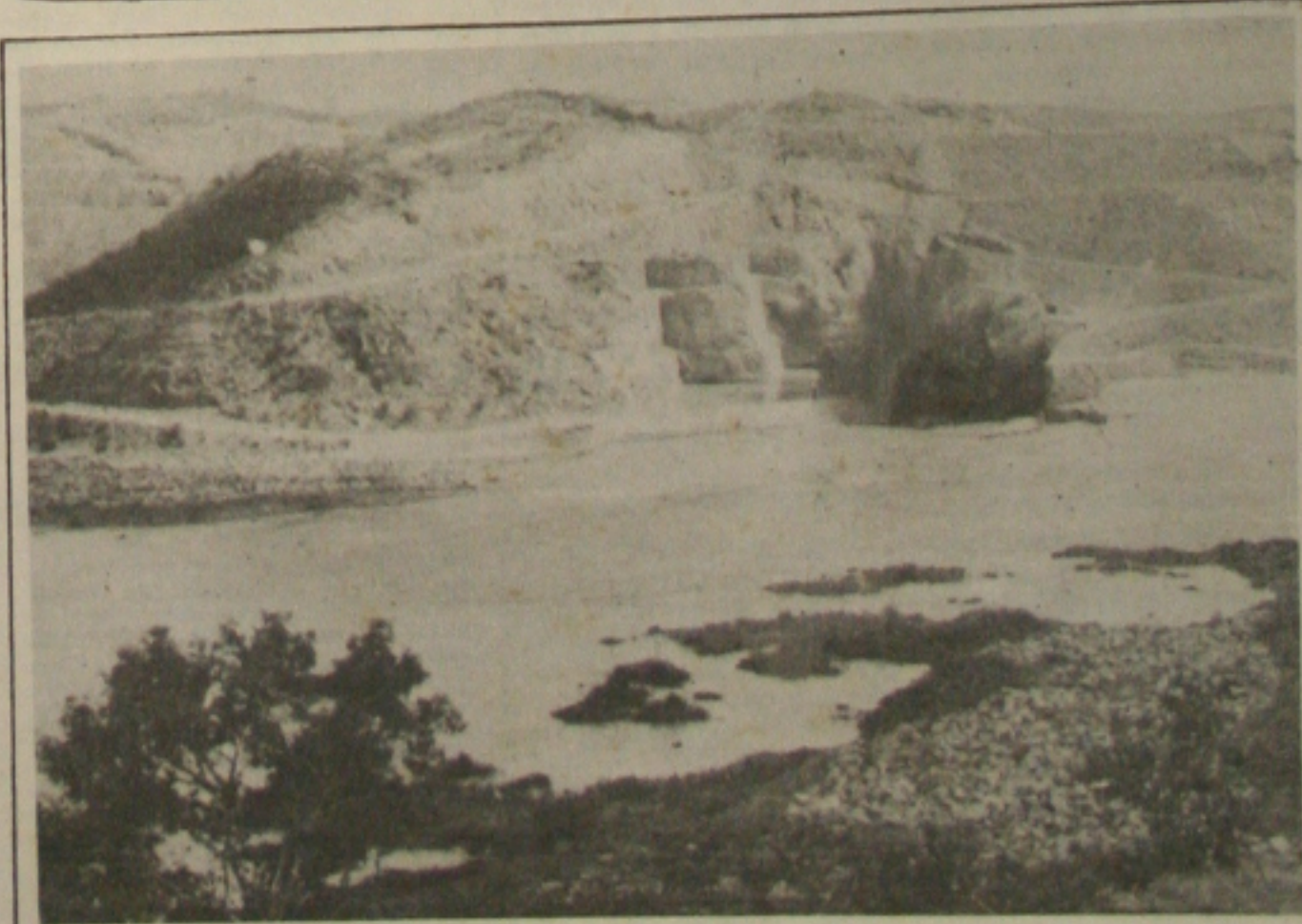
Em Xingó, o enchimento do reservatório prossegue normalmente

O reservatório da hidrelétrica de Xingó já atingiu quase 50% de sua capacidade de enchimento, tendo sido registrado até ontem o acúmulo de 1,8 bilhões de metros cúbicos de água de um total de 3,8 bilhões. A área inundada já atingiu 41 quilômetros quadrados, de um total de 60, o rápido enchimento está sendo possível graças à vazão de 5.250 metros cúbicos por segundo que está saindo do Complexo de Paulo Afonso. Com relação ao resgate da fauna, até o momento foram capturados 2.048 animais silvestres, dos quais 85 lacráias, 614 aracnídeos, 216 anfíbios, 1.133 répteis e 84 mamíferos, os quais estão sendo recolhidos na base da coleta, onde ficarão até serem destinados a uma universidade e Instituto Butatã.