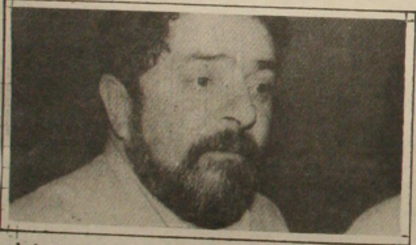
Lula: trabalhadores roubados

Em consequência do expurgo de quinze dias no cálculo de inflação os trabalhadores estarão sendo roubados - protestou Lula.