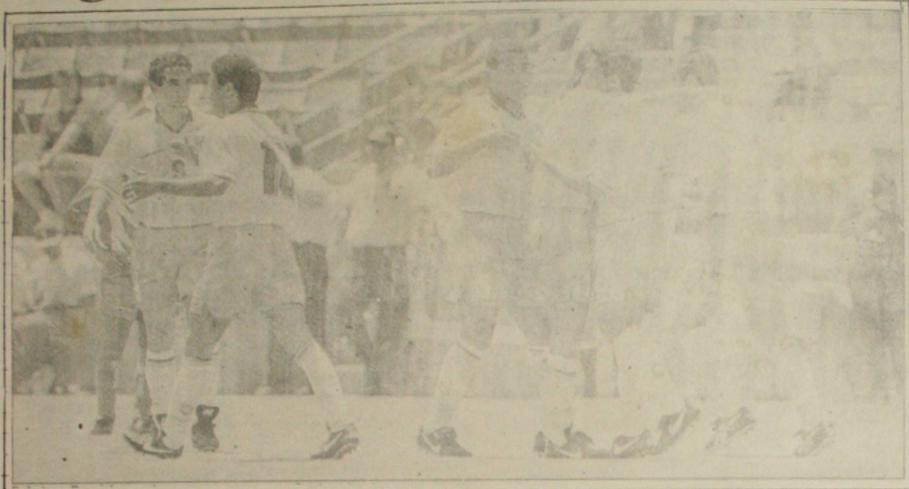
A união do grupo vem sendo o grande destaque da Seleção