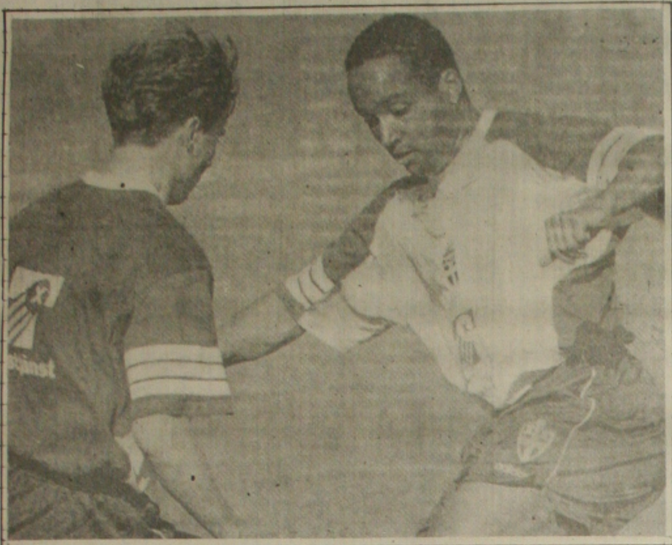
Martin Dahlin artilheiro da Suécia