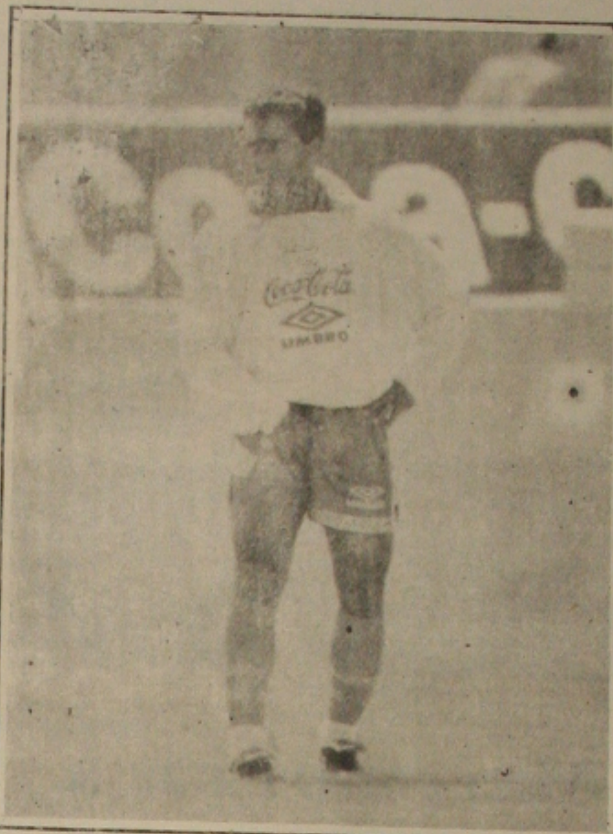
Situação de Romário preocupa comissão técnica

LOS GATOS, EUA (AE) - Artilheiro da seleção e principal estrela do Brasil na Copa, Romário garantiu que vai jogar contra a Rússia, segunda-feira, em Palo Alto, na estréia da seleção no Mundial dos Estados Unidos. Mesmo sentindo dor na virilha, responsável por sua saída de campo de sexta-feira e do amistoso contra El Salvador, em Fresno, o atacante disse que o problema não é grave e que ele estará pronto para mostrar todo o seu futebol. "Acho que vou superar tudo isso com um pouco de descanso", afirmou. As dores musculares seriam consequência do excesso de preparação física e que o jogador se submeteu na primeira fase de treinamentos. Mas o atacante preferiu não discutir o assunto. "Não é nada grave", afirma. "As dores foram mais fortes no último jogo, mas creio que isso é normal". A idéia da comissão técnica é preparar o jogador dos exercícios mais puxados, hoje e amanhã, preservando-o para os coletivos. Embora o problema de Romário proveja uma expectativa muito grande da torcida, que sofre todas as vezes em que o goleador deixa o campo com a mão na virilha, o técnico Carlos Alberto Parreira não tem dúvidas de que contará com o craque em grande forma no Mundial. "O Romário fez um trabalho específico de preparação, já que estava abaixo dos outros jogadores do grupo, mas começou a recuperar a melhor condição física", assegura o treinador. Com