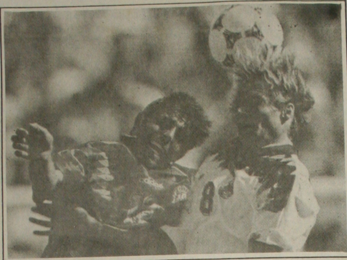
Klinsmann já admite jogar nos Estados Unidos.

Para Jan Wouters, do PSV Eindhoven, o pior ocorreu na metade do segundo tempo, quando gesticulou irritadamente para contestar uma falta marcada contra a Holanda e recebeu o cartão amarelo, o segundo, o que o tira da partida contra a Irlanda. "Não estarei em campo, mas acredito a Holanda está crescendo e tem condições de jogar contra a Irlanda mais do que nas três partidas de classificação".