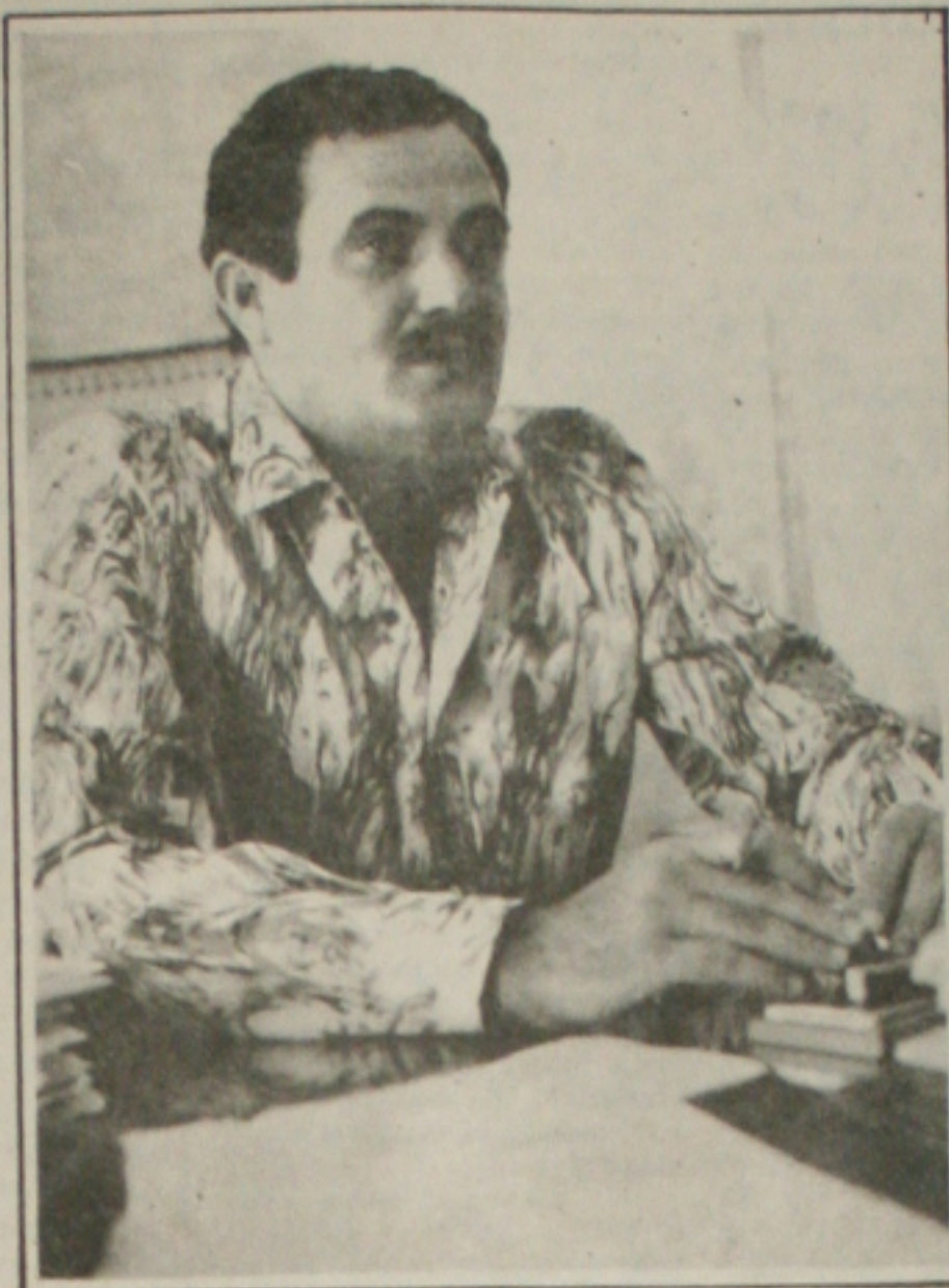
Sérgio Santana de Menezes, Secretário de Estado da Agricultura, retornando hoje da Alemanha.