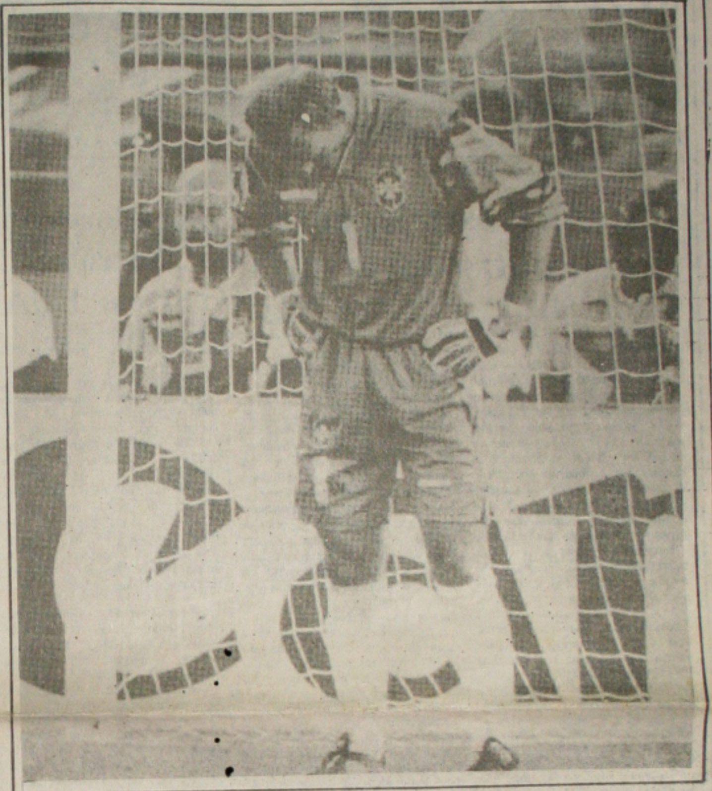
Taffarel a imagem do derrotado

A fraca atuação da Seleção diante da Suécia e as críticas da imprensa ao desempenho da equipe irritaram os jogadores. Muitos acharam as críticas intempestivas e incoerentes, pelo fato de o time ter sido o primeiro de seu grupo. "Nós nos classificamos antecipadamente, sem nenhum susto", chegou a dizer o volante Dunga, após a partida contra a Suécia.