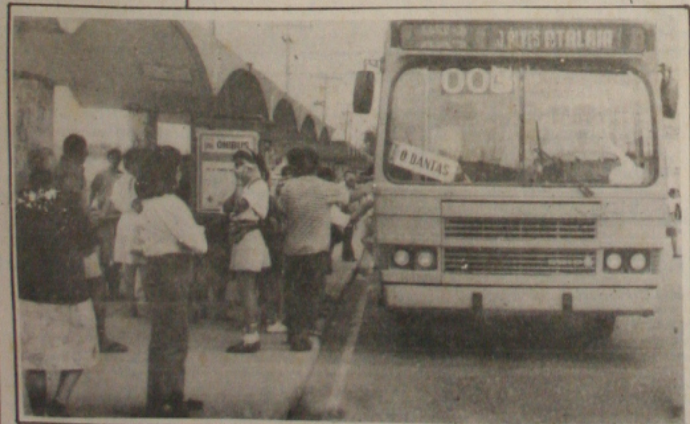
A tarifa dos ônibus, já em Real, custa a partir de hoje R$ 0,36

Com o Real, o novo índice de inflação em real oficial, o IPC-R, será o único indexador de contratos financeiros e não-financeiros com prazo superior a um ano. Os atuais indexadores e só continuarão valendo até o final do contrato. Depois disso, terão função meramente estatística, conforme definiu o advogado-geral da União, Geraldo Quintão. Ele garante que a mudança imposta dos indexadores não fere a legislação, porque a realidade do real é outra, diferente do cruzeiro real. (Páginas 5A e 8A).