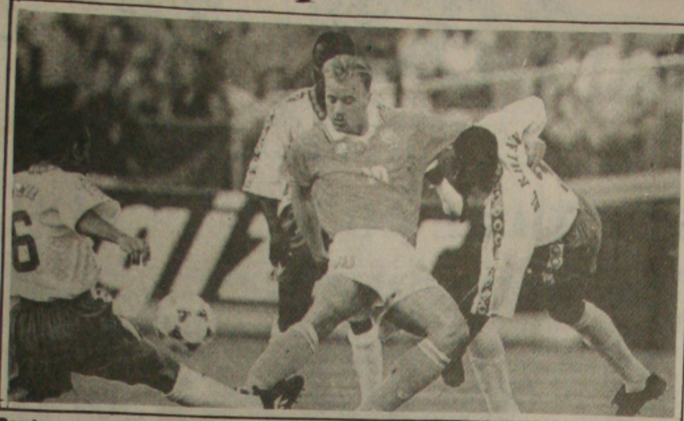
Bergkamp comanda o time holandês.