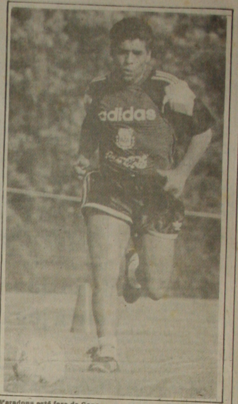
Maradona está fora da Copa.

O início da Copa nos Estados Unidos revelou um Maradona com disposição para recuperar-se. Fez um gol e comandou a seleção argentina nas vitórias diante de Grécia e Nigéria. Sonhava retornar ao Boca Juniors após a Copa, mas esse novo escândalo deve determinar o fim de sua tumultuada carreira, além de ter impedido que ele batesse o recorde: completaria hoje sua 22ª partida em Copas do Mundo.