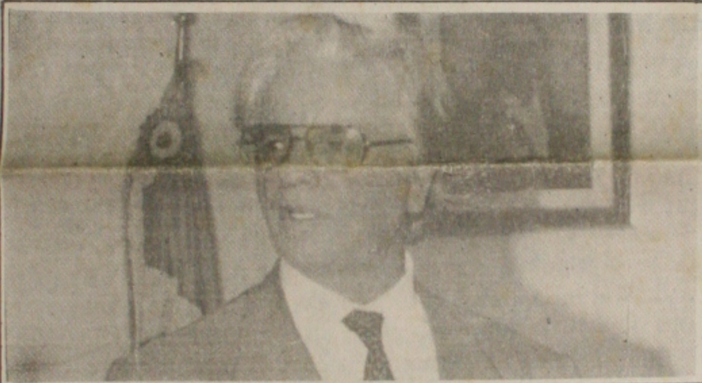
Itamar anunciou a MP do Real e pediu a colaboração da população para o sucesso do plano

Os estudantes secundaristas de Aracaju continuam recebendo assaduras com o objetivo de propor uma lei de iniciativa popular que regularmente definitivamente a cobrança das mensalidades escolares. A intenção é também criar um fórum permanente de acompanhamento e fiscalização da aplicabilidade da lei, a ser integrado por entidades representativas dos estudantes, associação de pais de alunos, Ministério da Educação e até da Receita Federal. (Página 4A).