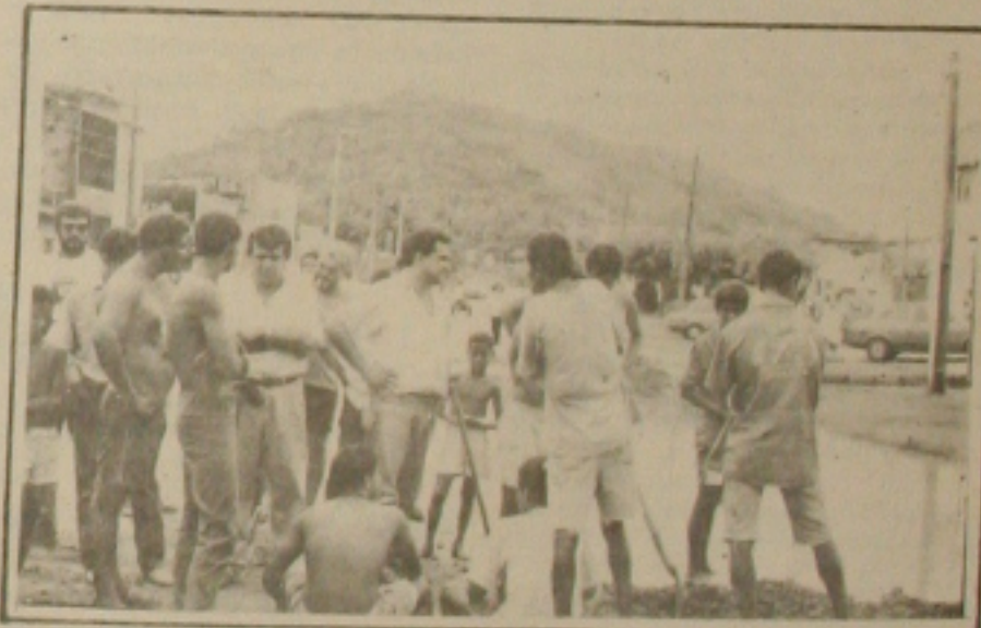
O prefeito comar da operação de limpeza.

A operação especial da PMA continua durante toda essa semana e vai beneficiar os bairros afetados com acúmulo de lixo e ruas com problemas de buracos e drenagem entupida.