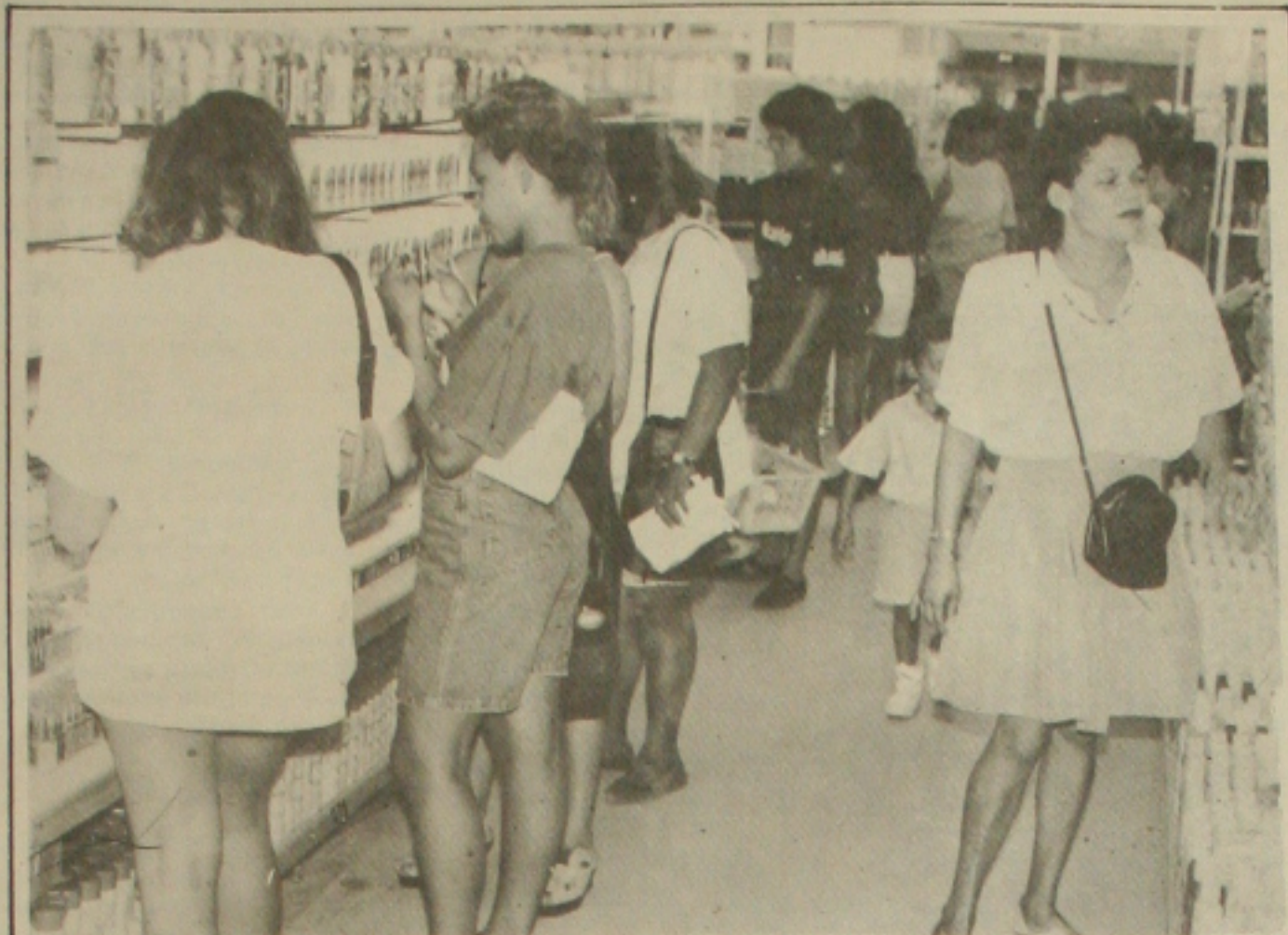
Consumidor tem que conferir tudo e guardar nota fiscal para ajudar na fiscalização.

Na montagem do novo esquema financeiro, as instituições federais (Sudene e BNDES) assumirão o compromisso de garantir o fluxo regular de recursos, com base nas necessidades das empresas.