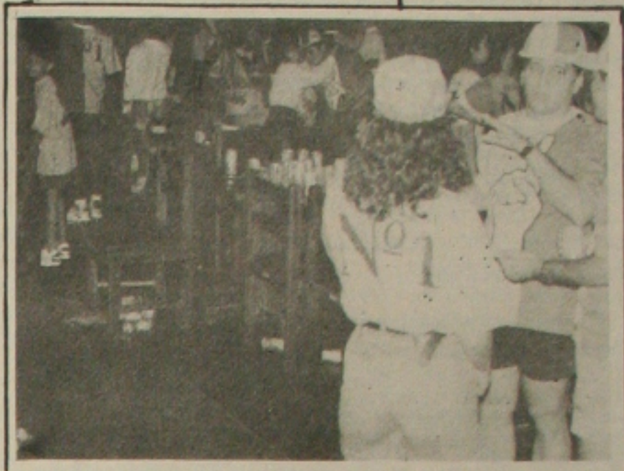
Em Aracaju, os torcedores se reuniram em vários pontos da cidade para acompanhar a vitória brasileira

"O jogo não foi dramático, foi difícil", afirmou, para depois achar virtude na equipe. "Jogou como um time que pretende ser campeão", ressaltou.