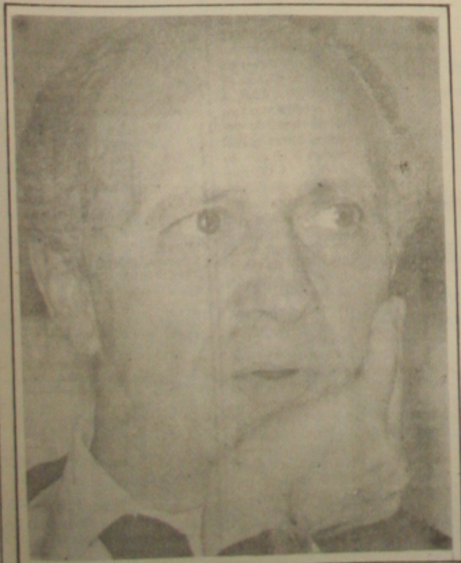
Ricupero abismado com ganância dos empresários.

Os colecionadores estão esperando algumas cédulas de cruzeiros reais, para suas coleções. Claro que os valores são mínimos e depende da necessidade de cada um.