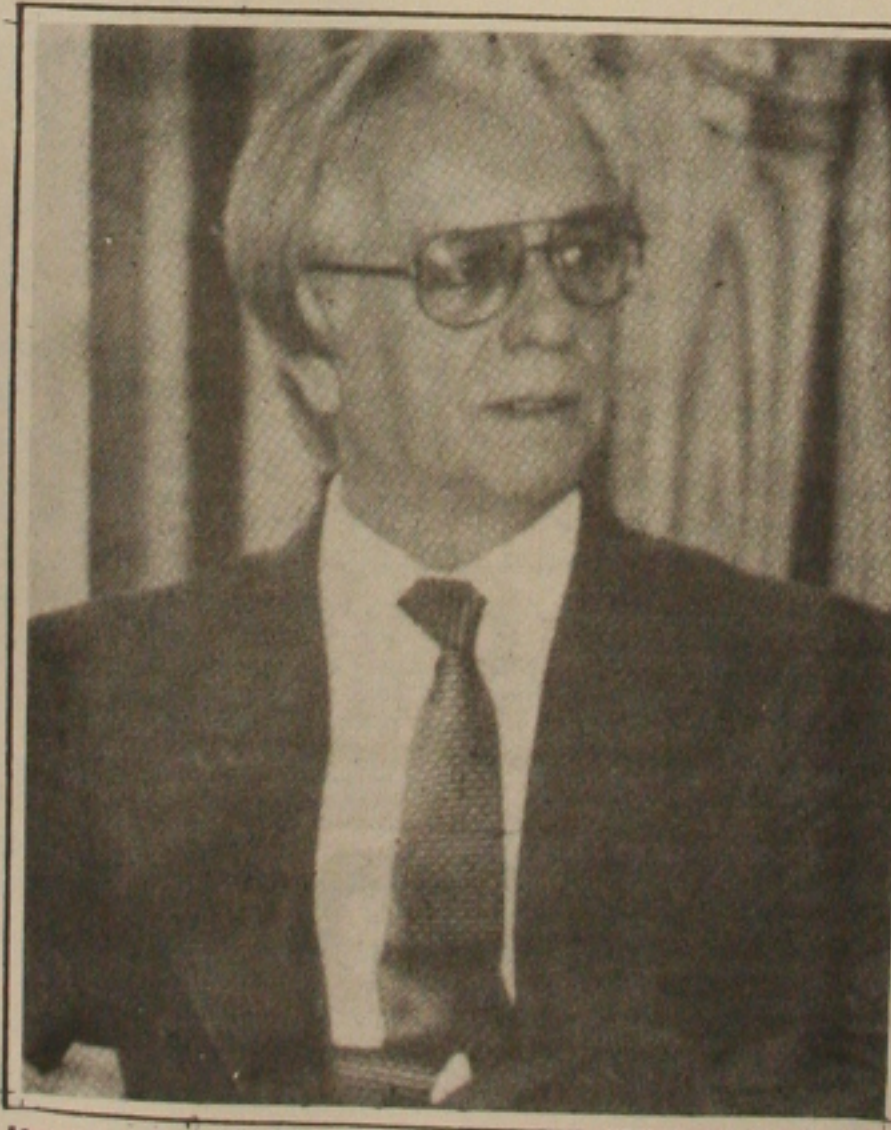
Itamar: mudanças possíveis