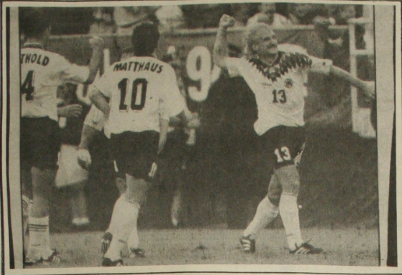
Voller volta a ser destaque na seleção da Alemanha.

Antes de o jogo começar, uma pesquisa informal podia mostrar o quanto os Estados Unidos sabem de bola. Nem um mísero torcedor consultado sabia de cor a escalação dos Estados Unidos. Quem foi mais longe, recitava apenas quatro nomes: