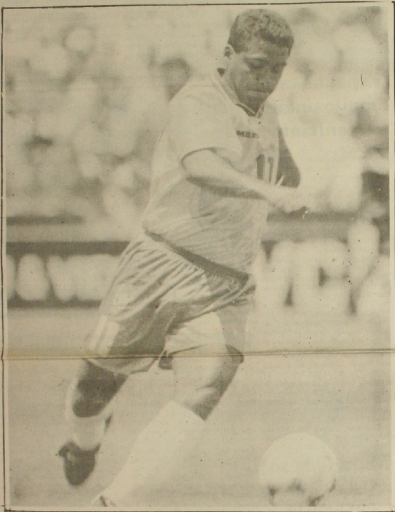
Romário fez a melhor partida na Copa e criou o lance do gol de Bebeto