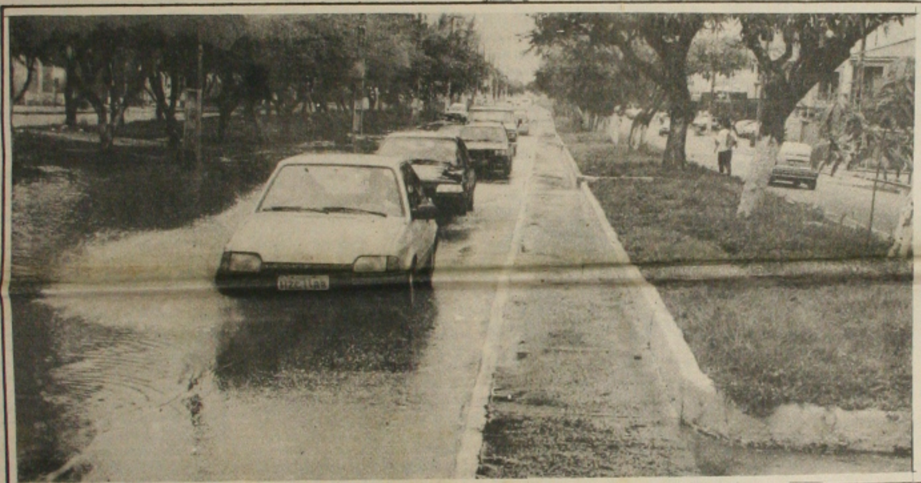
Com as chuvas, ruas e avenidas voltaram a ficar alagadas, dificultando o trânsito

O Ministro da Justiça, Alexandre Dupeyrat, inicia no próximo final de semana um programa de viagens por todo o país para estimular os prefeitos a criar serviços de proteção ao consumidor que deverão assinar convênios com a Sunab e a Secretaria de Direito Econômico para a aplicação da lei delegada nº 4 e da nova lei anti-truste. Trata-se de uma ação interministerial que conta com o apoio do Ministério da Fazenda na mobilização de pessoal para vigiar as remarcações. Outra medida nesse sentido foi anunciada ontem pelo Ministro Rubens Ricuperlo. Ele informou que o Governo criará centrais nacio-