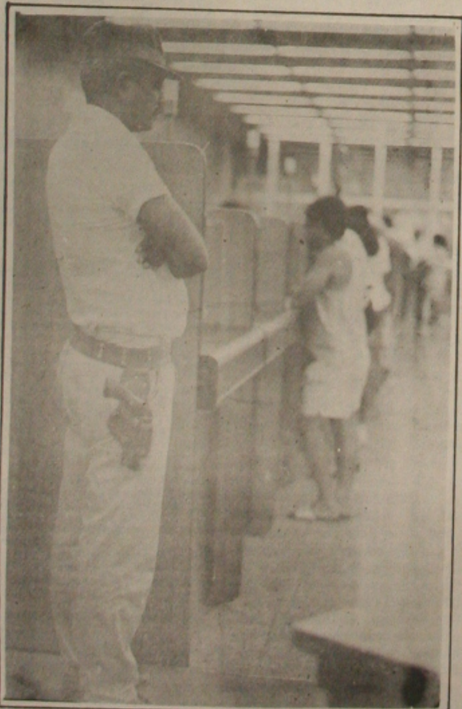
As empresas não cumprem acordo com os vigilantes sergipanos.