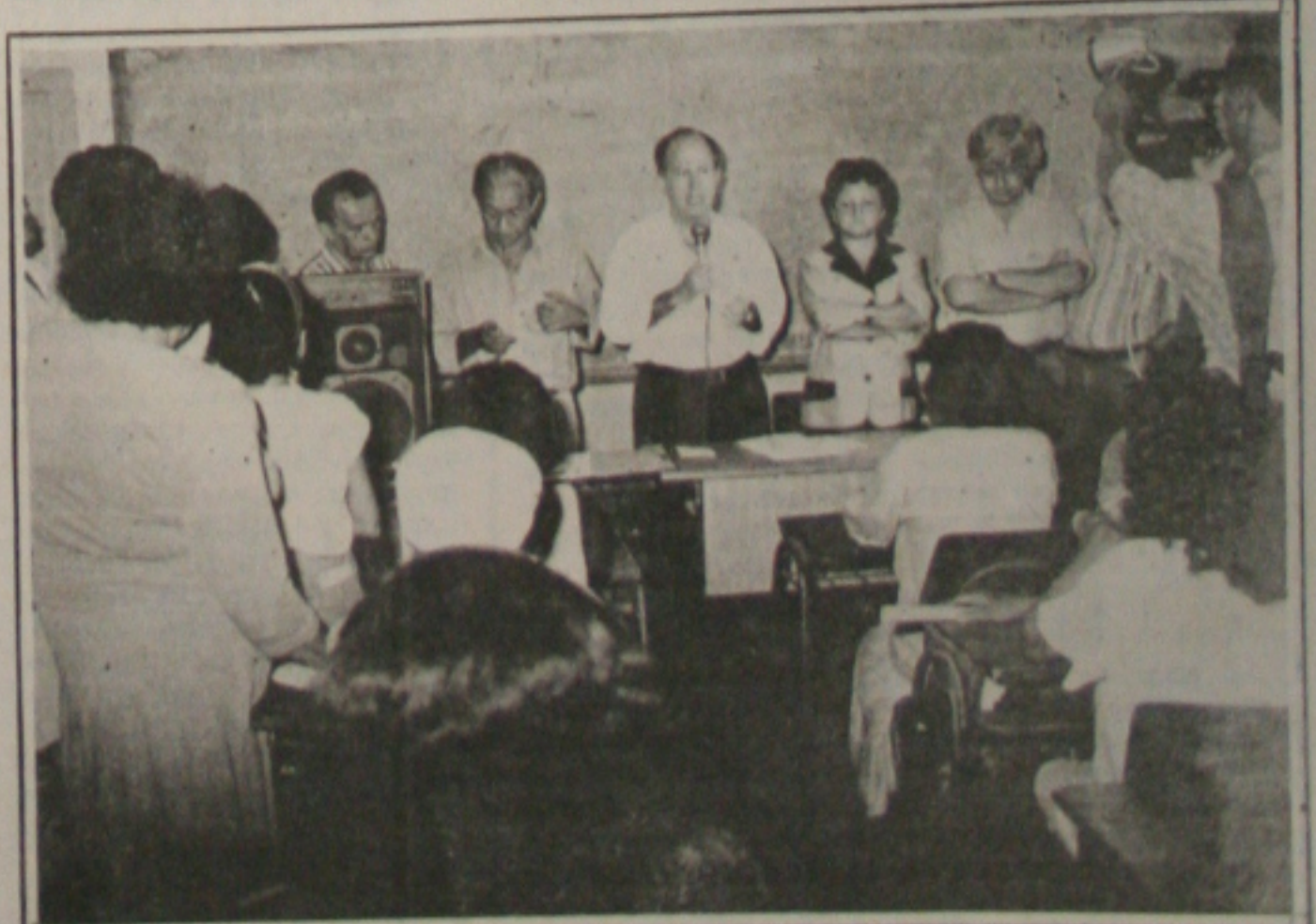
Ontem, o senador manteve encontro com lideranças do bairro Soledade, na periferia de Aracaju