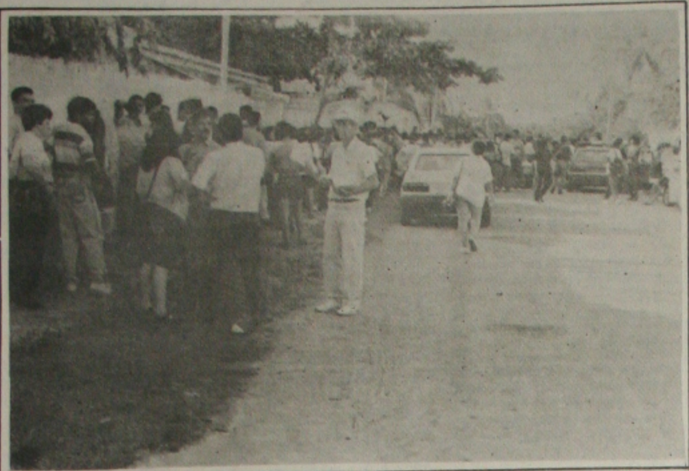
O concurso dos Correios tem levado as pessoas a dormirem na fila para conseguir a inscrição.

Mais de 10 mil pessoas já se inscreveram no concurso público dos Correios e Telégrafos (ECT), cujas inscrições iniciaram na segunda-feira passada e terminam amanhã às 17 horas. Esse concurso é para o cargo de agente postal e é destinado ao preenchimento de 118 vagas em todo o Estado de Sergipe, com o salário inicial de R$ 133,37.