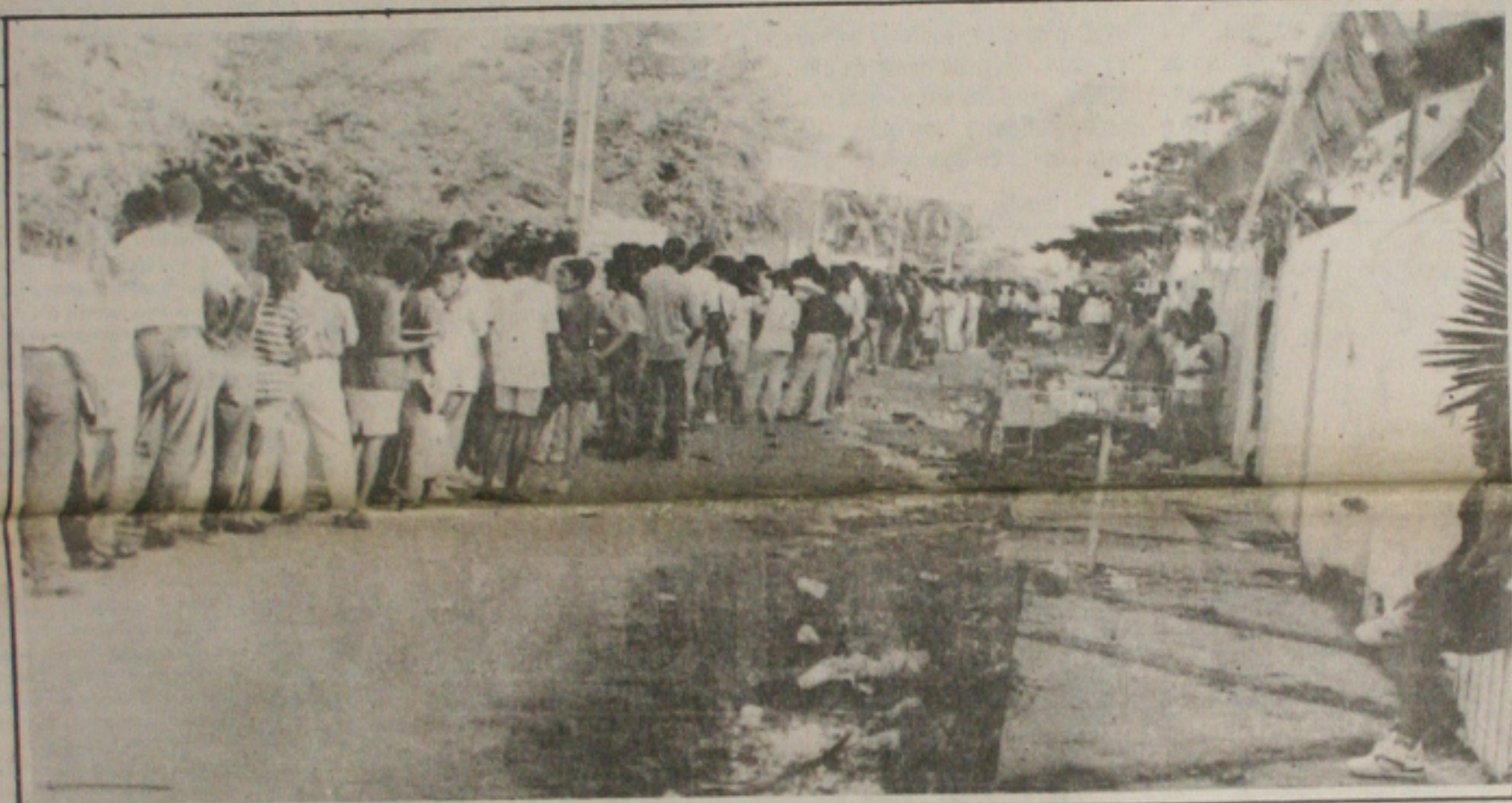
Desde segunda-feira, as filas de candidatos ao concurso são quilométricas

O reajuste salarial para os funcionários públicos federais será concedido em setembro e os militares terão direito a um percentual maior, segundo ficou decidido ontem na negociação entre os ministros da Fazenda, Rubens Ricuperena, do Planejamento, Benf Veras, da Administração Federal, Romildo Canhim, e do Estado-Maior das Forças Armadas (EMFA), Amaldo Leite. Os índices do aumento começaram a ser discutidos ontem numa nova