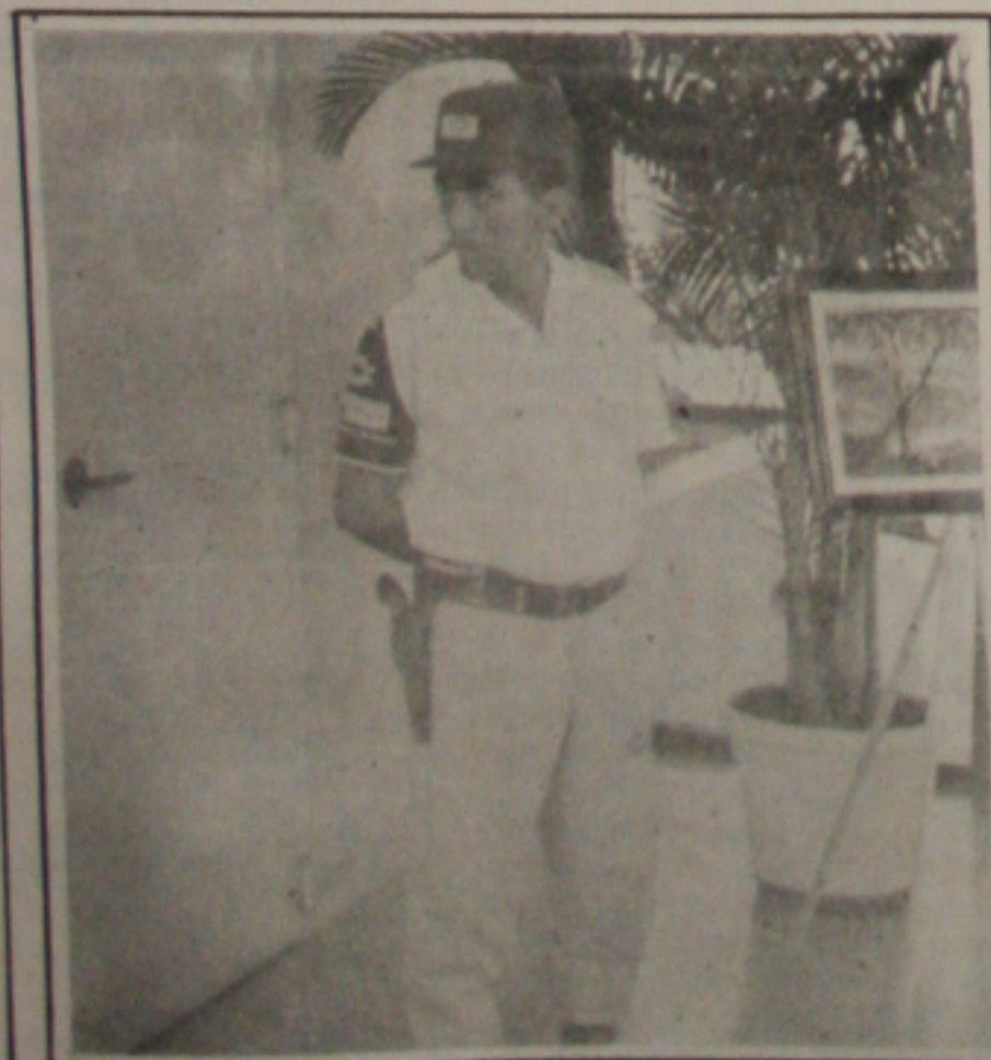
Os vigilantes têm sofrido constantes ameaças de demissão